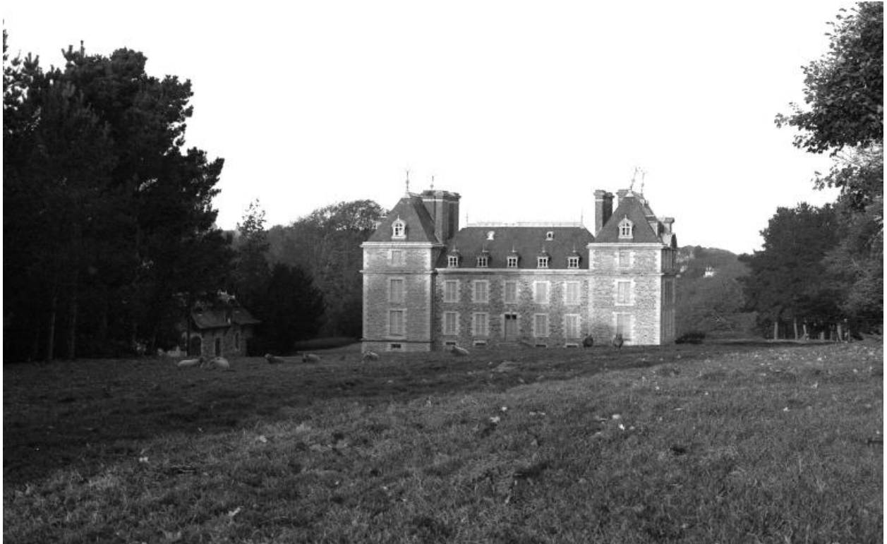
Minihy-Tréguier : château du Bilo et communs, photographie de 1973