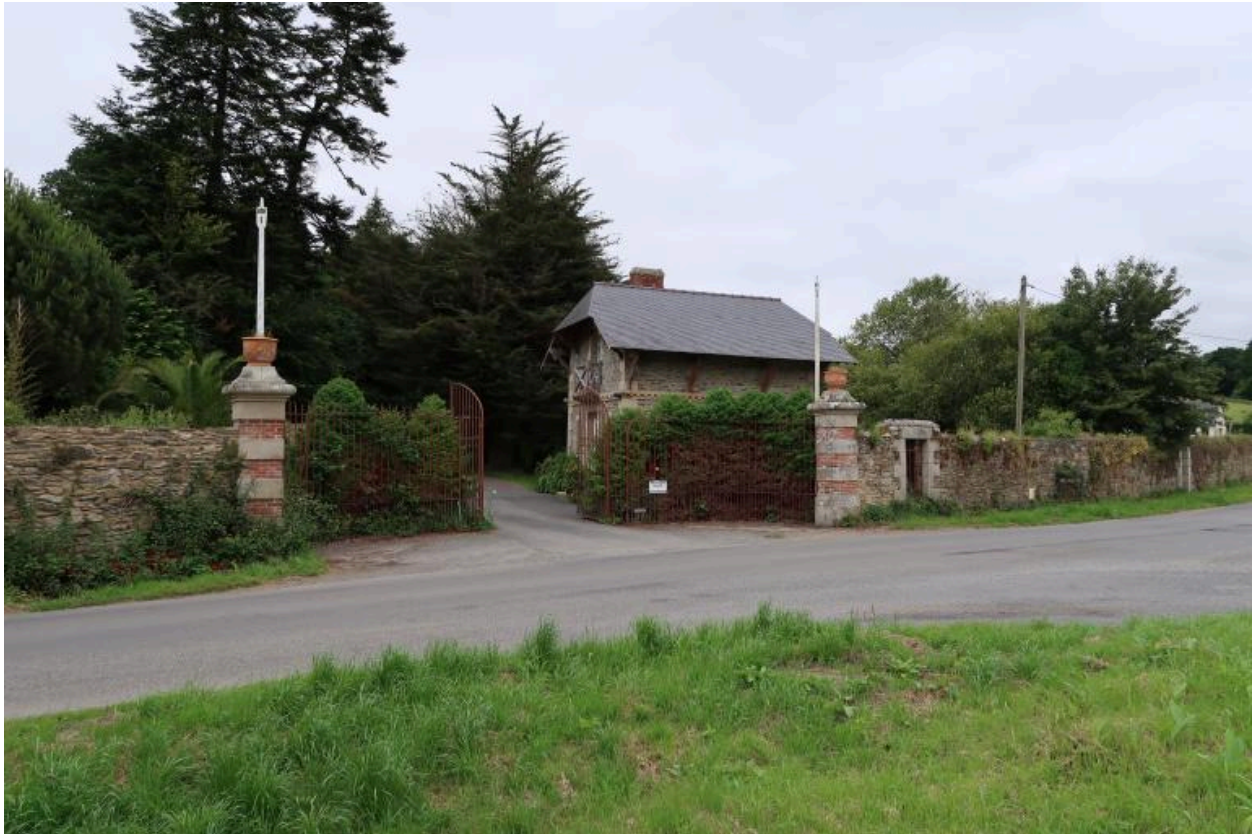
Minihy-Tréguier : entrée du château du Bilo, état en 2018 (phase de recensement)