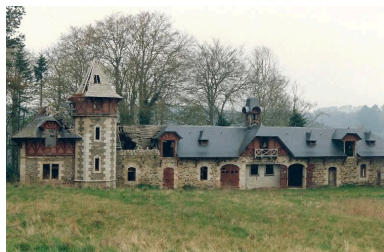
Minihy-Tréguier : communs du château du Bilo, état vers 1999-2000 IVR53_20192205396NUCA