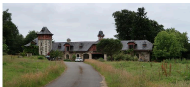
Minihy-Tréguier : communs du château du Bilo, état en 2018 (phase de recensement)