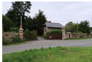
Minihy-Tréguier : entrée du château du Bilo, état en 2018 (phase de recensement) IVR53_20192205394NUCA