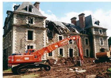
Minihy-Tréguier : le château du Bilo lors de sa destruction, juillet 2000