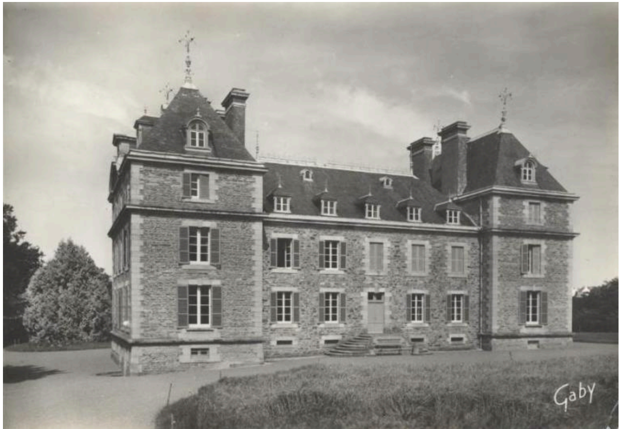
Minihy-Tréguier : château du Bilo et communs, vue générale, carte postale (collection particulière)