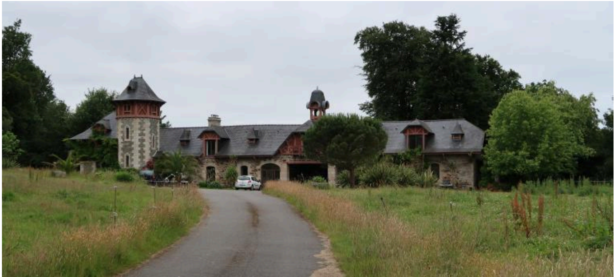
Minihy-Tréguier : communs du château du Bilo, état en 2018 (phase de recensement)