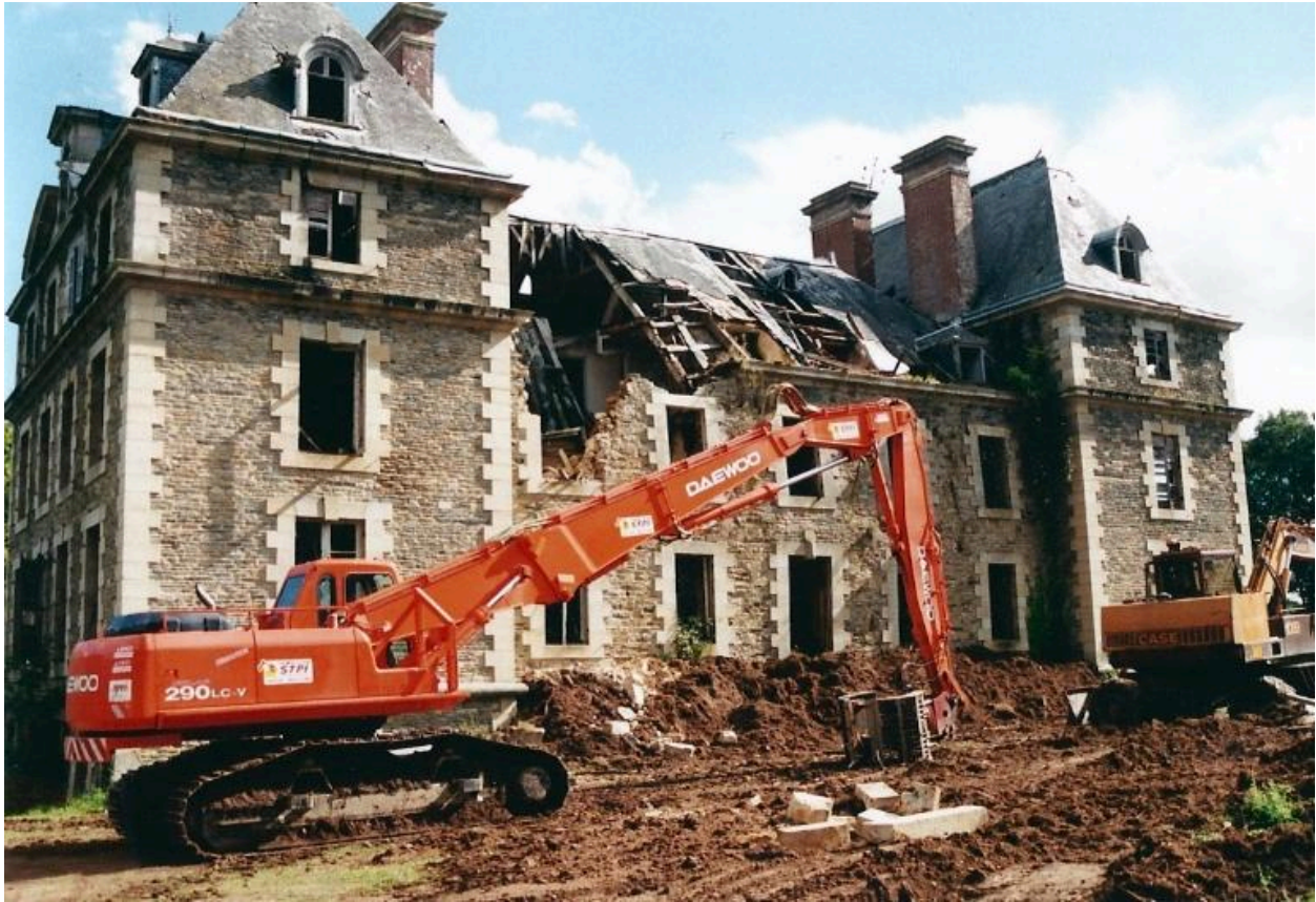
Minihy-Tréguier : le château du Bilo lors de sa destruction, juillet 2000