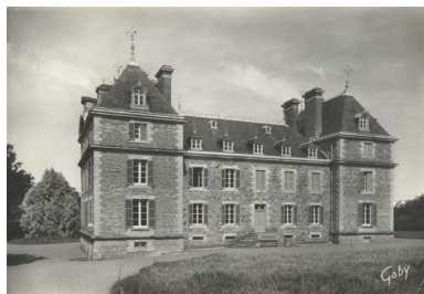
Minihy-Tréguier : château du Bilo et communs, vue générale, carte postale IVR53_20192205306NUCA