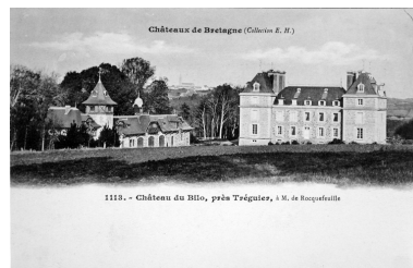
Minihy-Tréguier : château du Bilo et communs, vue générale, carte postale (collection particulière) IVR53_20042209039NUCB