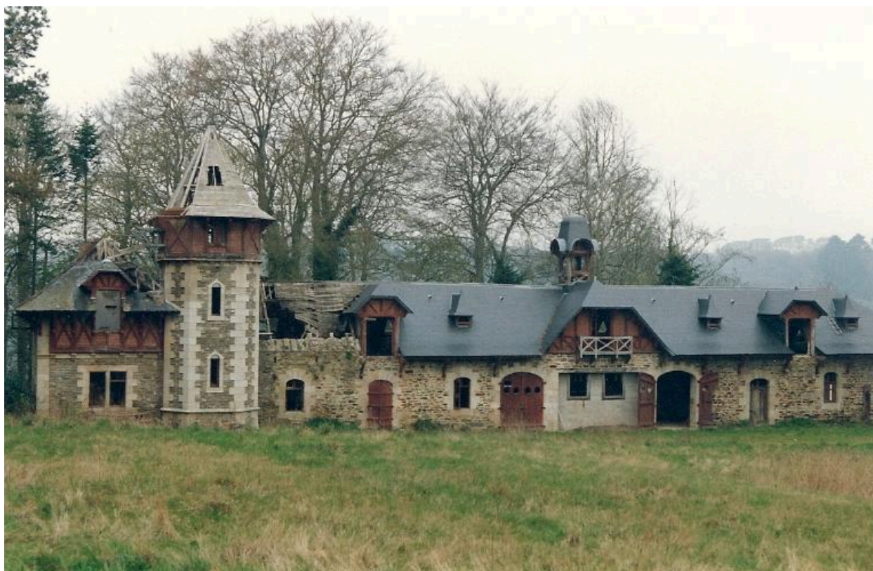
Minihy-Tréguier : communs du château du Bilo, état vers 1999-2000