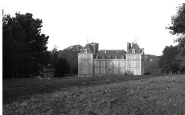
Minihy-Tréguier : château du Bilo et communs, photographie de 1973 IVR53_19732205405Z