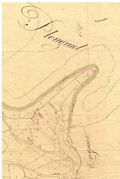
Extrait du cadastre ancien de Minihy-Tréguier, section A1 dite de Saint-Yves, 1835 : Le Bilo IVR53_20182205859NUCA