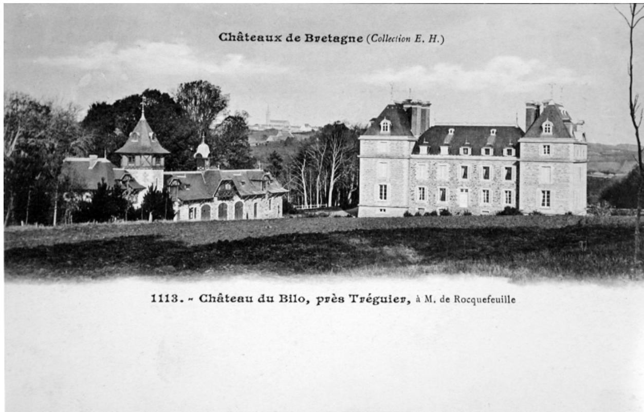
Minihy-Tréguier : château du Bilo et communs, vue générale, carte postale