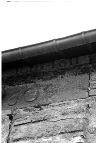
Détail de la date 1609 sur la sacristie.