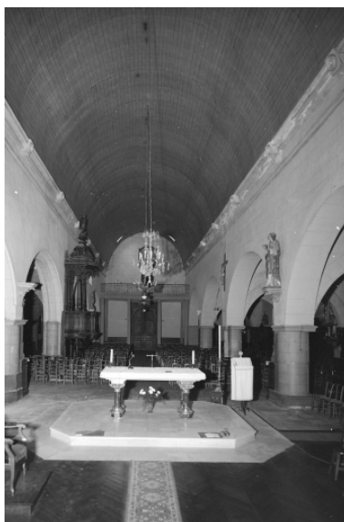
Intérieur, nef : vue générale. IVR53_19683500369V