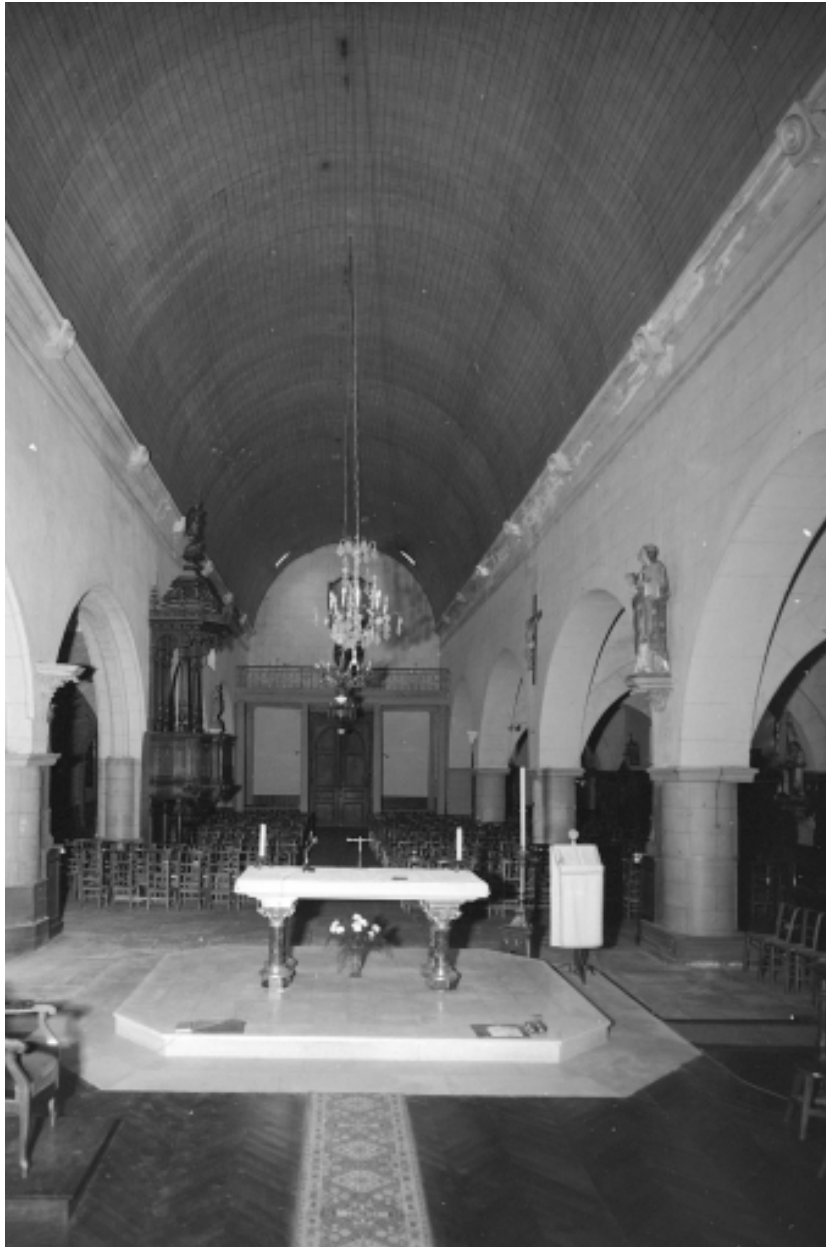
Intérieur, nef : vue générale.