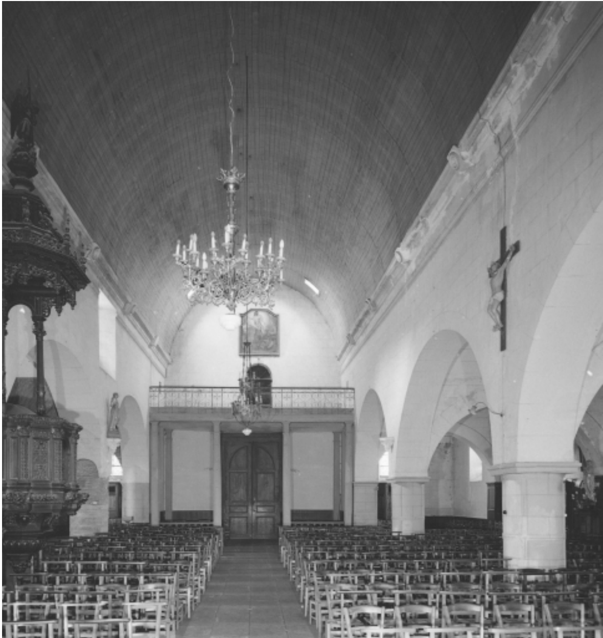
Vue générale est-ouest de la nef.