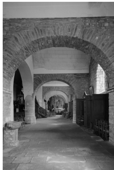
Vue générale axiale bas- côté sud (ouest-est).