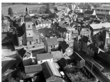
Elévation Ouest : vue aérienne IVR53_19713500479V