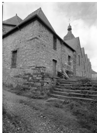
Elévation nord-est : vue générale IVR53_19683500453V