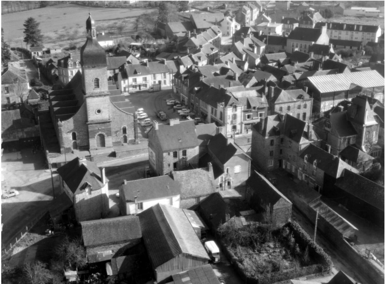
Elévation Ouest : vue aérienne