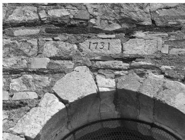
Détail de la date 1731 sur la troisième travée. IVR53_19683500409V