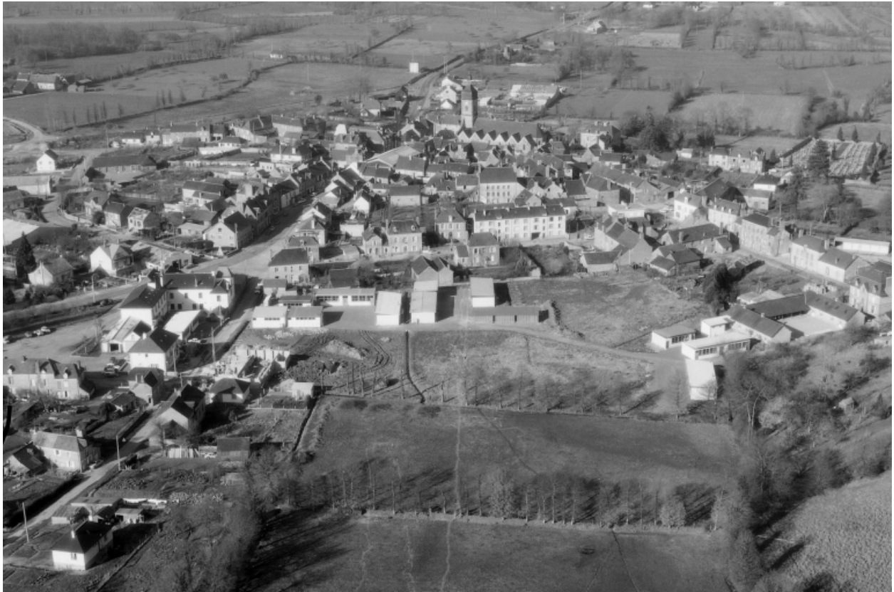
Vue aérienne vers le nord.