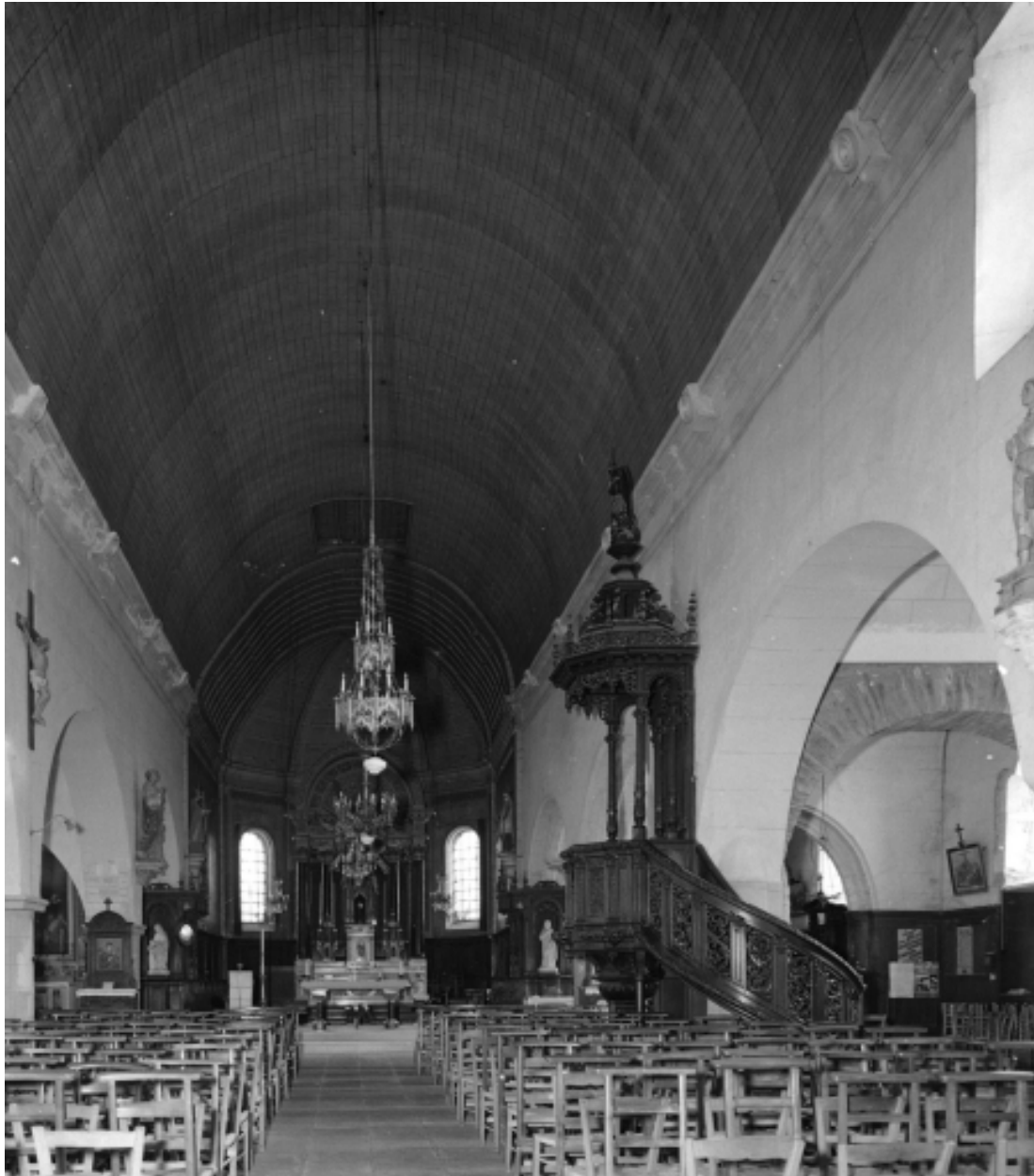
Intérieur : vue générale vers le chœur.