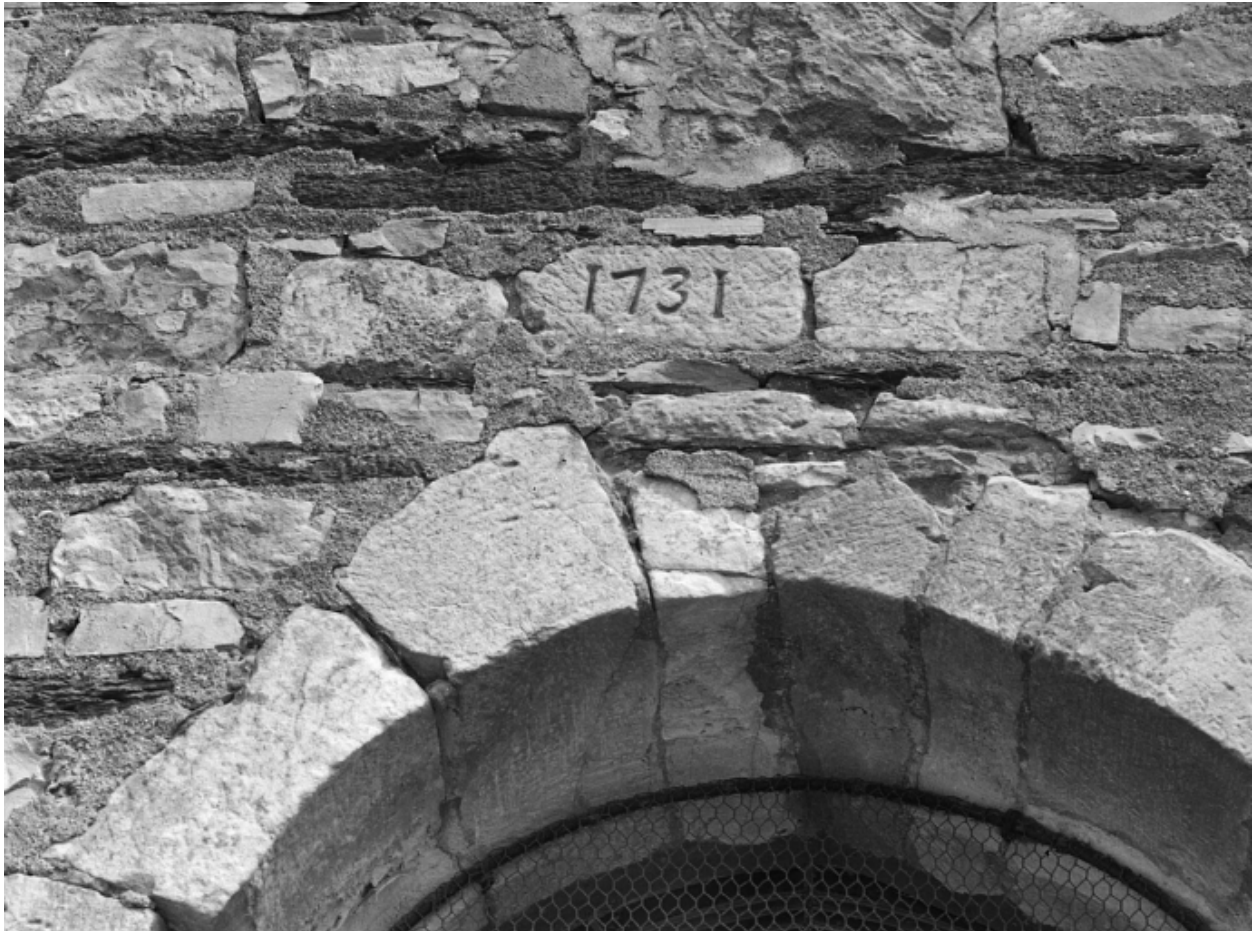
Détail de la date 1731 sur la troisième travée.