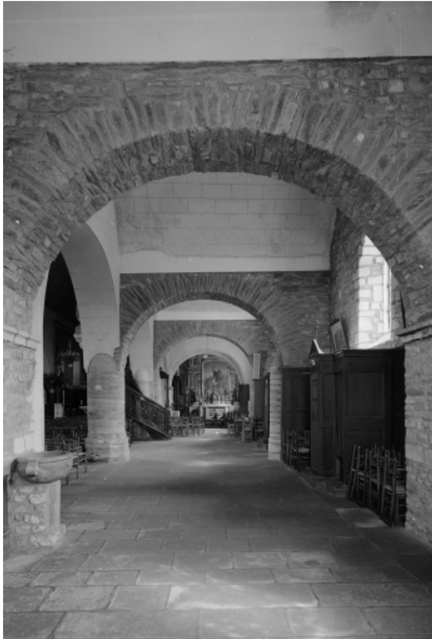
Vue générale axiale bas-côté sud (ouest-est).