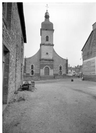
Elévation ouest : vue générale IVR53_19683500367V