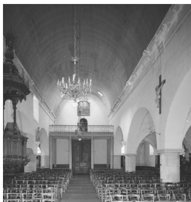
Vue générale est-ouest de la nef.