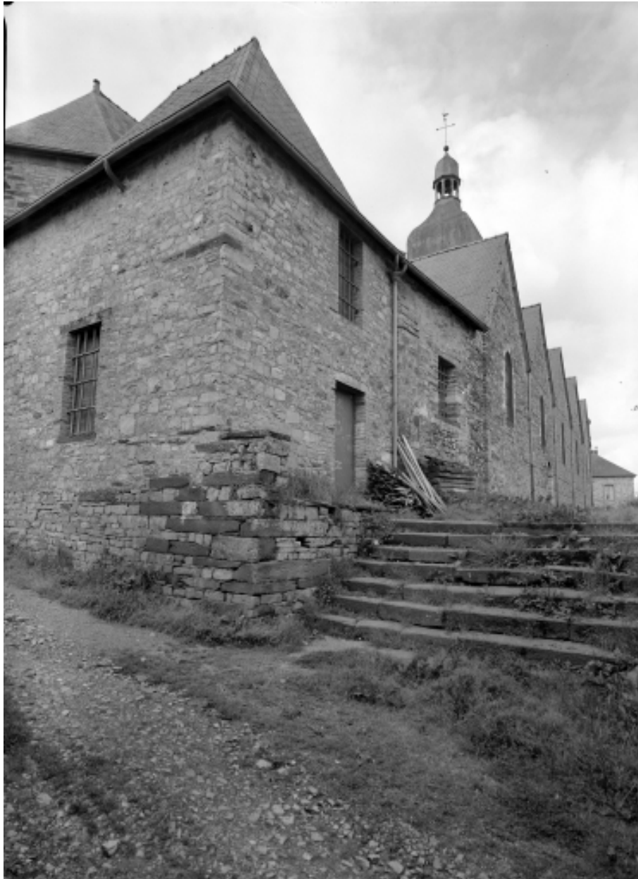
Elévation nord-est : vue générale