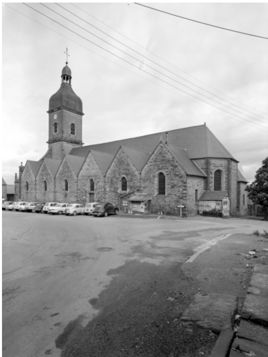
Elévation sud : vue générale