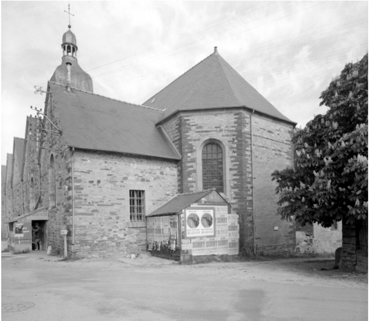
Elévation Est : vue générale