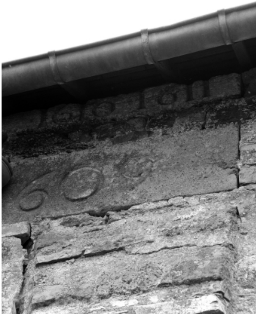
Détail de la date 1609 sur la sacristie.