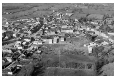
Vue aérienne vers le nord. IVR53_19713500478V