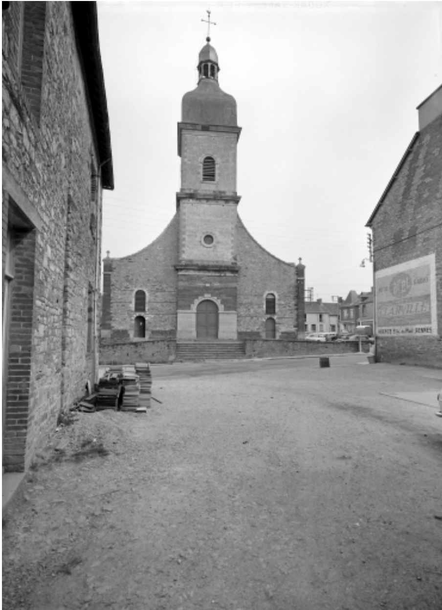
Elévation ouest : vue générale