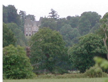
Vue de situation nord IVR53_20013519568NUCA