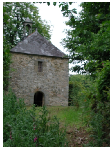
Chapelle