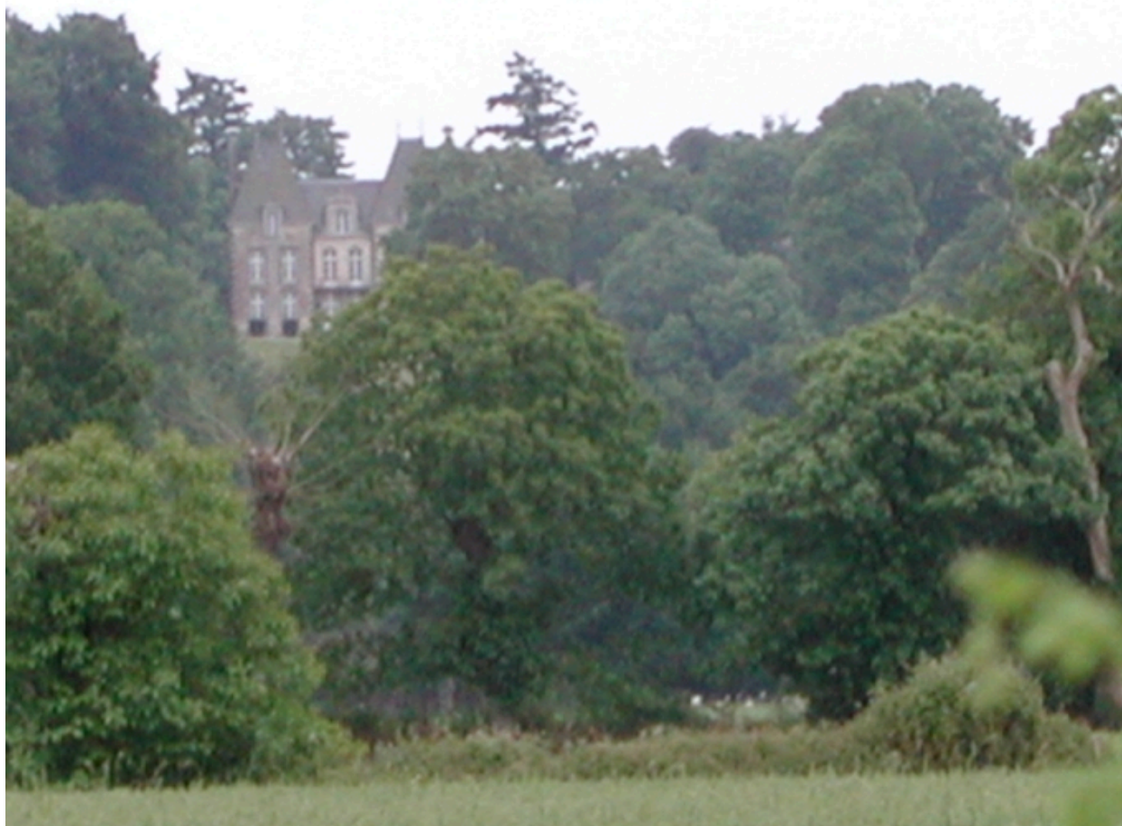
Vue de situation nord