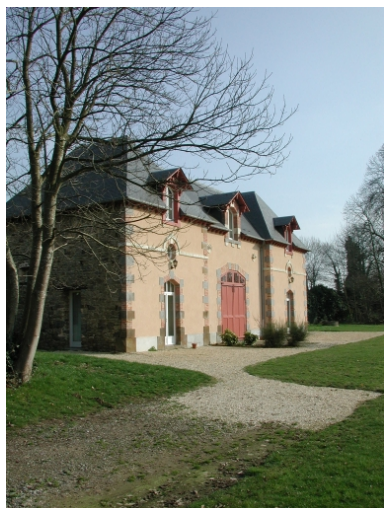
Ancien chenil IVR53_20013520092NUCA