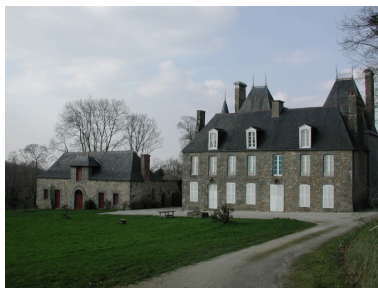
Vue générale sud IVR53_20013520097NUCA