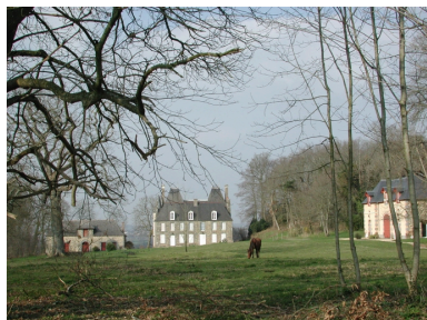
Vue de situation sud