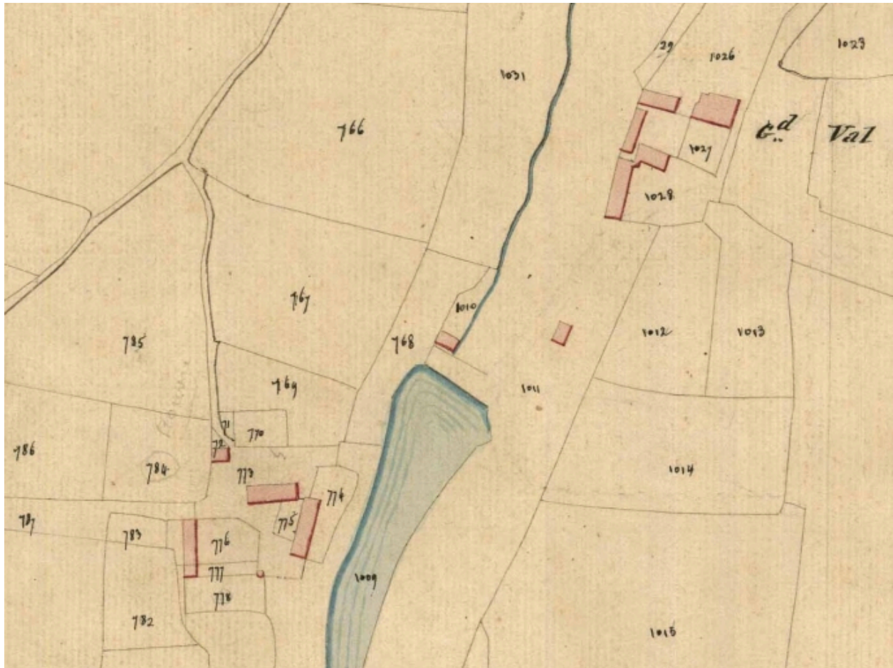
Cadastre vers 1825