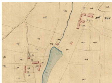
Cadastré vers 1825 IVR53_20013520053NUC