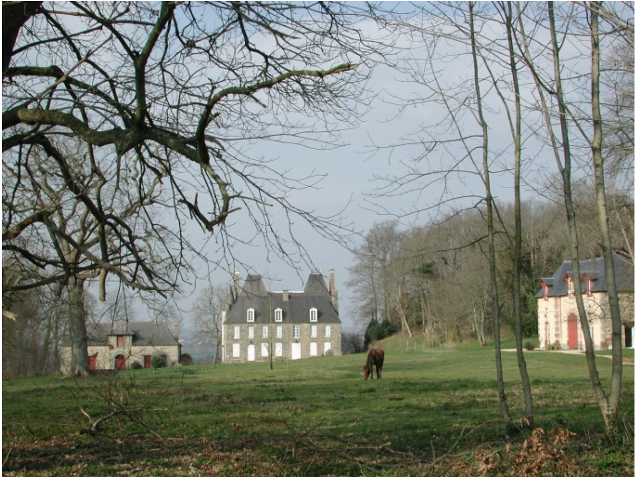
Vue de situation sud