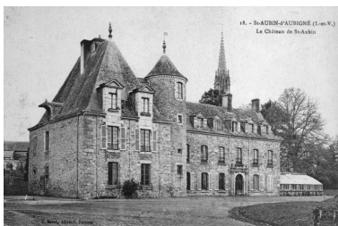
Carte postale IVR53_19883500573XB

IVR53_19913500595XB