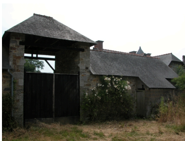
Communs ; vue partielle IVR53_20053516654NUCA