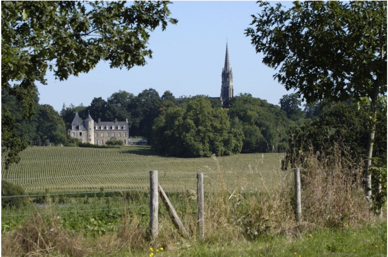
Vue de situation sud