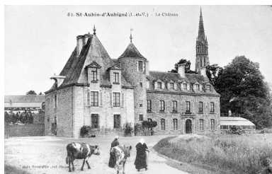
Carte postale IVR53_19913500596XB

Cadastre de 1828 ; logis parcelle 68 IVR53_20053516963NUCA