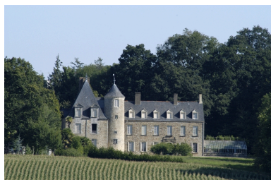
Vue générale sud IVR53_20053502410NUCA