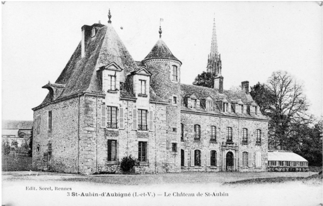
Edit. Sorel, Rennes 3 St-Aubin-d'Aubigné (I.-et-V.) — Le Château de St-Aubin