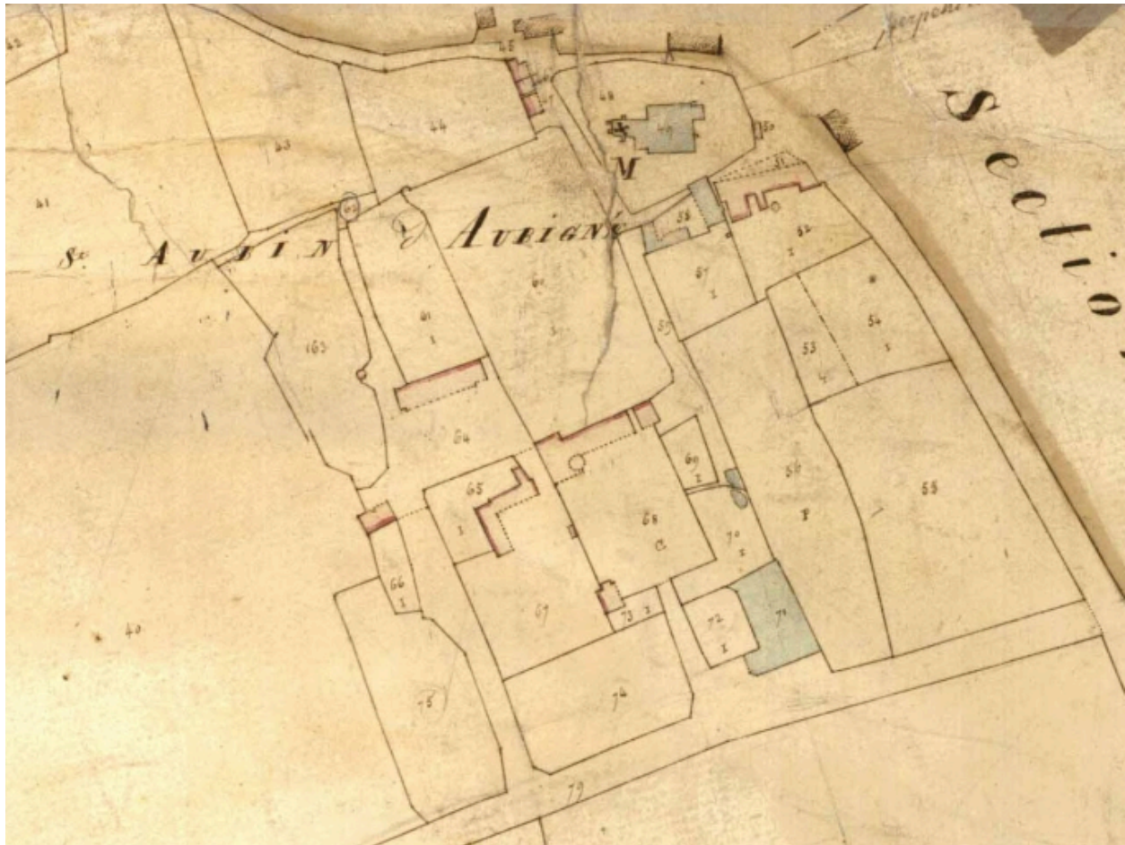
Cadastre de 1828 ; logis parcelle 68