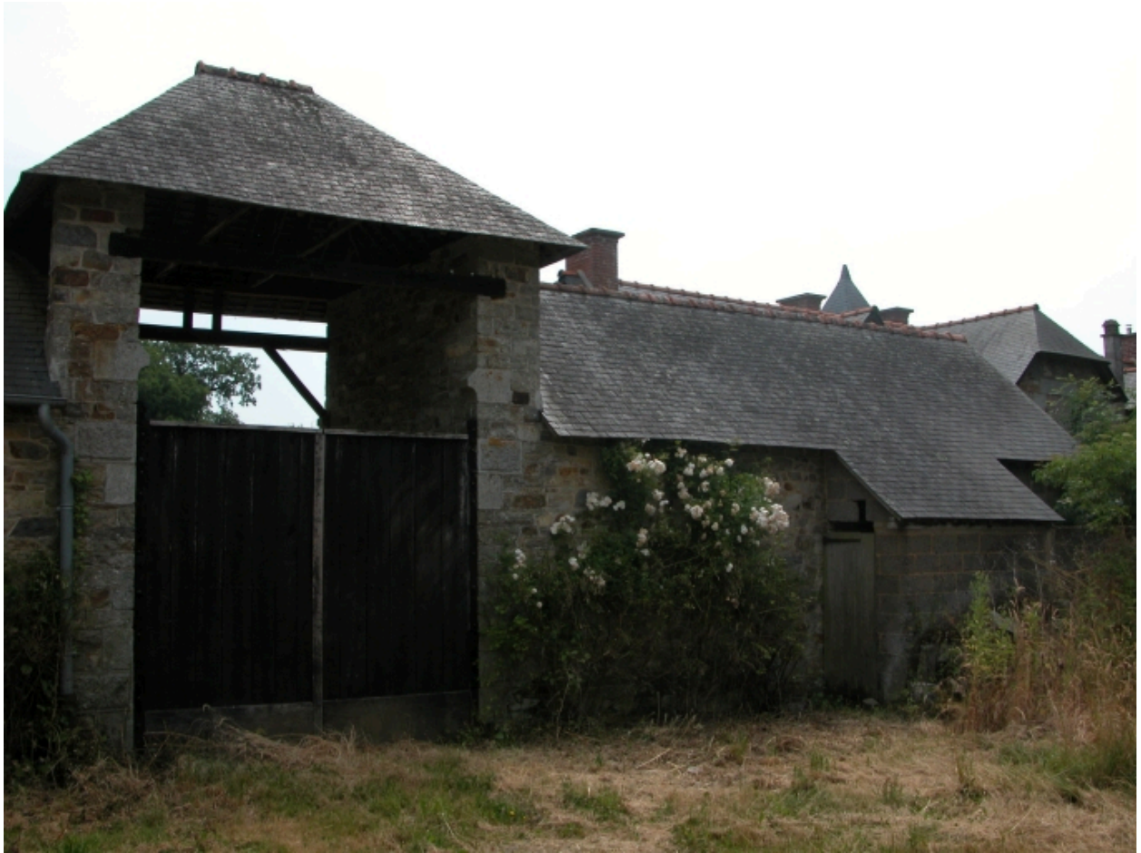
Communs ; vue partielle