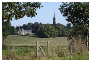
Vue de situation sud IVR53_20053502412NUCA

IVR53_19913500597XB