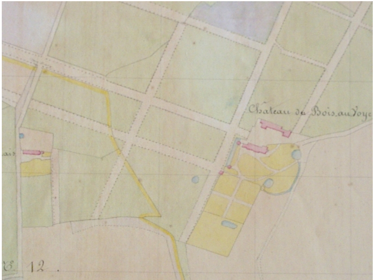
Bois au Voyer(le) : le château et ses dépendances, tableau d'assemblage du cadastre de 1830