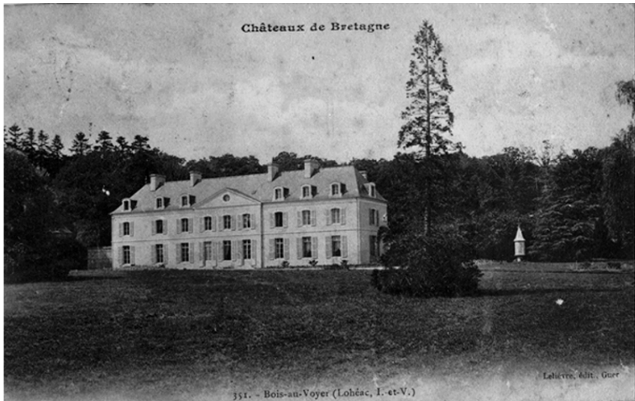
Le corps principal du château (façade sur le parc), sur une carte postale du début du 20e siècle : vue générale sud-est