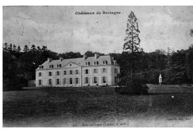
Le corps principal du château (façade sur le parc), sur une