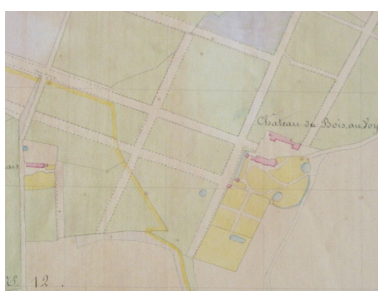
Bois au Voyer(le) : le château et ses dépendances, tableau d'assemblage du cadastre de 1830 IVR53_19983503708NUC