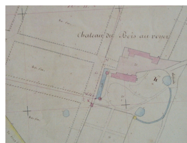
Bois au Voyer(le) : le château et ses dépendances sur le cadastre de 1830 IVR53_19983503709NUC