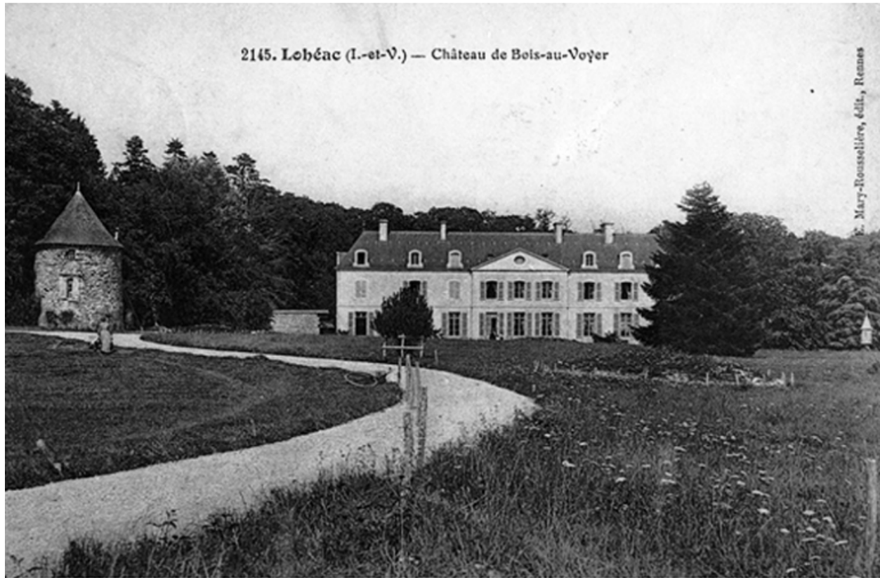
Le château avec le colombier sur une carte postale au début du 20e siècle : vue générale sud-est