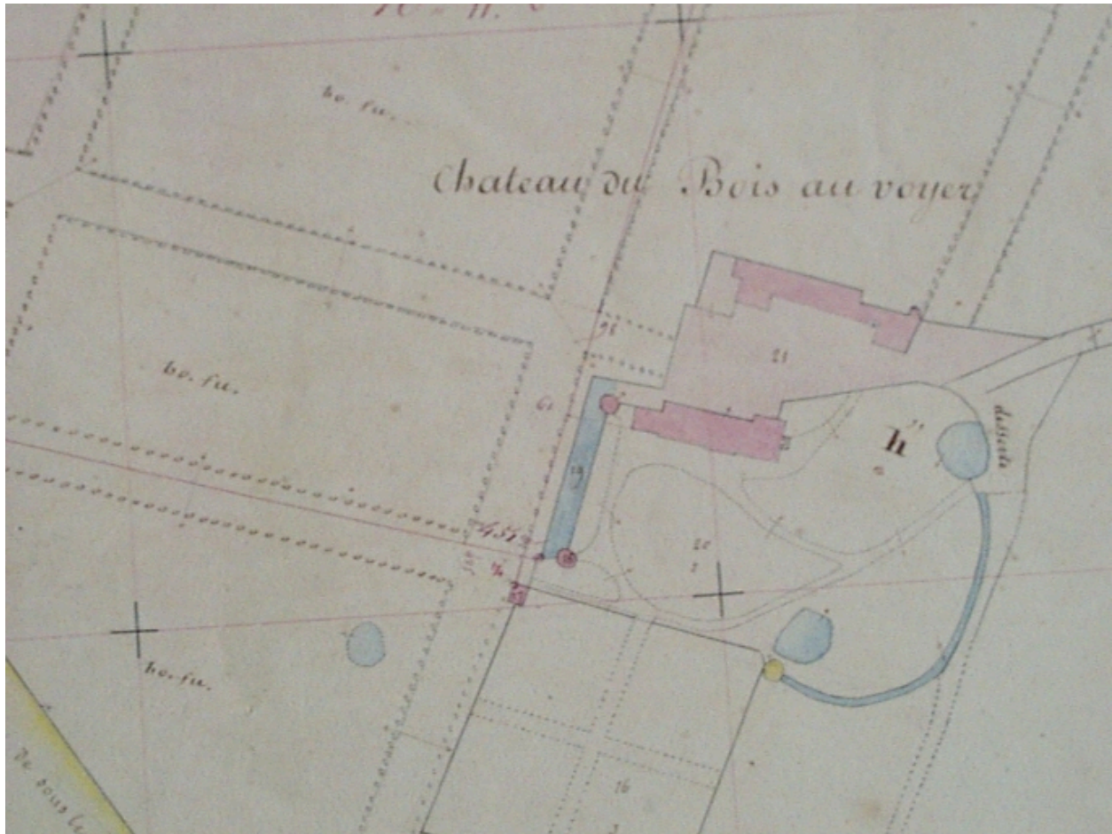
Bois au Voyer(le) : le château et ses dépendances sur le cadastre de 1830