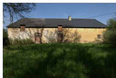
Ferme IVR53_20102202755NUCA