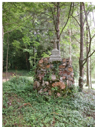
Parc, 2ème croix IVR53_20092210774NUCA