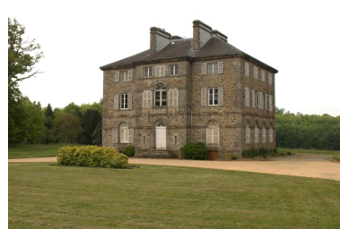
Château, façade nord sur cour IVR53_20102202794NUCA