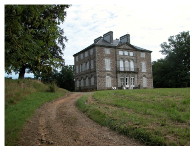
Château, vue générale sud IVR53_20092210759NUCA