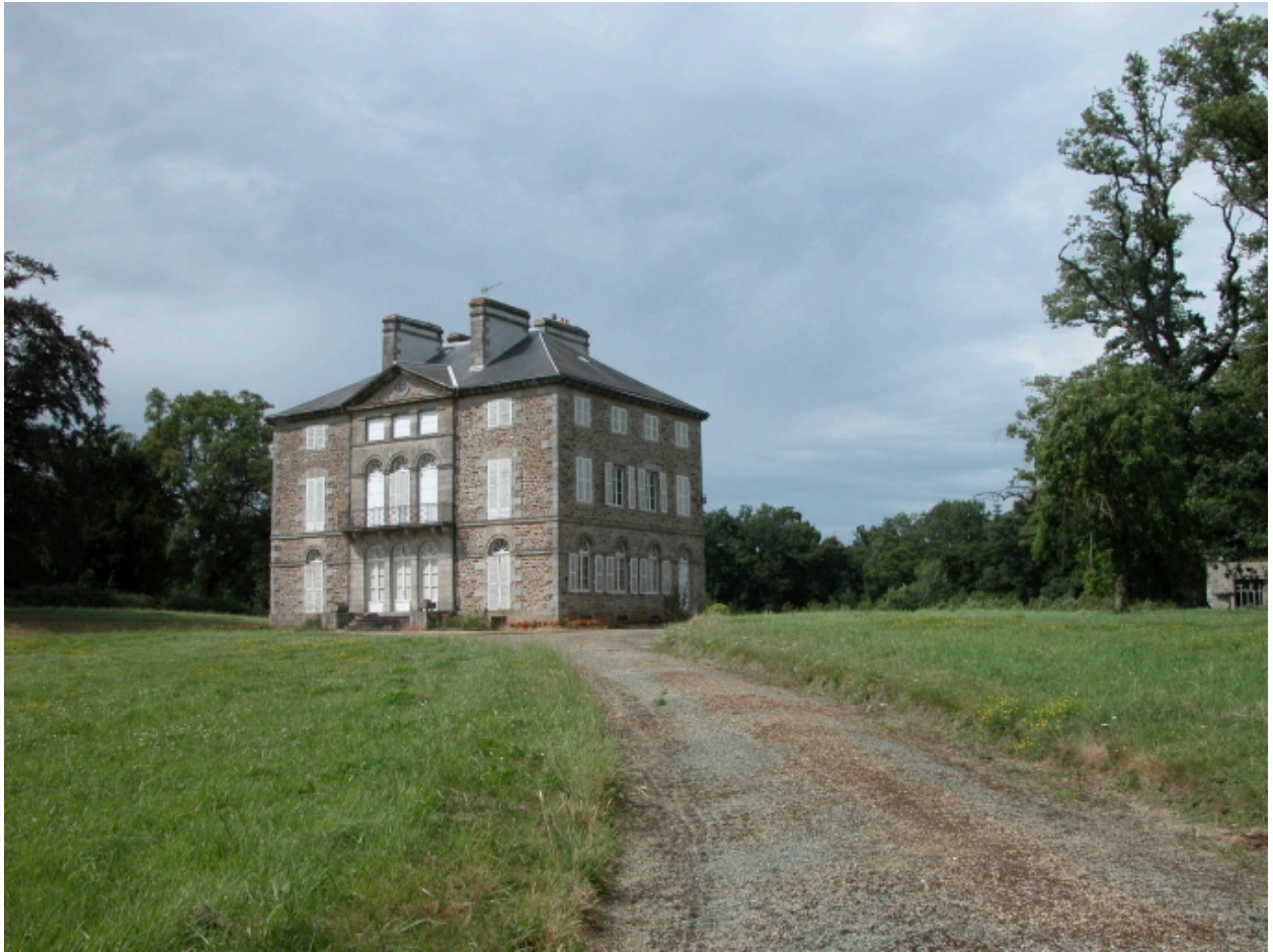
Château, vue générale sud