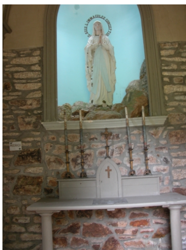
Chapelle, vue intérieure