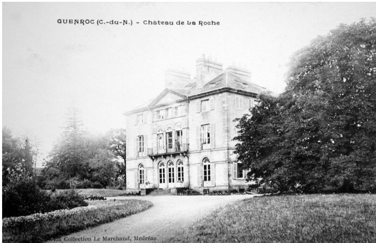
Château de la Roche, carte postale du début du siècle, collection Lemarchand, Médréac (A.D. Ille-et-Vilaine : 6Fi Guenroc)