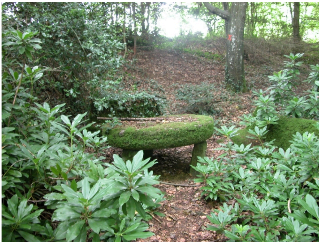
Parc, mobilier de jardin, remploi de meules de pressoir