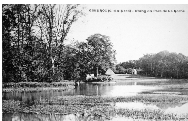
Etang du parc de la Roche, carte postale du début du 20e