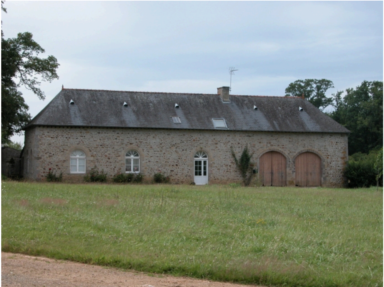
Communs, aile ouest