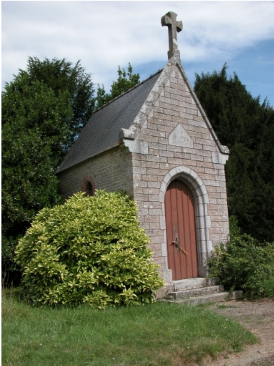
Chapelle située à l'est de l'étang