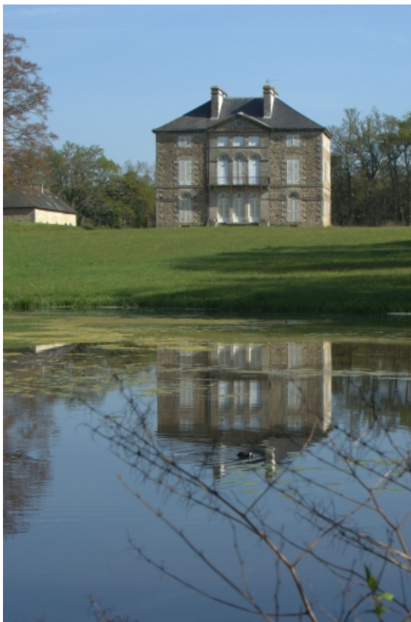
Château, étang et façade sud