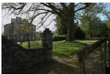
Enclos et parc