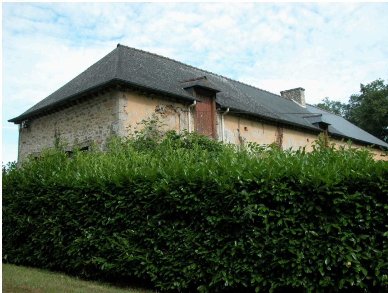
Ferme, le logis