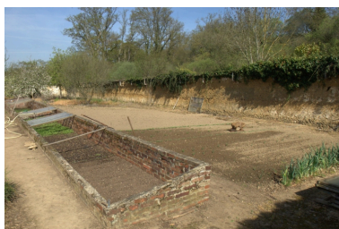
Jardin potager, serres quadrangulaires IVR53_20102202762NUCA