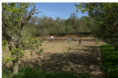
Jardin potager IVR53_20102202761NUCA