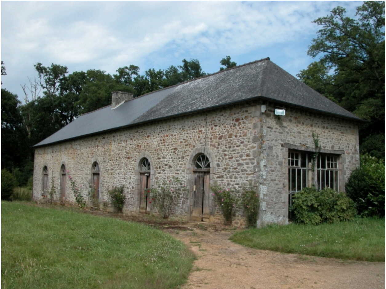
Communs, aile est