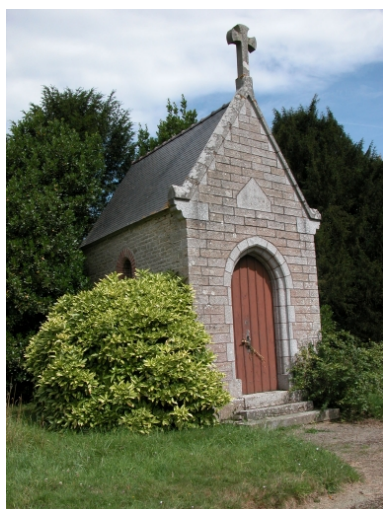
Chapelle située à l'est de l'étang IVR53_20092210849NUCA