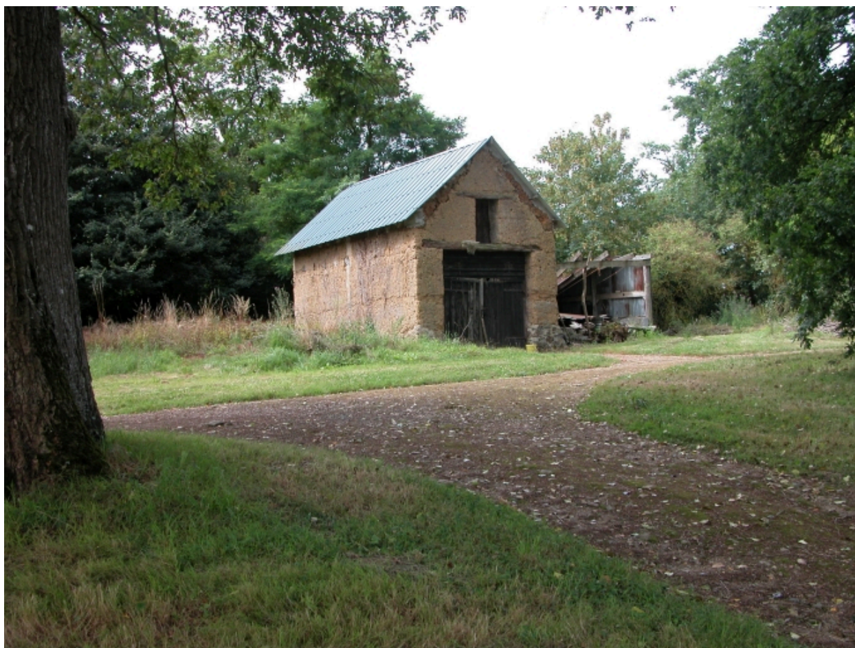
Ferme située à l'ouest, la grange