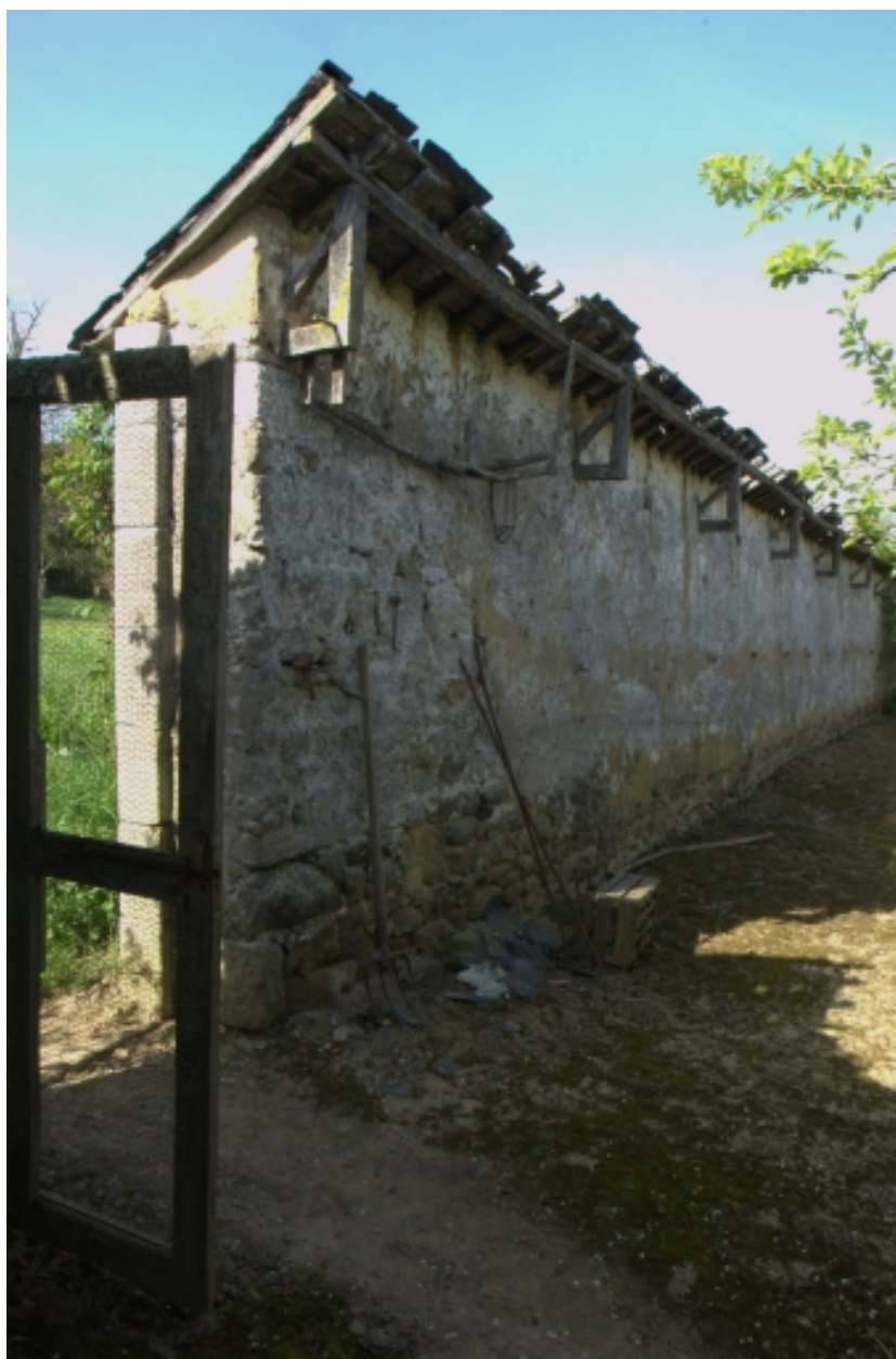
Clos du jardin potager