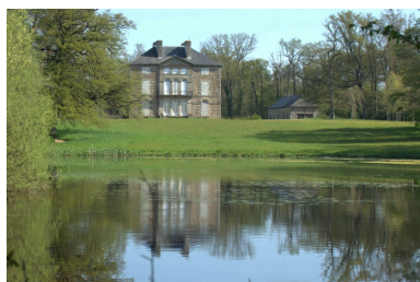
Château, vue générale donnant sur le parc IVR53_20102202746NUCA

IVR53_20042209061NUCB