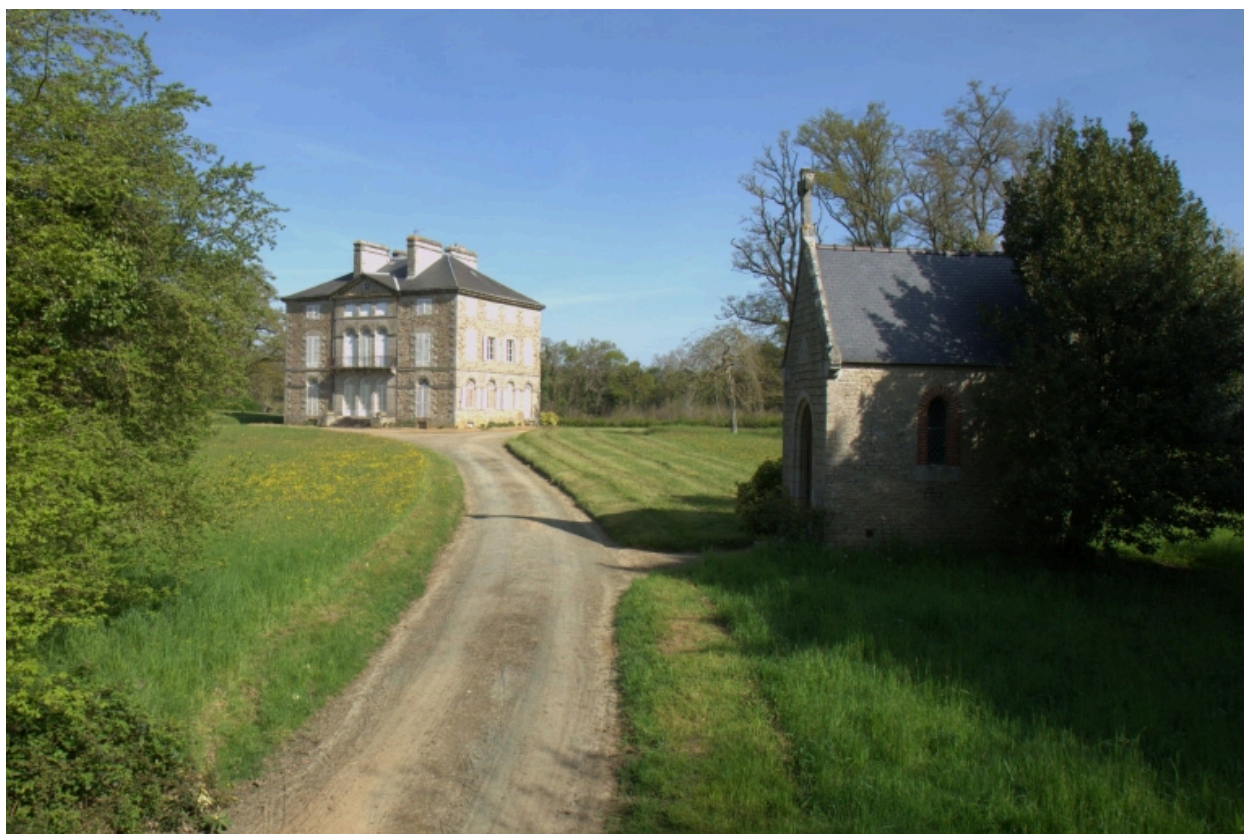
Chapelle située à l'est de l'étang