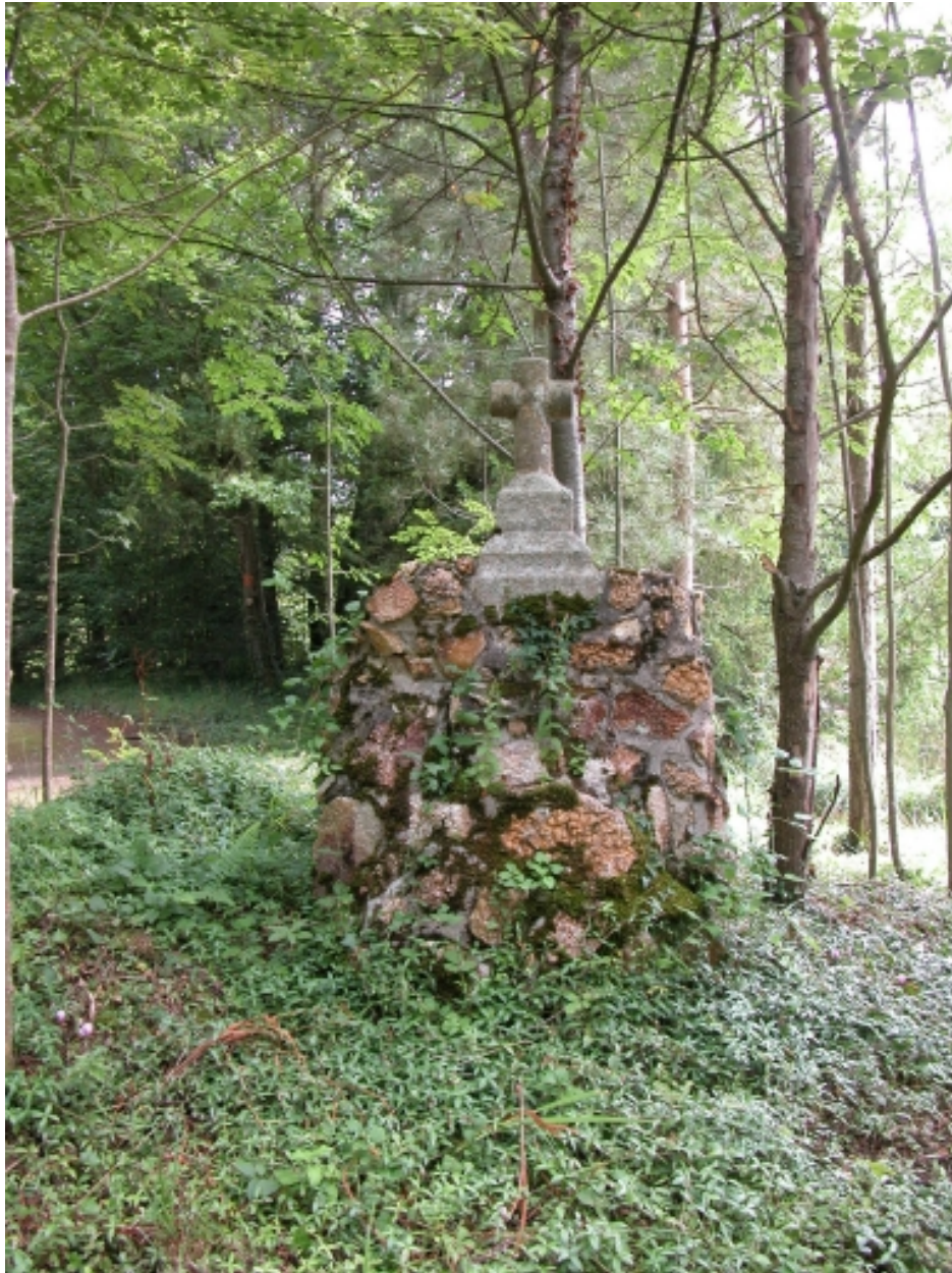
Parc, 2ème croix