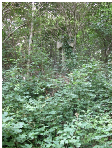
Parc, 1ère croix IVR53_20092210776NUCA