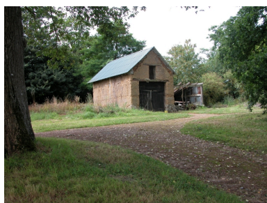
Ferme située à l'ouest, la grange IVR53_20092210798NUCA