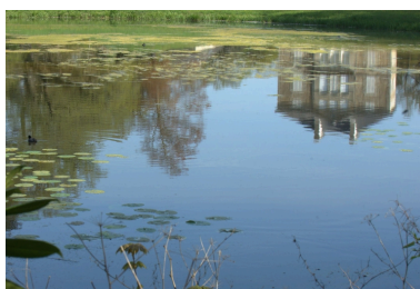
Reflét sur l'étang