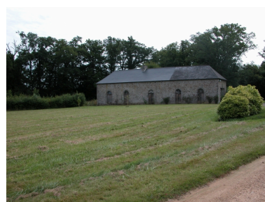
Communs, aile est IVR53_20092210752NUCA