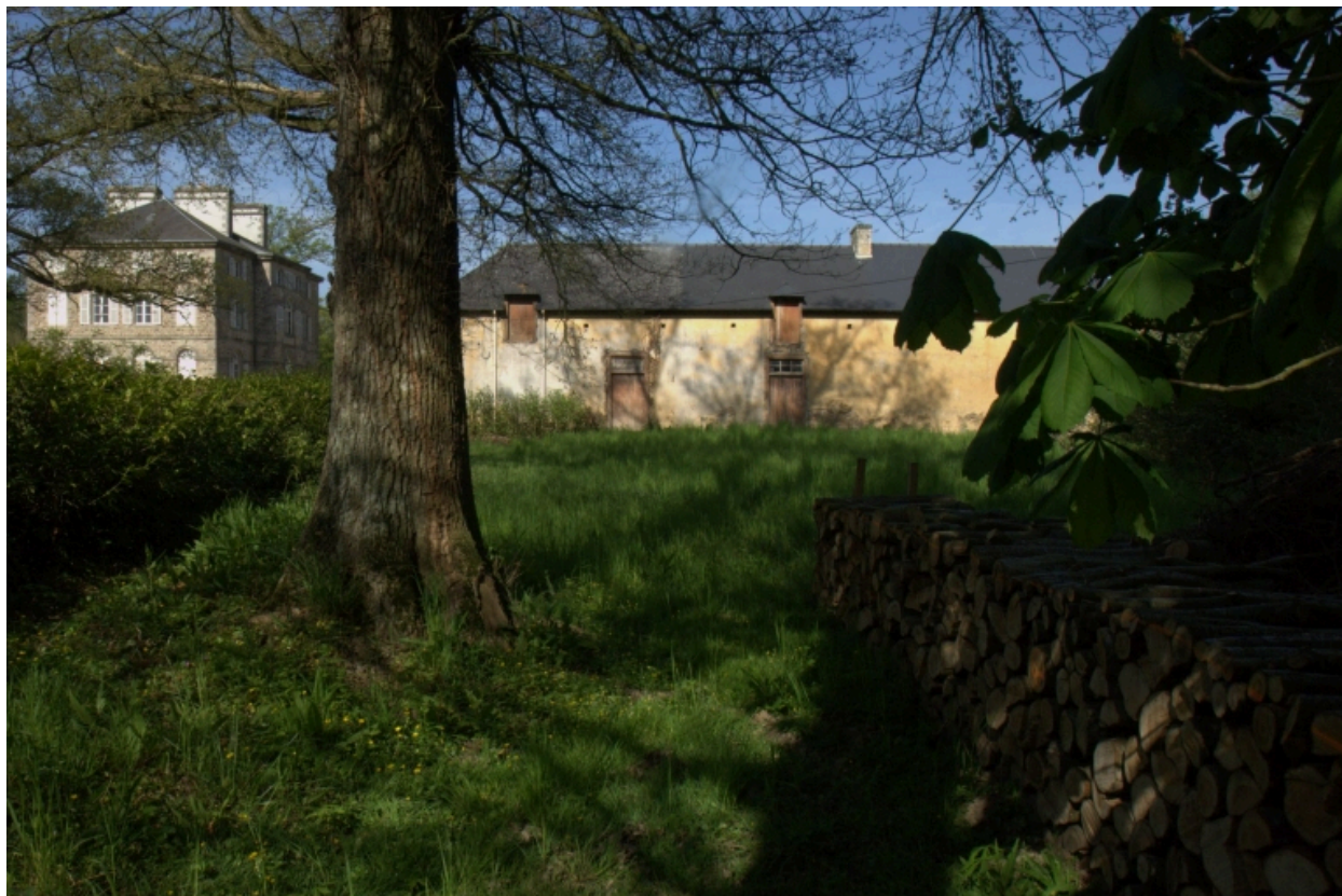
La Ferme du château