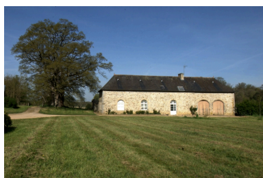
Communs IVR53_20102202742NUCA