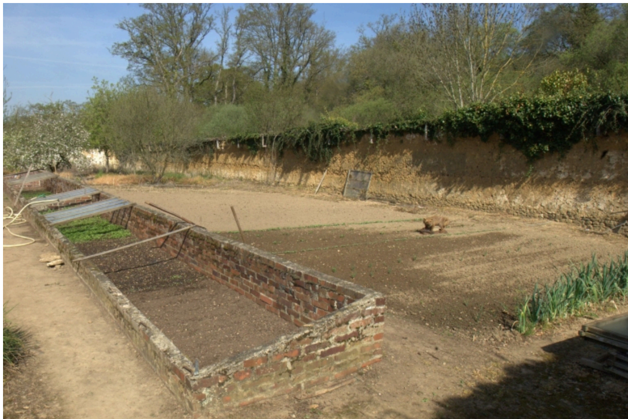
Jardin potager, serres quadrangulaires