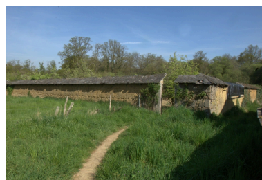
Clos du jardin potager IVR53_20102202759NUCA