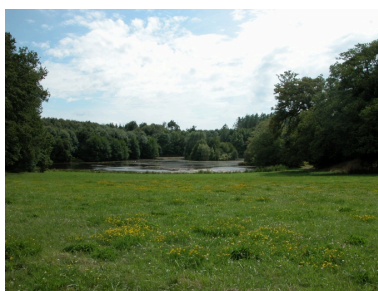
Le parc dessiné au 19e siècle