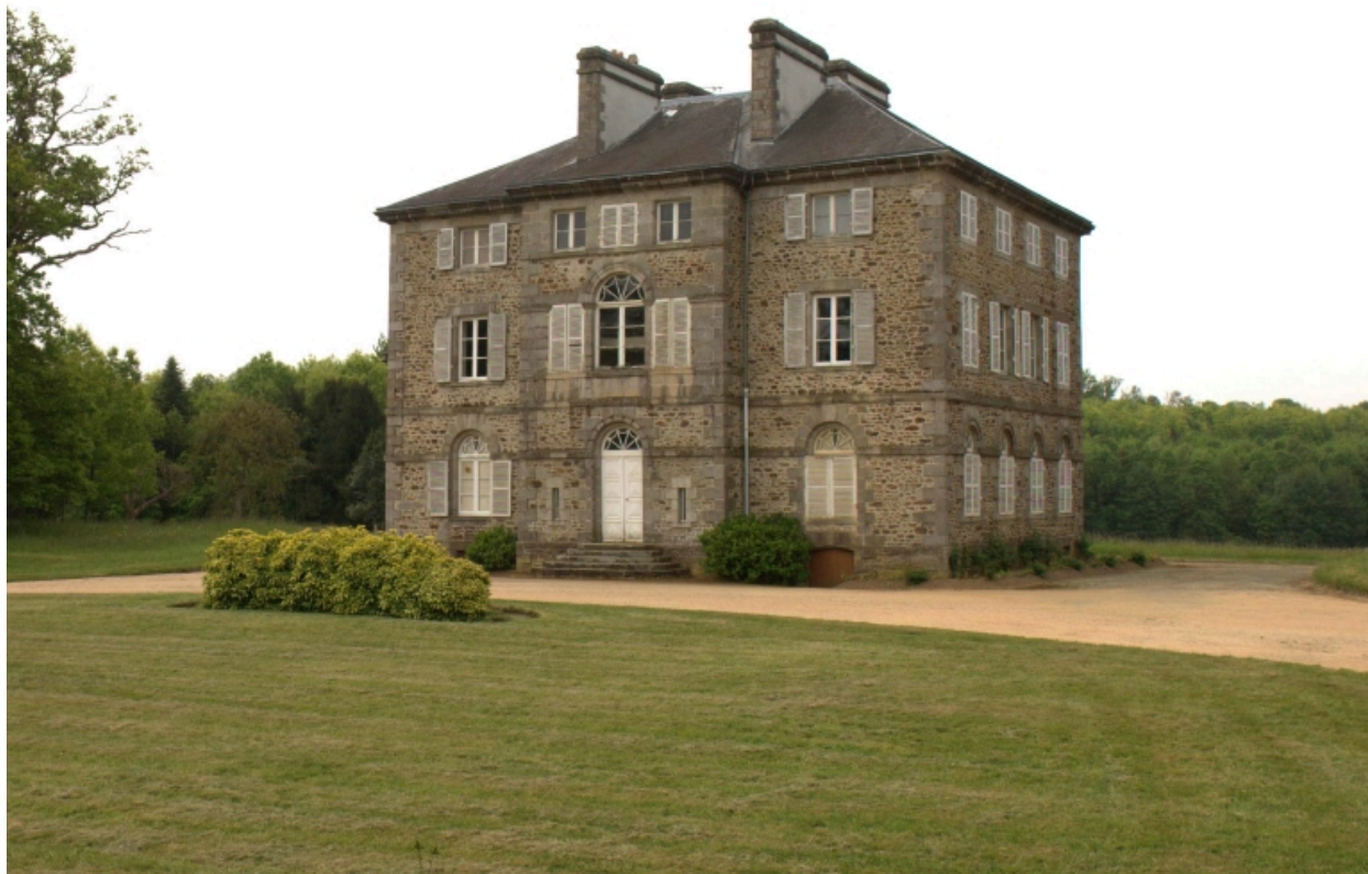
Château, façade nord sur cour