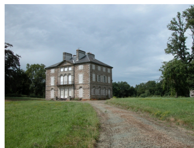
Château, vue générale sud

Phot. Véronique Orain IVR53_20092210856NUCA