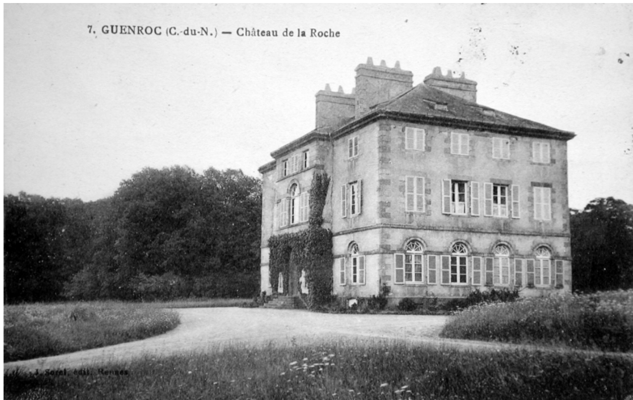
Château de la Roche, façade sur la cour, carte postale du début du 20e siècle, édition J.Sorel à Rennes ( A.D.Ille-et-Vilaine 6Fi Guenroc)