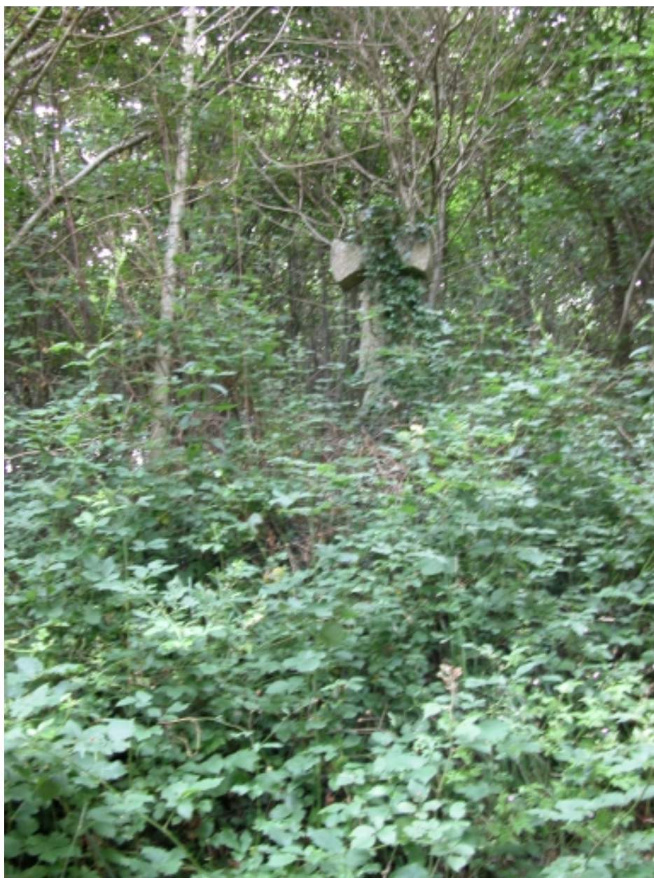
Parc, 1ère croix