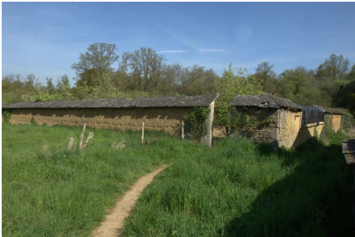
Clos du jardin potager