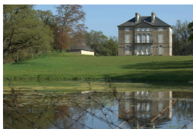
Château, vue générale sud IVR53_20102202748NUCA