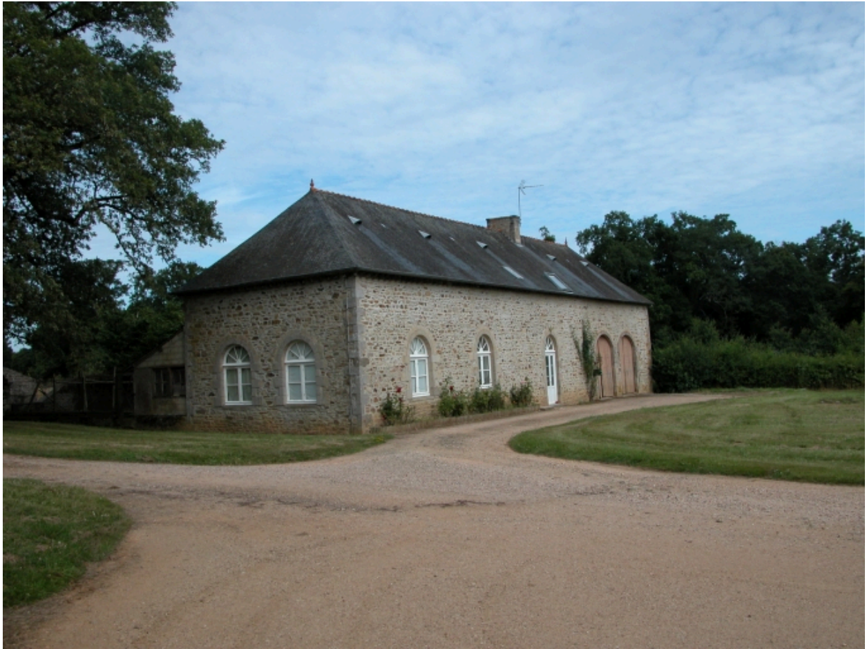
Communs, aile ouest