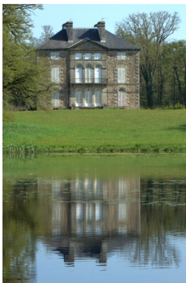
Château, vue générale sud IVR53_20102202747NUCA

IVR53_20042209060NUCB