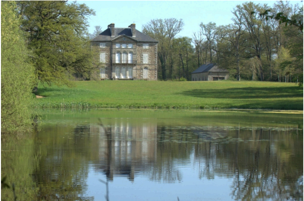
Château, vue générale donnant sur le parc