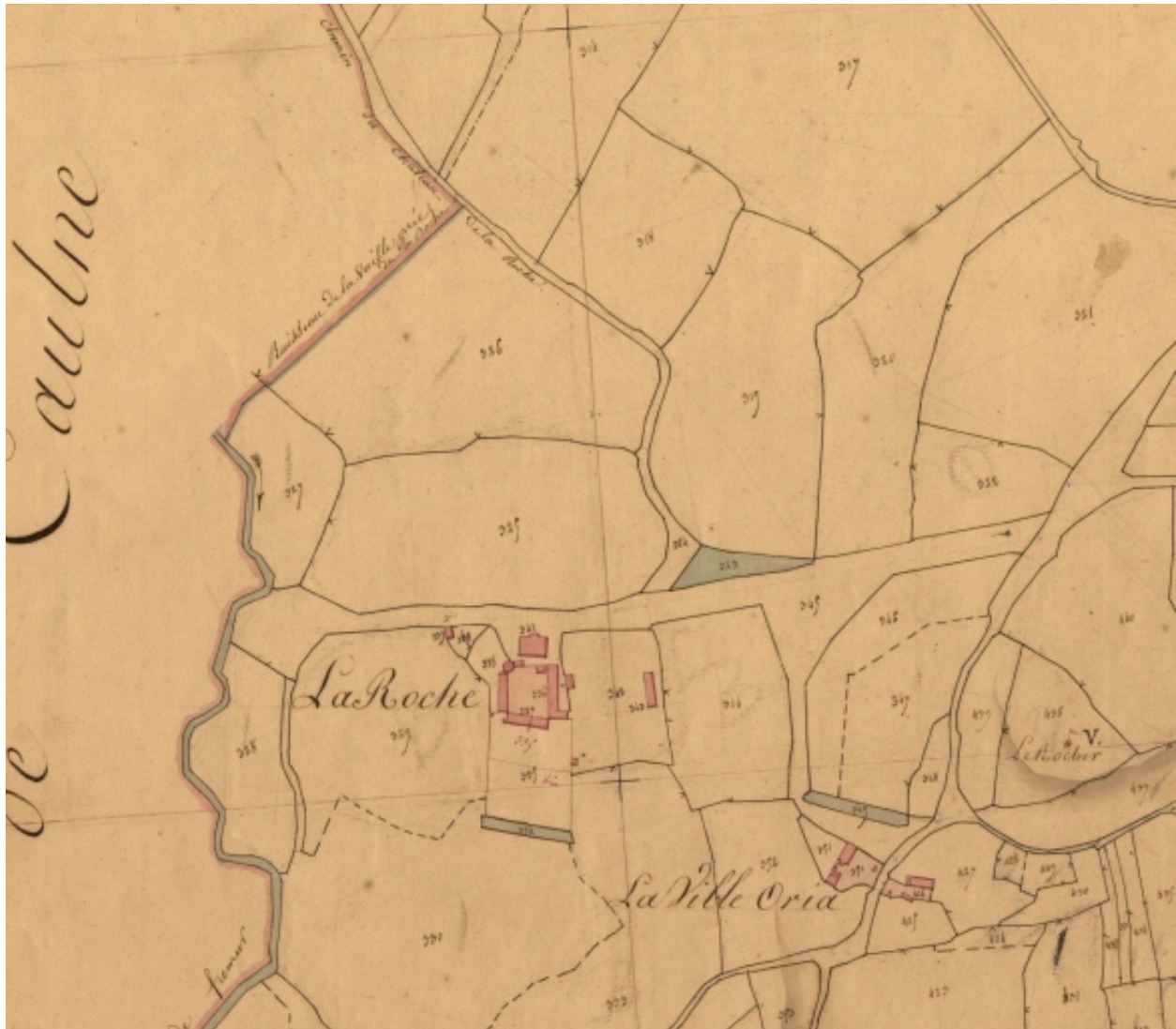
Extrait du cadastre de 1833, section A