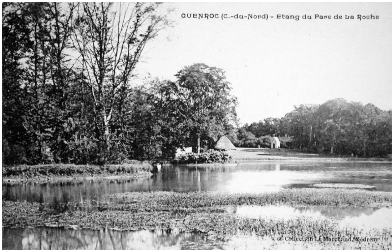
Étang du parc de la Roche, carte postale du début du 20e siècle