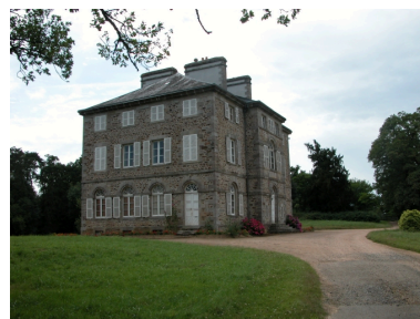
La cour du château, façade est du logis