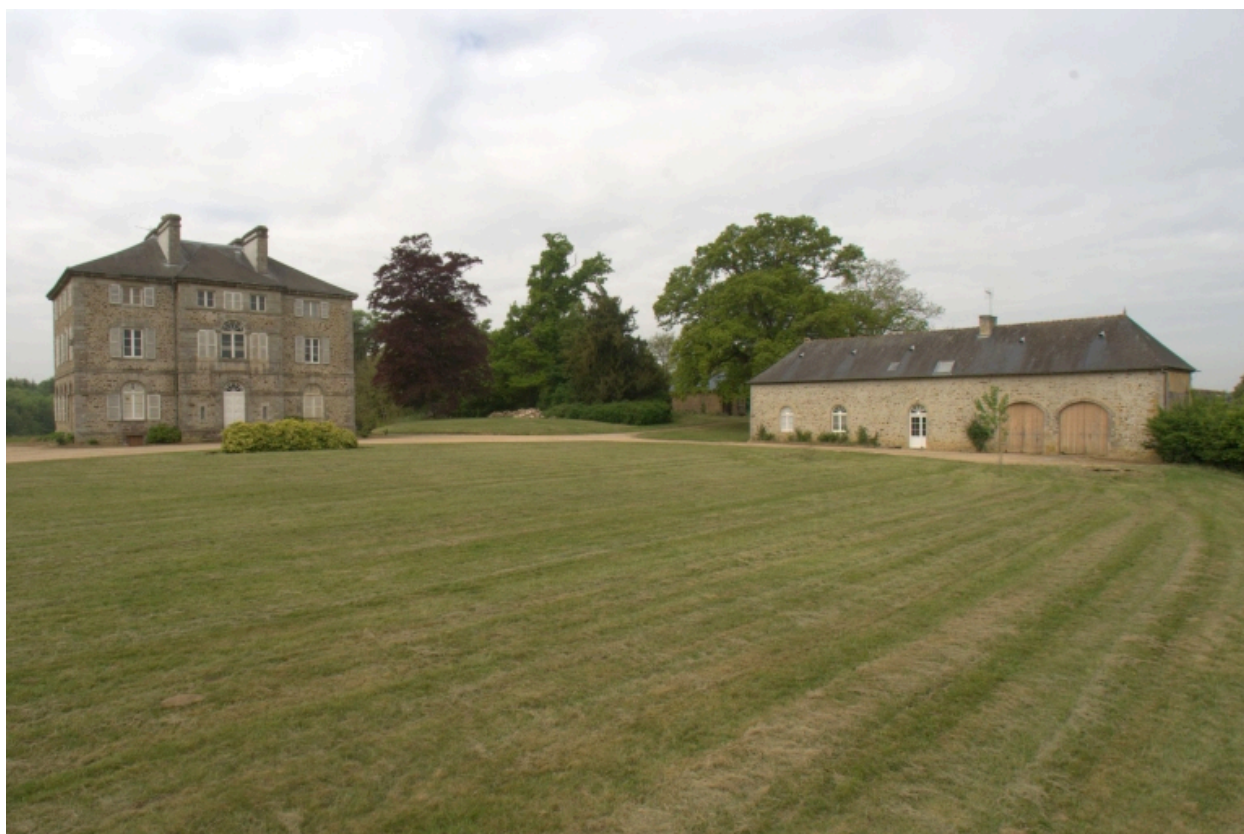
Château, façade nord et aile de communs