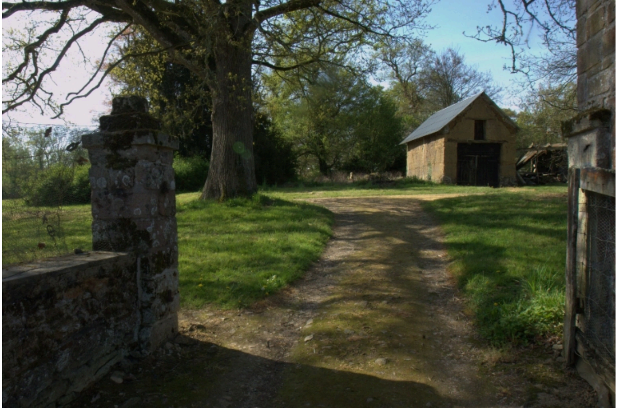
La ferme du château, remise en terre