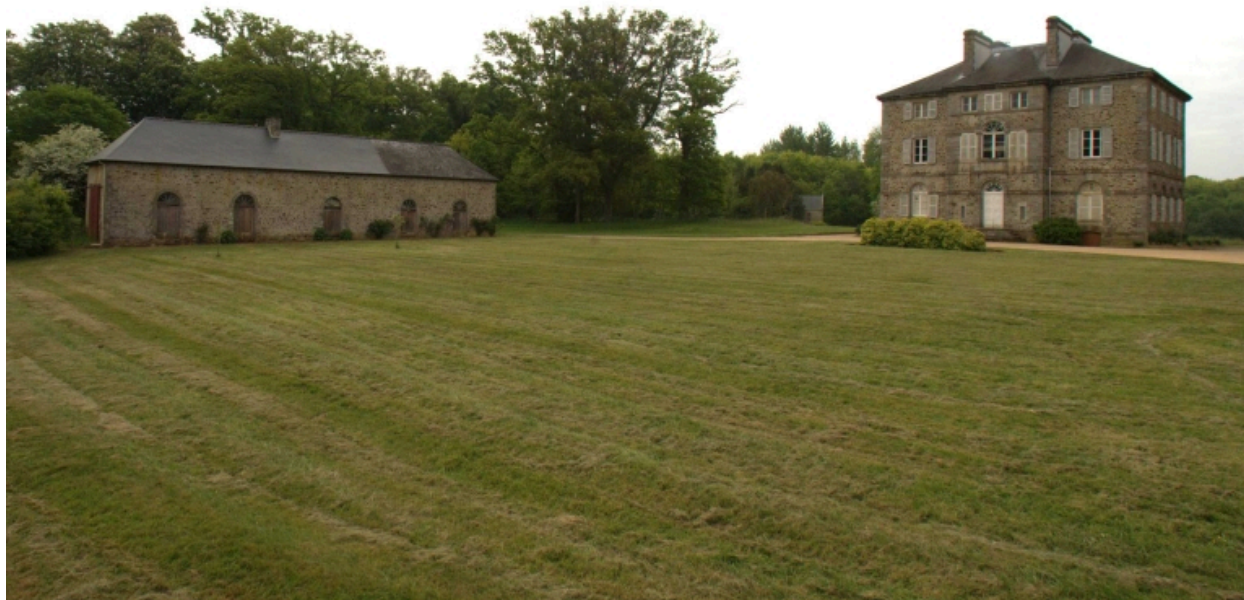
Château, façade nord et aile de communs