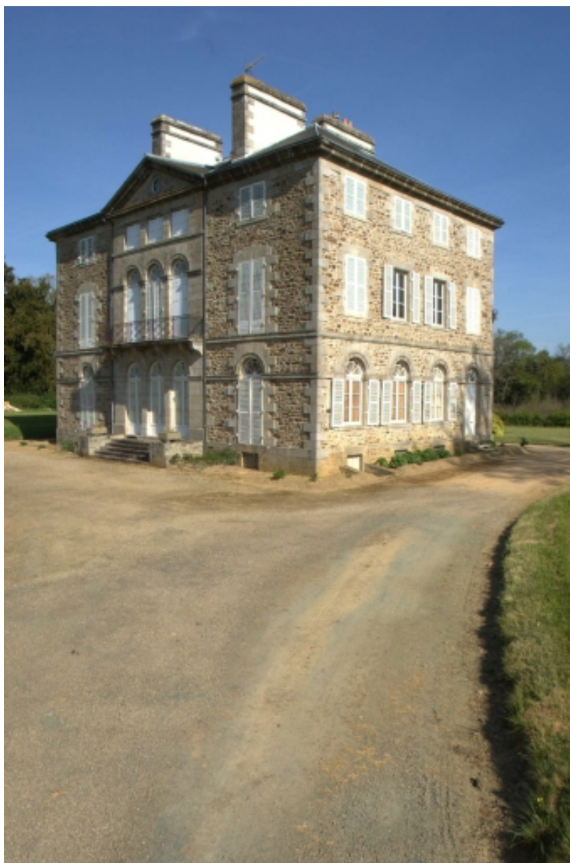
Château, vue de trois quart