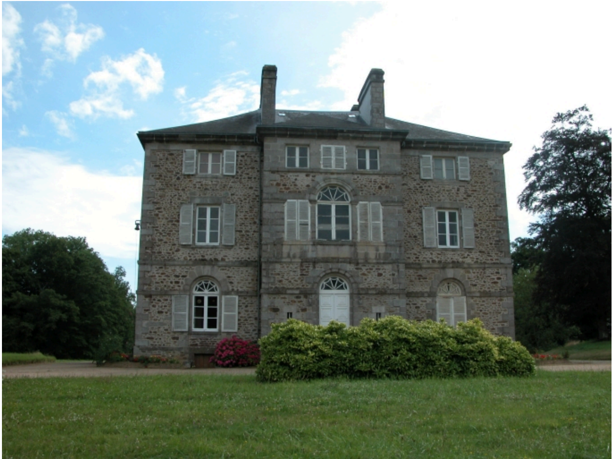
Château, façade nord