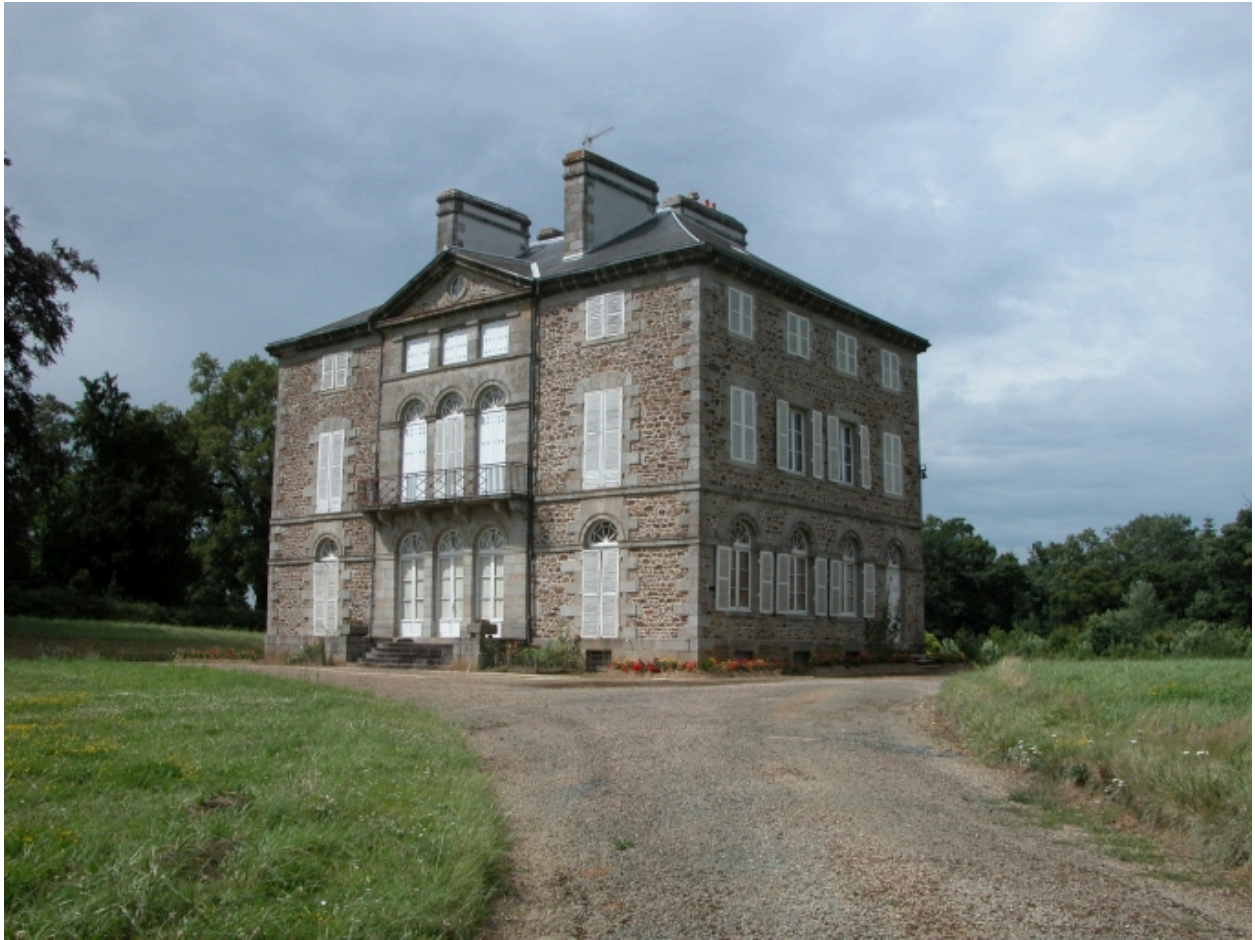
Château, façade sud