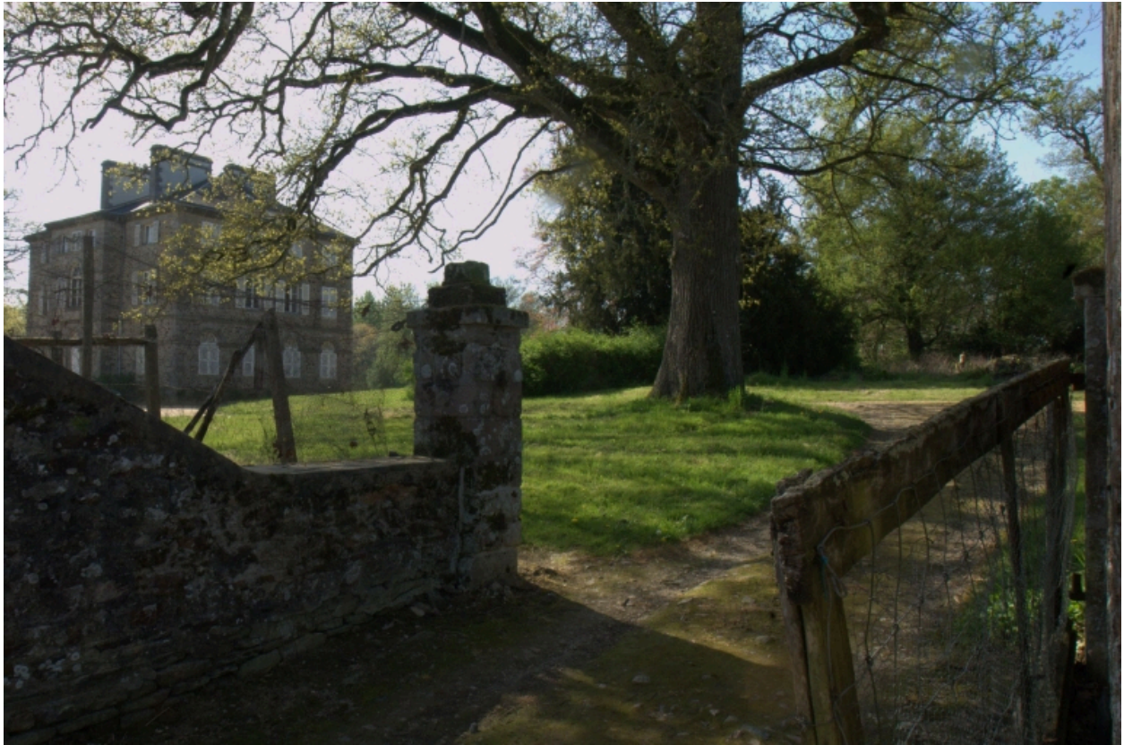
Enclos et parc