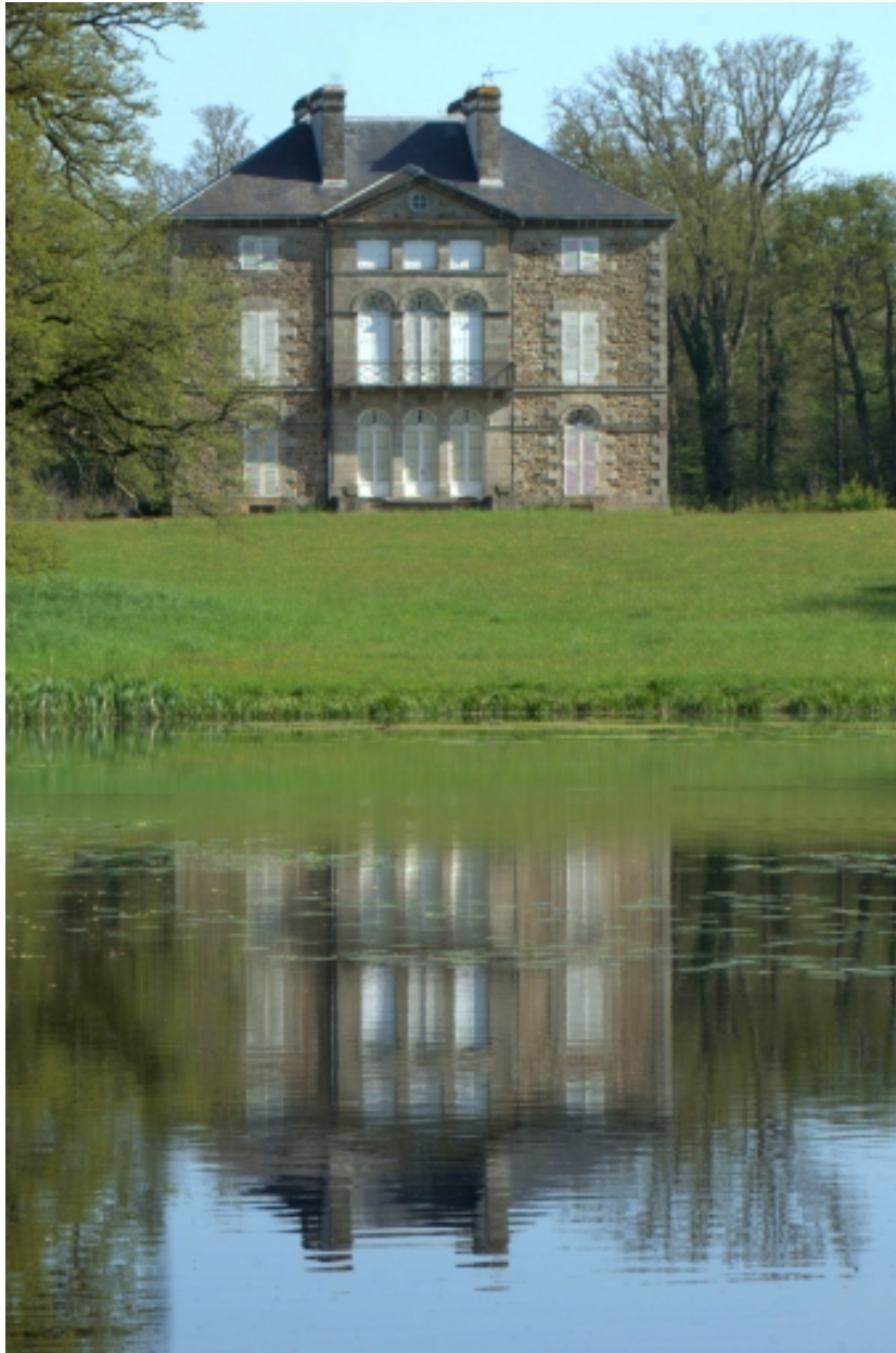
Château, vue générale sud