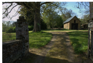
La ferme du château, remise en terre IVR53_20102202757NUCA