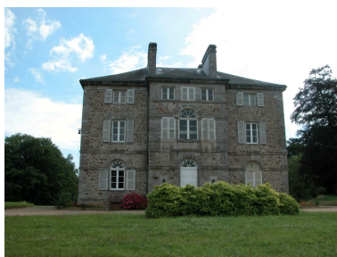
Château, façade nord IVR53_20092210841NUCA