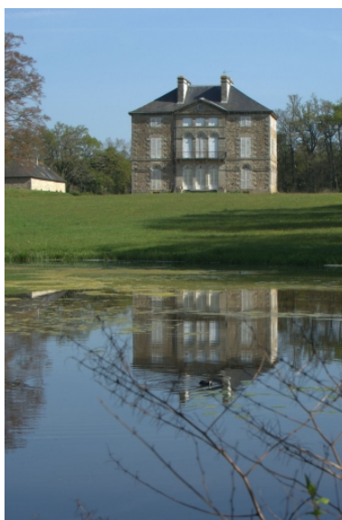
Château, étang et façade sud IVR53_20102202750NUCA