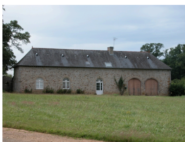
Communs, aile ouest IVR53_20092210857NUCA