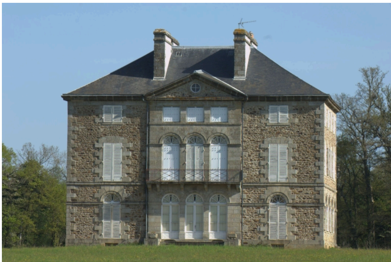
Château, vue rapprochée sud