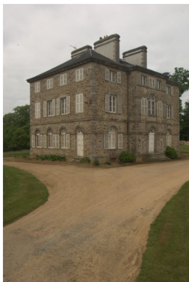
Château, façade nord IVR53_20102202793NUCA