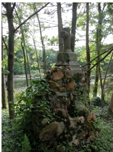
Parc, 2ème croix