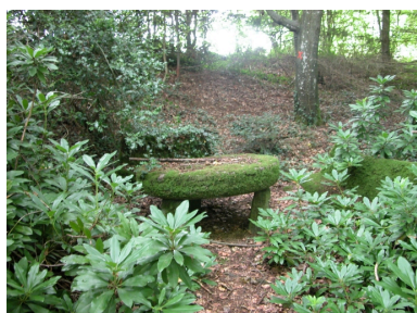
Parc, mobilier de jardin, remploi de meules de pressoir IVR53_20092210762NUCA