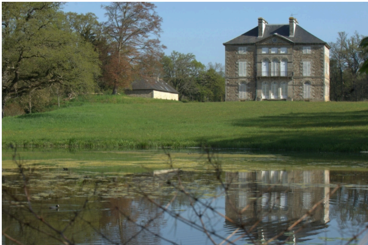
Château, vue générale sud