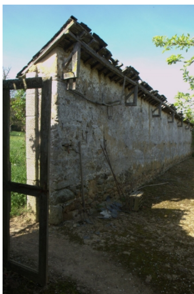
Clos du jardin potager IVR53_20102202760NUCA