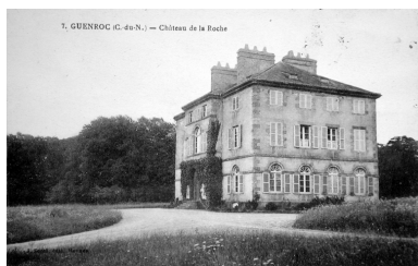
Château de la Roche, façade sur la cour, carte postale du début du