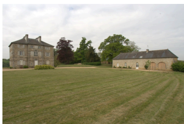
Château, façade nord et aile de communs IVR53_20102202795NUCA