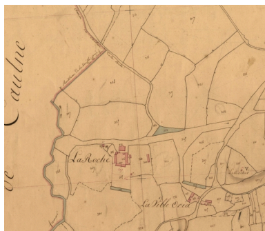
Extrait du cadastre de 1833, section A IVR53_20092210883NUCA