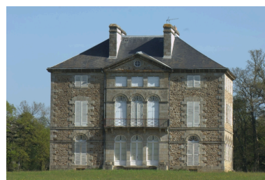
Château, vue rapprochée sud IVR53_20102202749NUCA