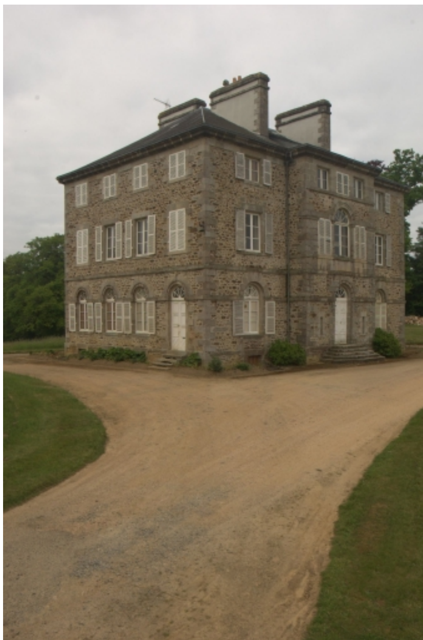
Château, façade nord