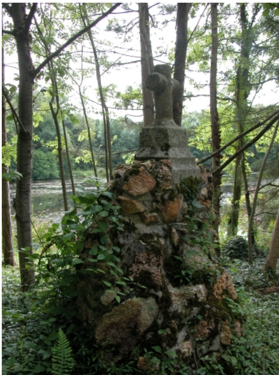
Parc, 2ème croix