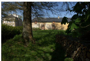
La Ferme du château IVR53_20102202756NUCA