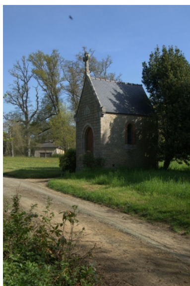
Chapelle IVR53_20102202754NUCA