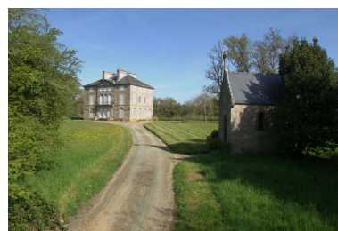
Chapelle située à l'est de l'étang IVR53_20102202753NUCA