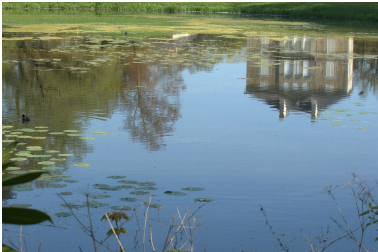
Reflet sur l'étang