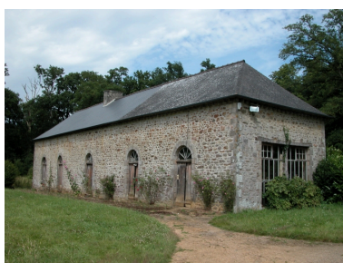
Communs, aile est