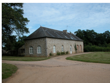
Communs, aile ouest IVR53_20092210783NUCA