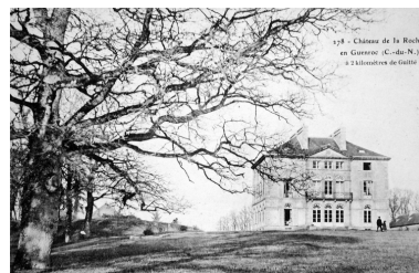
Château de la Roche, façade sur le parc, carte postale du début du 20e siècle IVR53_20042209062NUCB