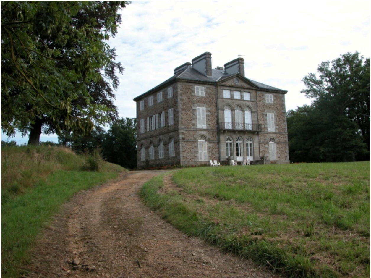
Château, vue générale sud