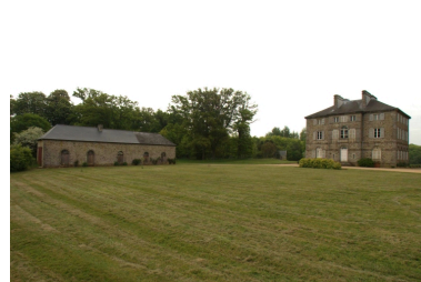
Château, façade nord et aile de communs