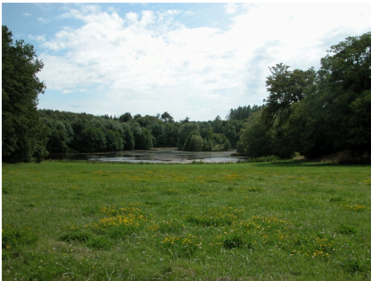
Le parc dessiné au 19e siècle