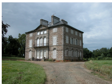
Château, façade sud IVR53_20092210859NUCA