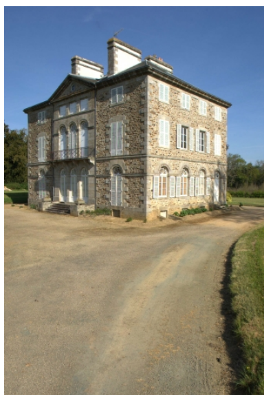
Château, vue de trois quart IVR53_20102202743NUCA