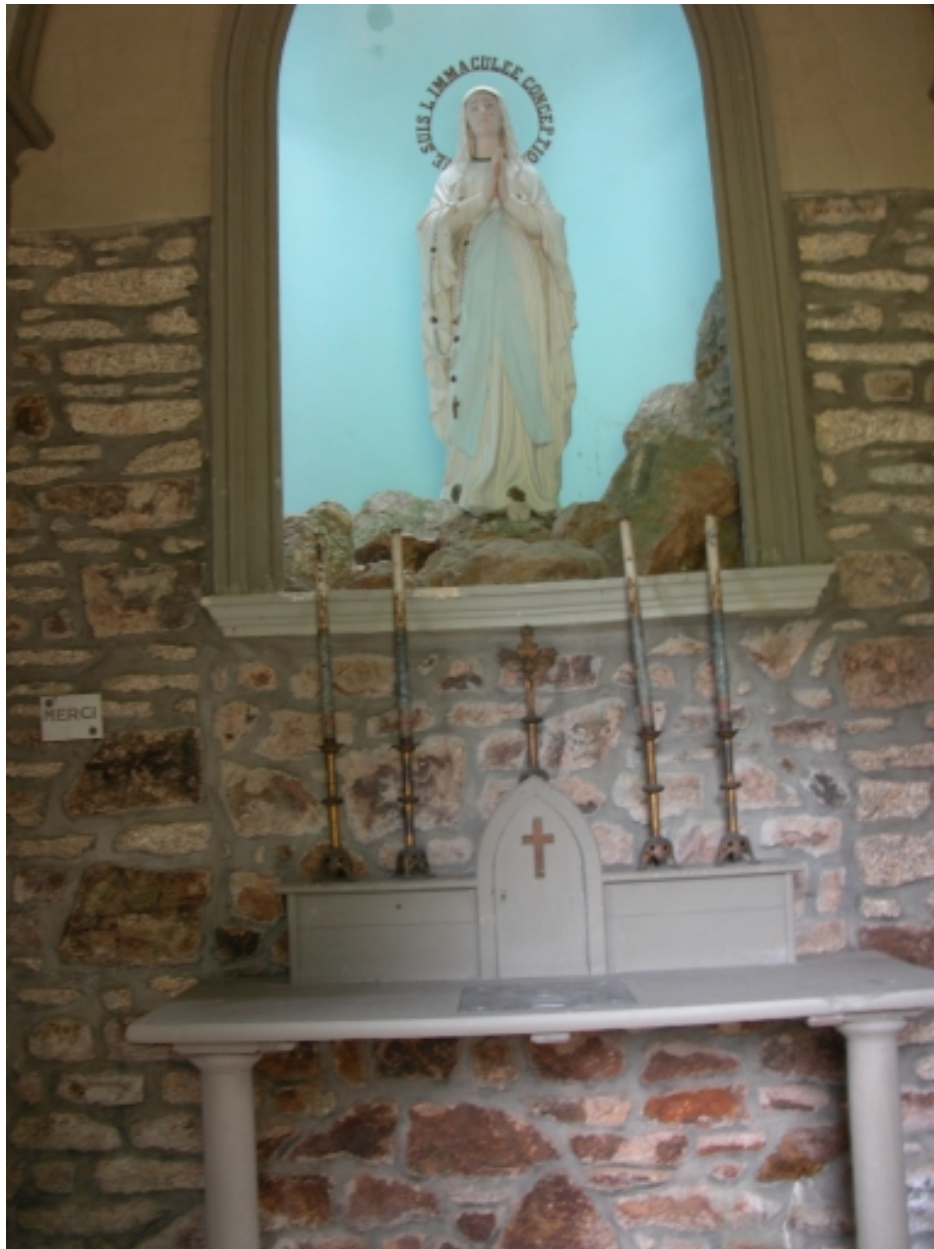
Chapelle, vue intérieure