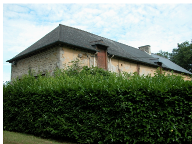
Ferme, le logis IVR53_20092210860NUCA