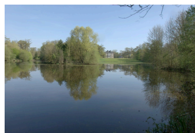
Etang IVR53_20102202744NUCA