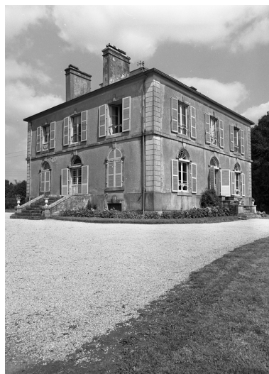
Vue générale depuis le sud-ouest IVR53_19775600776X