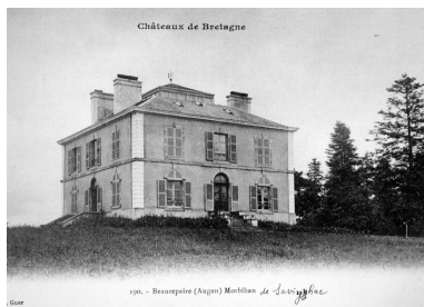
Vue générale IVR53_20045606250NUCB