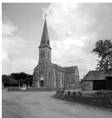
Vue générale prise du sud-ouest IVR53_19803500532V