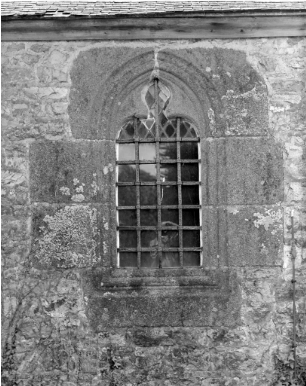
Baie n°1 réemployée dans la sacristie.