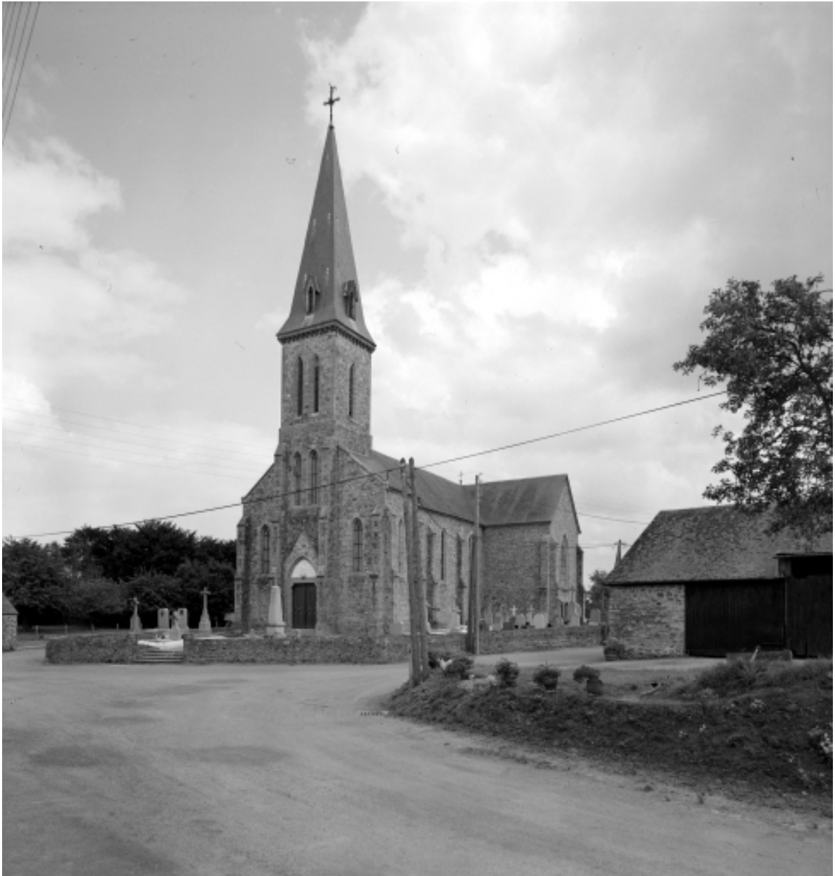
Vue générale prise du sud-ouest