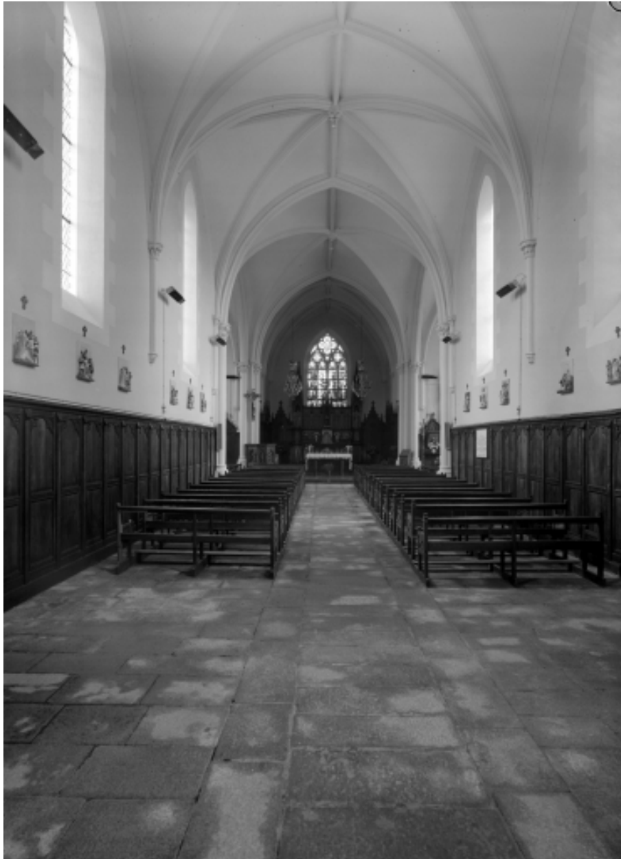
Nef vers l'est, vue générale.