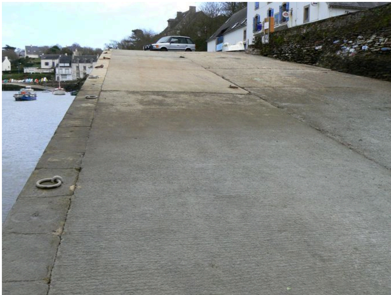
Cale du Quai Neuf