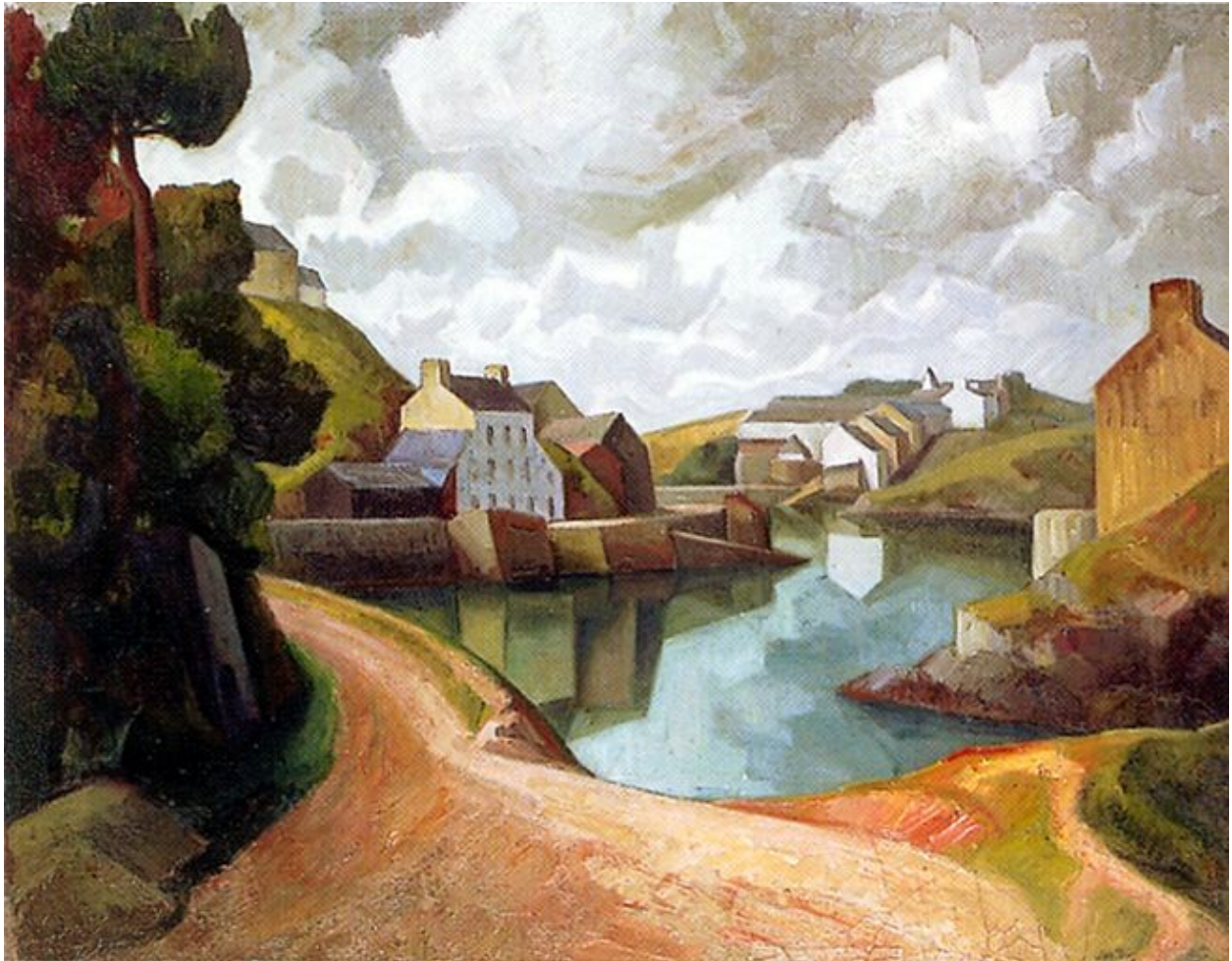
Peinture de Jules Leray, Le port de Doëlan, 1927