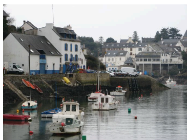
Quai Neuf vu de l'amont