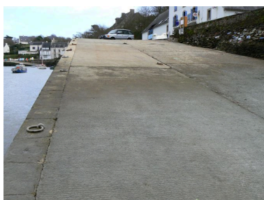
Cale du Quai Neuf IVR53_20092909040NUCA