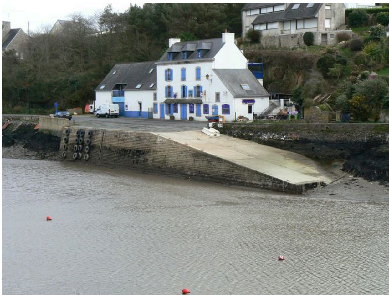
Vue générale du Quai Neuf de Doëlan