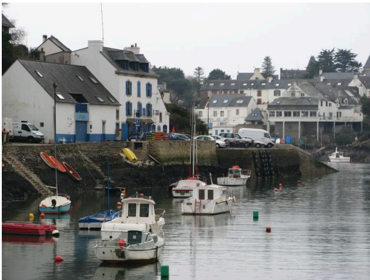
Quai Neuf vu de l'amont