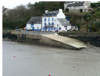
Vue générale du Quai Neuf de Doëlan IVR53_20082908596NUCA