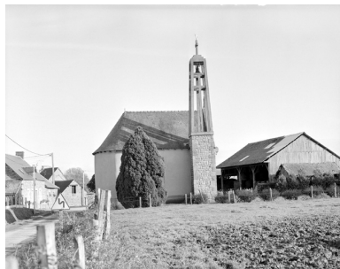
Vue générale IVR53_19923500968X