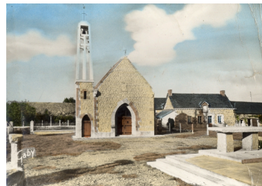
Carte postale IVR53_20043502716NUC