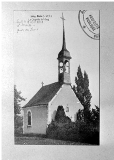
Carte postale IVR53_19933500192X