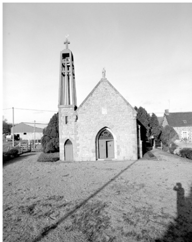
Vue générale IVR53_19923500969X