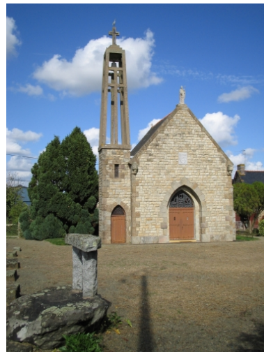
Vue générale sud IVR53_20043516247NUCA