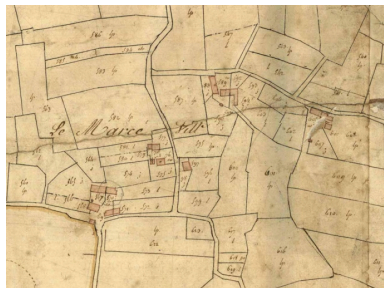
Cadastré de 1827 IVR53_20043516218NUC