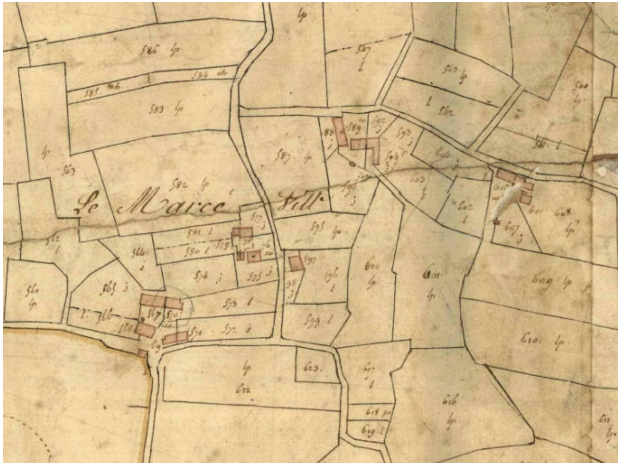
Cadastre de 1827