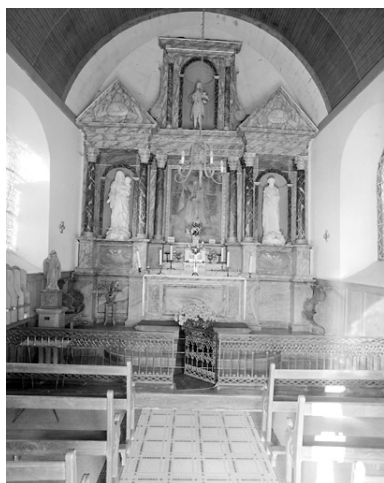
Vue intérieure