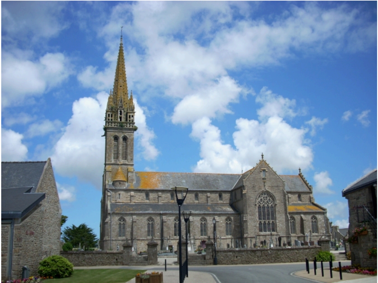
Plourin-Ploudalmézeau, église paroissiale : vue générale sud