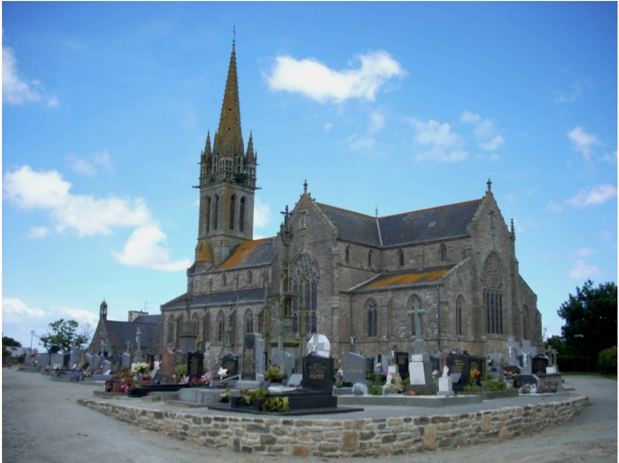
Plourin-Ploudalmézeau, église paroissiale : vue générale sud-est