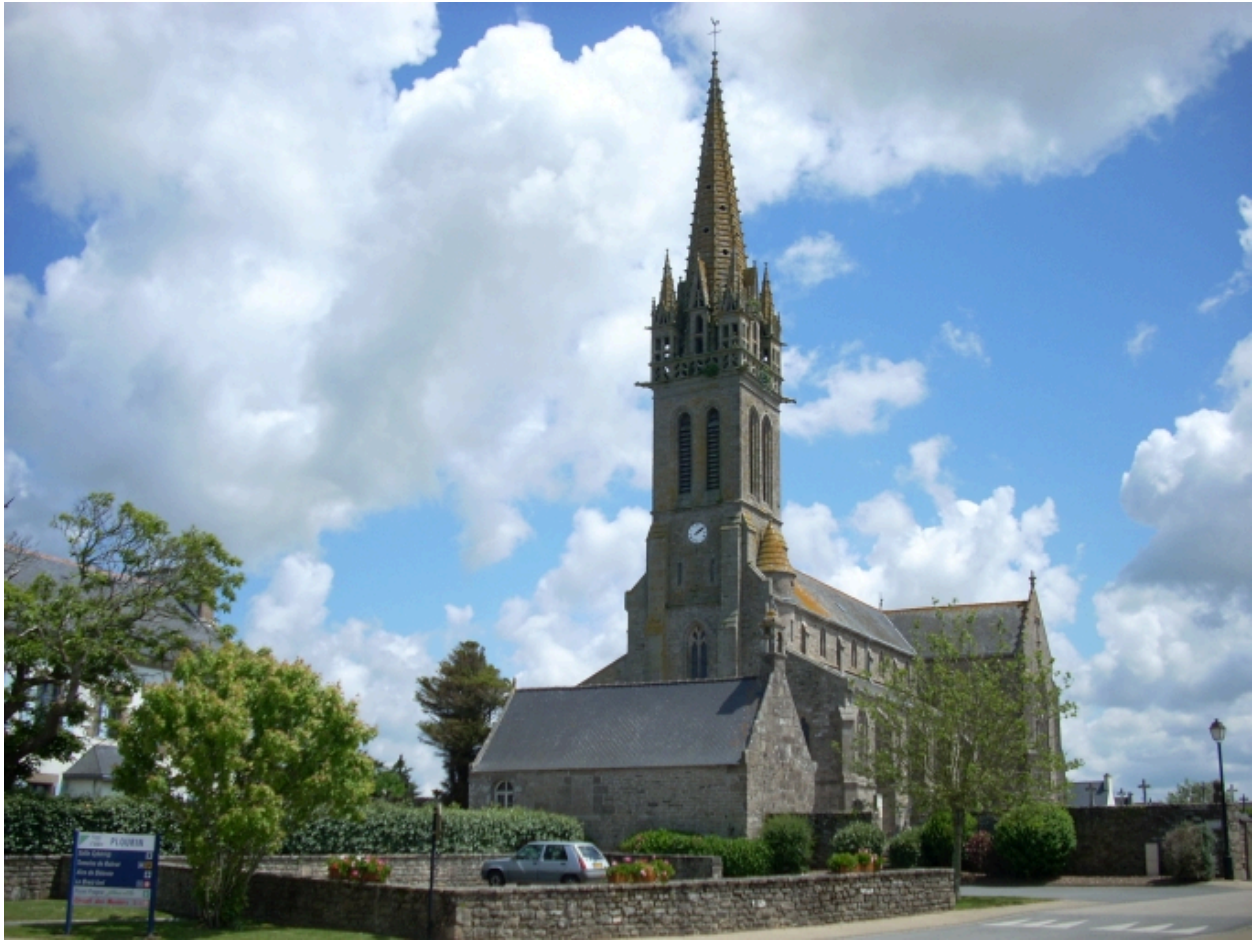
Plourin-Ploudalmézeau, église paroissiale : vue générale sud-ouest