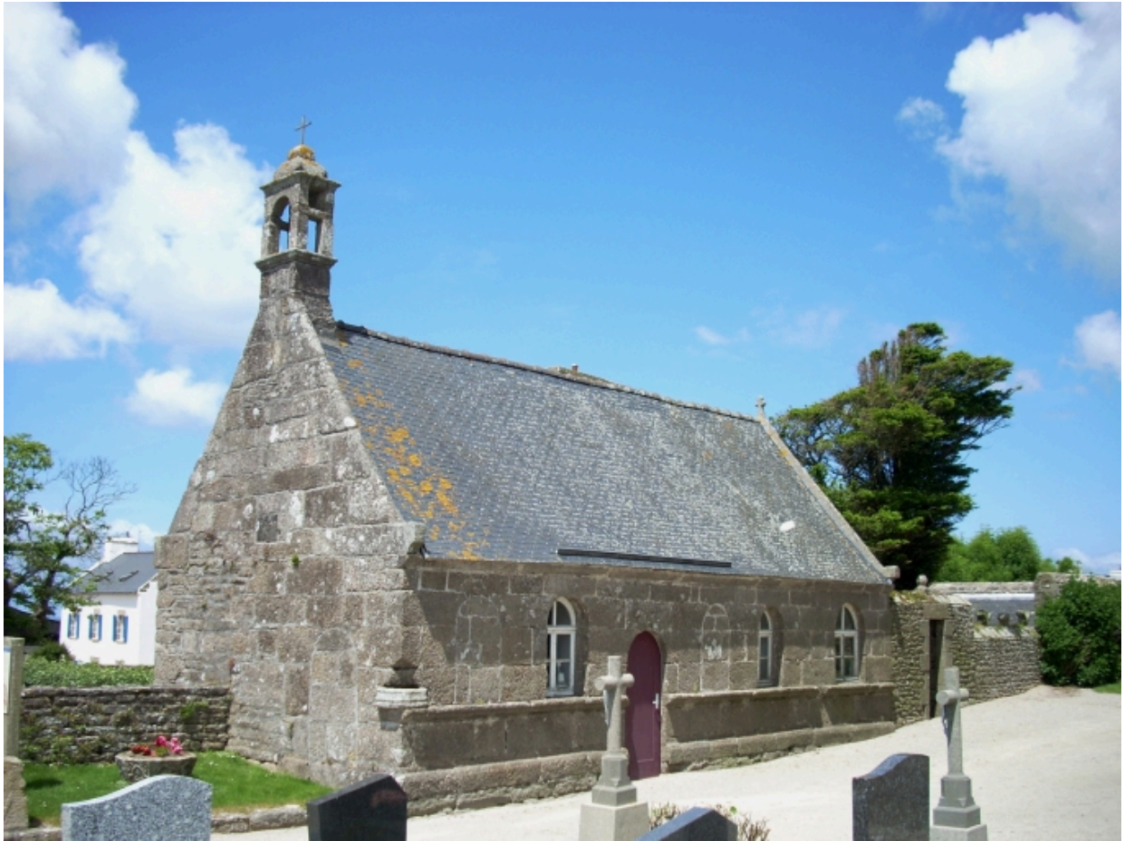
Plourin-Ploudalmézeau, église paroissiale : ossuaire, vue générale sud-est