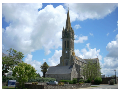
Plourin-Ploudalmézeau, église paroissiale : vue générale sud-ouest IVR53_20082906206NUCA