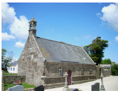
Plourin-Ploudalmézeau, église paroissiale : ossuaire, vue générale sud-est IVR53_20082906210NUCA