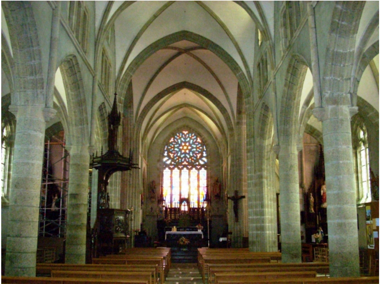
Plourin-Ploudalmézeau, église paroissiale : vue axiale est