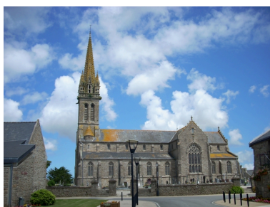
Plourin-Ploudalmézeau, église paroissiale : vue générale sud IVR53_20082906207NUCA