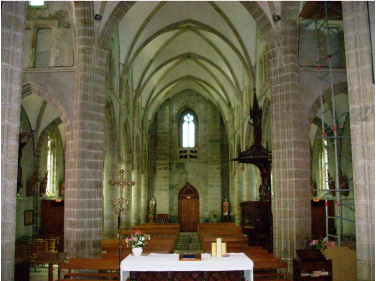
Plourin-Ploudalmézeau, église paroissiale : vue axiale ouest