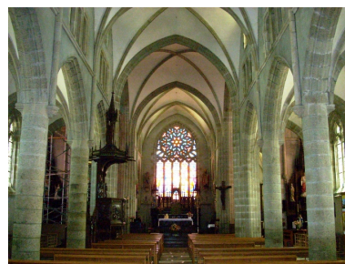
Plourin-Ploudalmézeau, église paroissiale : vue axiale est IVR53_20082906211NUCA