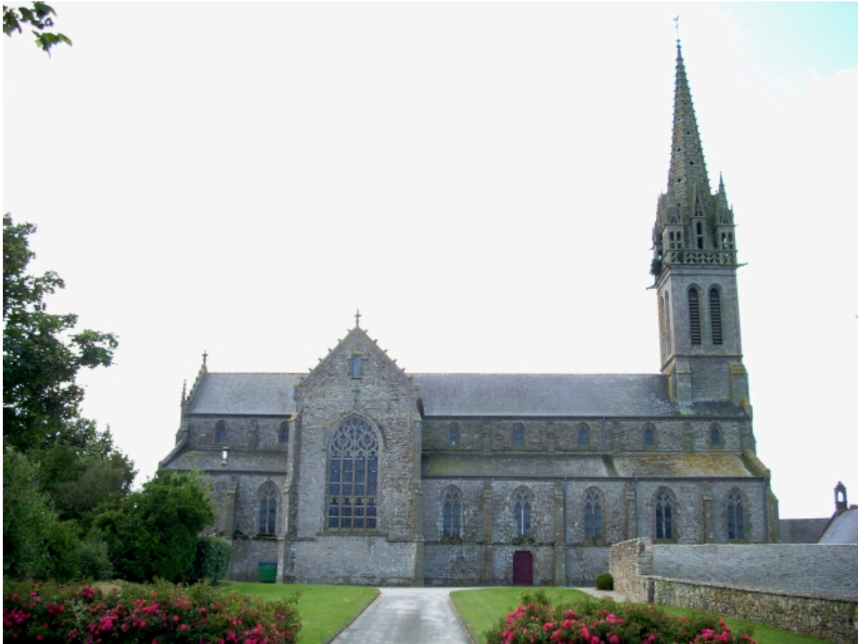
Plourin-Ploudalmézeau, église paroissiale : élévation nord