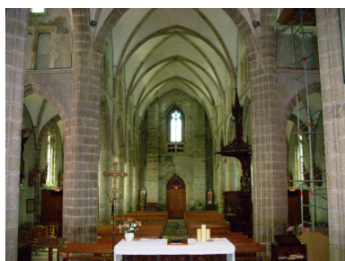
Plourin-Ploudalmézeau, église paroissiale : vue axiale ouest