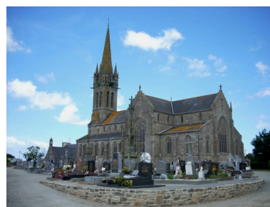
Plourin-Ploudalmézeau, église paroissiale : vue générale sud-est