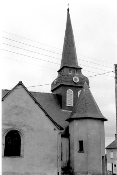
Vue générale du clocher IVR53_19753500865X