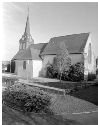
Elévation sud-est : vue générale