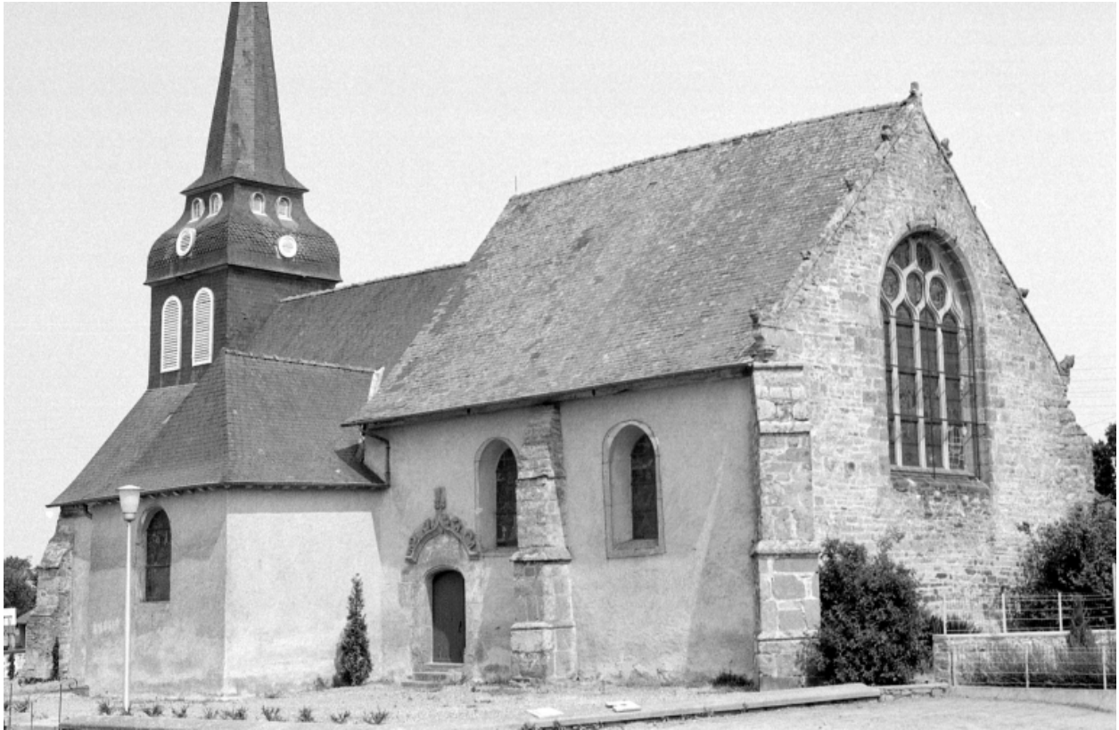
Vue de l'église en 1975