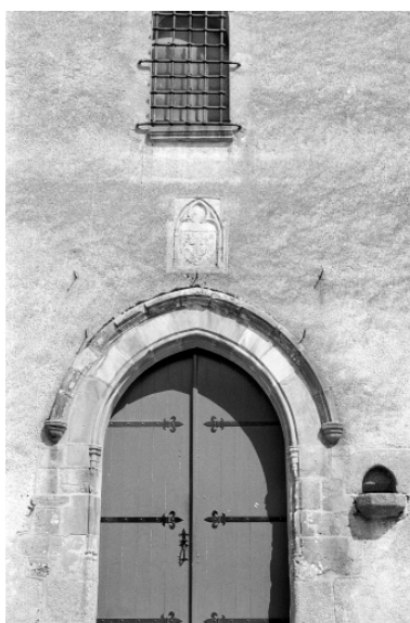
Porte surmontée d'un blason