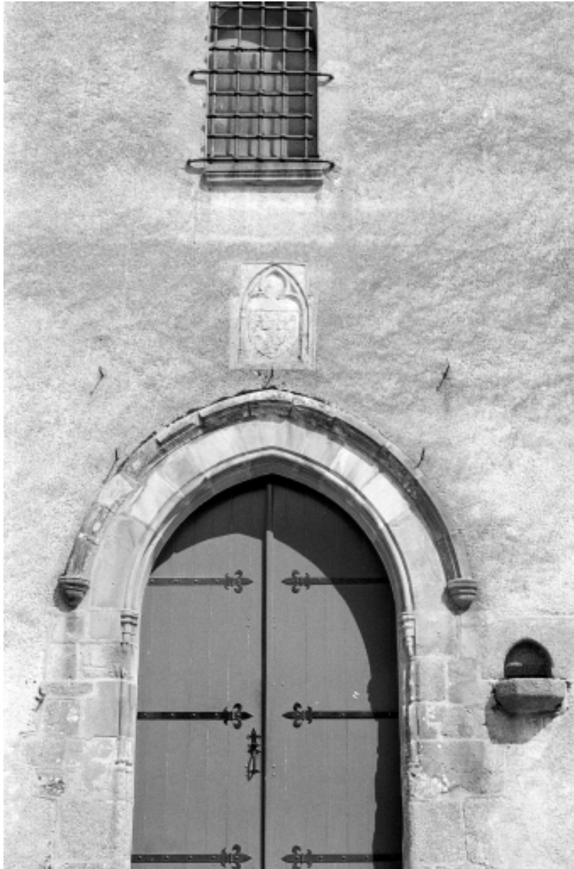
Porte surmontée d'un blason