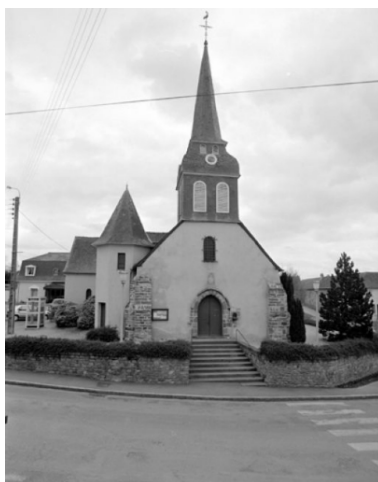
Elévation ouest : vue générale IVR53_19943500832X