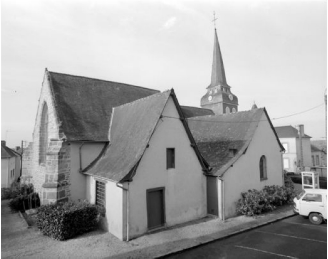
Elévation nord-est : vue générale