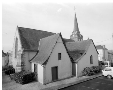
Elévation nord-est : vue générale IVR53_19943500769X