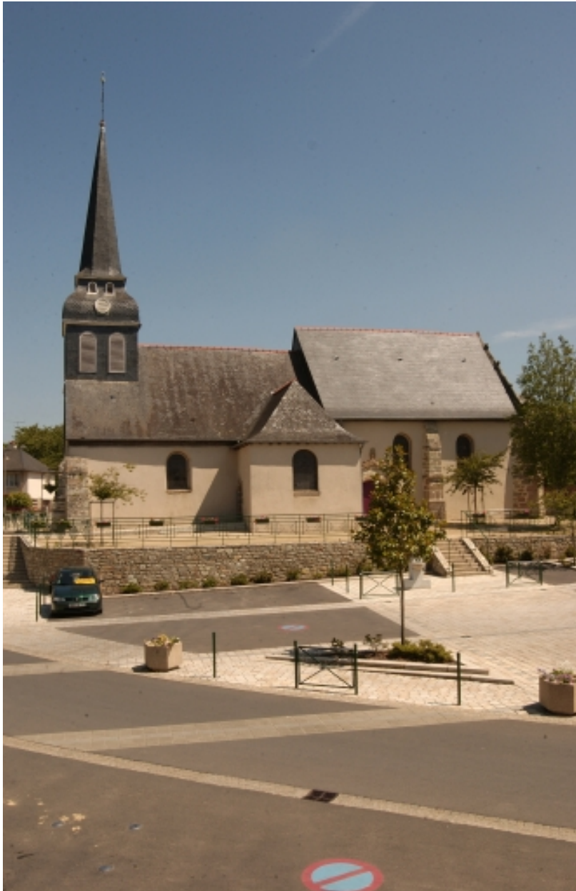
Elévation sud : vue générale