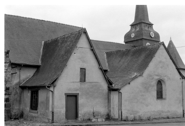
Vue nord IVR53_19753500863X