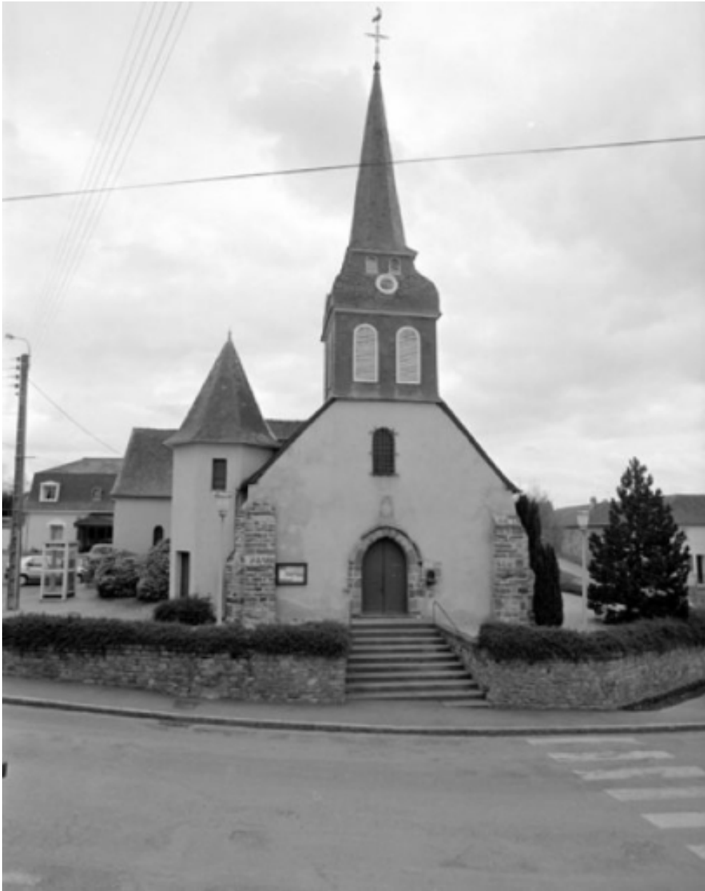
Elévation ouest : vue générale