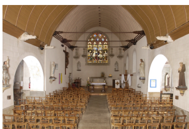
Vue intérieure prise de la nef vers le chœur IVR53_20053501233NUCA