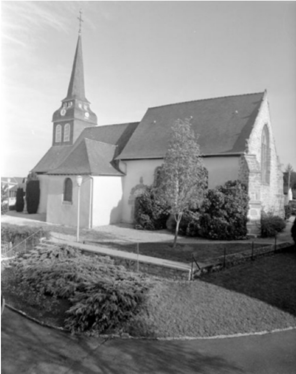
Elévation sud-est : vue générale