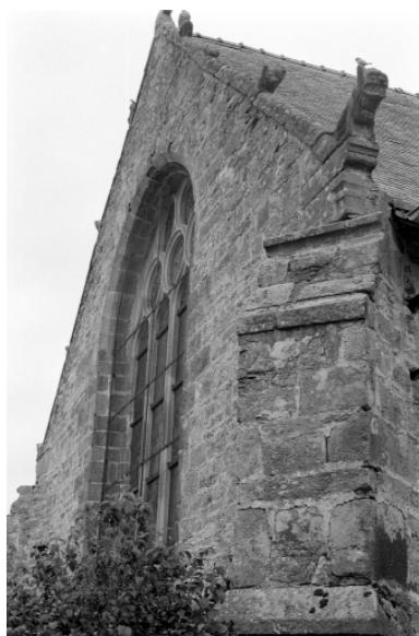
Vue nord-est IVR53_19753500864X