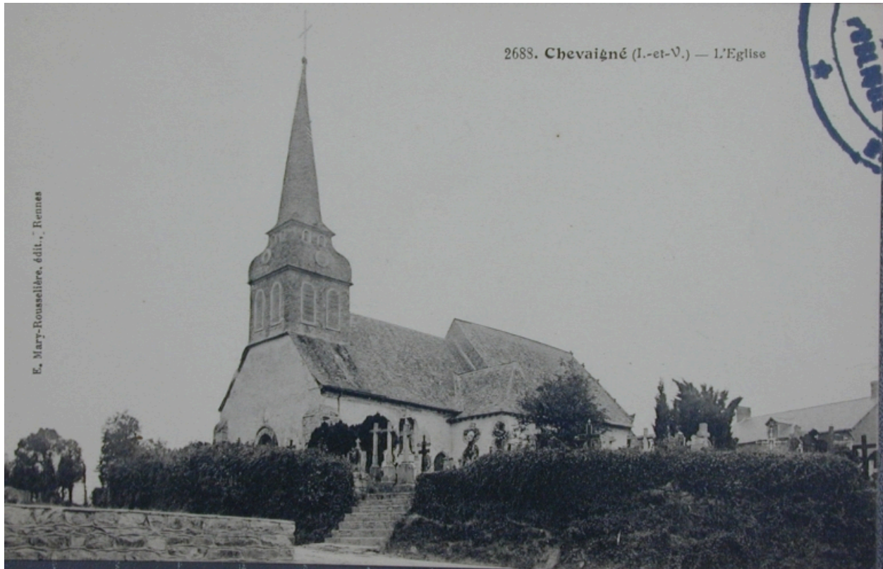
L'église sur une carte postale ancienne