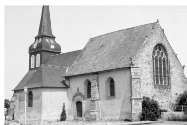
Vue de l'église en 1975