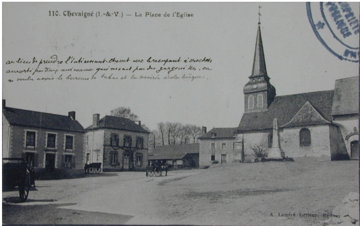
La place de l'église en 1923