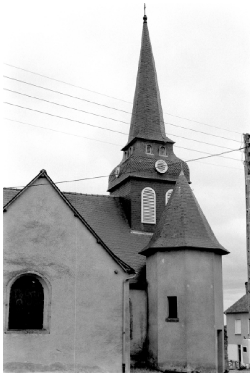
Vue générale du clocher