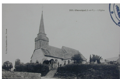
L'église sur une carte postale ancienne