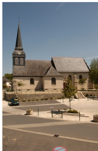
Elévation sud : vue générale IVR53_20053501901NUCA