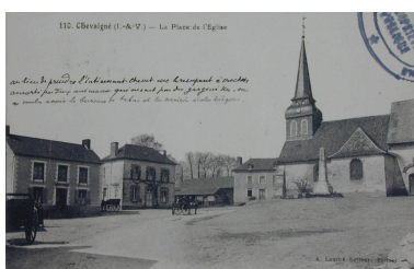
La place de l'église en 1923