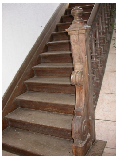
L'escalier central