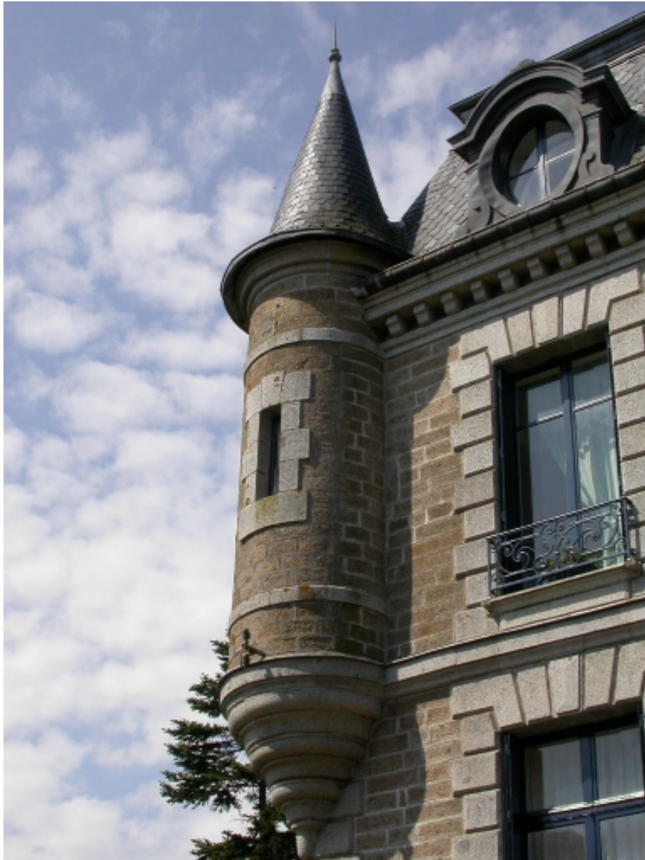
Détail de l'une des échauguettes