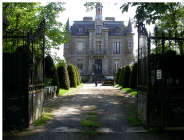
Vue générale ouest IVR53_20053507808NUCA