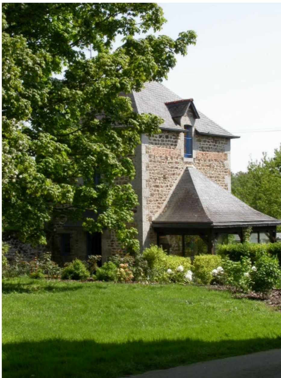
Bâtiment situé au nord-est du château