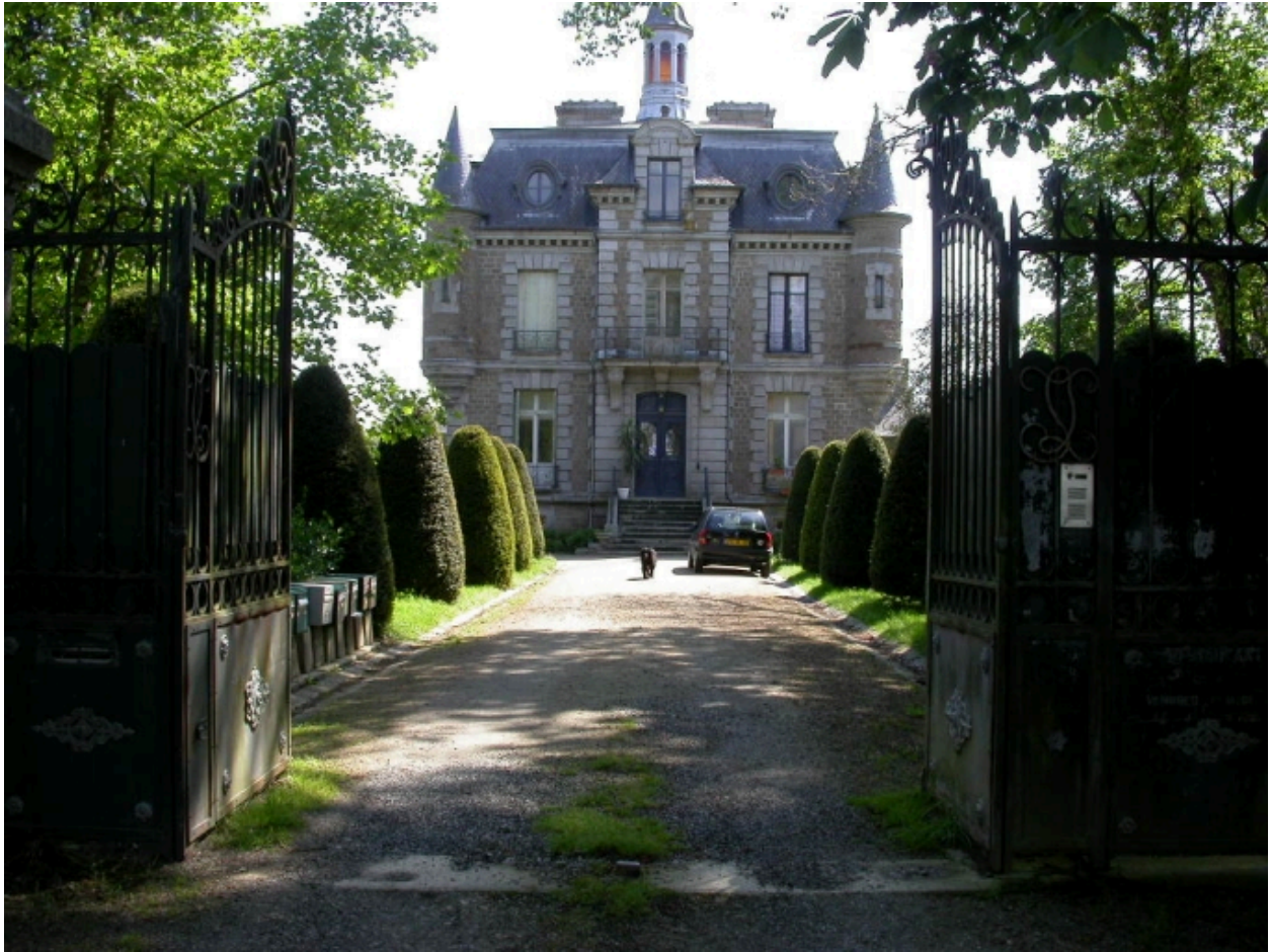
Vue générale ouest