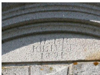
Détail de l'inscription de la lucarne est