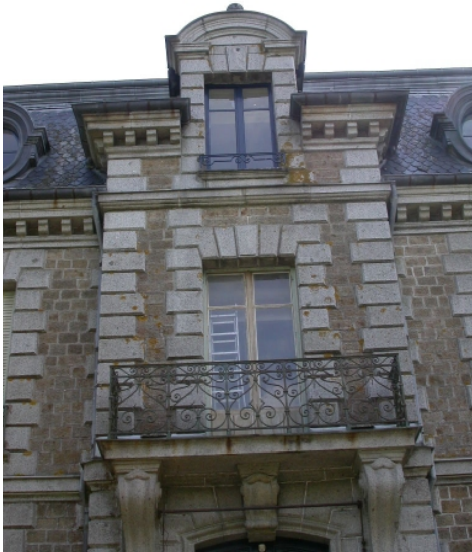
Partie supérieure de la travée centrale