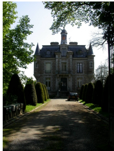
Vue ouest