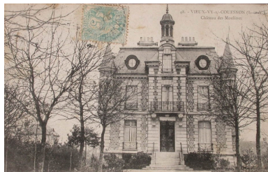
Le château sur une carte postale du début du 20e siècle