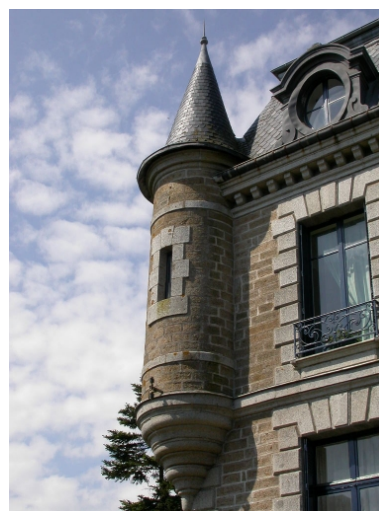
Détail de l'une des échauguettes IVR53_20053507812NUCA