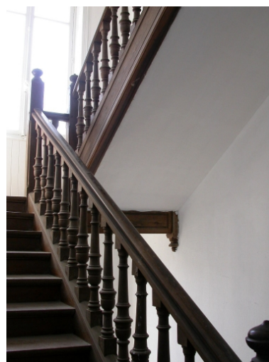
L'escalier à balustrés