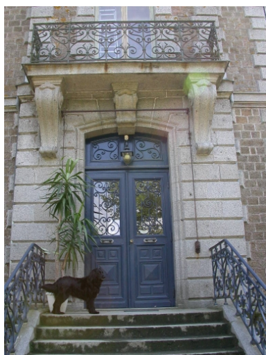
Détail de la porte