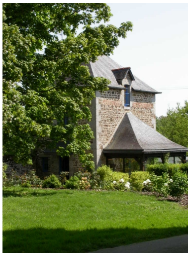
Bâtiment situé au nord-est du château IVR53_20053507816NUCA