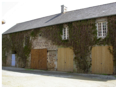
Anciennes écuries ? IVR53_20053507817NUCA