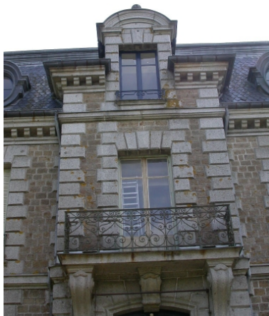
Partie supérieure de la travée centrale IVR53_20053507811NUCA