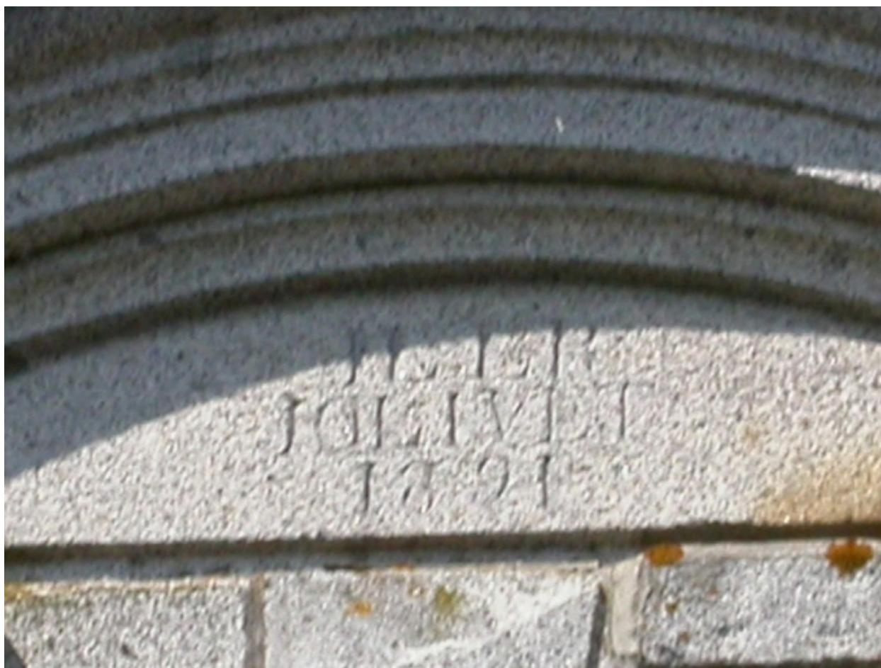
Détail de l'inscription de la lucarne est