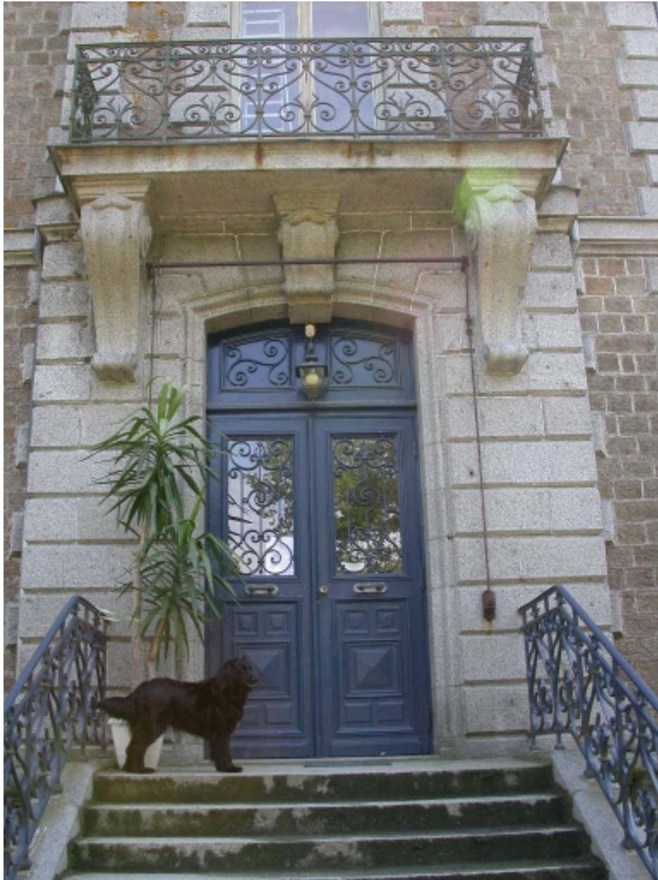
Détail de la porte