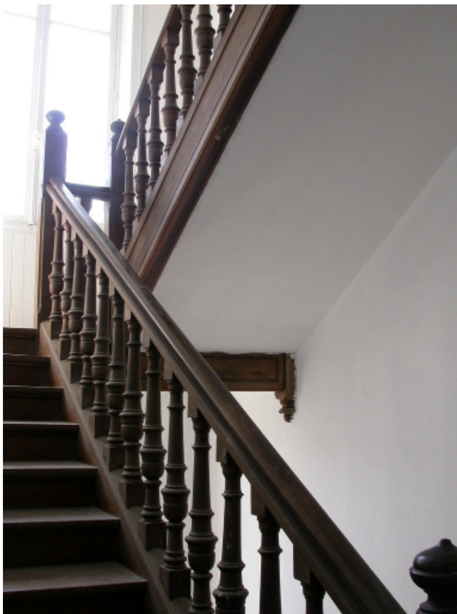
L'escalier à balustres