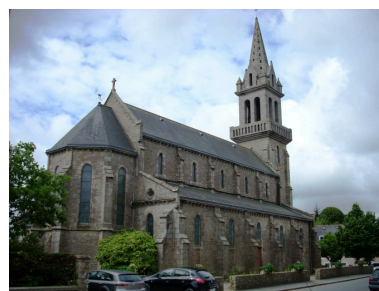
Bohars, église paroissiale : vue générale nord-est IVR53_20082906383NUCA