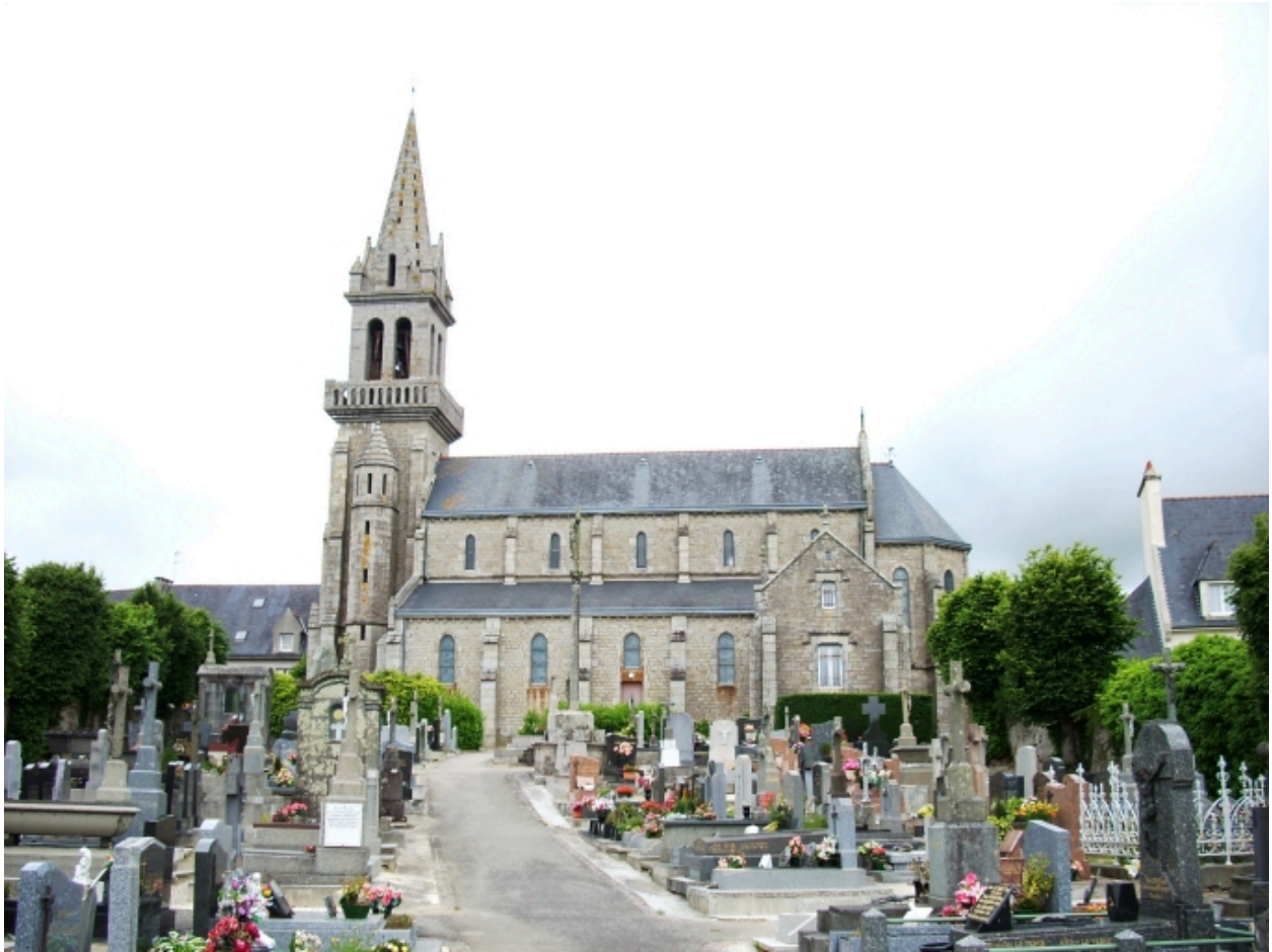
Bohars, église paroissiale : vue générale sud