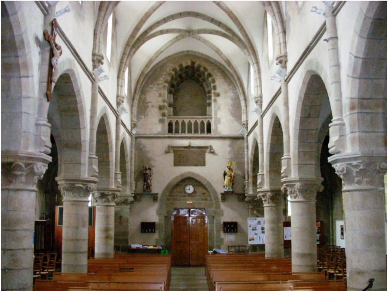
Bohars, église paroissiale : vue axiale ouest