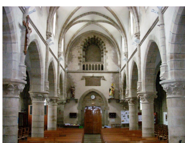
Bohars, église paroissiale : vue axiale ouest IVR53_20082906385NUCA