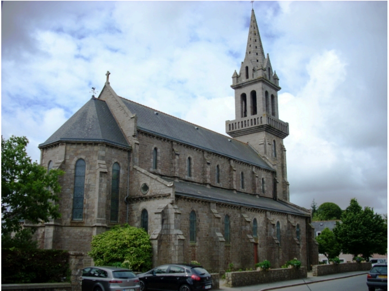
Bohars, église paroissiale : vue générale nord-est