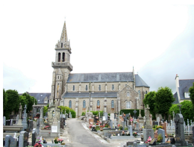
Bohars, église paroissiale : vue générale sud IVR53_20082906381NUCA