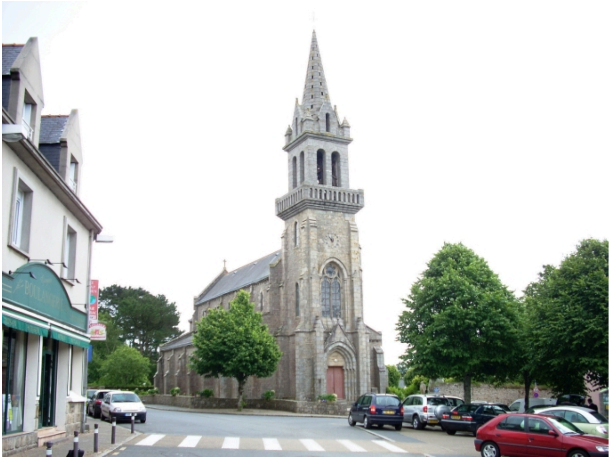
Bohars, église paroissiale : vue générale nord-ouest