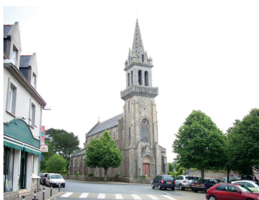
Bohars, église paroissiale : vue générale nord-ouest IVR53_20082906382NUCA