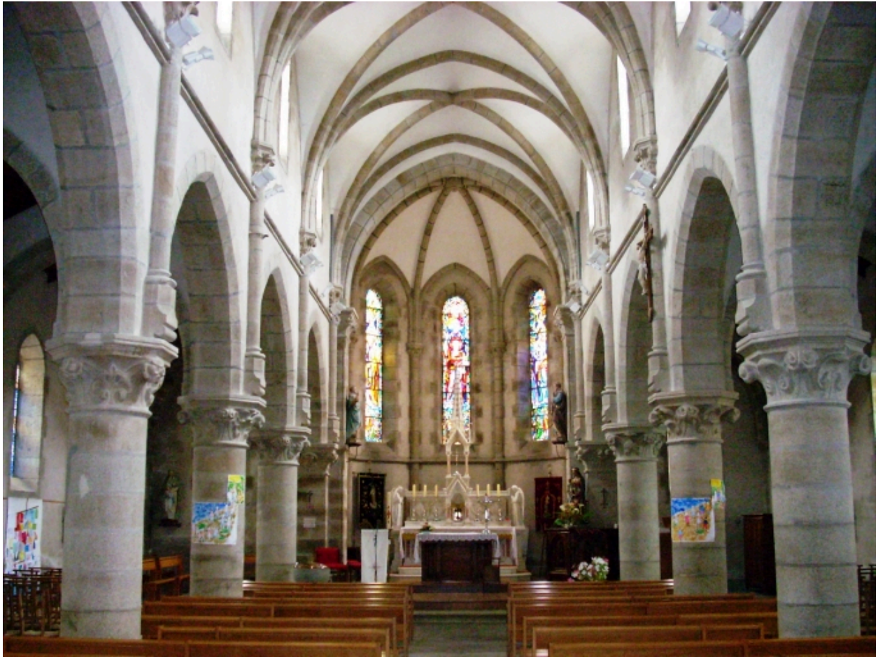
Bohars, église paroissiale : vue axiale est