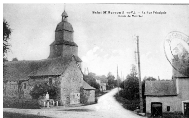
Elévation Nord de l'ancienne église (Carte postale ancienne, AD35 : 6Fi)