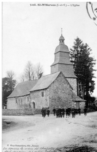
Elévation Nord de l'ancienne église (Carte postale ancienne, AD35 : 6Fi)