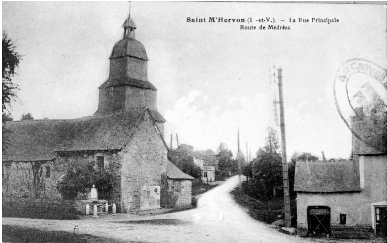
Elévation Nord de l'ancienne église (Carte postale ancienne, AD35 : 6Fi)