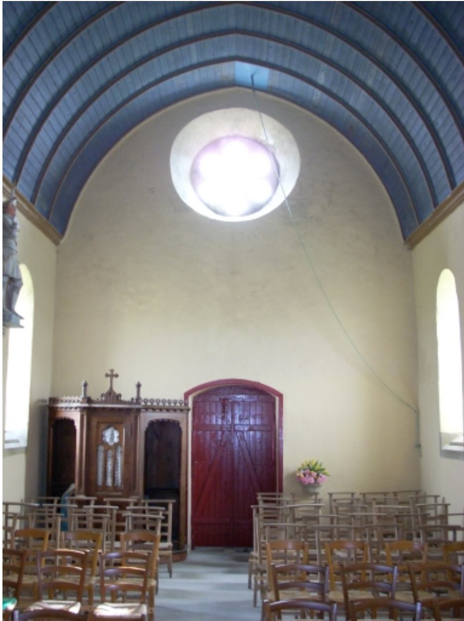
Tréguennec, chapelle Saint-Alour : vue axiale ouest