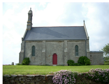
Tréguennec, chapelle Saint-Alour : élévation sud IVR53_20082905916NUCA