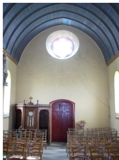
Tréguennec, chapelle Saint- Alour : vue axiale ouest IVR53_20082905919NUCA