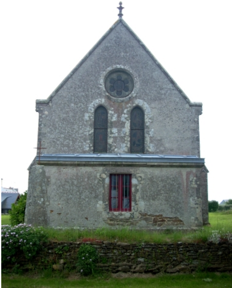
Tréguennec, chapelle Saint-Alour : élévation est