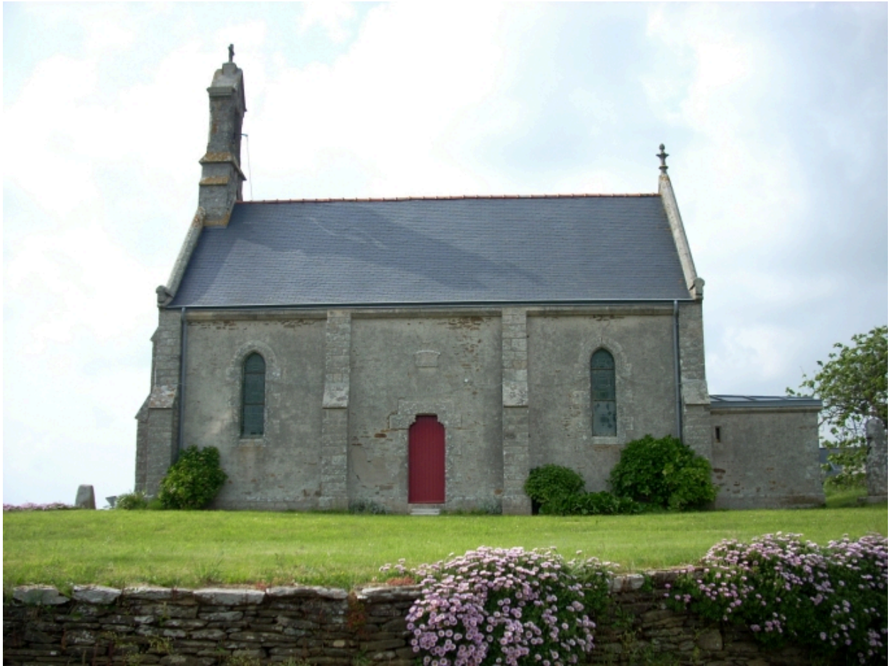
Tréguennec, chapelle Saint-Alour : élévation sud