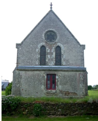
Tréguennec, chapelle Saint-Alour : élévation est IVR53_20082905917NUCA