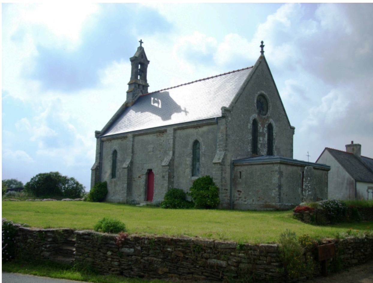
Tréguennec, chapelle Saint-Alour : vue générale sud-est