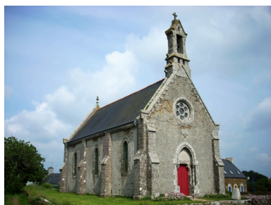
Tréguennec, chapelle Saint-Alour : vue générale nord-ouest IVR53_20082905914NUCA