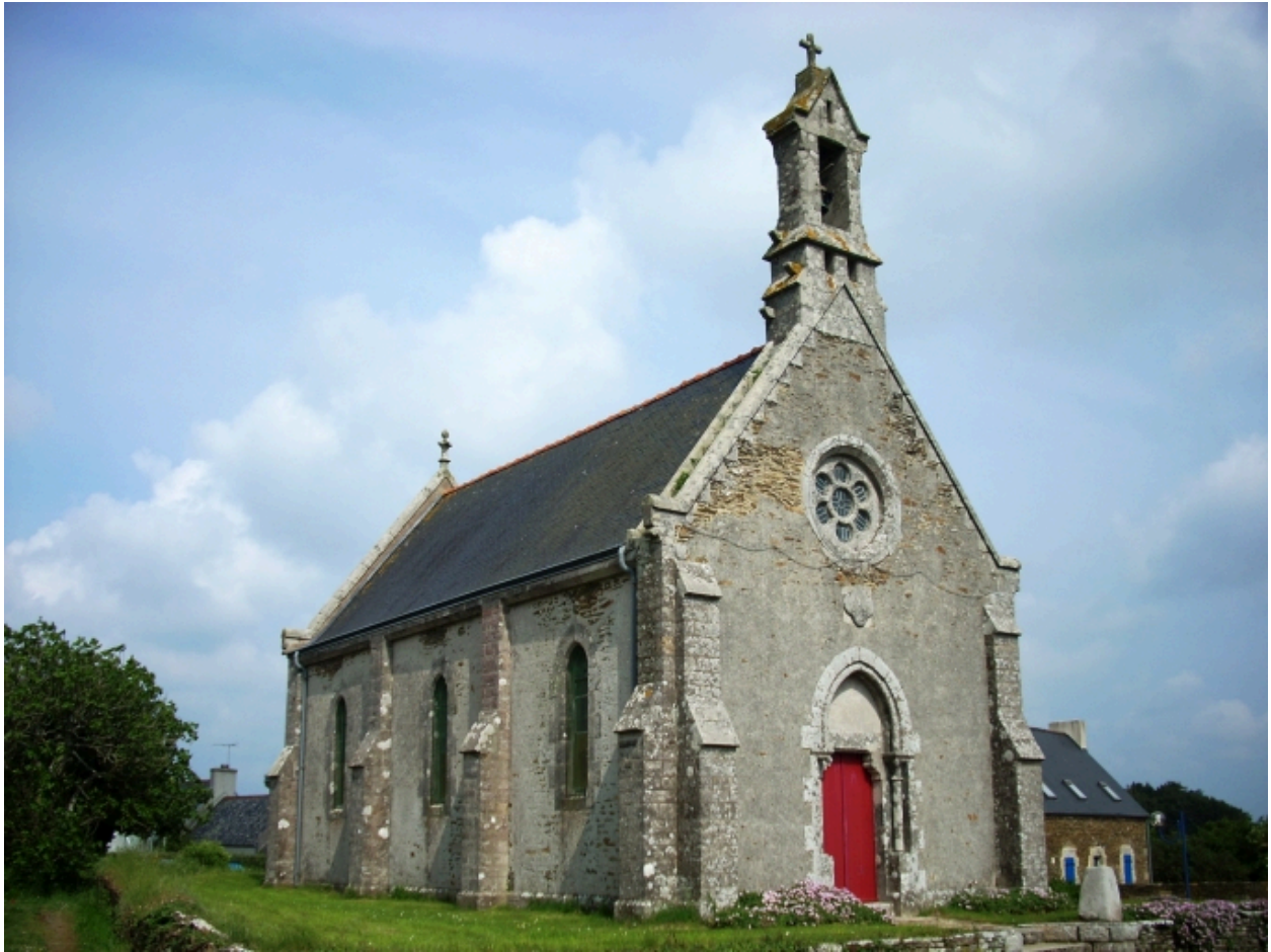
Tréguennec, chapelle Saint-Alour : vue générale nord-ouest