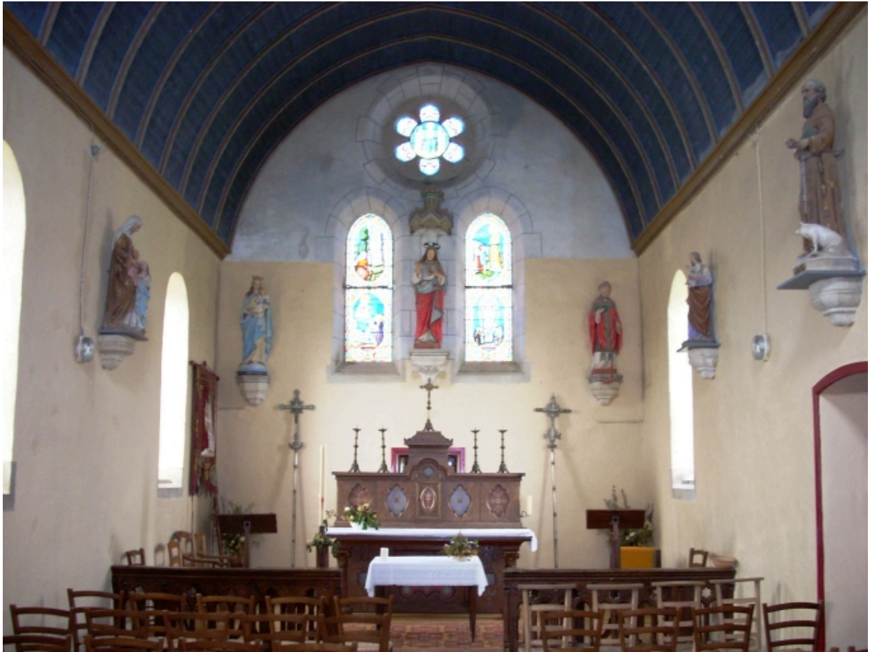
Tréguennec, chapelle Saint-Alour : vue axiale est