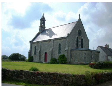
Tréguennec, chapelle Saint-Alour : vue générale sud-est