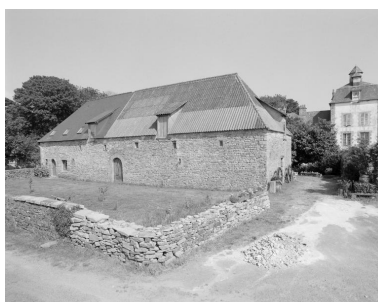
Communs est, vue nord-ouest. IVR53_19945600930X