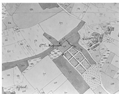
Plan cadastral de 1809, section B2.

IVR53_19935600191X