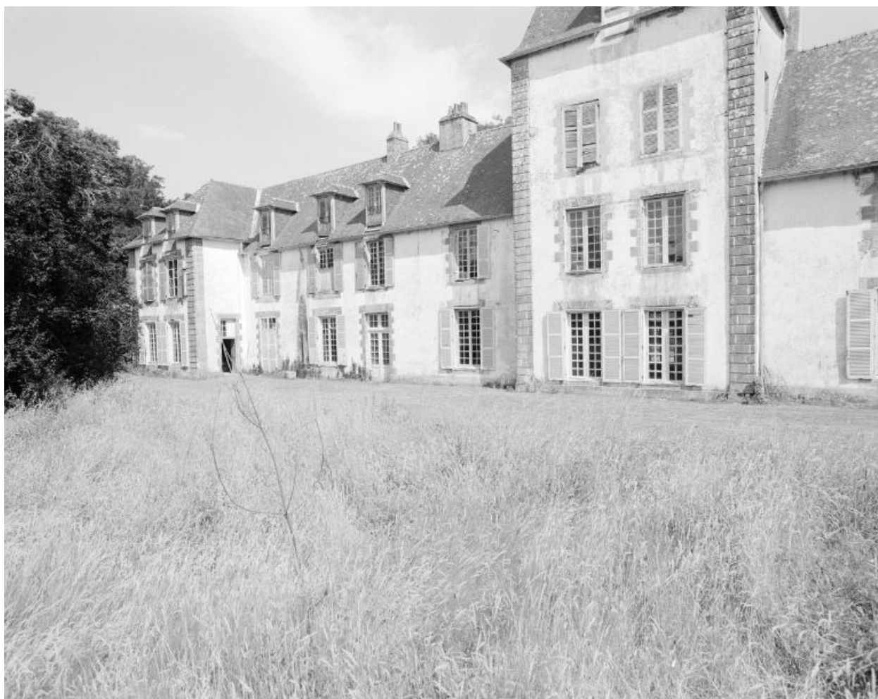
Elévation nord, partie est.