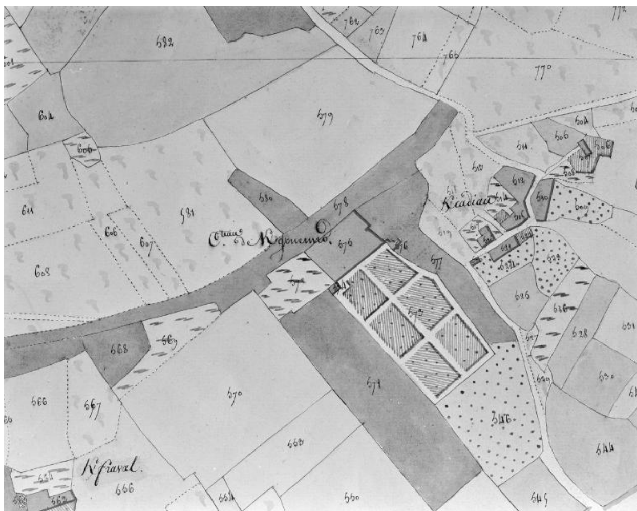
Plan cadastral de 1809, section B2.