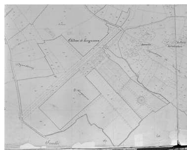
Plan cadastral 1852, section B3.

IVR53_19935600406XA