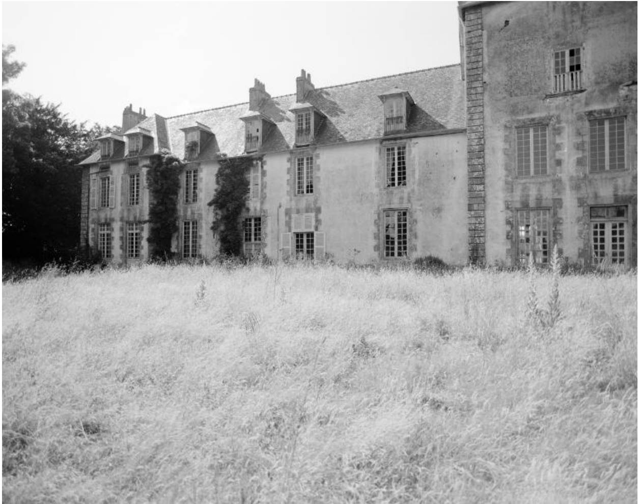
Elévation sud, aile ouest, vue sud-est.