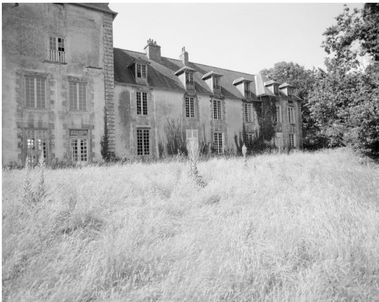
Elévation sud, aile est, vue sud-ouest