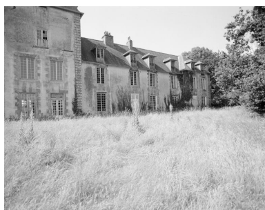
Elévation sud, aile est, vue sud-ouest IVR53_19945600933X