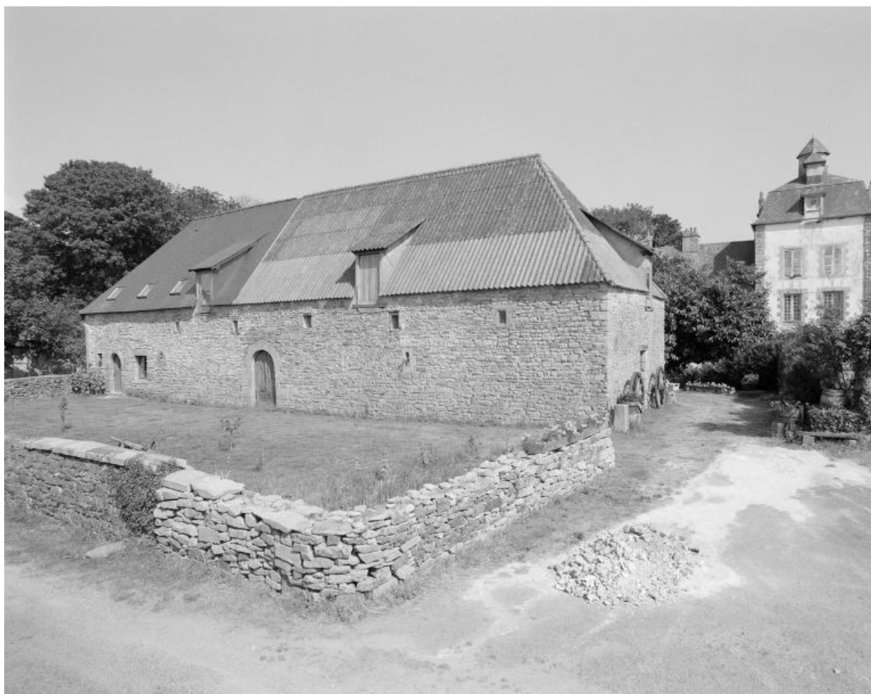
Communs est, vue nord-ouest.