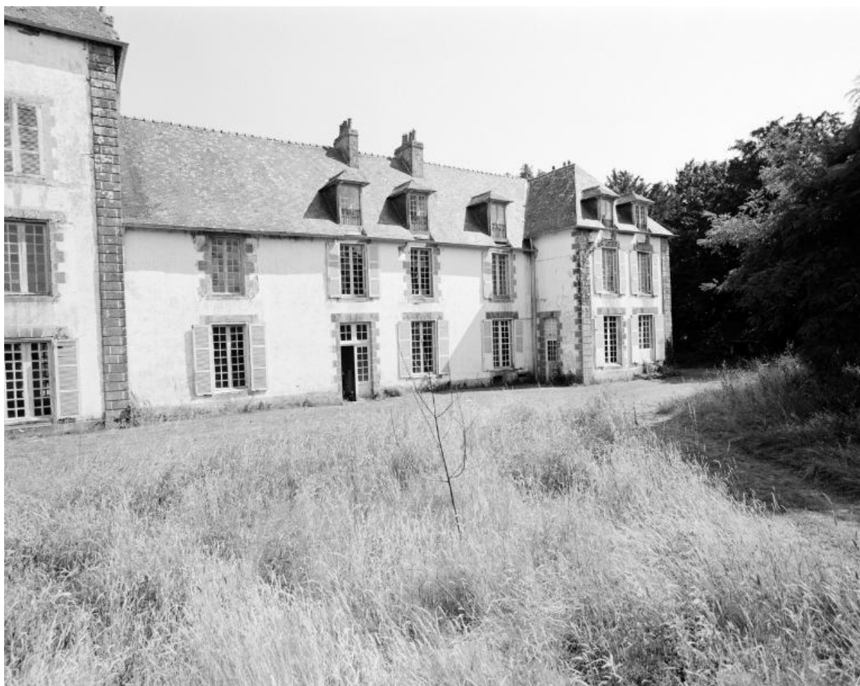
Elévation nord, partie est