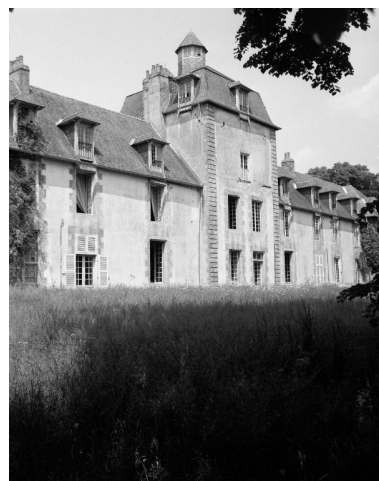
Elévation sud, partie centrale, vue prise de l'ouest.