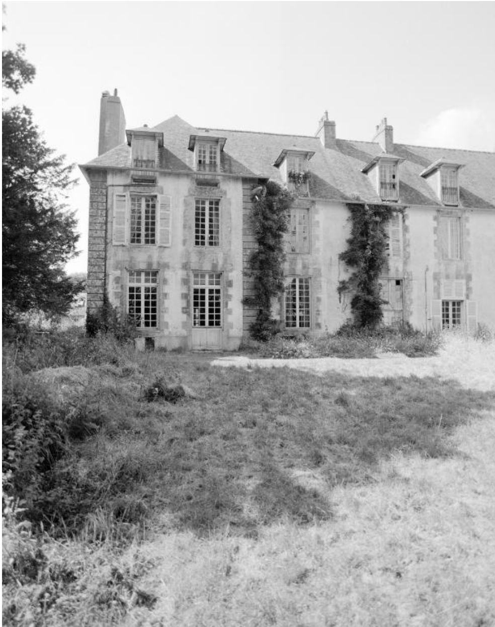
Elévation sud, aile ouest, pavillon ouest.