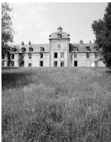
Elévation sud, partie centrale. IVR53_19925600939X