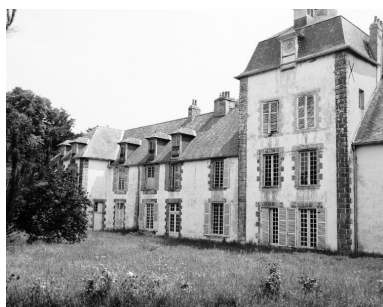
Elévation nord, partie est. IVR53_19925600936X