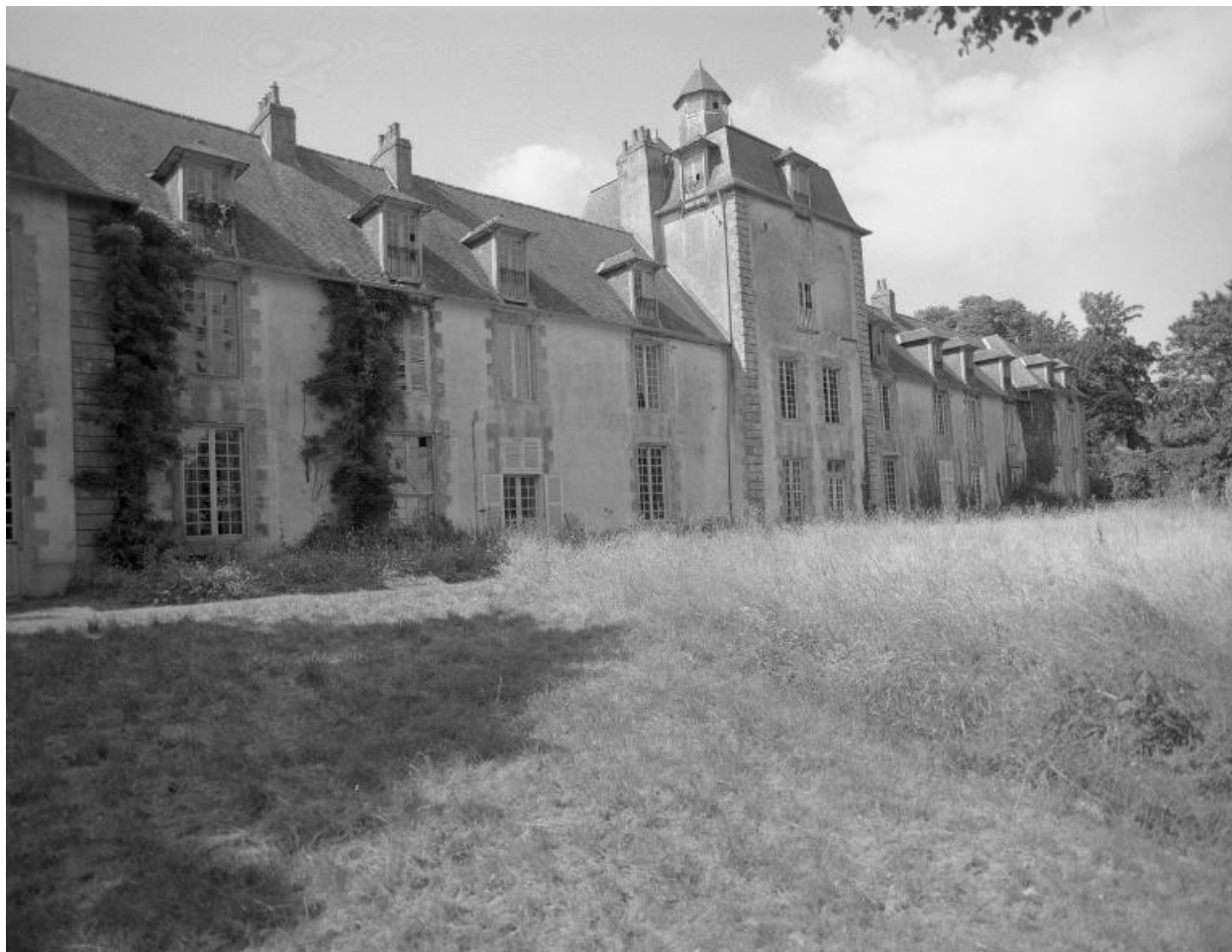
Elévation sud, vue prise de l'ouest