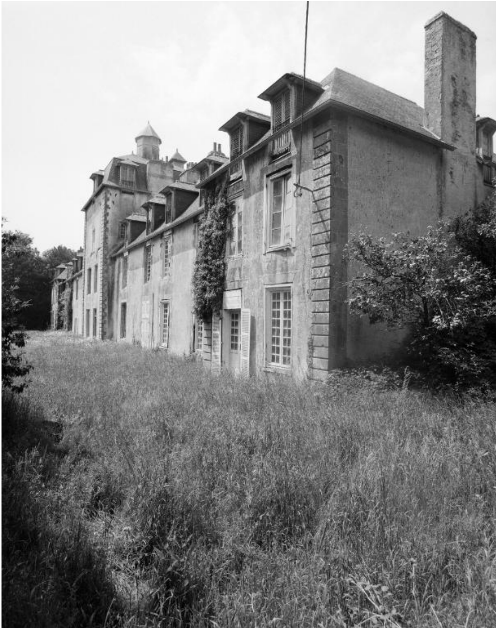
Elévation sud, aile est, pavillon est, vue nord-est.