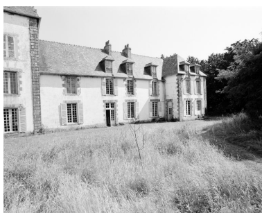
Elévation nord, partie est