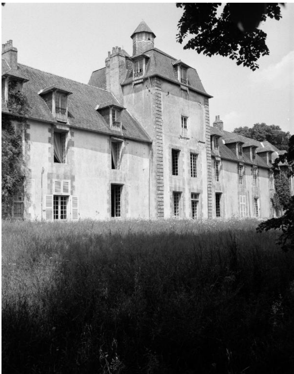
Elévation sud, partie centrale, vue prise de l'ouest.