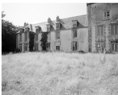
Elévation sud, aile ouest, vue sud-est. IVR53_19945600932X