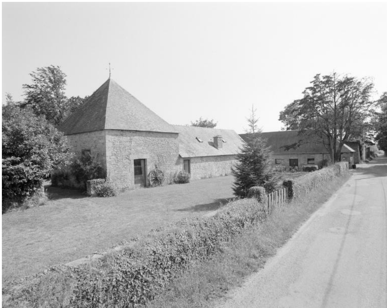
Communs ouest, vue nord-est.