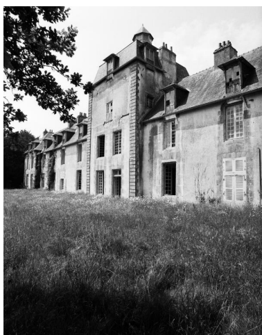
Elévation sud, partie centrale, vue prise de l'est. IVR53_19925600938X