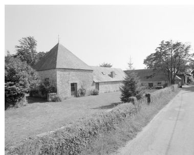
Communs ouest, vue nord-est. IVR53_19945600931X