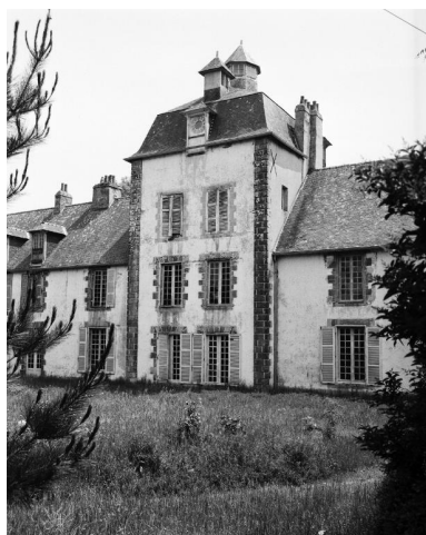
Elévation nord, pavillon central, vue prise de l'ouest. IVR53_19925600935X