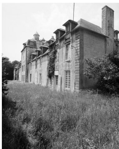
Elévation sud, aile est, pavillon est, vue nord-est.