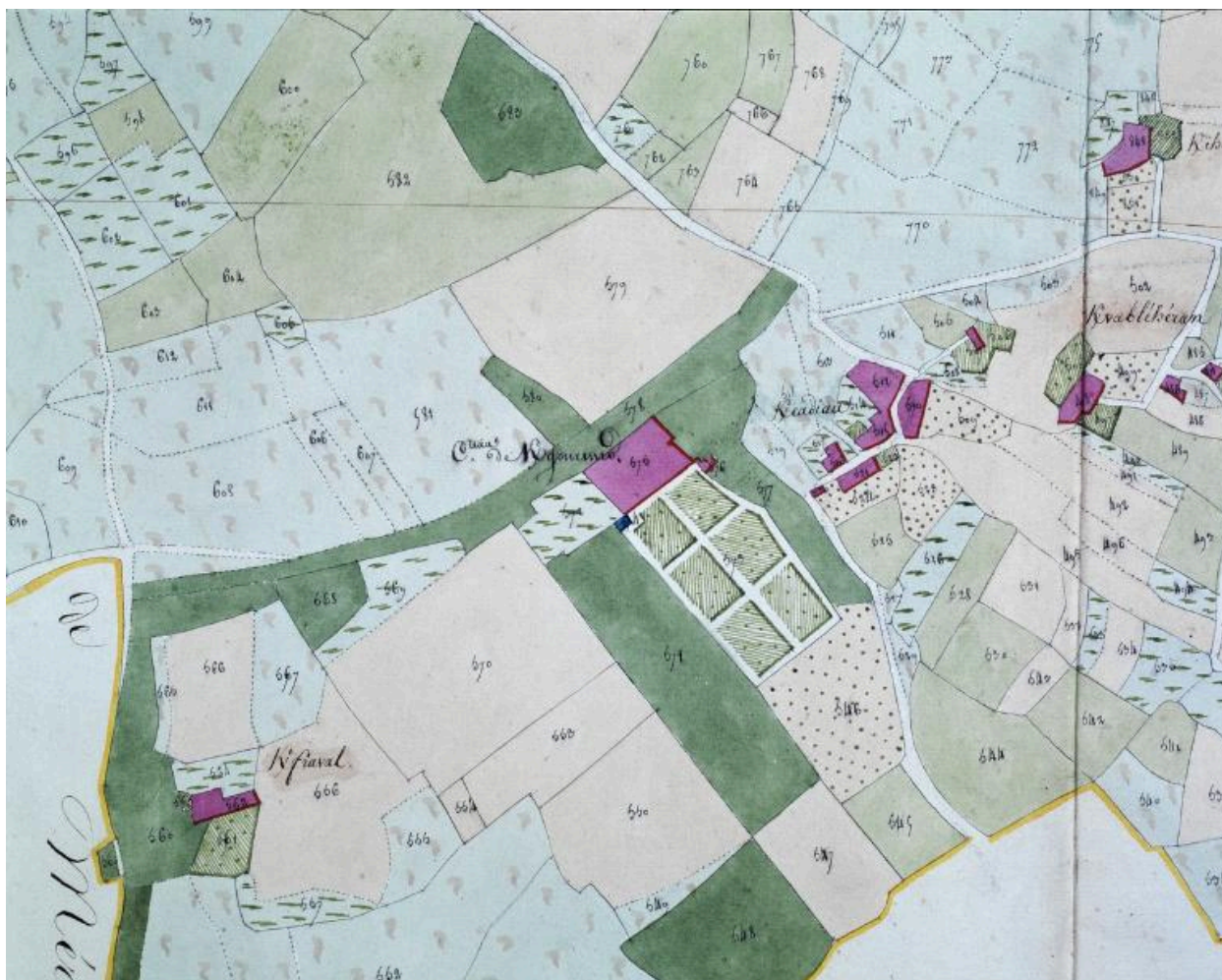
Plan cadastral de 1852, section B3