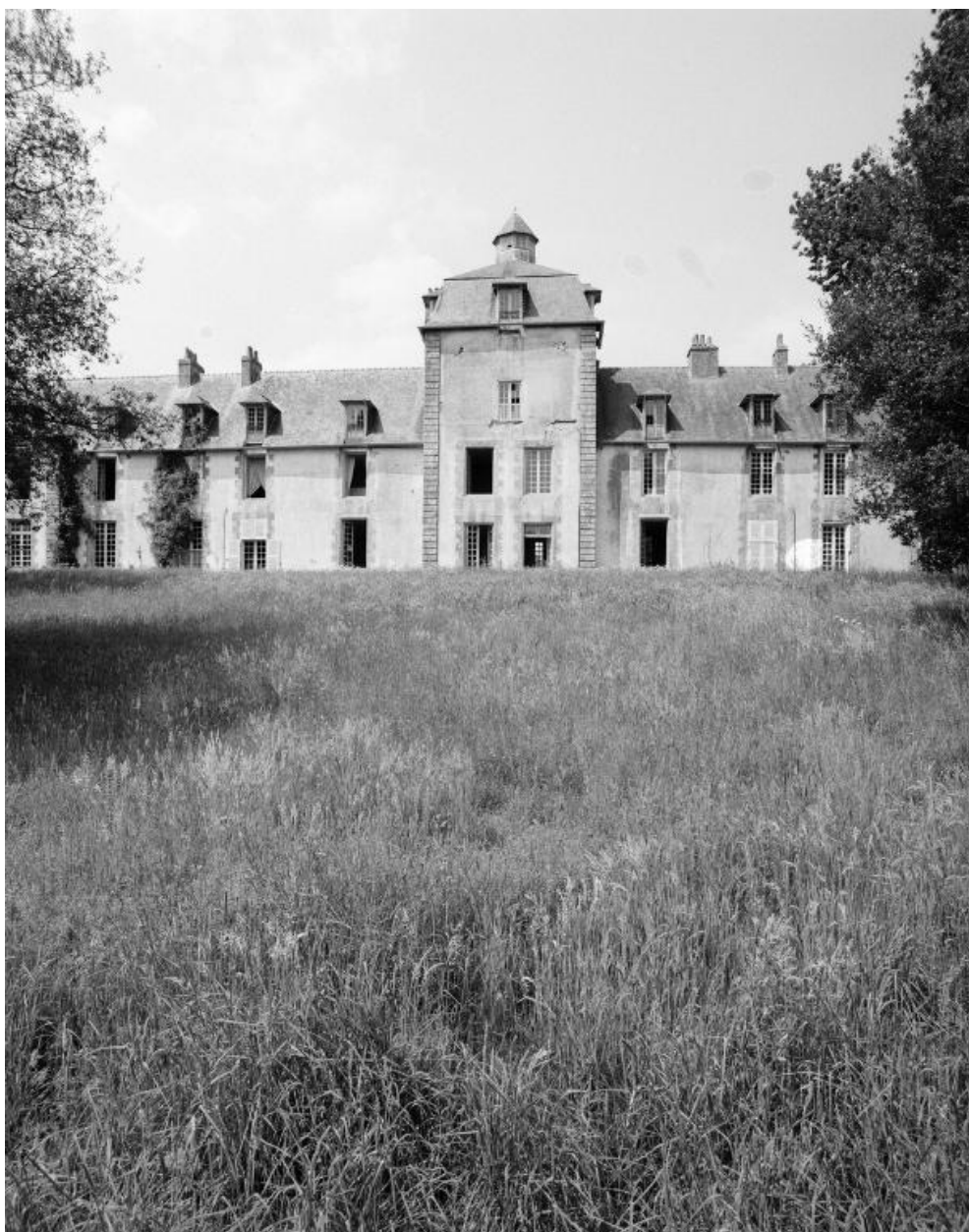
Elévation sud, partie centrale.