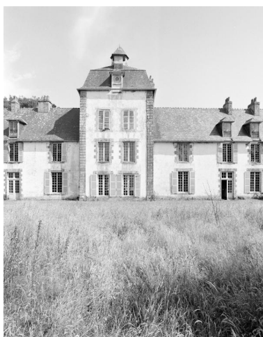
Elévation nord, pavillon central.