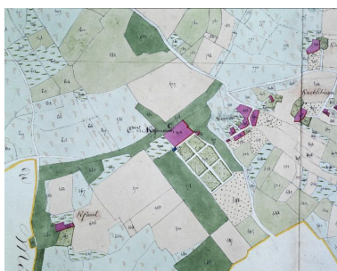
Plan cadastral de 1852, section B3

IVR53_19935600191X