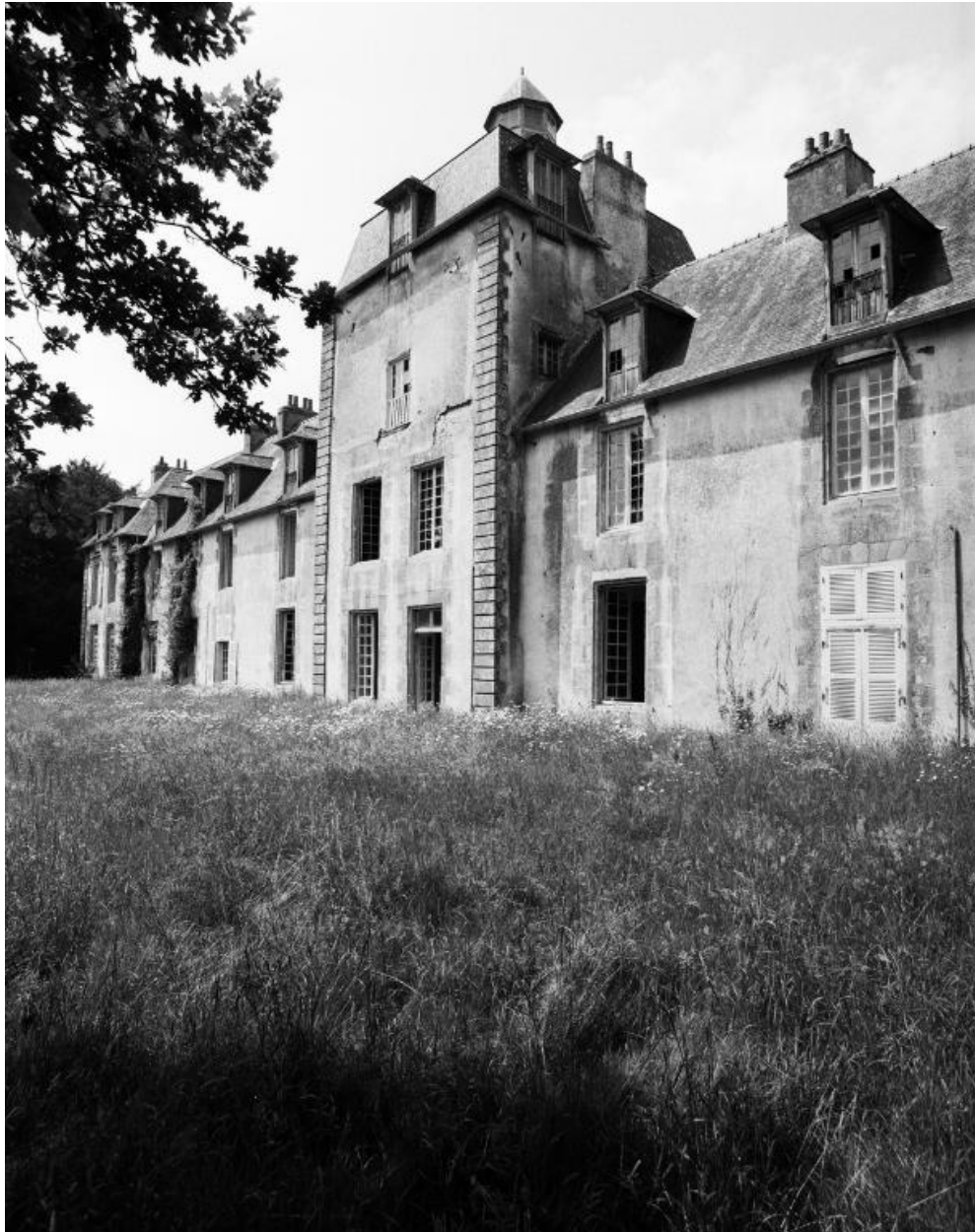
Elévation sud, partie centrale, vue prise de l'est.