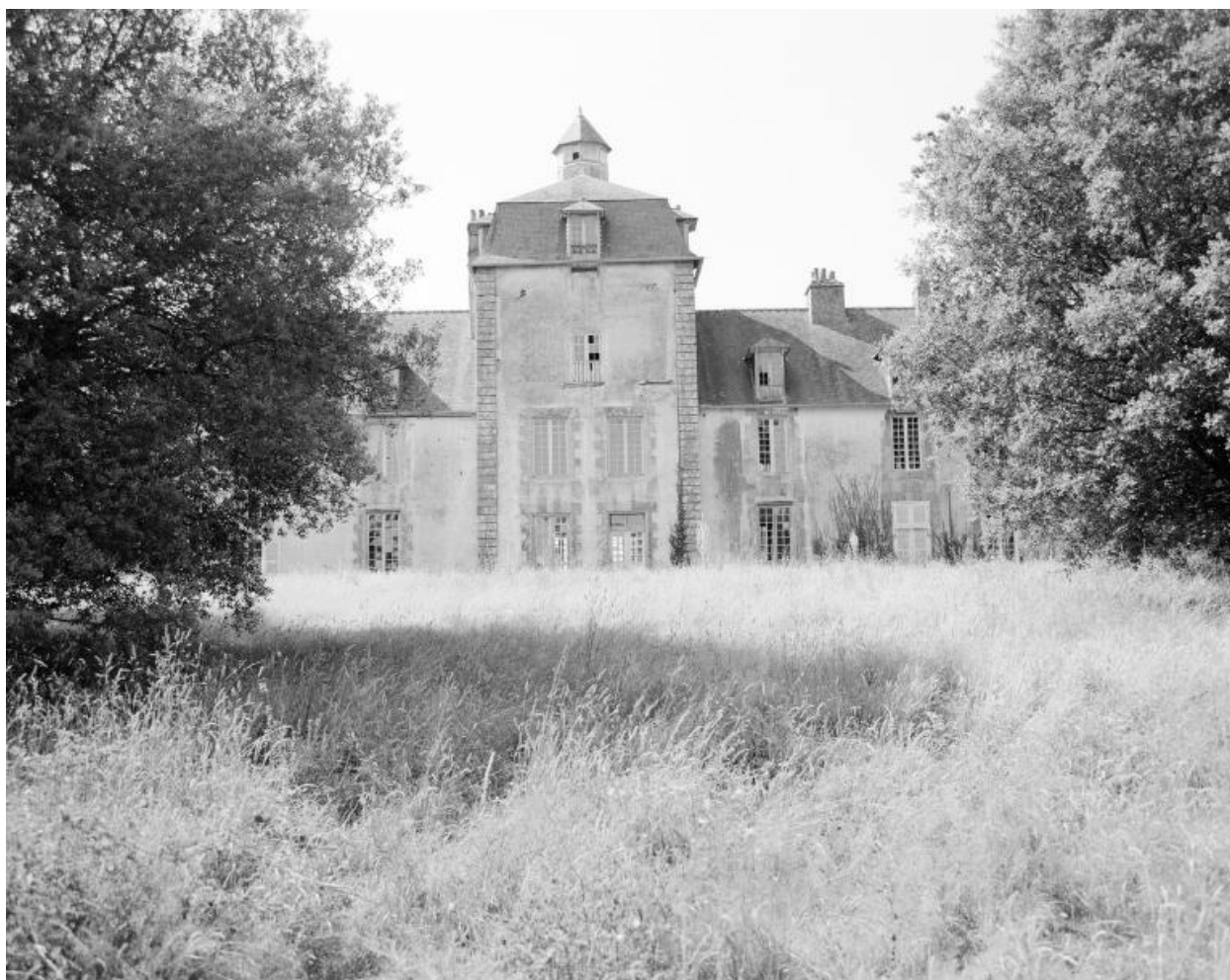
Elévation sud, partie centrale, vue prise de l'ouest.