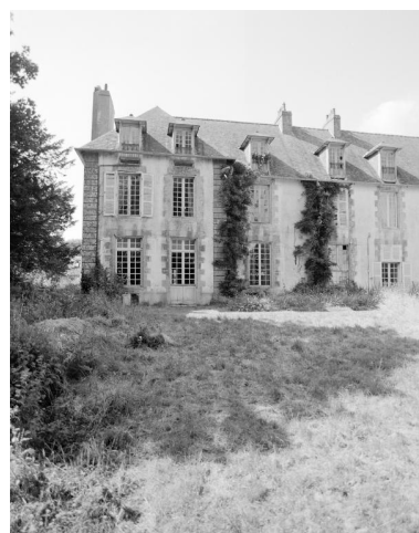
Elévation sud, aile ouest, pavillon ouest. IVR53_19945600934X