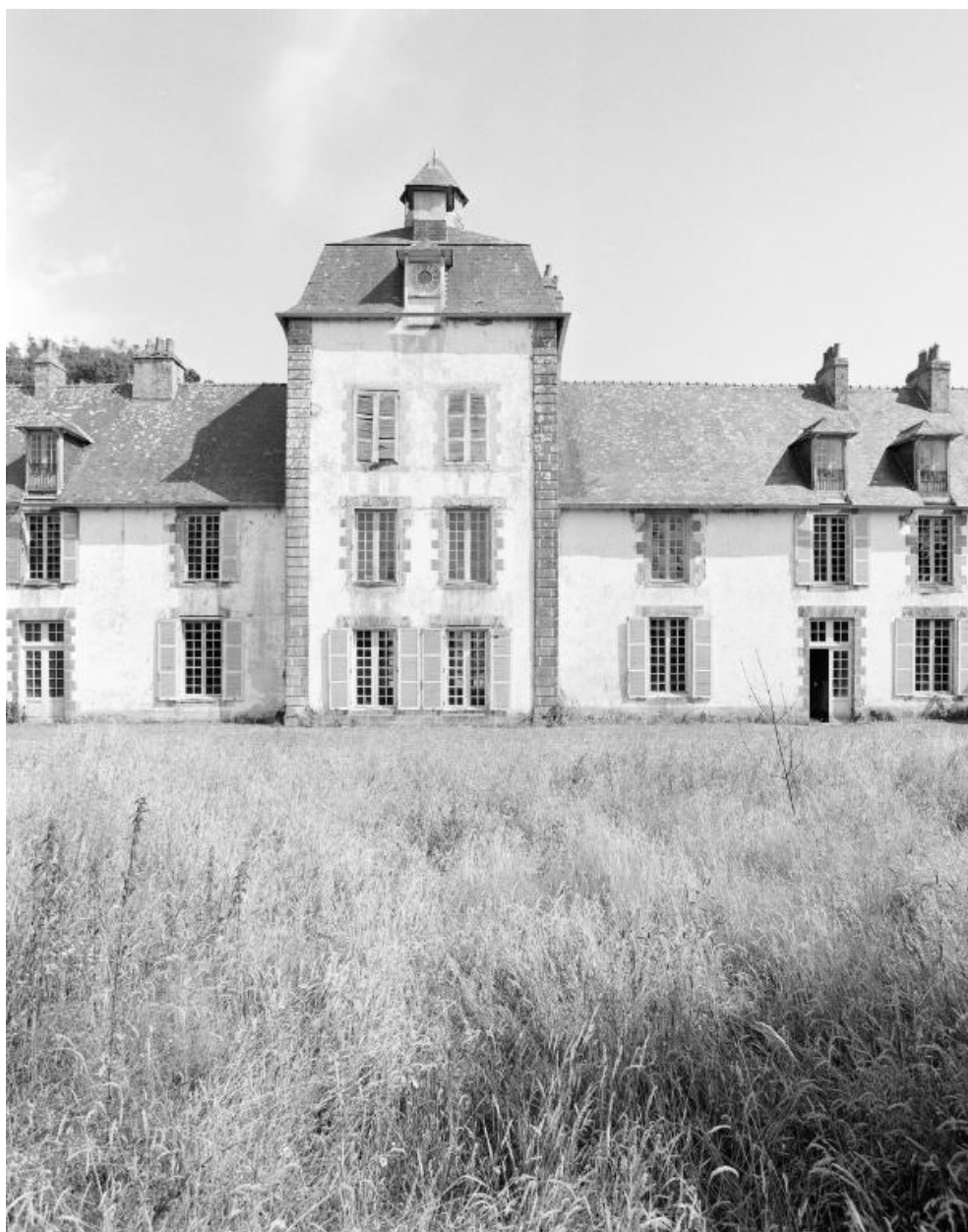
Elévation nord, pavillon central.