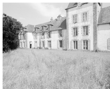
Elévation nord, partie est. IVR53_19945600916X