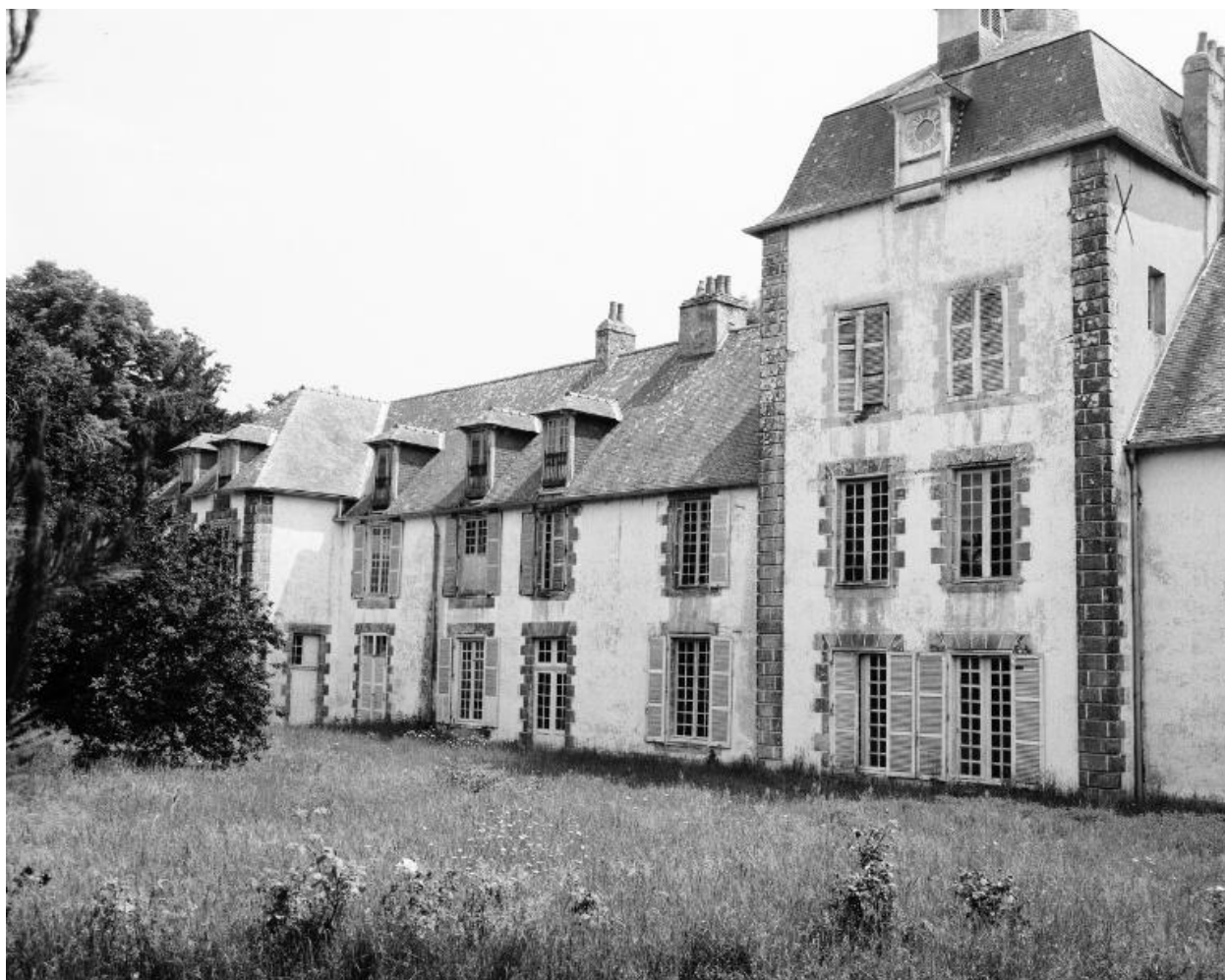
Elévation nord, partie est.