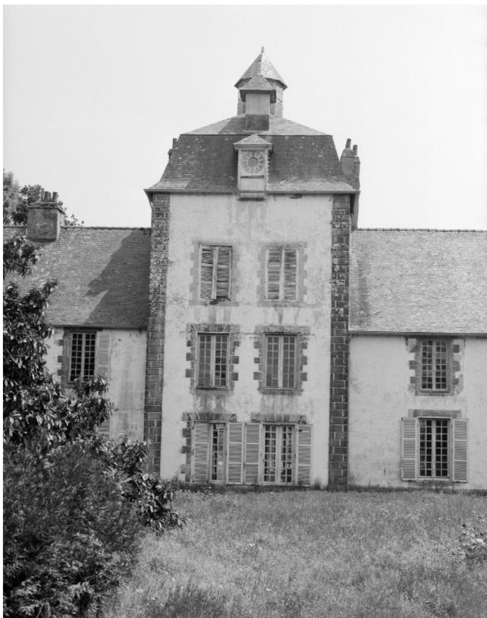
Elévation nord, pavillon central.