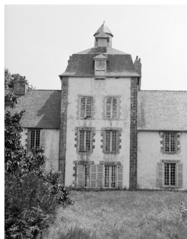
Elévation nord, pavillon central.