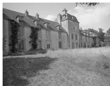
Elévation sud, vue prise de l'ouest IVR53_19945600918X