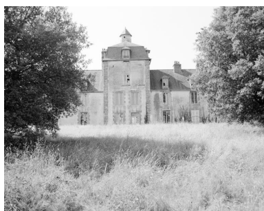
Elévation sud, partie centrale, vue prise de l'ouest. IVR53_19945601019X