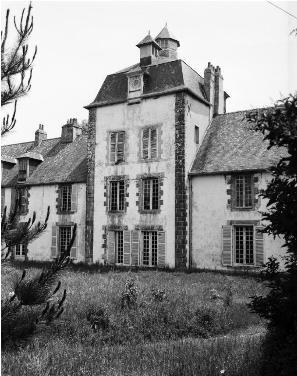
Elévation nord, pavillon central, vue prise de l'ouest.