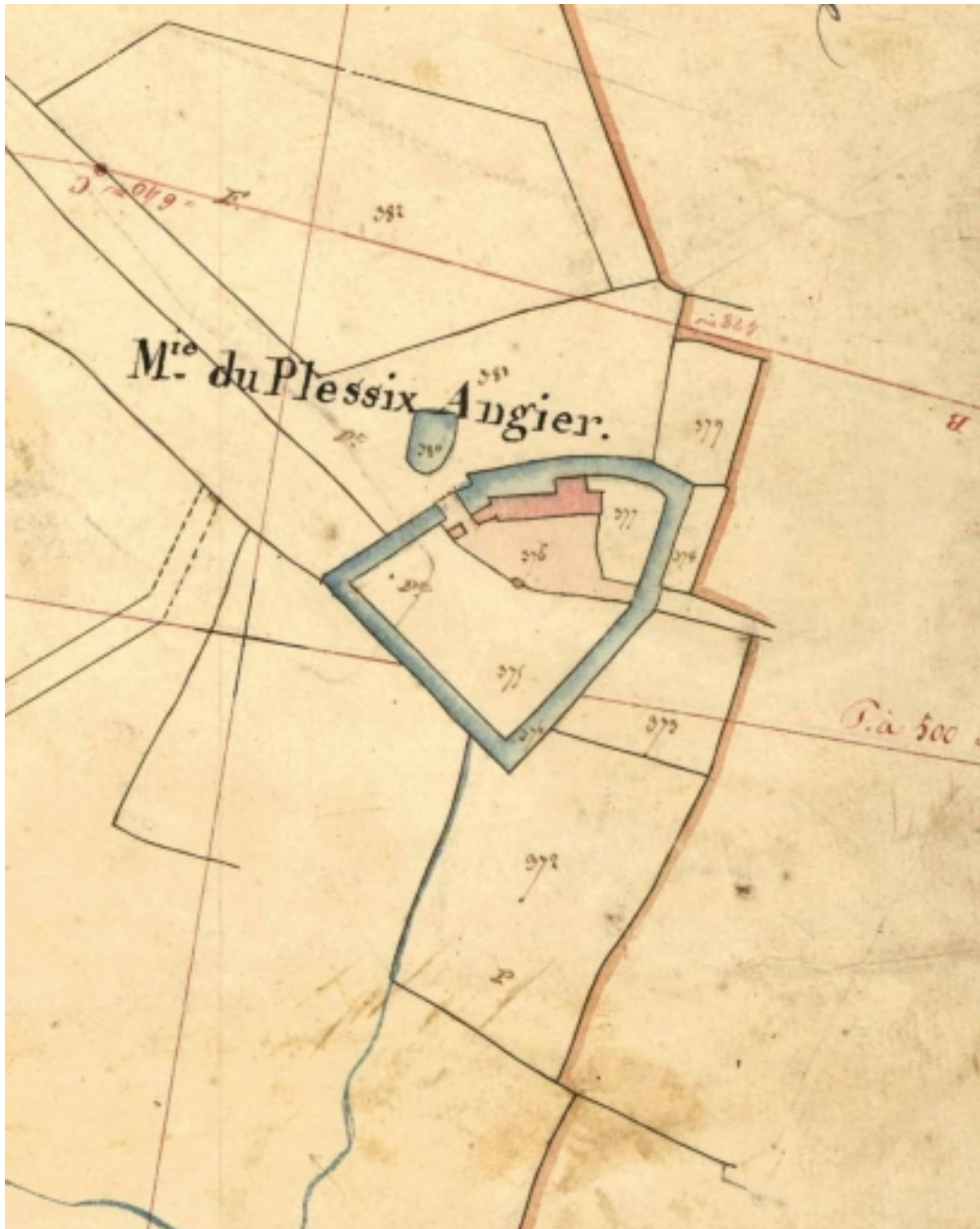
Le château et ses dépendances sur le cadastre de 1831