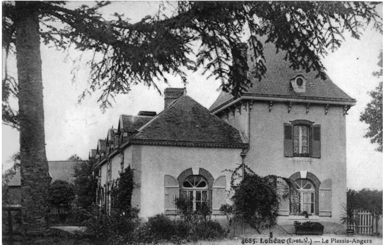
Le corps de logis avec son pavillon, tel qu'il est encore actuellement, sur une carte postale au début du 20e siècle