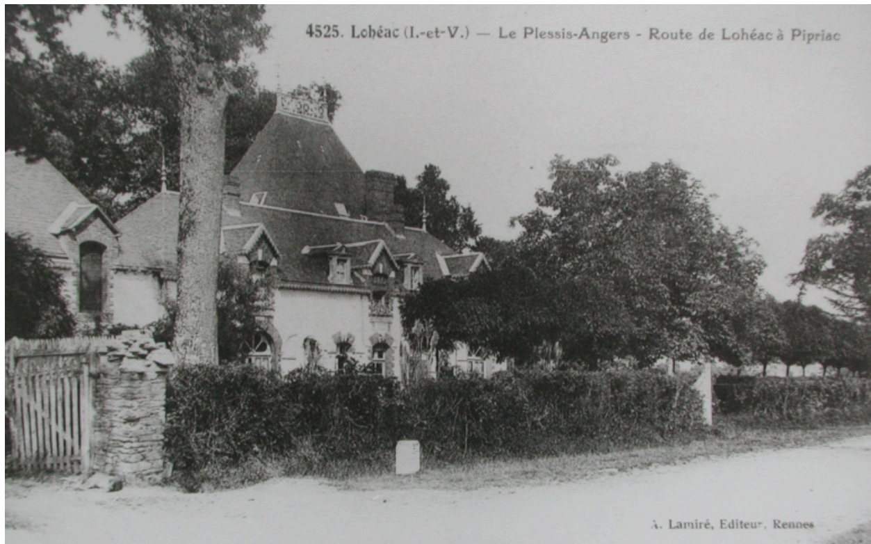
Le château, alors sur le bord de la route, sur une carte postale au début du 20e siècle