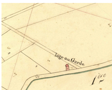
La loge du garde sur le cadastre de 1831 IVR53_20003520179NUC