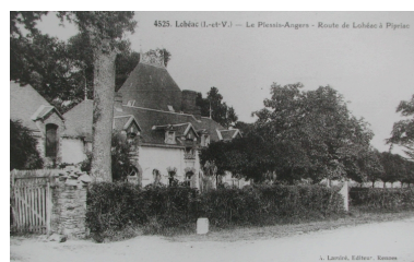
Le château, alors sur le bord de la route, sur une carte postale au début du 20e siècle