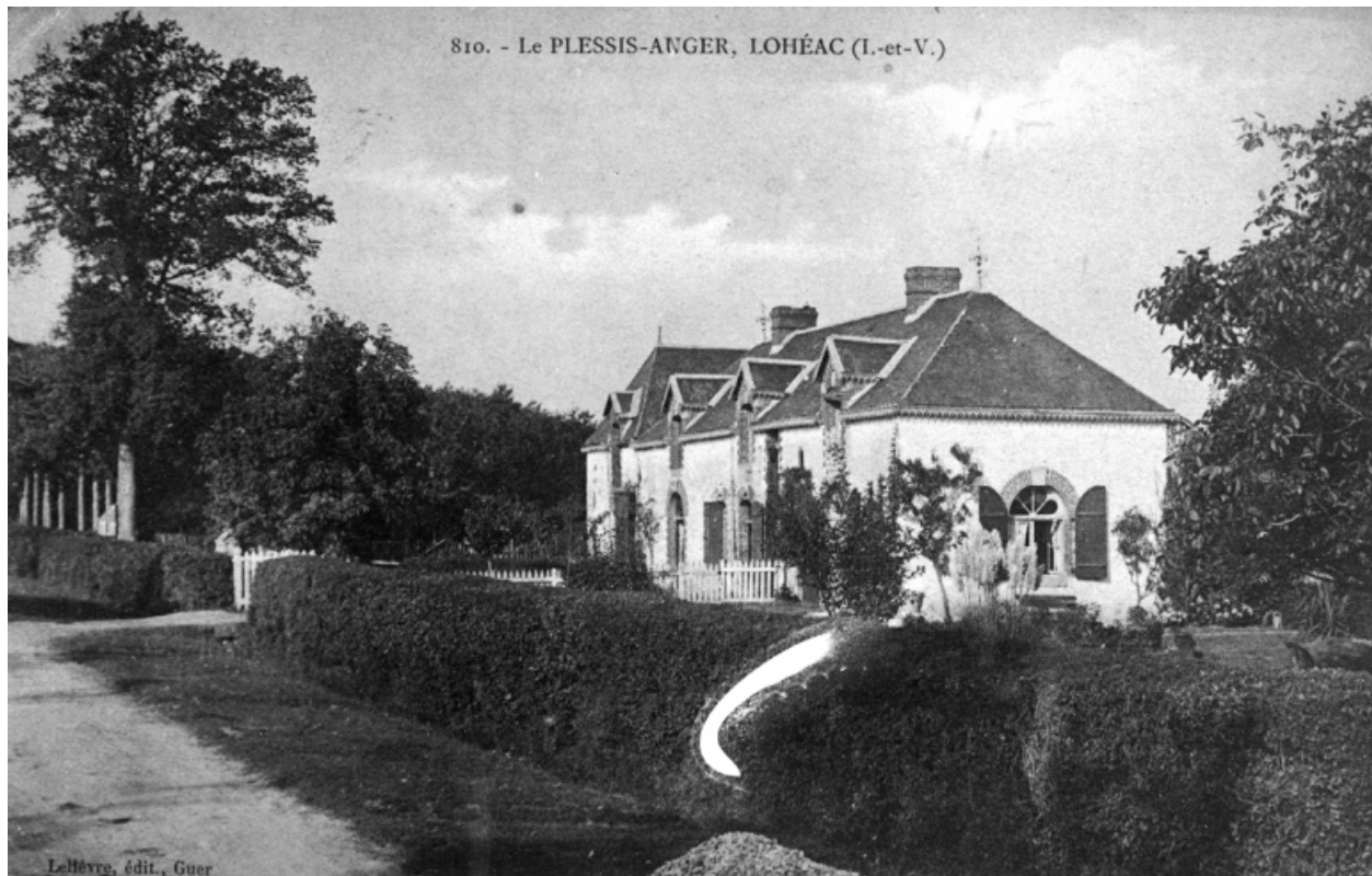
Le corps de logis principal avant la construction du pavillon sur une carte postale au début du 20e siècle