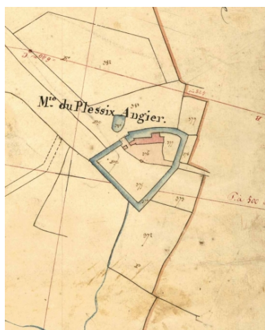
Le château et ses dépendances sur le cadastre de 1831 IVR53_20003514532NUC