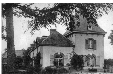
Le château dans son écrin de verdure : vue de situation sud IVR53_20003514852NUCA