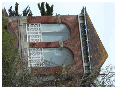
Aile nord de la maison de villégiature du 12 boulevard des Dunes IVR53_20075605610NUCA