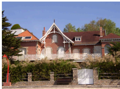
Vue générale de la maison de villégiature du 12 boulevard des Dunes