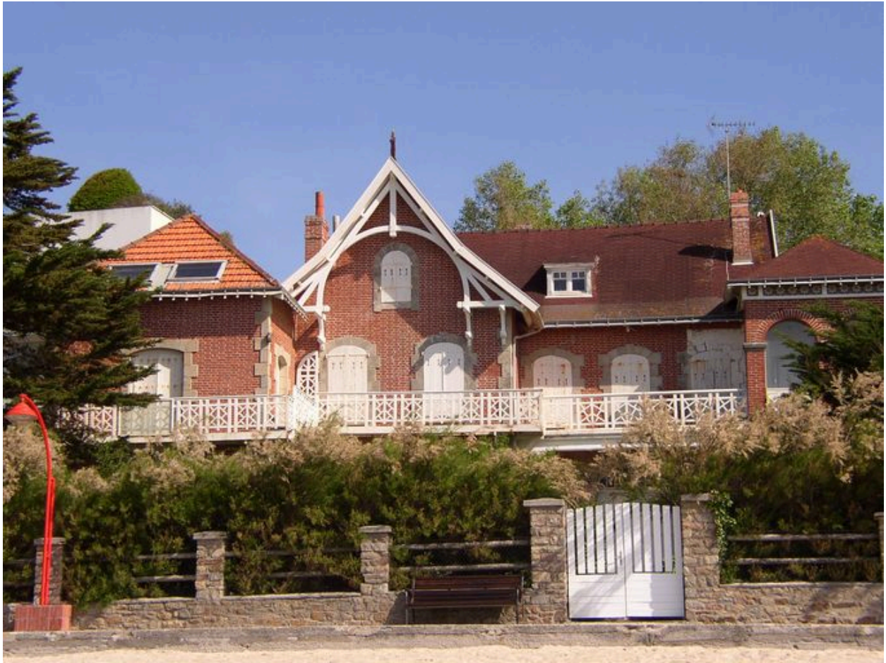
Vue générale de la maison de villégiature du 12 boulevard des Dunes