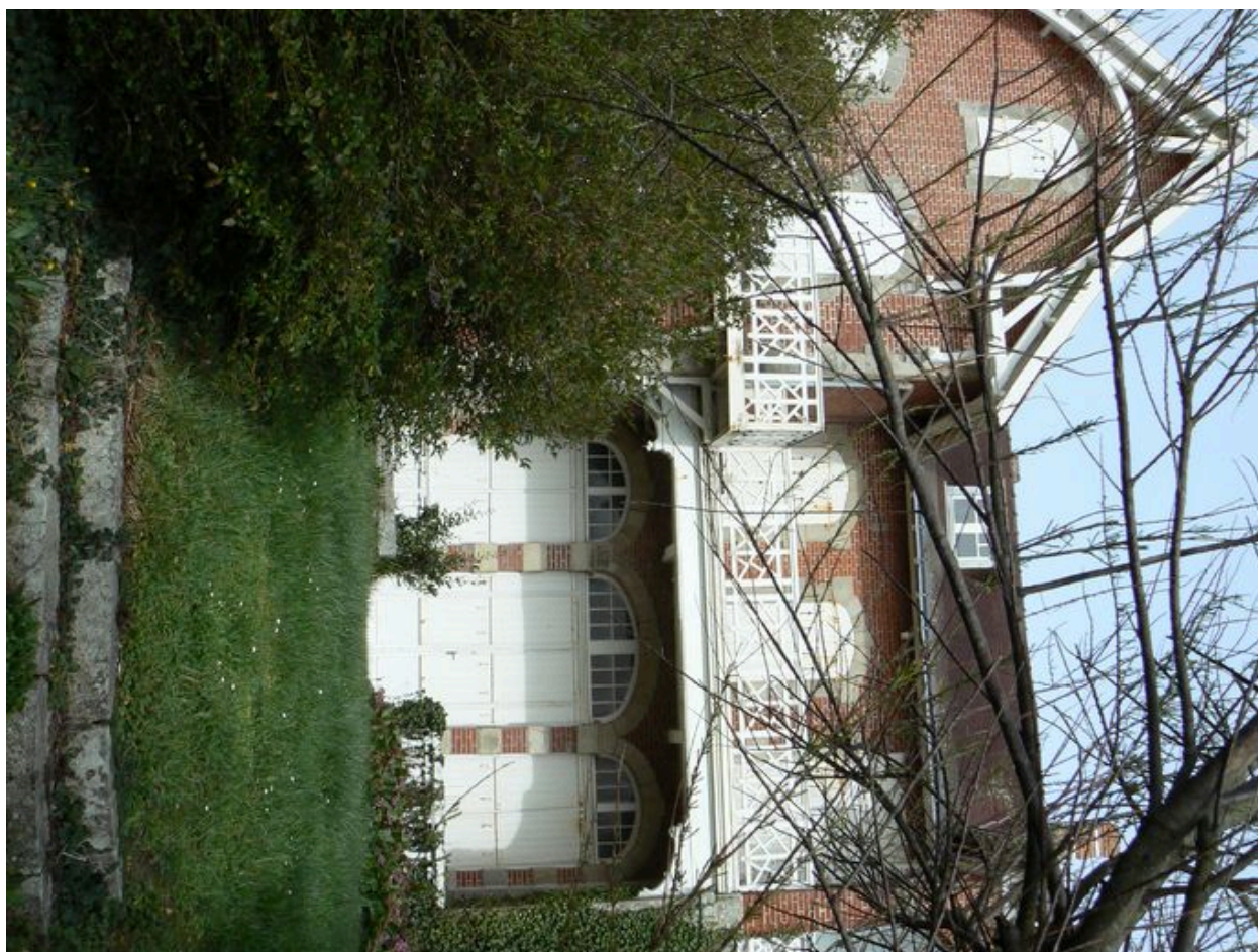
Maison de villégiature du 12 boulevard des Dunes