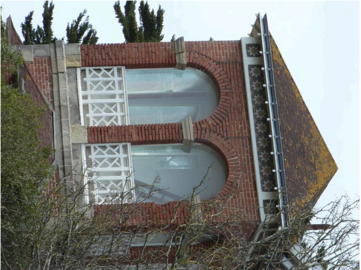
Aile nord de lma maison de villégiature du 12 boulevard des Dunes