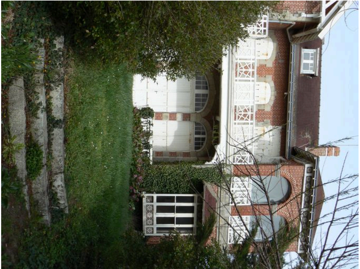
Maison de villégiature du 12 boulevard des Dunes