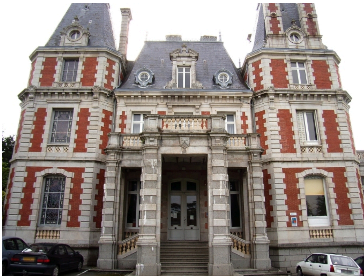
Vue générale (élévation antérieure)