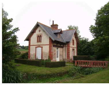
Conciergerie