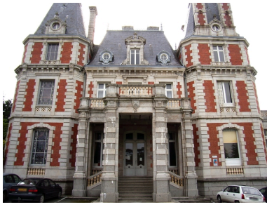
Vue générale (élévation antérieure) IVR53_20072210076NUCA