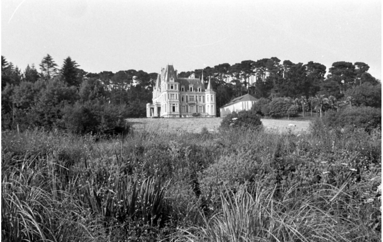
Vue générale (cliché S. Laffiché, pré-inventaire, 1973)