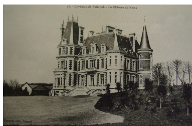
Vue générale, 1er quart du 20ème siècle (AD 22) IVR53_20072210172NUCB