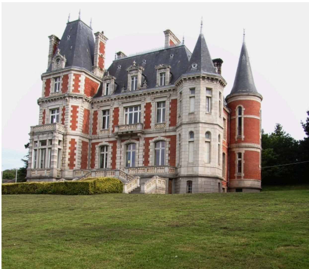
Vue générale (élévation sud)