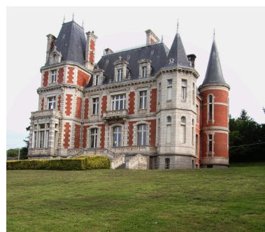
Vue générale (élévation sud) IVR53_20072209961NUCA