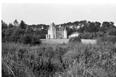
Vue générale IVR53_19732205089ZB