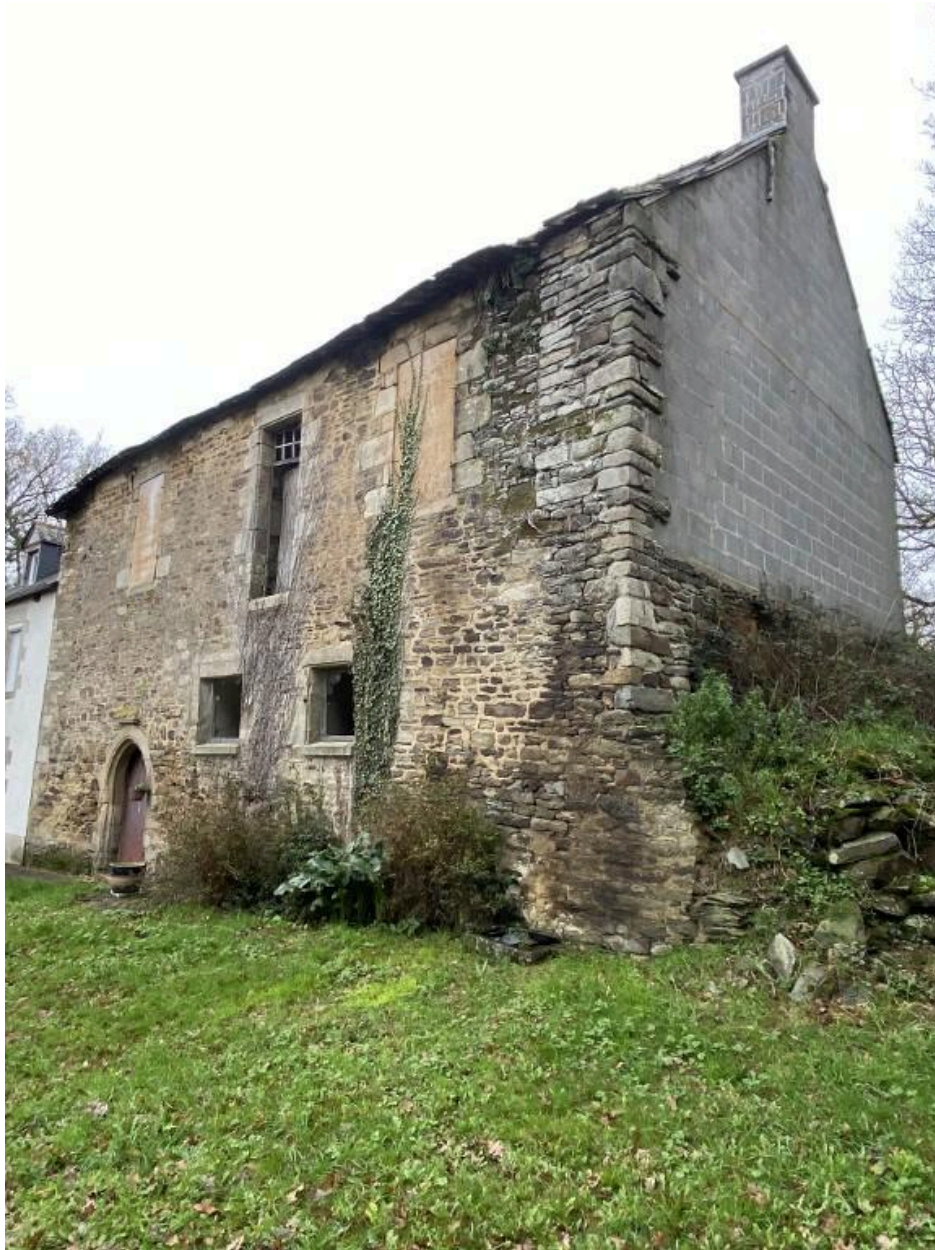
Élévation sud, vue ouest