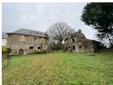
Vue générale sud IVR53_20265610673NUCA