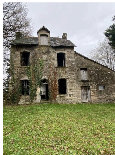
Élévation ouest IVR53_20265610674NUCA