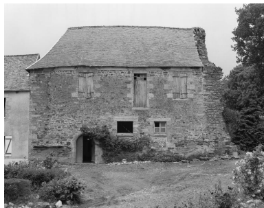
Manoir : élévation sud (état en 1991) IVR53_19915600435X