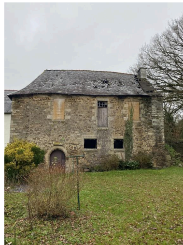
Élévation sud, vue générale IVR53_20265610672NUCA