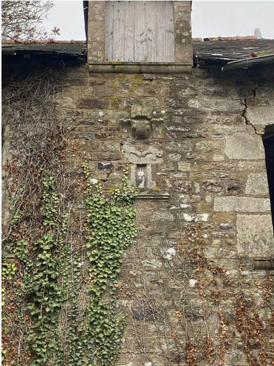
Niche, élévation ouest, détail