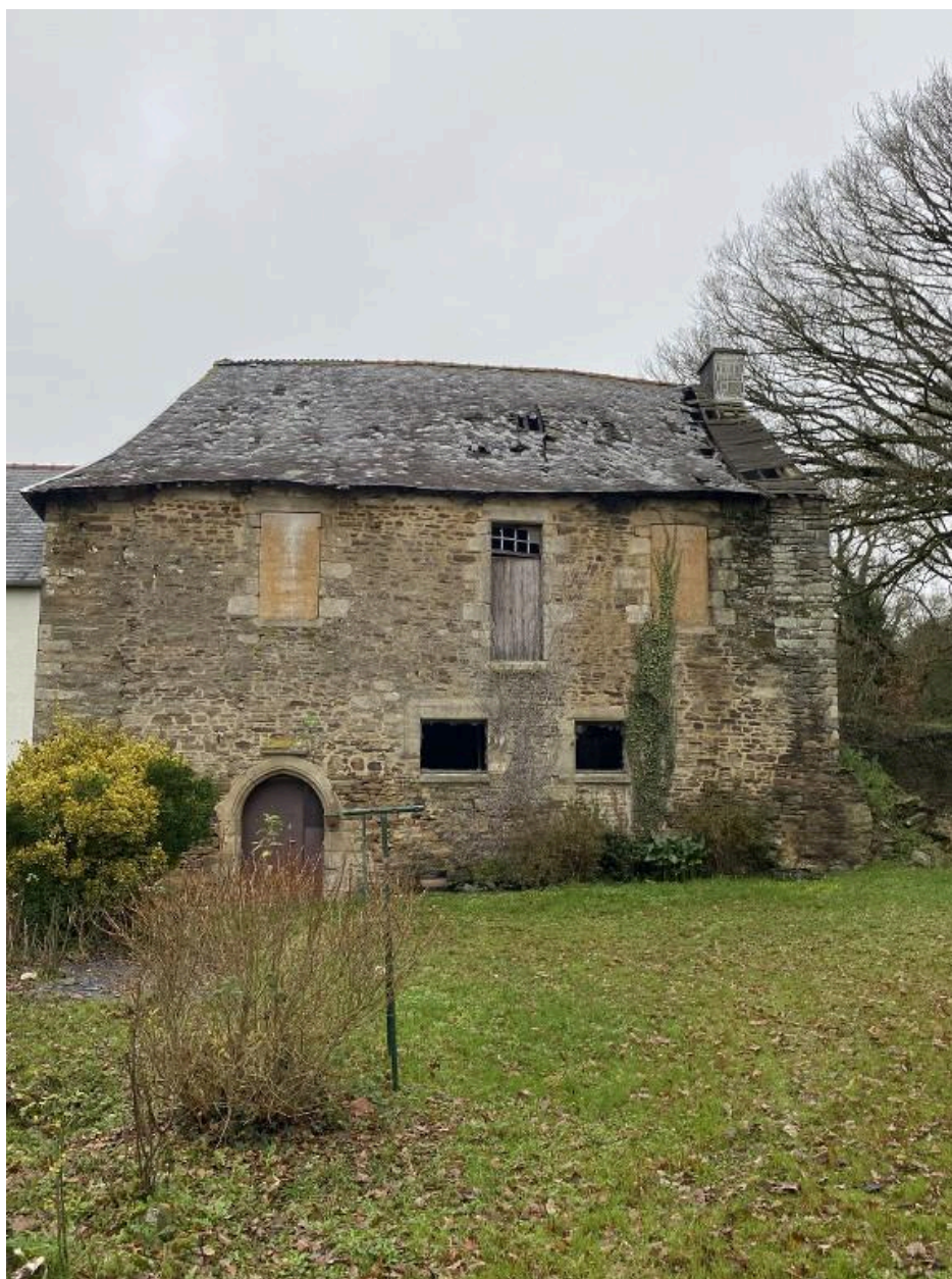
Élévation sud, vue générale