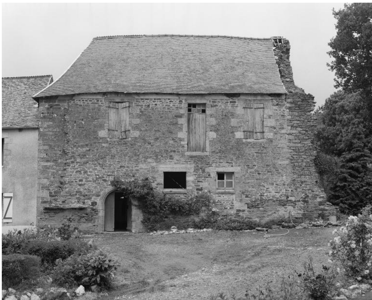
Manoir : élévation sud (état en 1991)