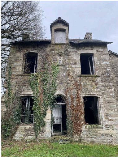
Élévation ouest