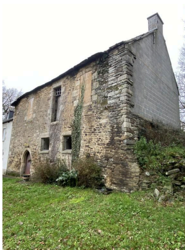
Élévation sud, vue ouest IVR53_20265610677NUCA