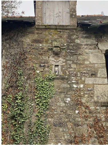
Niche, élévation ouest, détail IVR53_20265610676NUCA