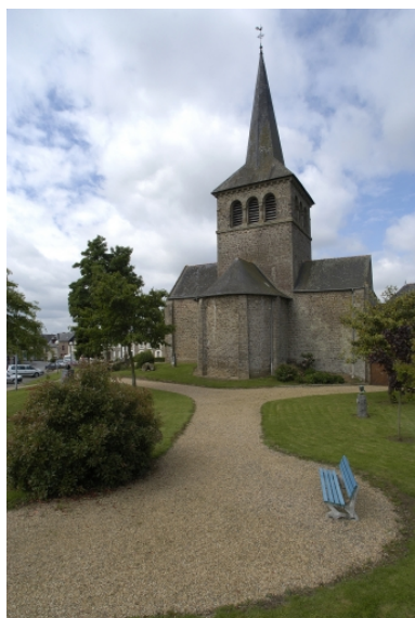
L'église de Hédé