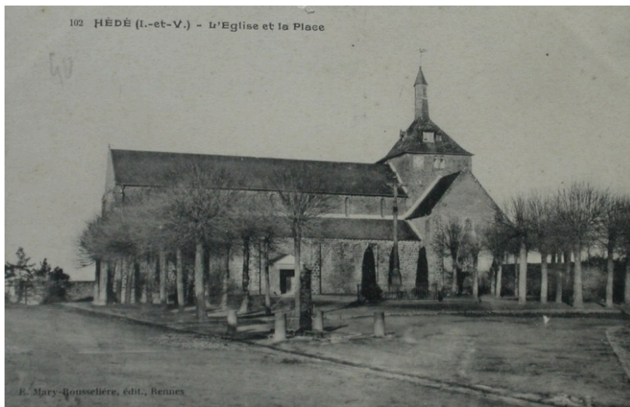
L'église de Hédé sur une carte postale ancienne