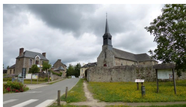
Vue générale sud ouest, église paroissiale Saint-Martin de Tours (Hédé-Bazouges) IVR53_20253530147NUCA