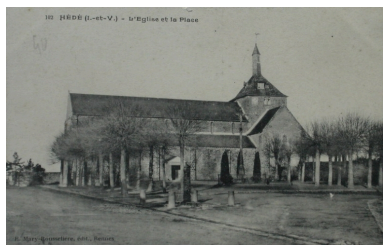
L'église de Hédé sur une carte postale ancienne IVR53_20053519238NUCA