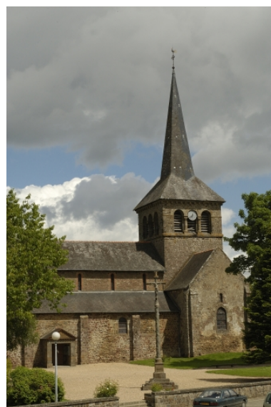
L'église de Hédé