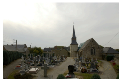
L'église de Saint-Symphorien