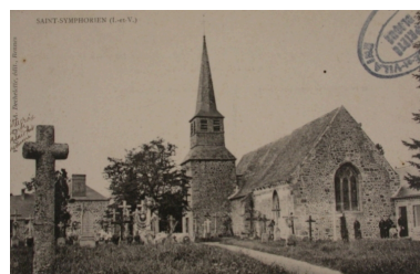
L'église de Saint-Symphorien sur une carte postale du début du 20e siècle