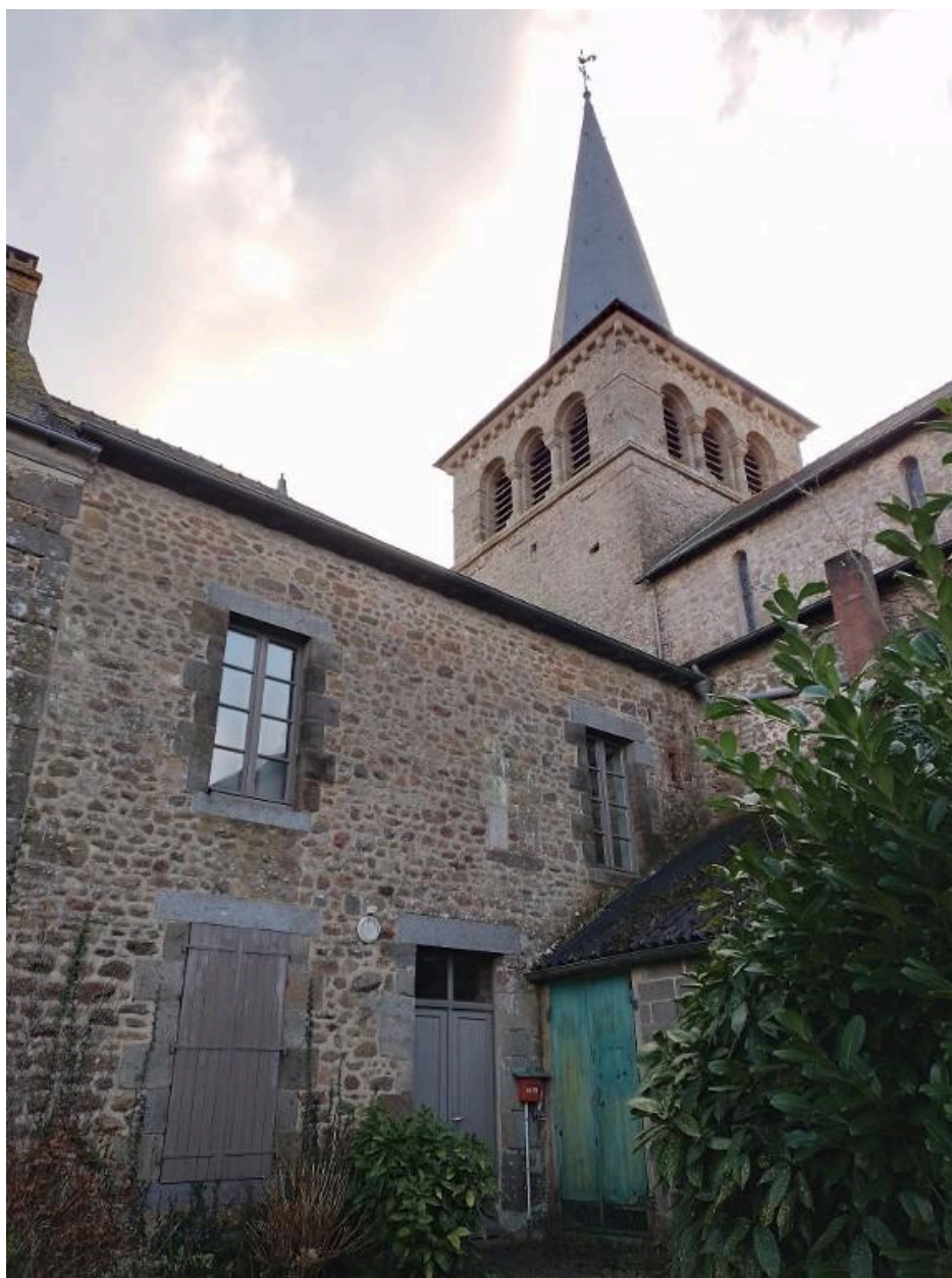
Vue de la façade ouest