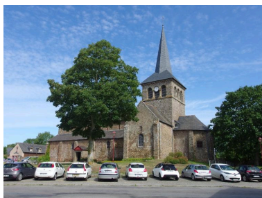
vue sud de l'église paroissiale Notre Dame (Hédé-Bazouges) IVR53_20253510063NUCA