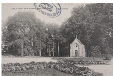
La chapelle du château de la Bretèche IVR53_20053518368NUCA