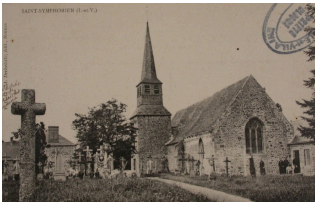
L'église de Saint-Symphorien sur une carte postale du début du 20e siècle