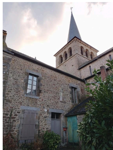
Vue de la façade ouest IVR53_20253530096NUCA