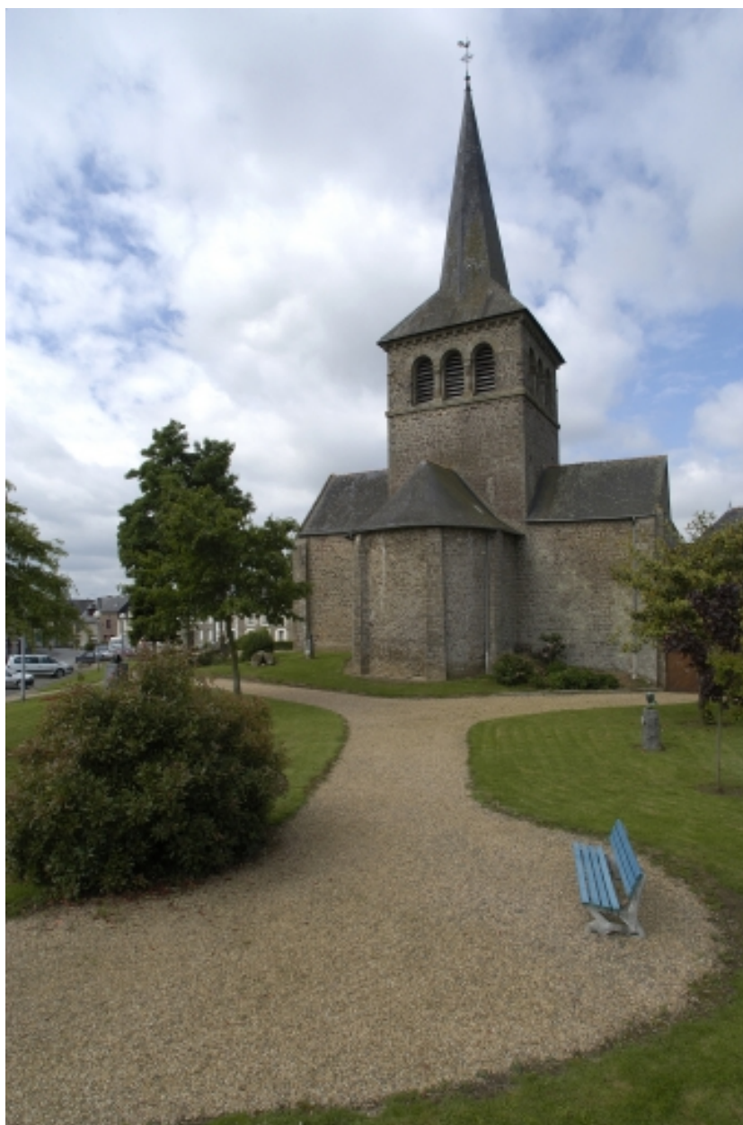
L'église de Hédé