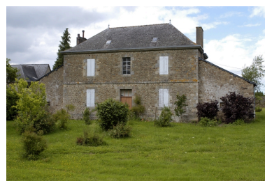
L'ancien presbytère de Bazouges-sous-Hédé IVR53_20053501724NUCA