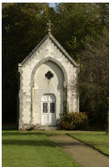
La chapelle de la Bretèche