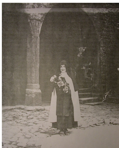
En arrière plan, le cloître du Couvent des Ursulines