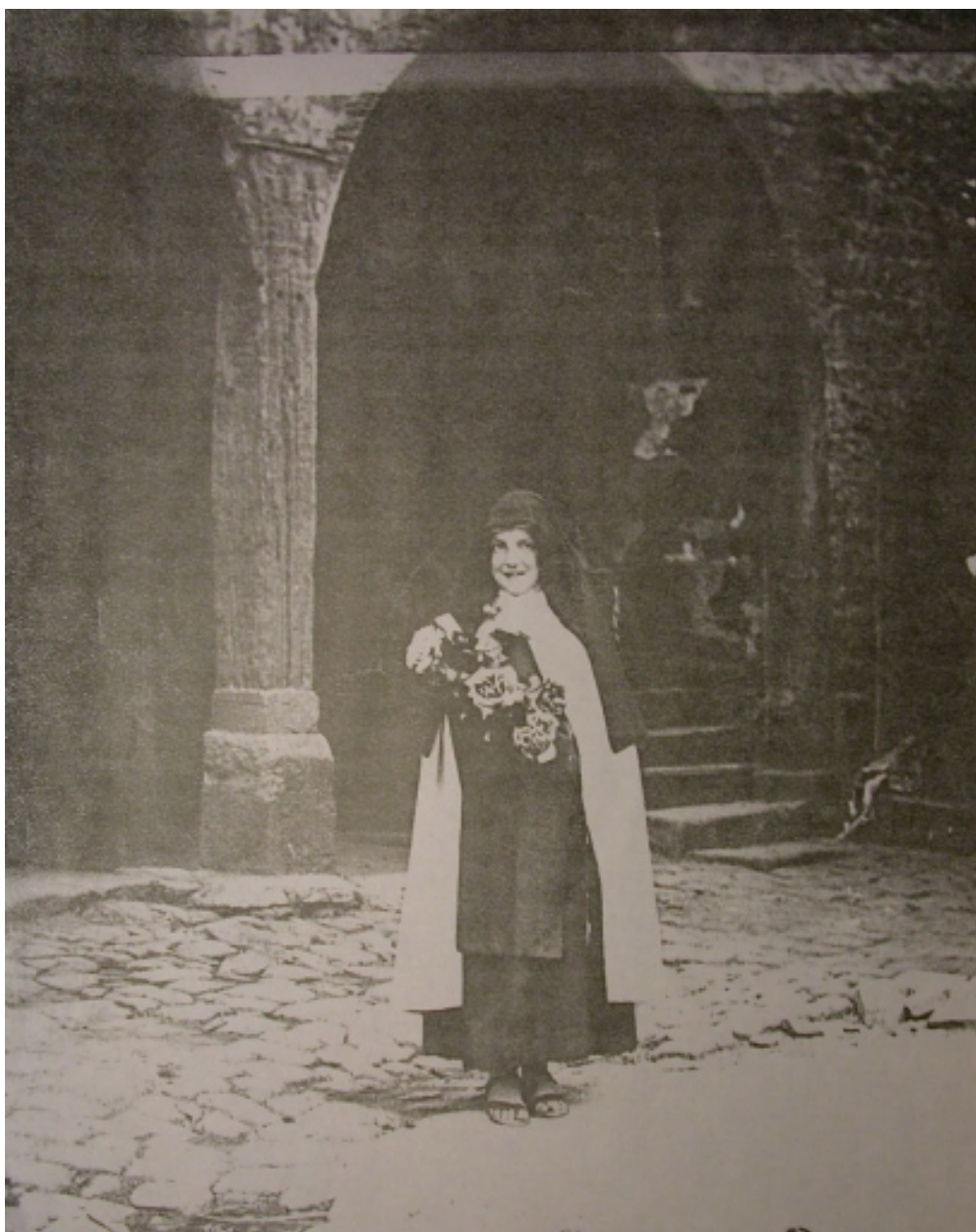
En arrière plan, le cloître du Couvent des Ursulines