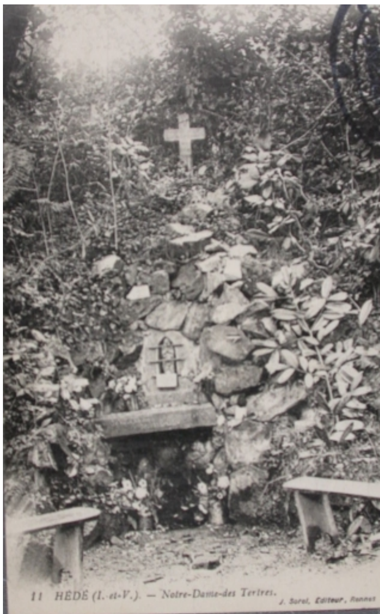
Notre-Dame des Tertres