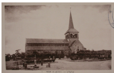
L'église sur une carte postale ancienne IVR53_20053518390NUCA