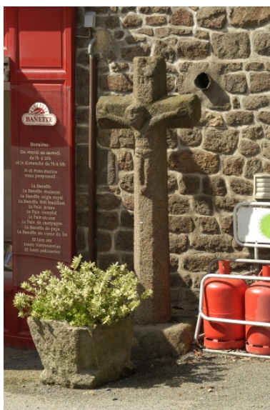
La croix de Saint-Jean