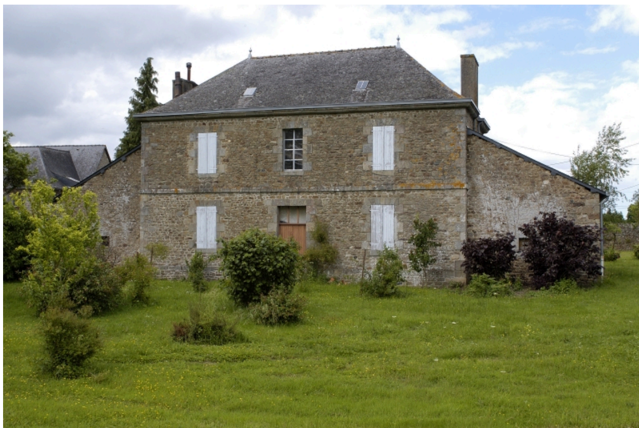
L'ancien presbytère de Bazouges-sous-Hédé