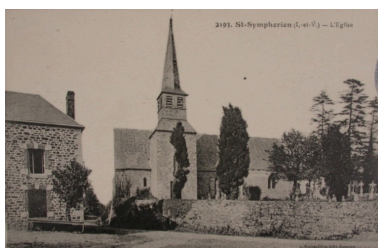
L'église de Saint-Symphorien sur une carte postale ancienne IVR53_20053518362NUCA