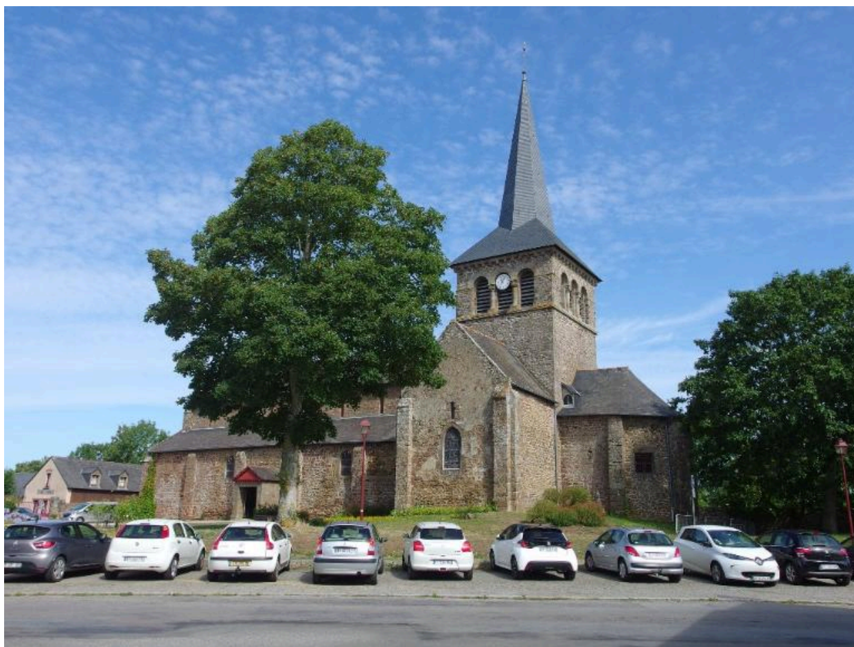
vue sud de l'église paroissiale Notre Dame (Hédé-Bazouges)