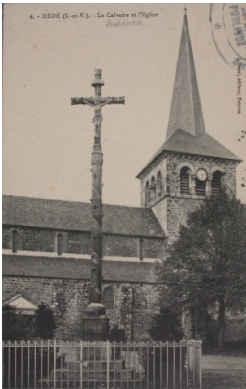
Le calvaire et l'église de Hédé