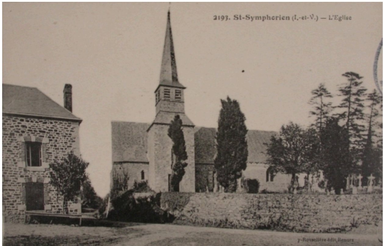
L'église de Saint-Symphorien sur une carte postale ancienne