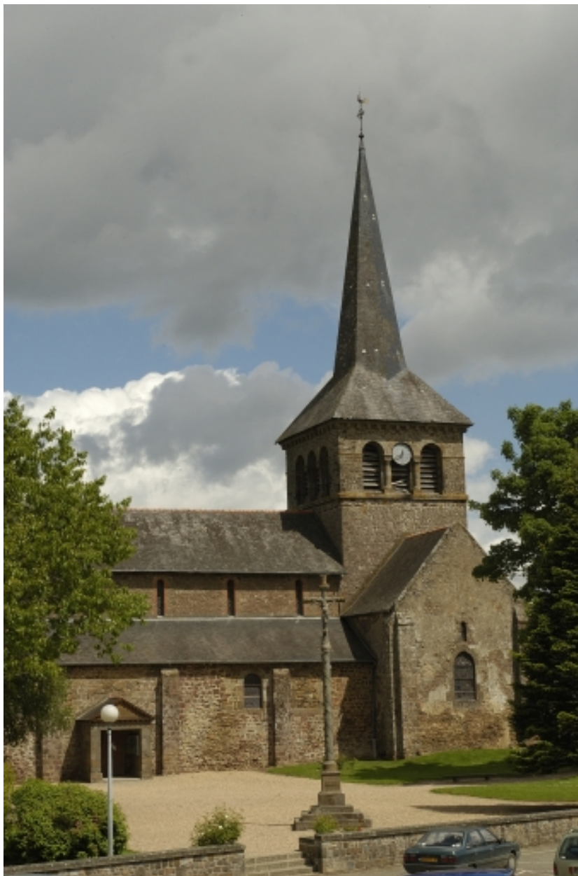
L'église de Hédé