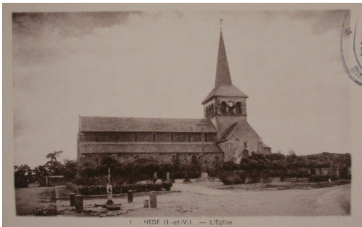
L'église sur une carte postale ancienne