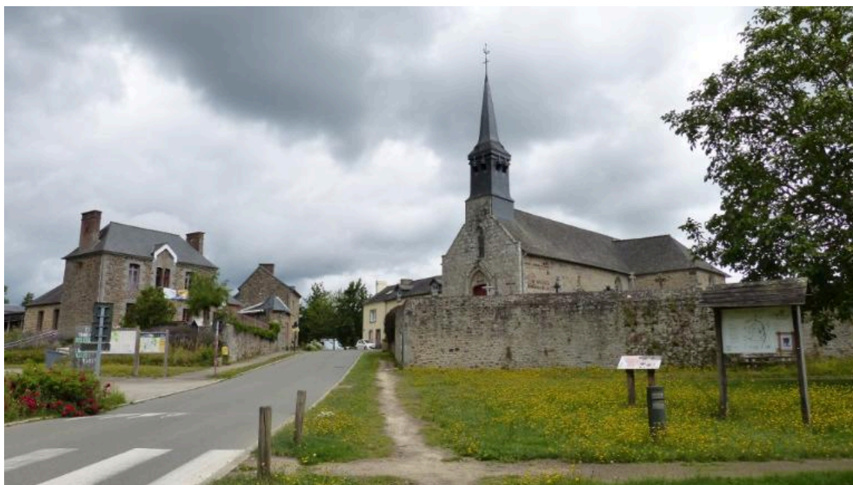
Vue générale sud ouest, église paroissiale Saint-Martin de Tours (Hédé-Bazouges)