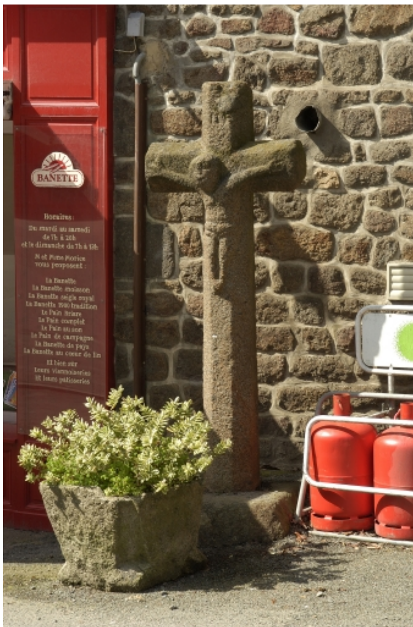
La croix de Saint-Jean