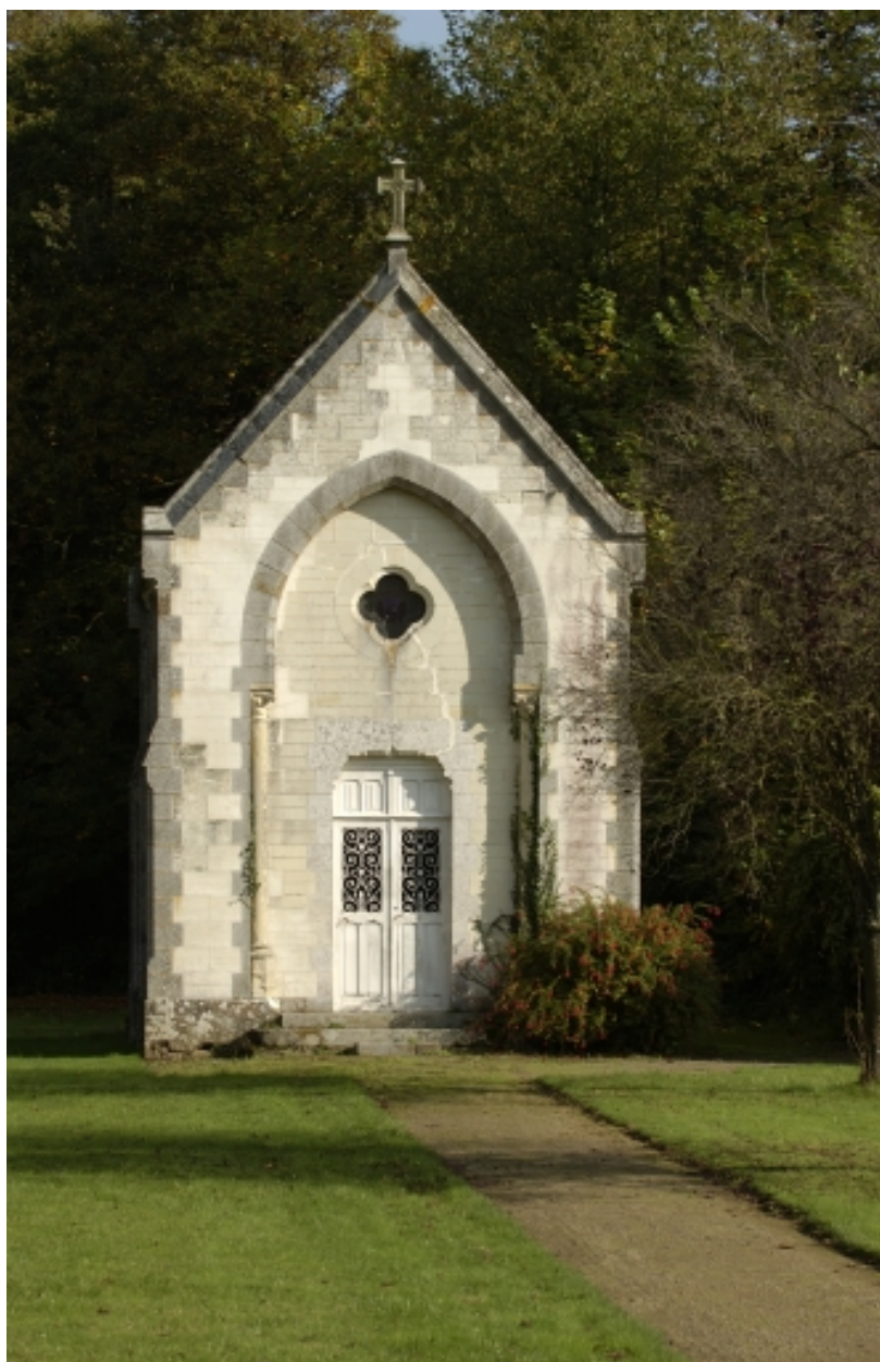
La chapelle de la Bretèche