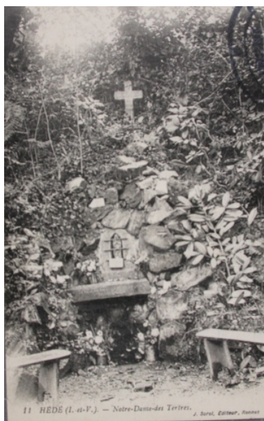
Notre-Dame des Tertres