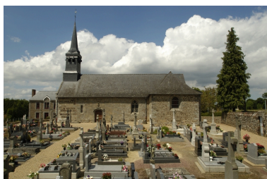
L'église de Bazouges-sous-Hédé