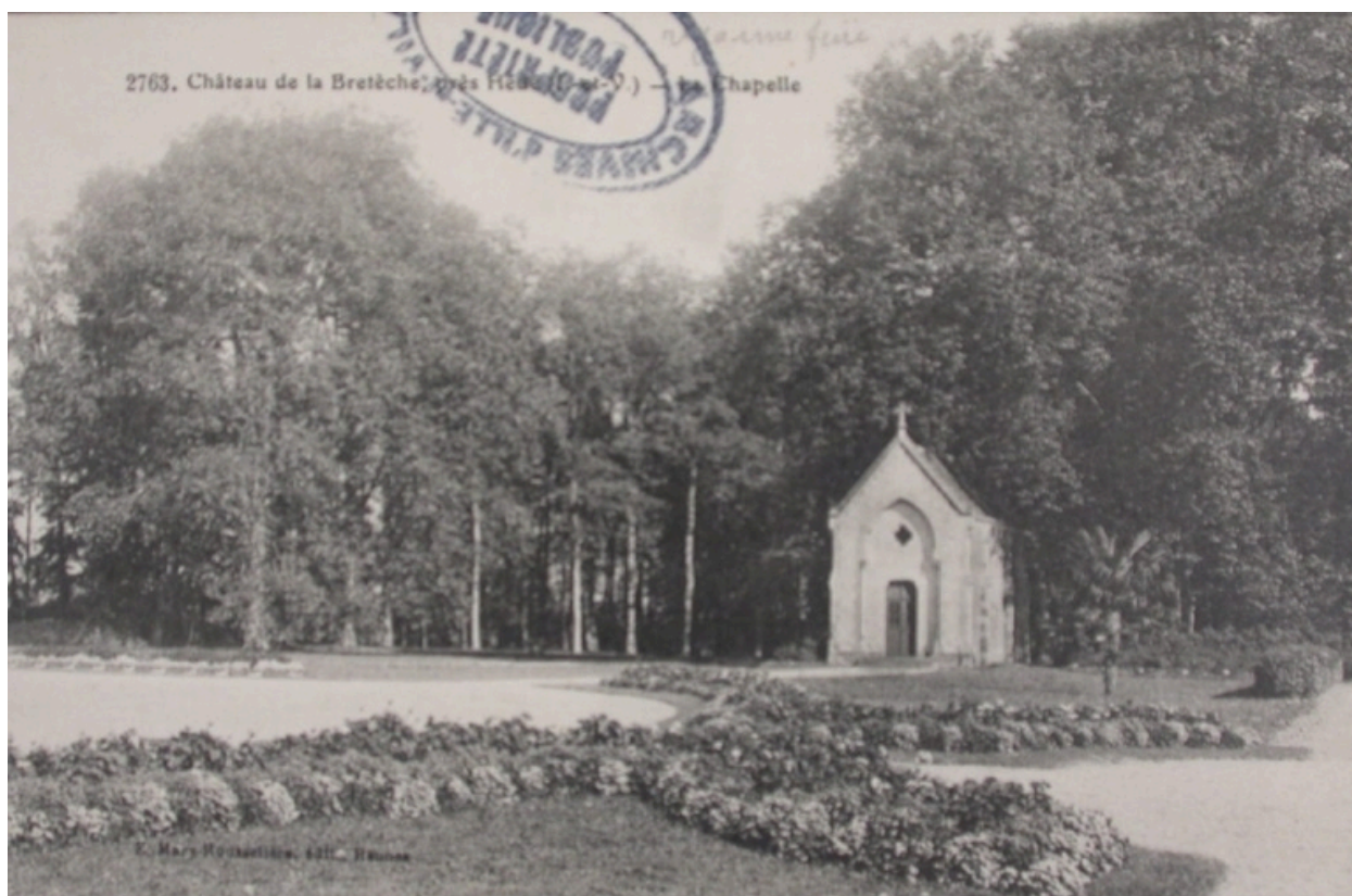
La chapelle du château de la Bretèche