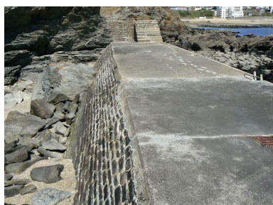
Plateforme, escalier et partie supérieure de la cale des Grands-Sables IVR53_20082908645NUCA