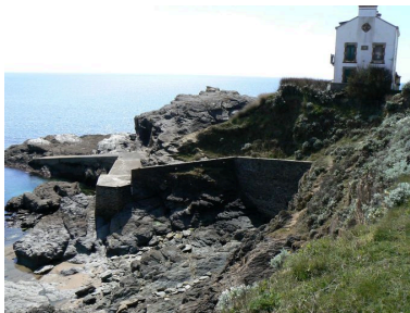
Vue générale de la cale des Grands-Sables