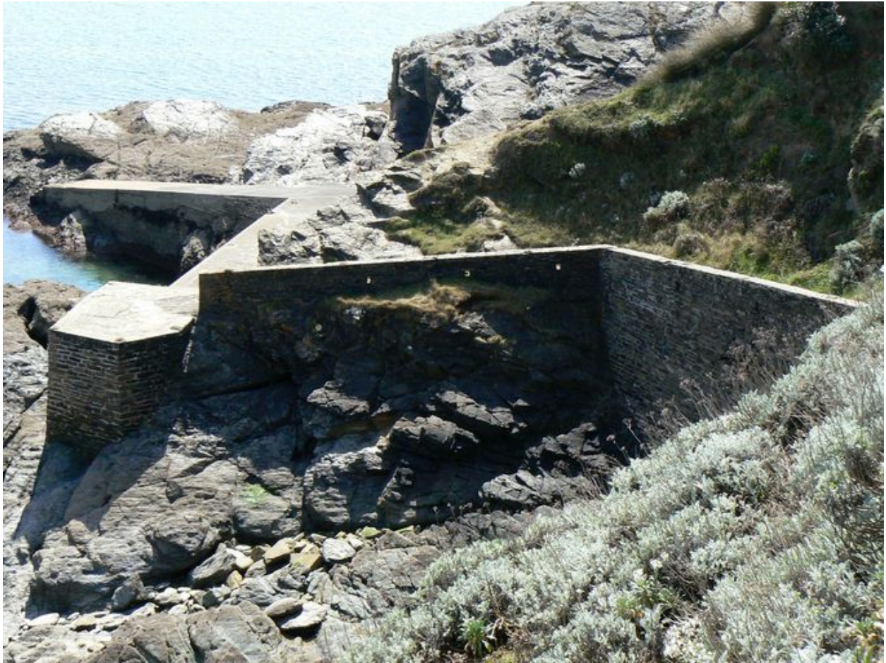
Muret protégeant le chemin d'accès à la cale et cale des Grands-Sables