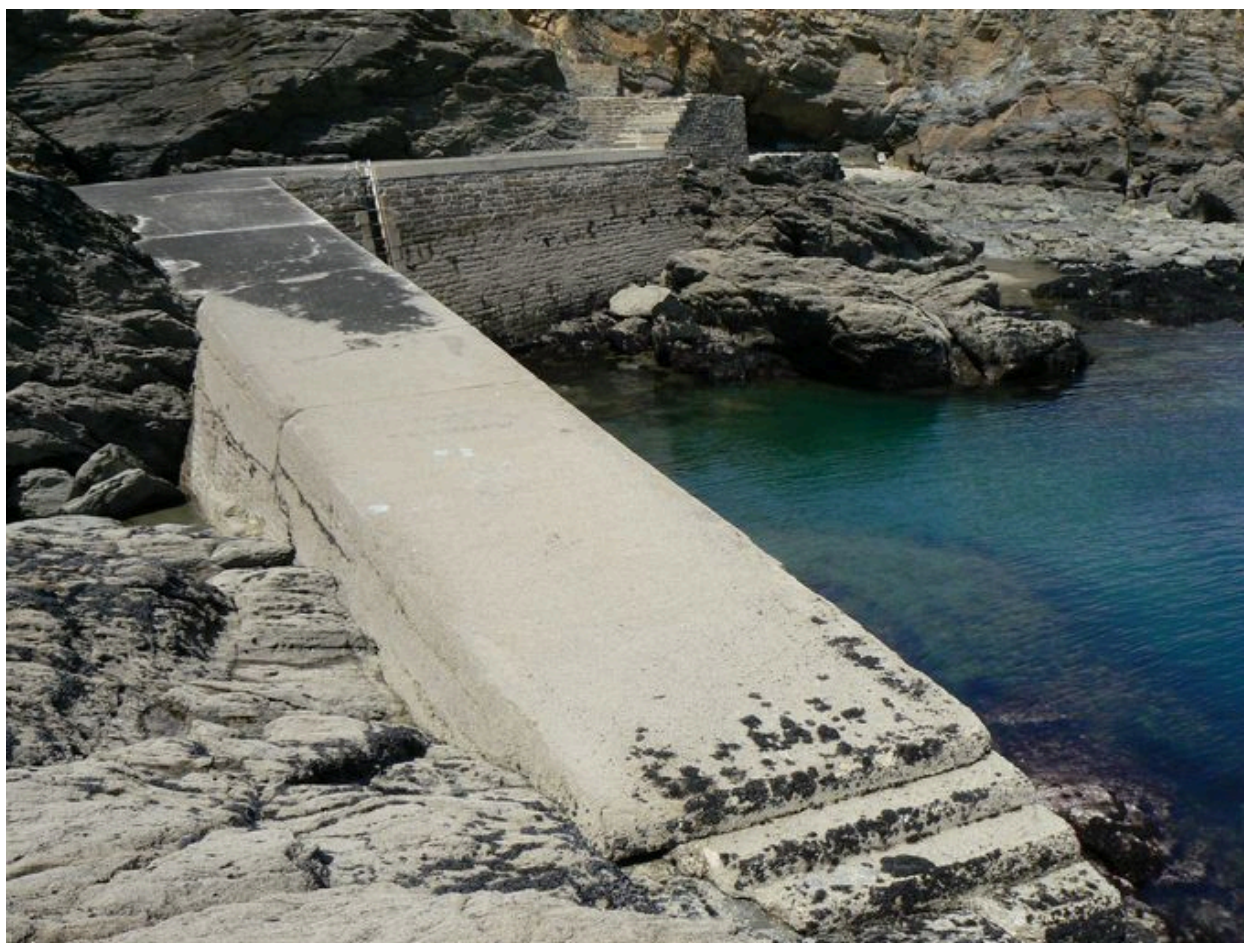
Partie inférieure de la cale des Grands-Sables