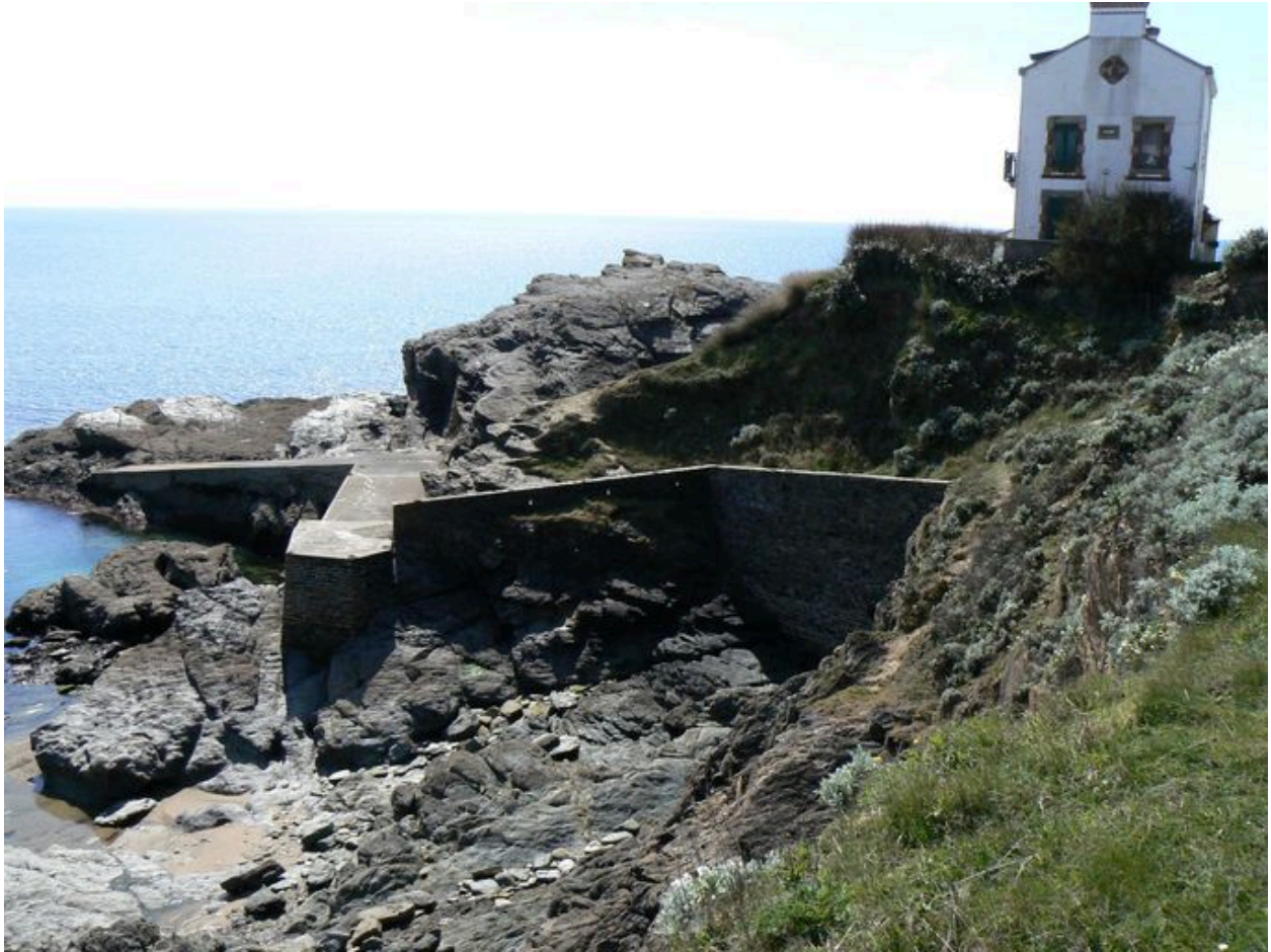
Vue générale de la cale des Grands-Sables