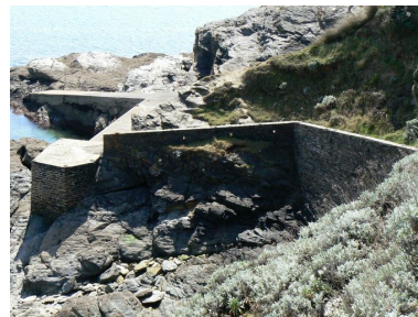
Muret protégeant le chemin d'accès à la cale et cale des Grands-Sables IVR53_20082908644NUCA