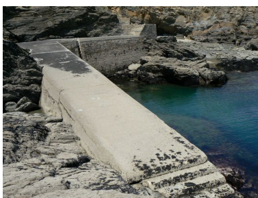
Partie inférieure de la cale des Grands-Sables IVR53_20082908646NUCA