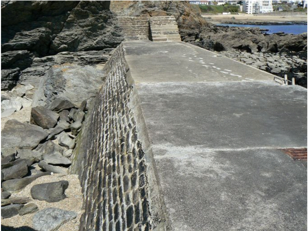
Plateforme, escalier et partie supérieure de la cale des Grands-Sables