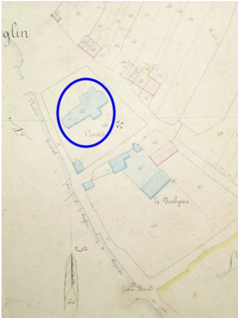
L'église sur le cadastre napoléonien ; remarquer la nef et la tour porche du 18 e siècle