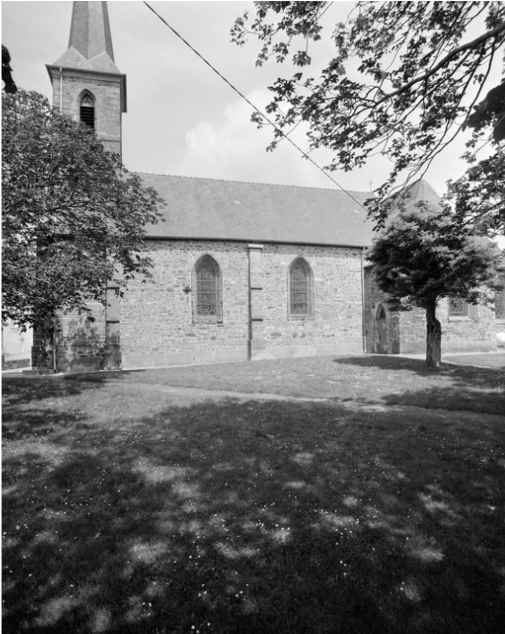
Le clocher : vue générale sud-est