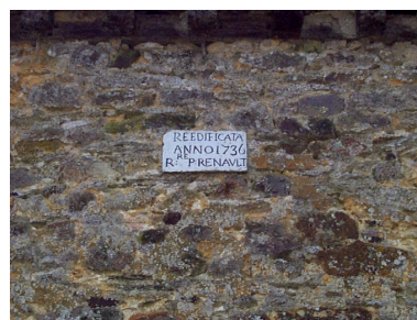
Inscription du chevet : détail IVR53_19993505394NUCA

Le clocher : vue générale sud-ouest IVR53_19993505404NUCA