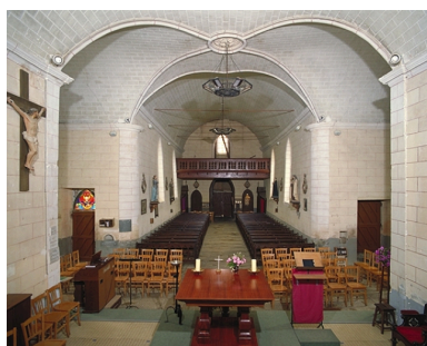
Vue intérieure prise du chœur vers la nef IVR53_19993502461XA