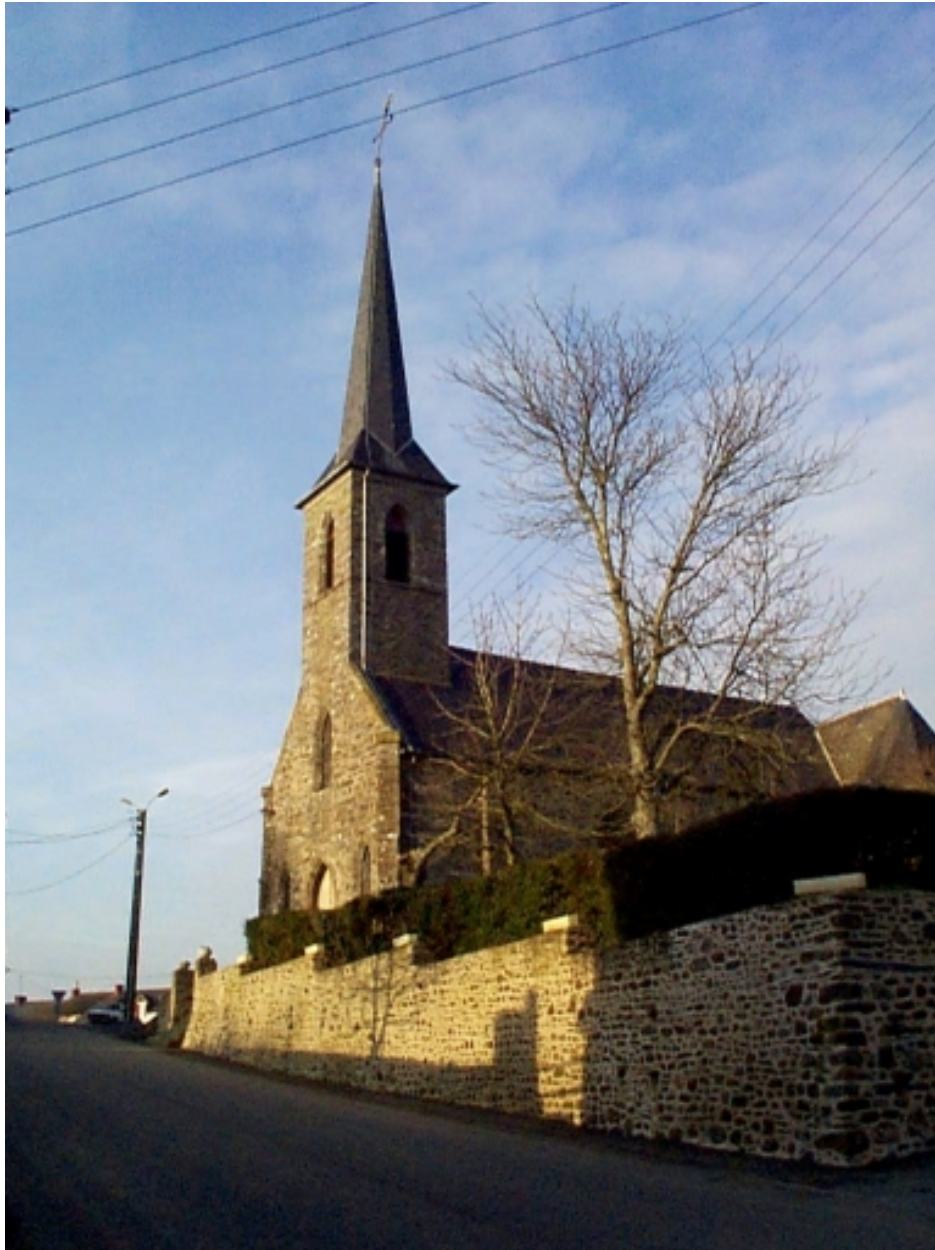
Le clocher : vue générale sud-ouest