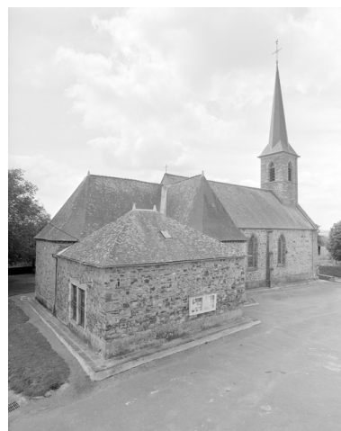
Le chevet avec la sacristie : vue générale nord-est