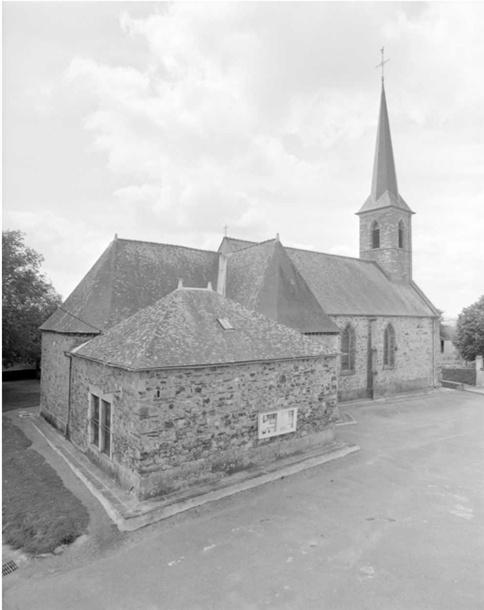
Le chevet avec la sacristie : vue générale nord-est