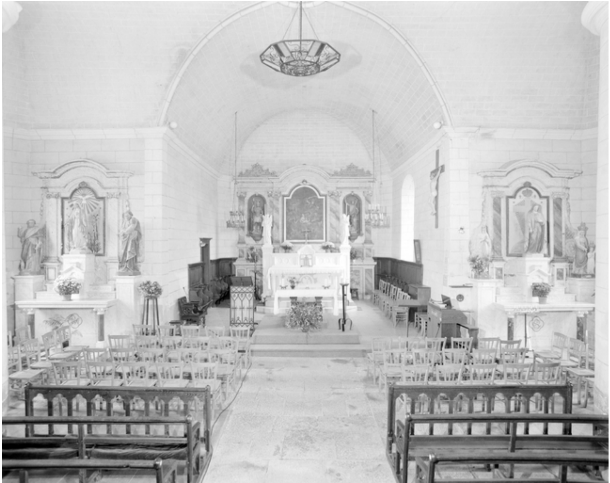
Vue intérieure prise en milieu de nef vers le chœur