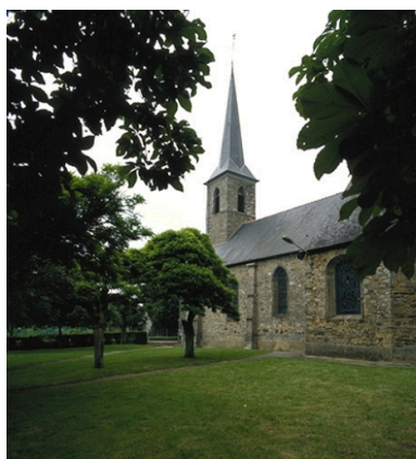
Le clocher : vue générale sud-est