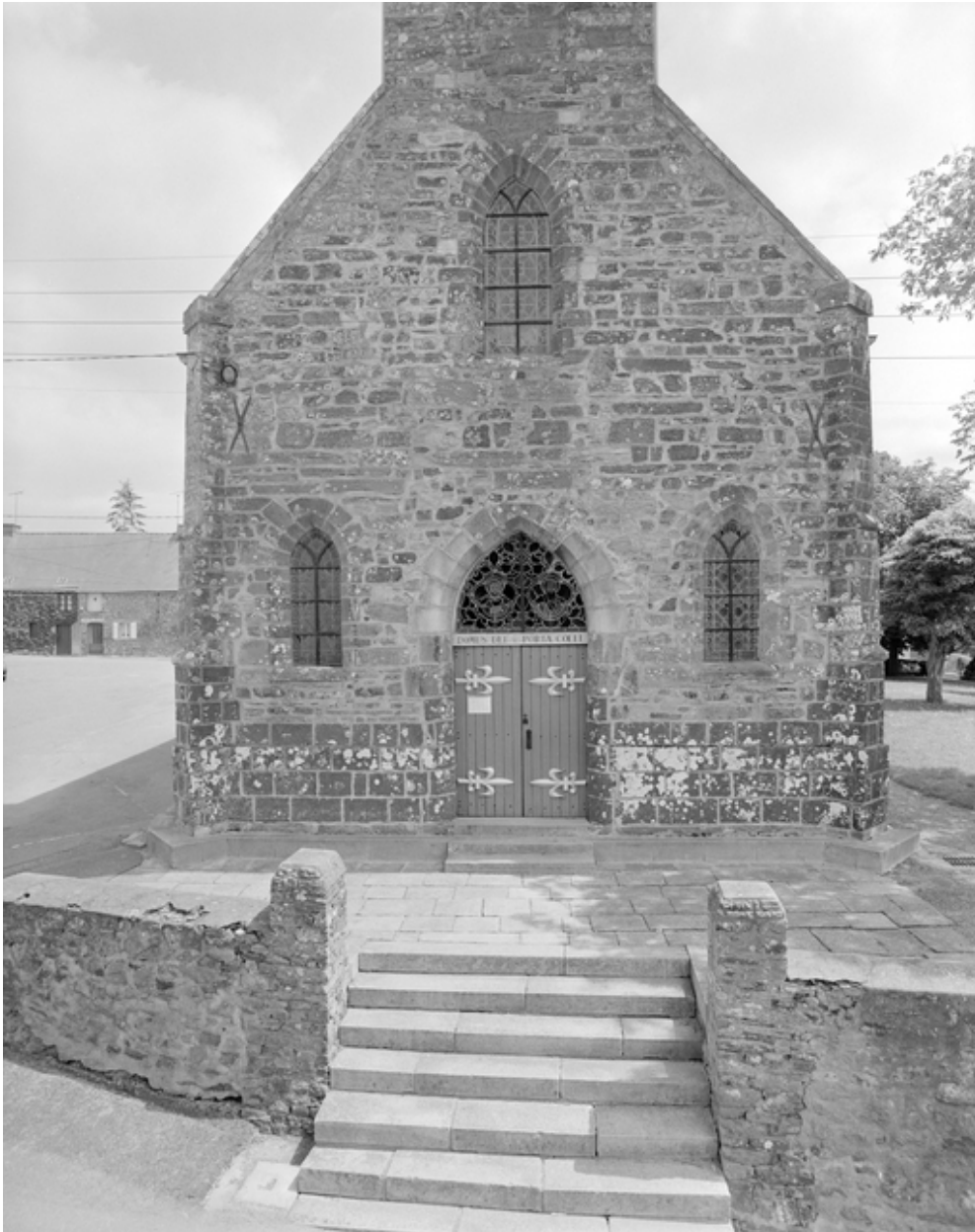
Le clocher-porche : vue partielle ouest