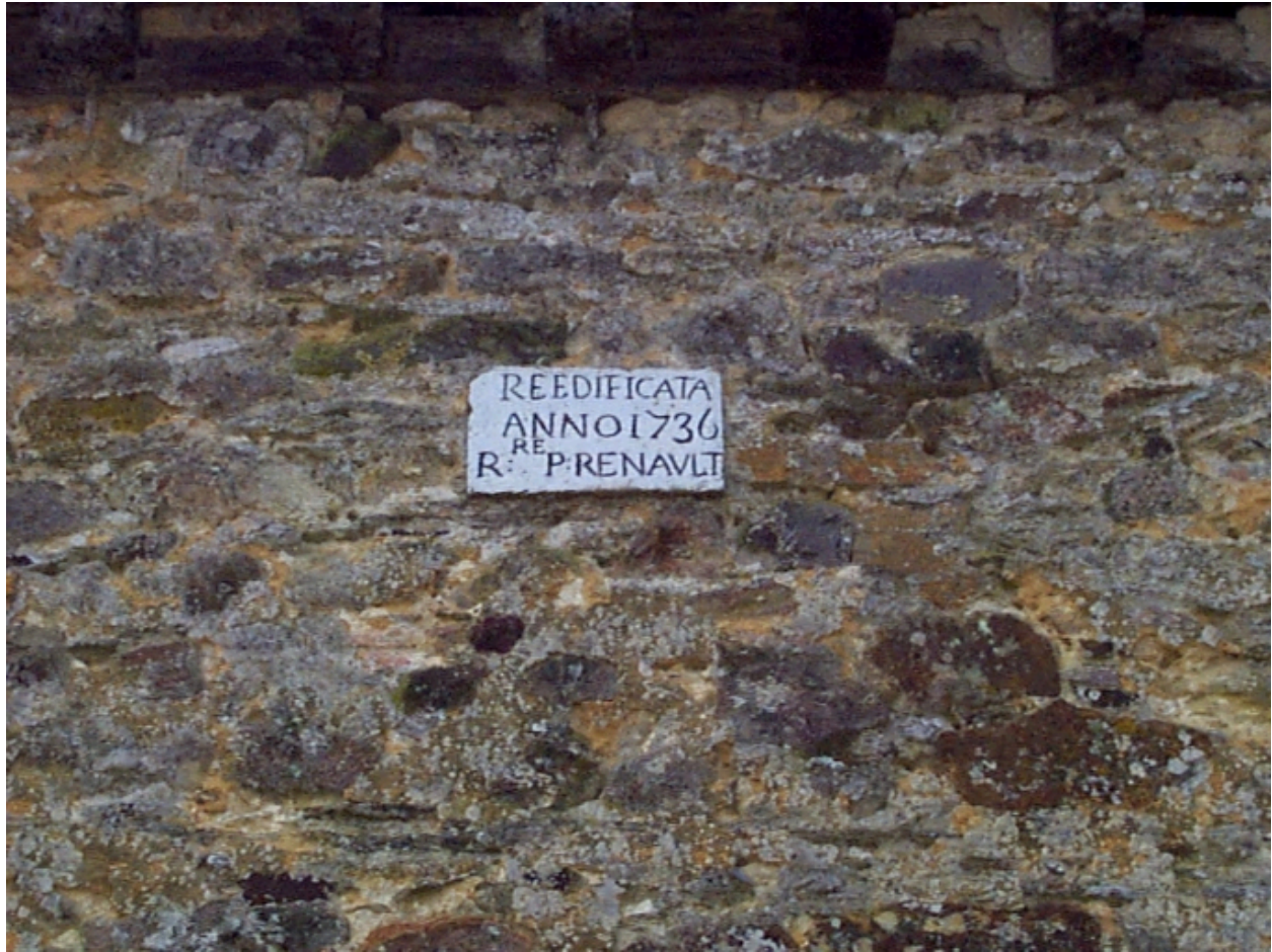
Inscription du chevet : détail