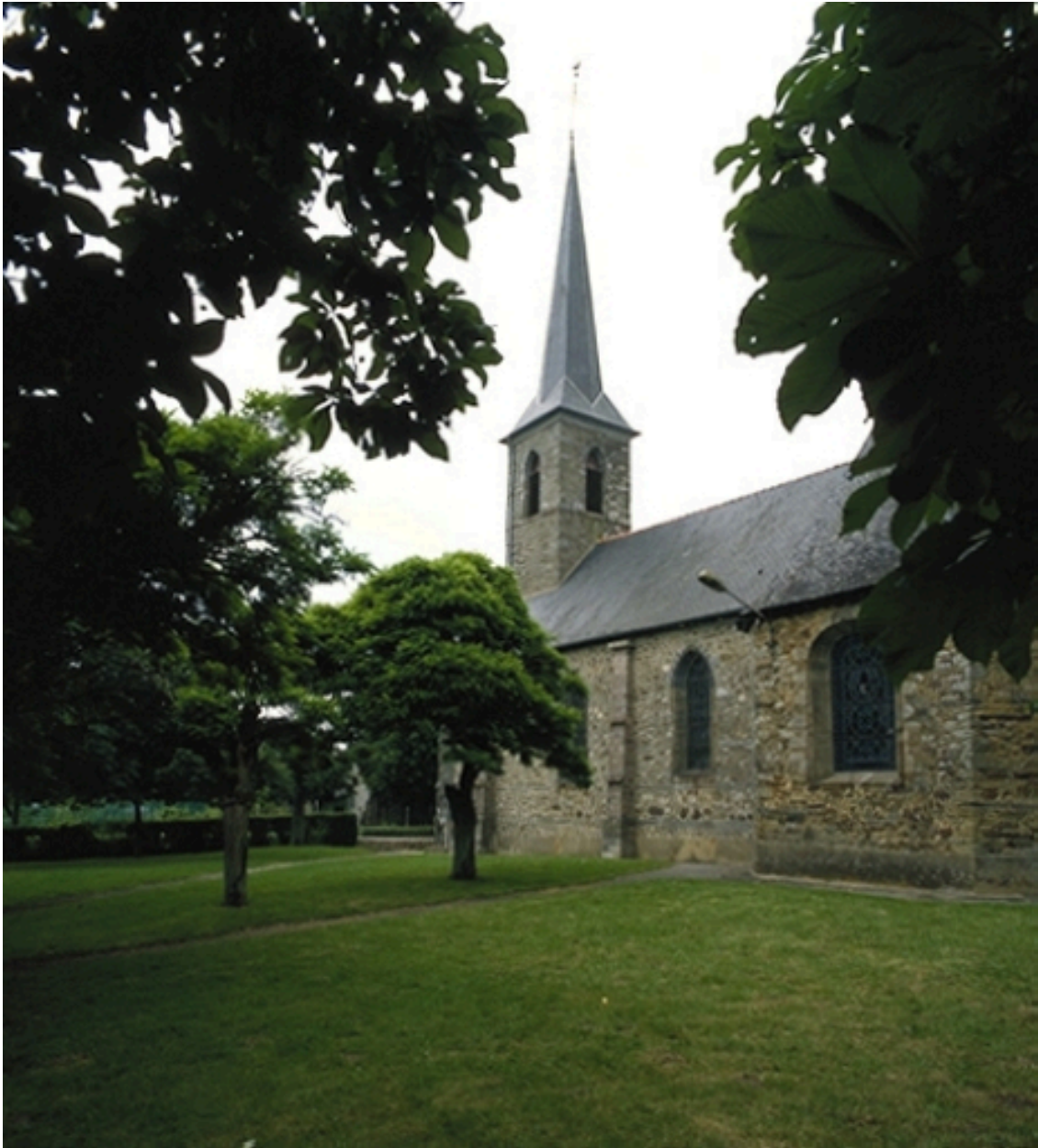
Le clocher : vue générale sud-est