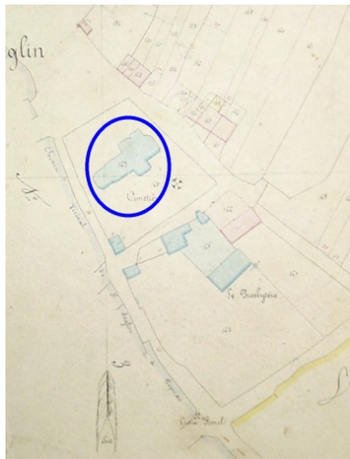
L'église sur le cadastre napoléonien ; remarquer la nef et la tour porche du 18e siècle IVR53_19993505453NUC