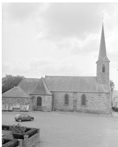
L'église : vue générale nord IVR53_19943501041X