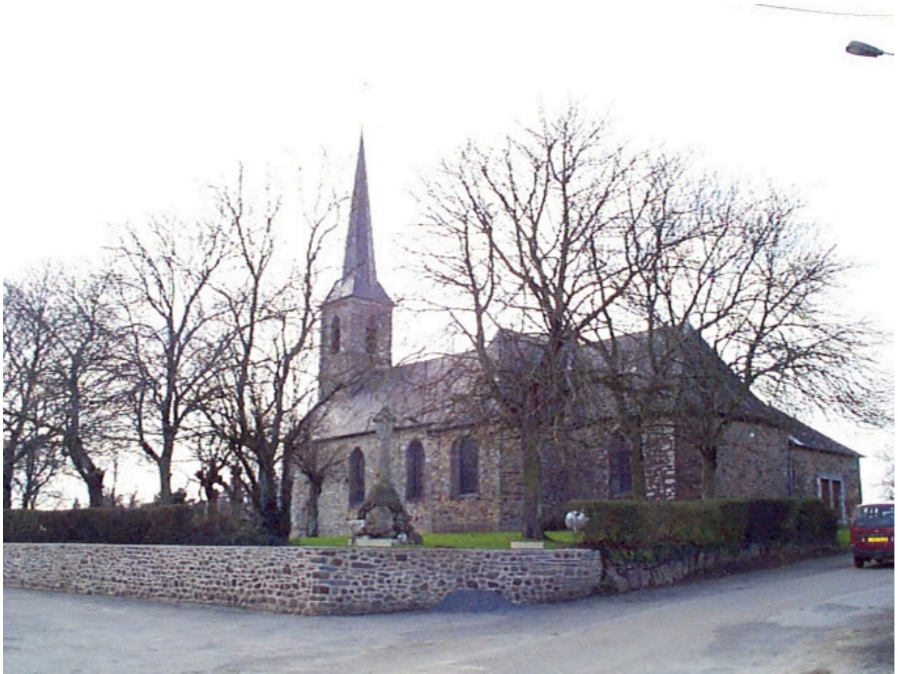
Vue générale sud est