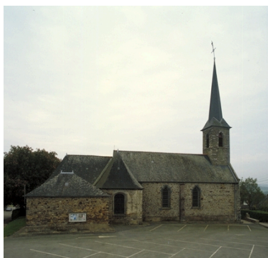
L'église : vue générale nord IVR53_19993500862XA