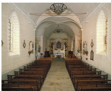
Vue intérieure prise de la nef vers le chœur IVR53_19993502460XA

IVR53_19943501044X