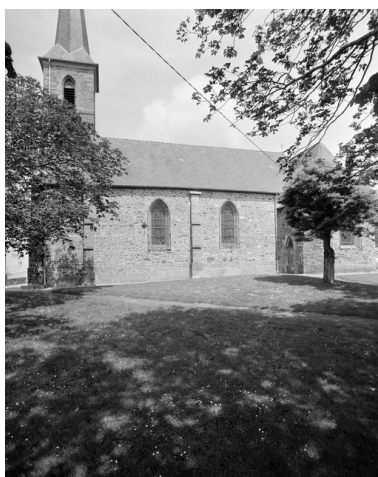
Le clocher : vue générale sud-est