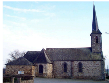
L'église : vue générale nord IVR53_19993505405NUCA