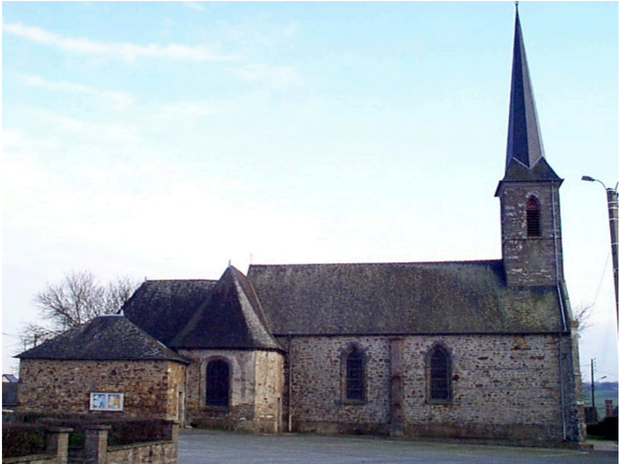
L'église : vue générale nord