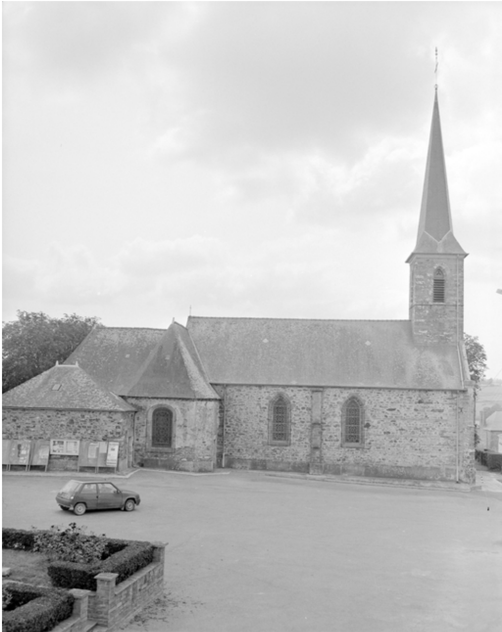
L'église : vue générale nord