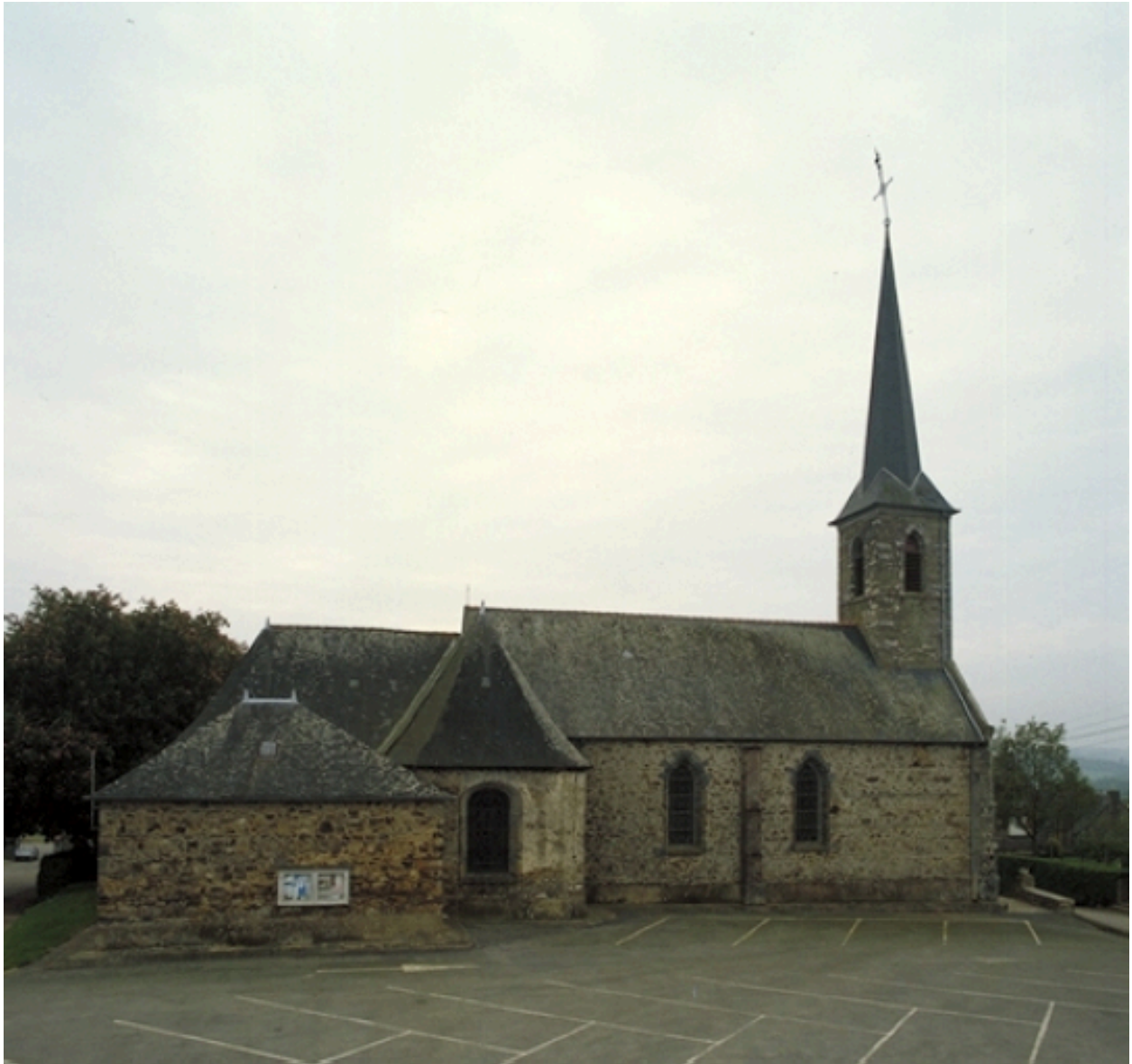
L'église : vue générale nord