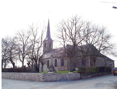
Vue générale sud est IVR53_19993505396NUCA