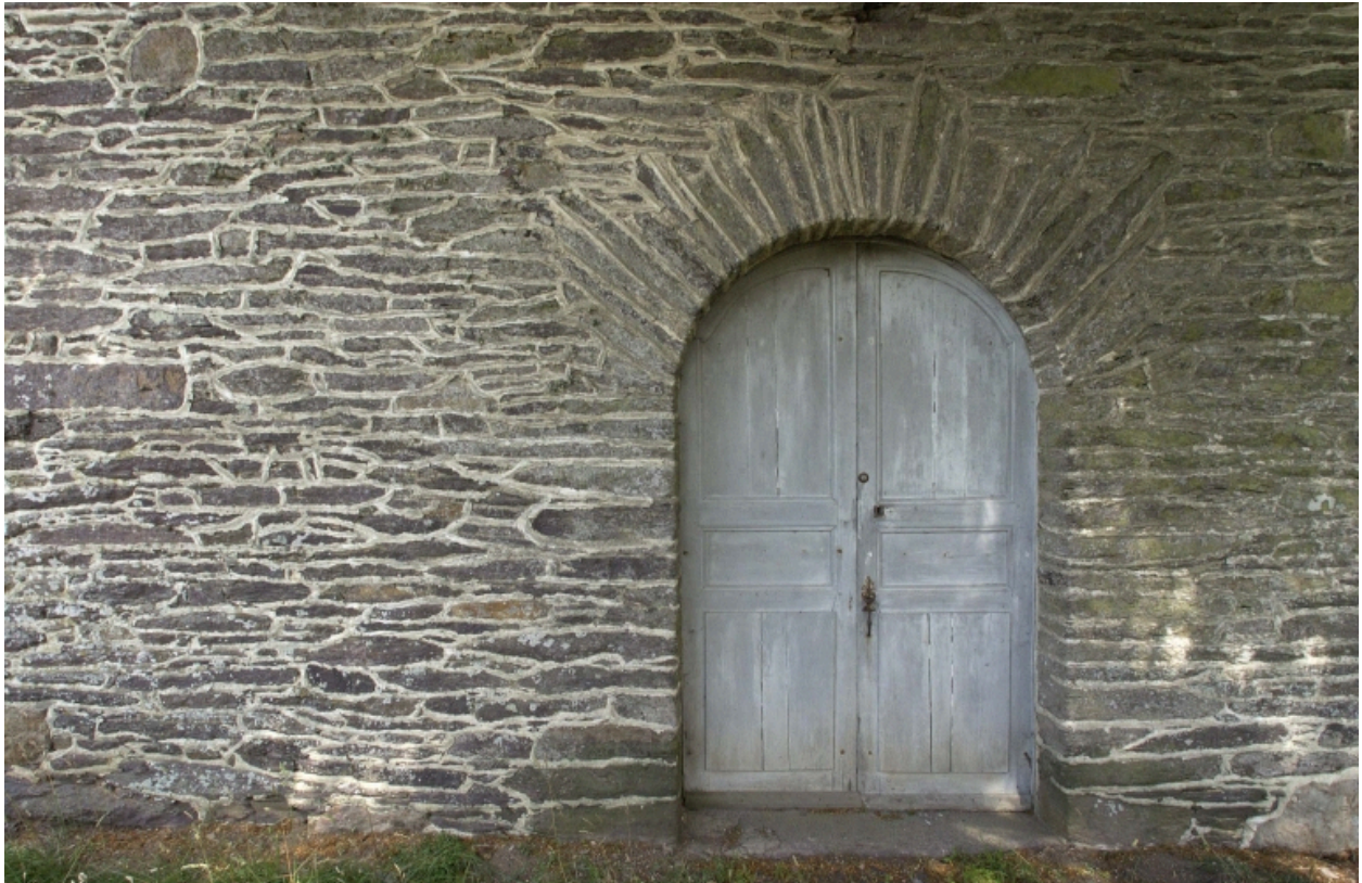
La porte occidentale : vue g n rale