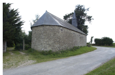
Le choeur à pans coupés : vue générale nord-est