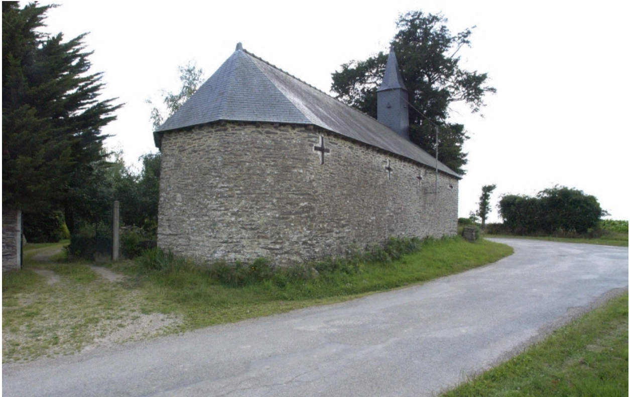
Le choeur   pans coup s : vue g n rale nord-est