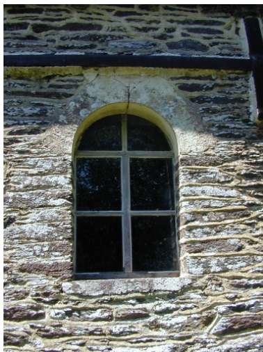
C ti re sud, premi re baie   partir de l'ouest : vue g n rale IVR53_20023510573NUCA