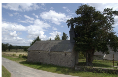
Vue de situation nord-ouest IVR53_20023503188NUCA