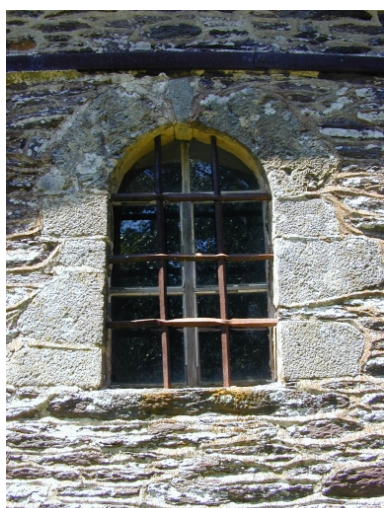
C ti re sud, ancienne baie du choeur aujourd'hui m diane : vue g n rale IVR53_20023510575NUCA