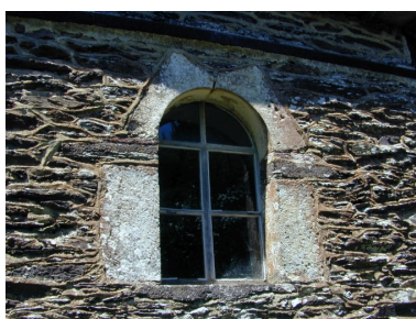
C ti re sud, baie est grav e de la date 1964 : vue g n rale IVR53_20023510576NUCA