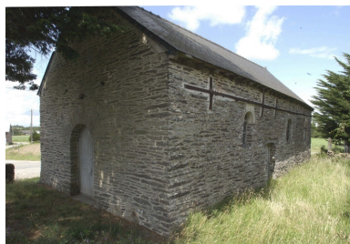
La c ti re sud : vue g n rale sud-ouest