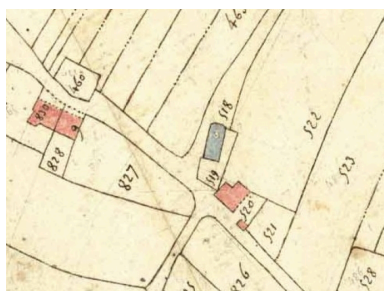
La chapelle sur le cadastre de 1823 IVR53_20023510572NUC