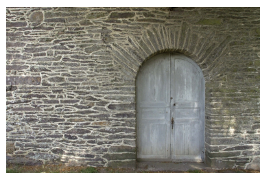
La porte occidentale : vue g n rale IVR53_20023503190NUCA