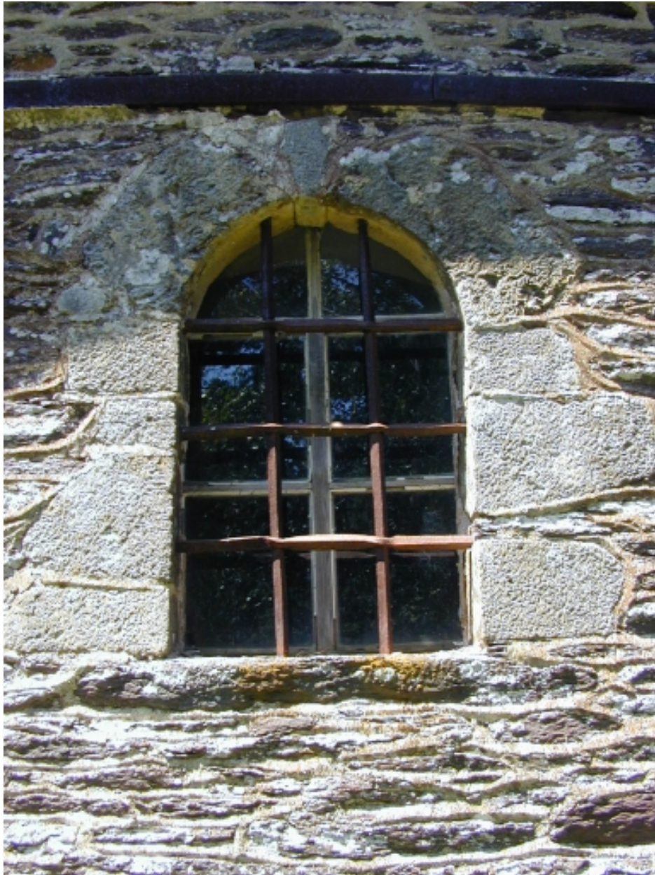
Côtière sud, ancienne baie du choeur aujourd'hui médiane : vue générale