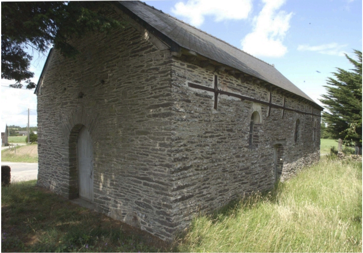
La c ti re sud : vue g n rale sud-ouest