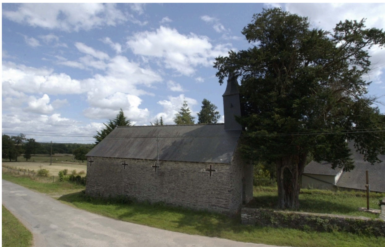
Vue de situation nord-ouest