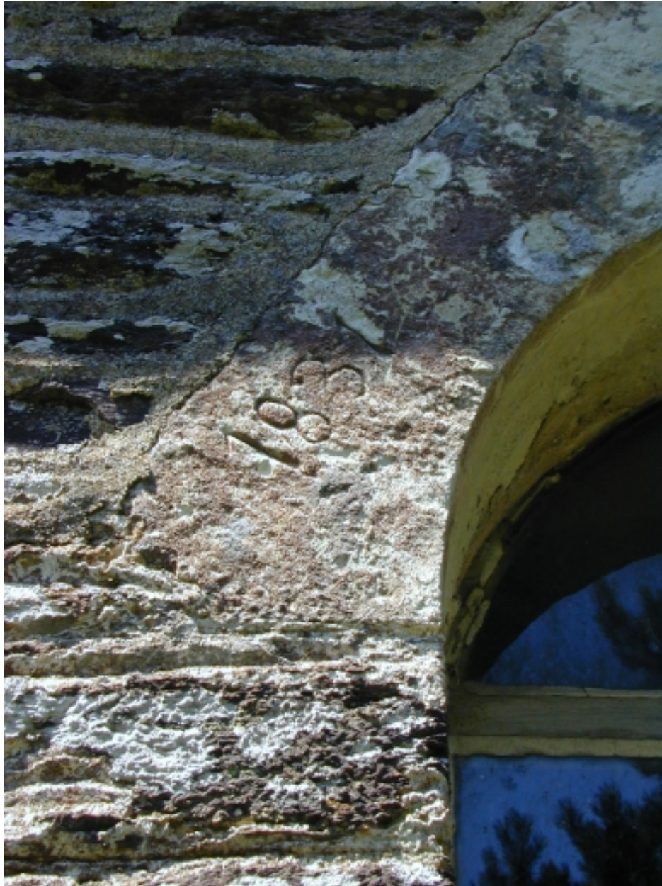
Côtière sud, première baie à partir de l'ouest : détail de la date gravée