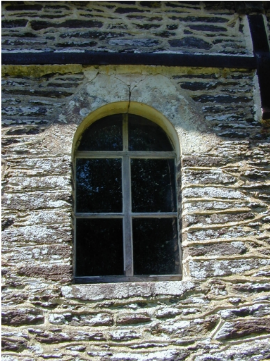
Côtière sud, première baie à partir de l'ouest : vue générale