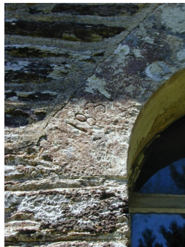
C ti re sud, premi re baie   partir de l'ouest : d tail de la date grav e IVR53_20023510574NUCA