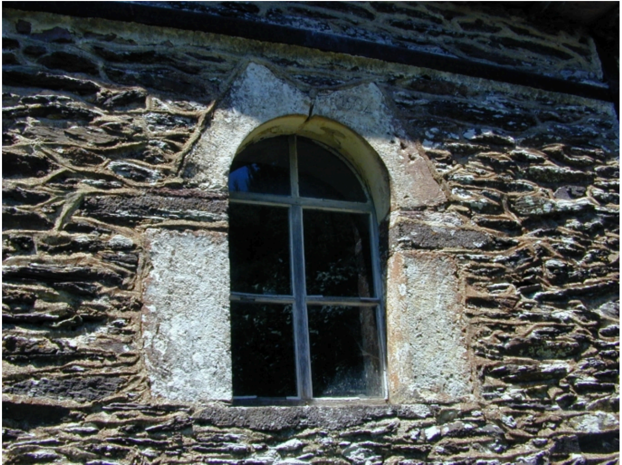
C ti re sud, baie est grav e de la date 1964 : vue g n rale