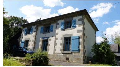
IVR53_20053519049NUCA Vue sud est, la sagerie (Hédé-Bazouges) IVR53_20243531635NUCA