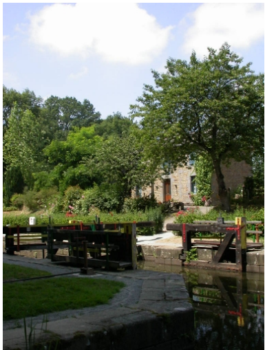
Vue générale sud-est (2005)