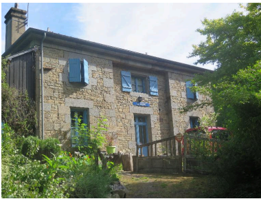
Maison éclésièrre de la Ségerie en 2017 IVR53_20173506216NUCA