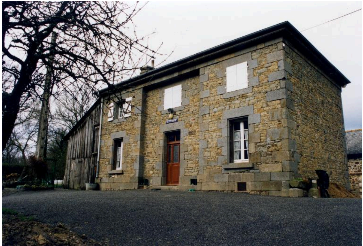
Maison éclusière, La Ségerie en 1995

IVR53_20173506252PA Date de prise de vue : 1995