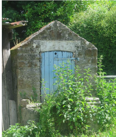
Le puits de La Sagerie IVR53_20173506217NUCA