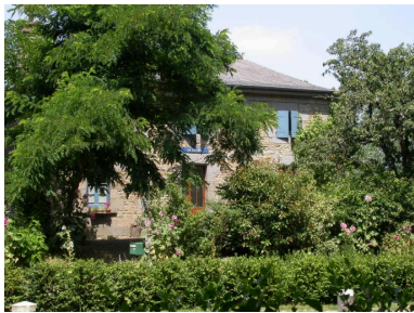
Vue sud (2005) IVR53_20053519050NUCA