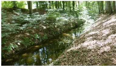
Rigole d'alimentation du canal d'Ille et Rance