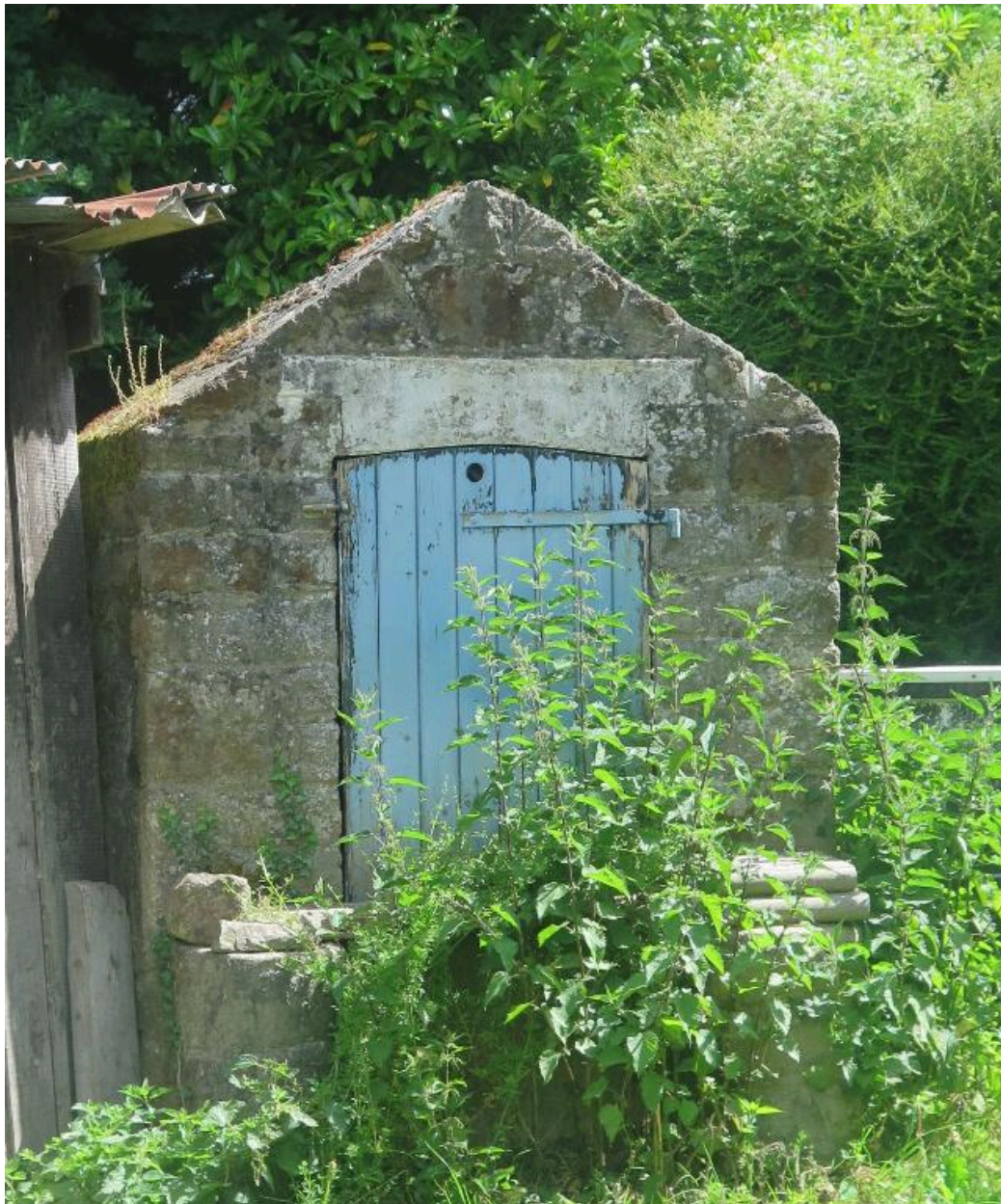
Le puits de La Ségerie