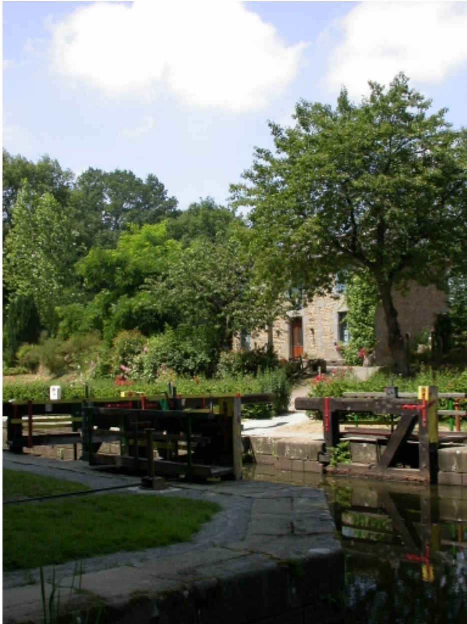
Vue générale sud-est (2005)