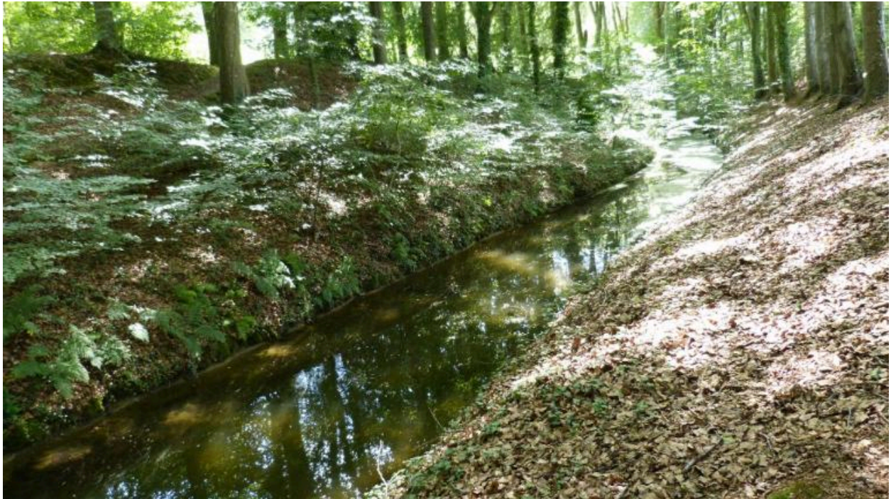
Rigole d'alimentation du canal d'Ille et Rance