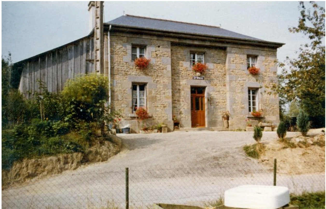
Maison éclusière de la Sagerie en 1981

IVR53_20173506253PA Date de prise de vue : 1981