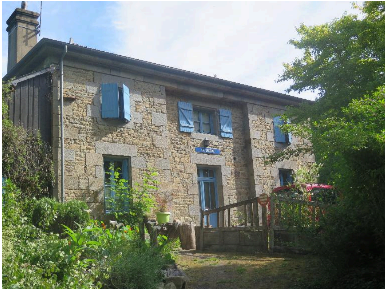
Maison éclésièrre de la Ségerie en 2017