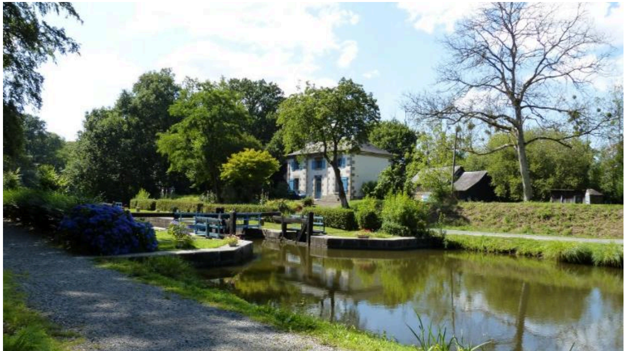
Vue d'ensemble depuis le sud est, La Sagerie (Hédé-Bazouges)