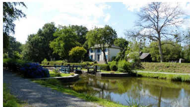
Vue d'ensemble depuis le sud est, La Sagerie (Hédé-Bazouges) IVR53_20243531633NUCA