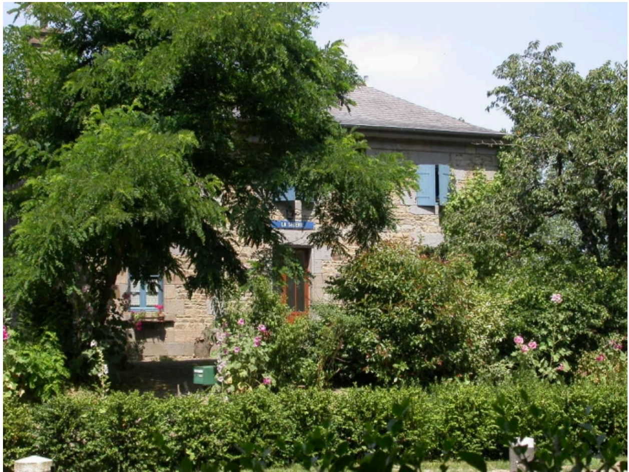
Vue sud (2005)