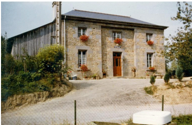
Maison éclésièrre de la Ségerie en 1981 IVR53_20173506253PA