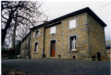
Maison éclésièrre, La Ségerie en 1995 IVR53_20173506252PA