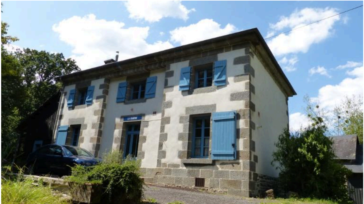
Vue sud est, la sagerie (Hédé-Bazouges)