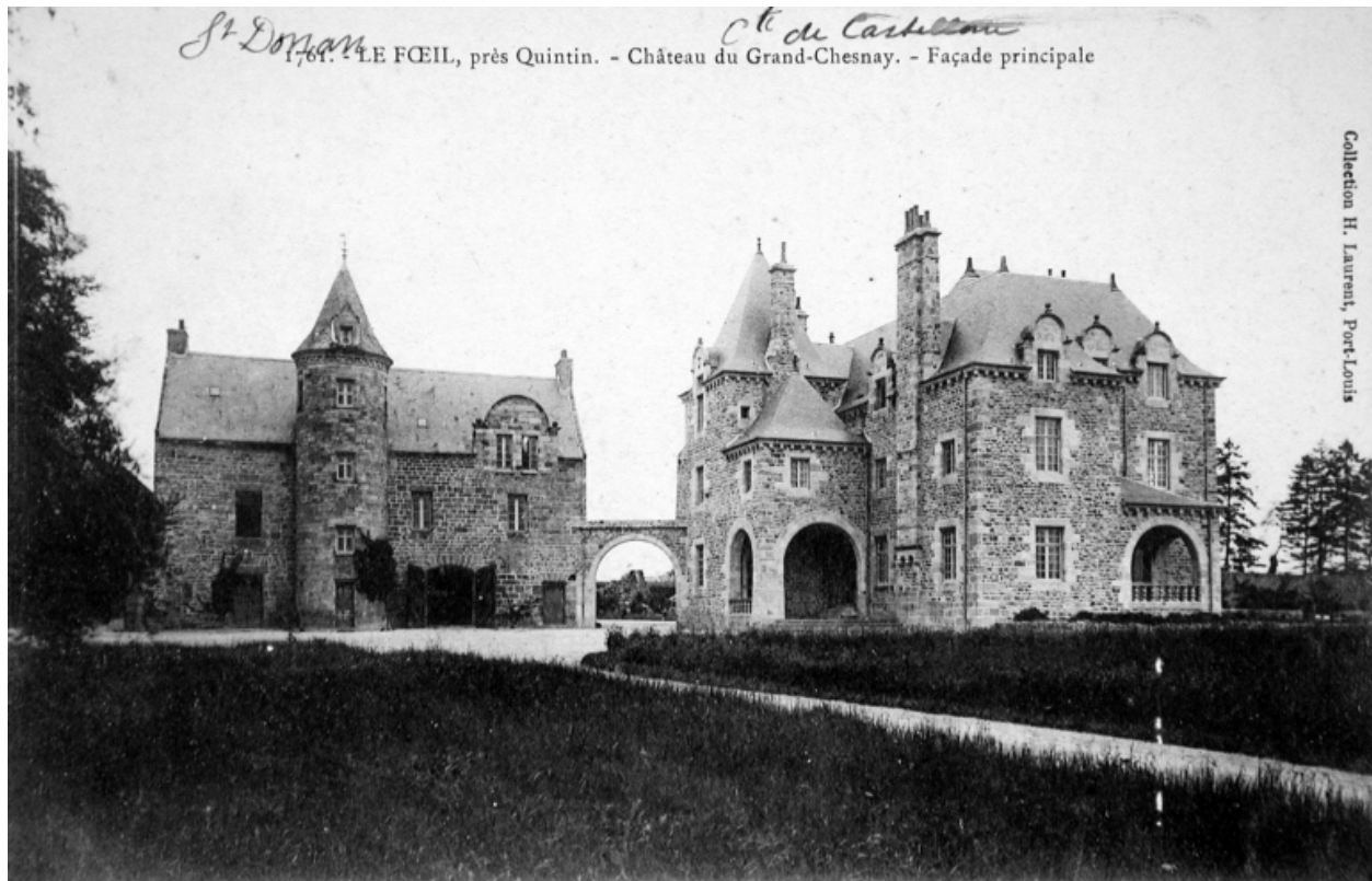
Vue générale : le manoir et le château