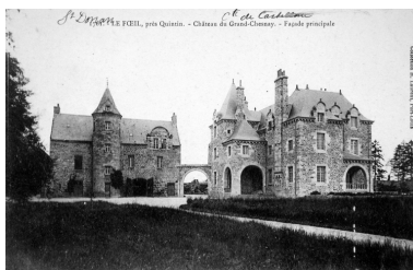
Vue générale : le manoir et le château IVR53_20042208987NUCB

IVR53_20052205029NUCA