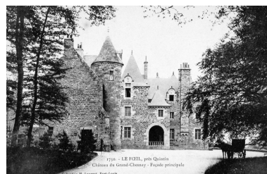
Château : élévation antérieure IVR53_20042208984NUCB