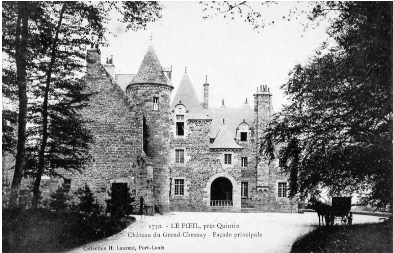
Château : élévation antérieure