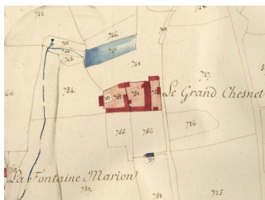
Le Grand Chesnet sur le cadastre de 1812

Repro. Archives départementales d'Ille-et-Vilaine IVR53_20052205029NUCA