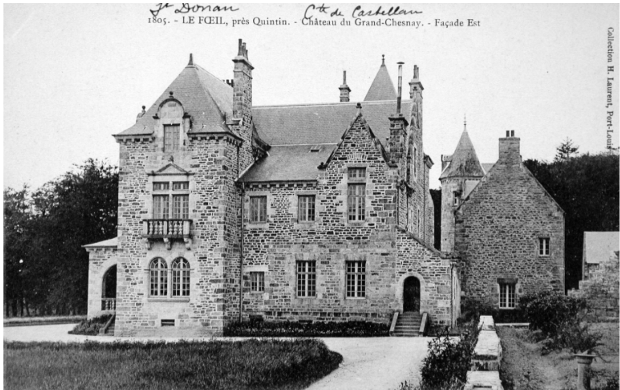
Château : élévations est