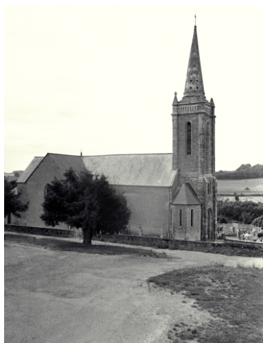
Elévation nord : vue générale