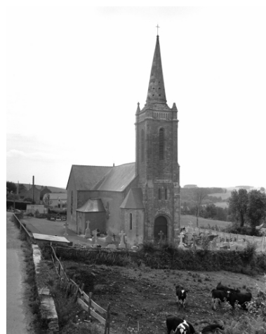
Elévation ouest : vue générale, IVR53_19943501747X