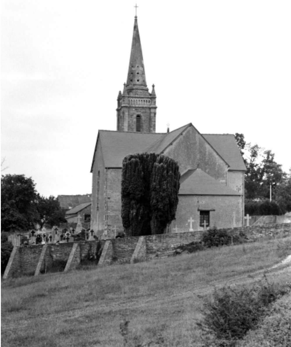
Vue générale est de l'église avec son enclos