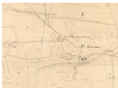
Vue de situation sur le cadastre de 1831 IVR53_20003510225NUC