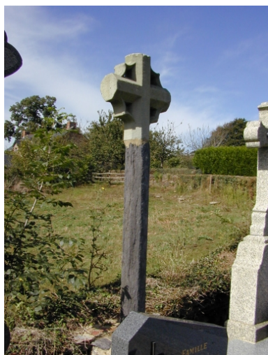
La croix de cimetière ; le fût est en schiste pourpre, la croix est en grès