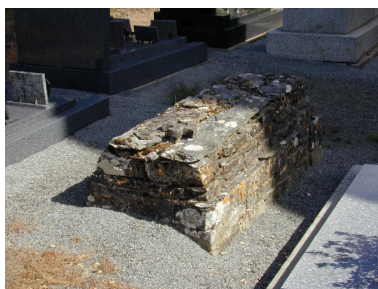
Tombe en dalles de schiste IVR53_20003510147NUCA