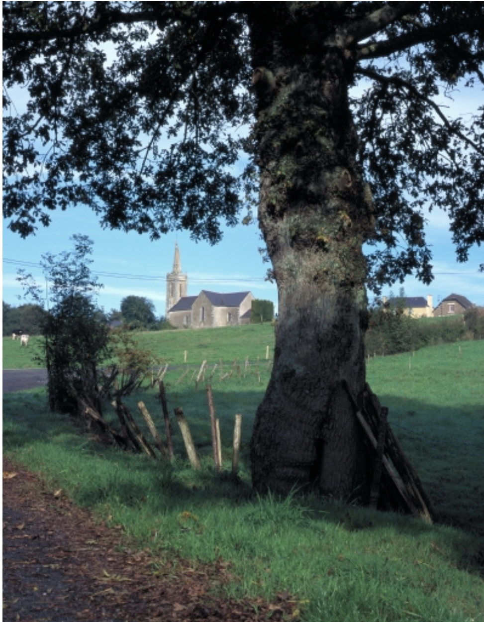
Vue de situation depuis le sud