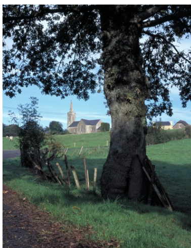
Vue de situation depuis le sud IVR53_20003502534XA