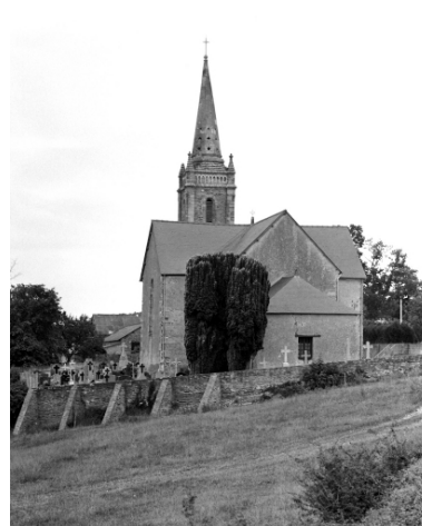
Vue générale est de l'église avec son enclos