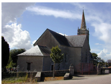
Vue générale est de l'église avec son enclos IVR53_20003510145NUCA