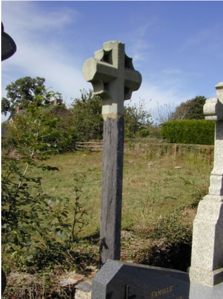
La croix de cimetière ; le fût est en schiste pourpre, la croix est en grès