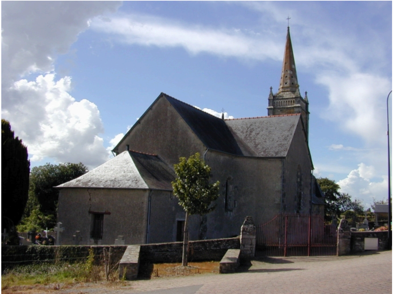
Vue générale est de l'église avec son enclos