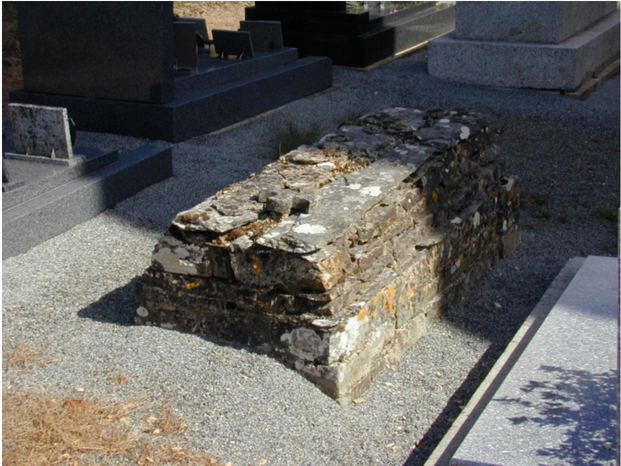
Tombe en dalles de schiste