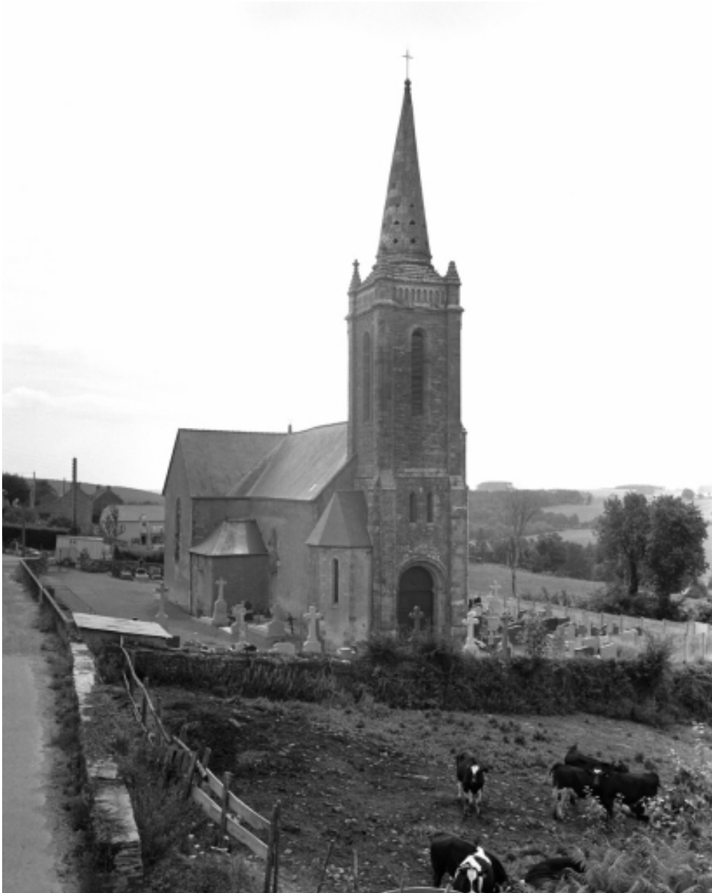
Elévation ouest : vue générale