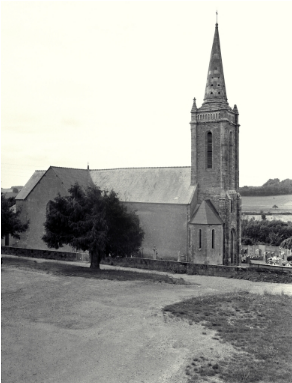
Elévation nord : vue générale