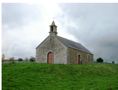
Poullaouen, chapelle Saint- Victor : vue générale sud-ouest IVR53_20082905796NUCA