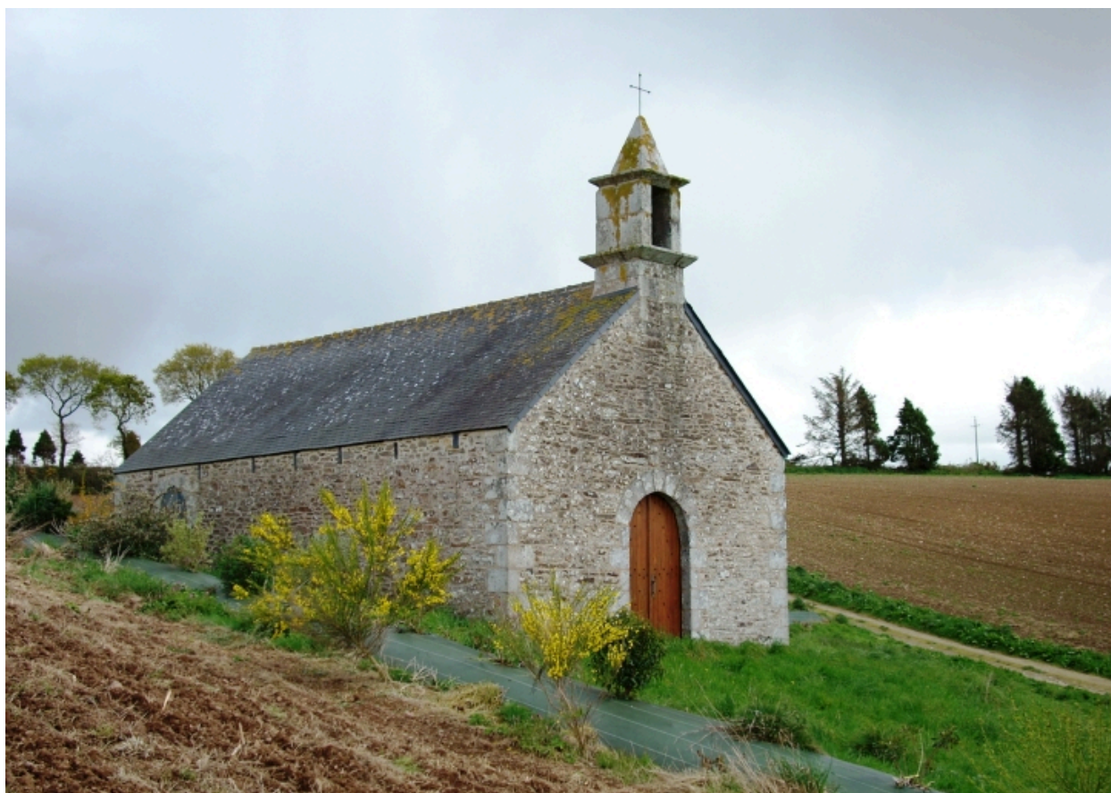
Poullaouen, chapelle Saint-Victor : vue générale nord-ouest