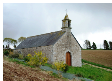
Poullaouen, chapelle Saint- Victor : vue générale nord-ouest