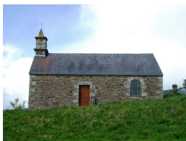
Poullaouen, chapelle Saint- Victor : élévation sud IVR53_20082905798NUCA