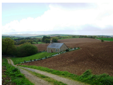
Poullaouen, chapelle Saint-Victor : vue de situation depuis le sud-est IVR53_20082905795NUCA