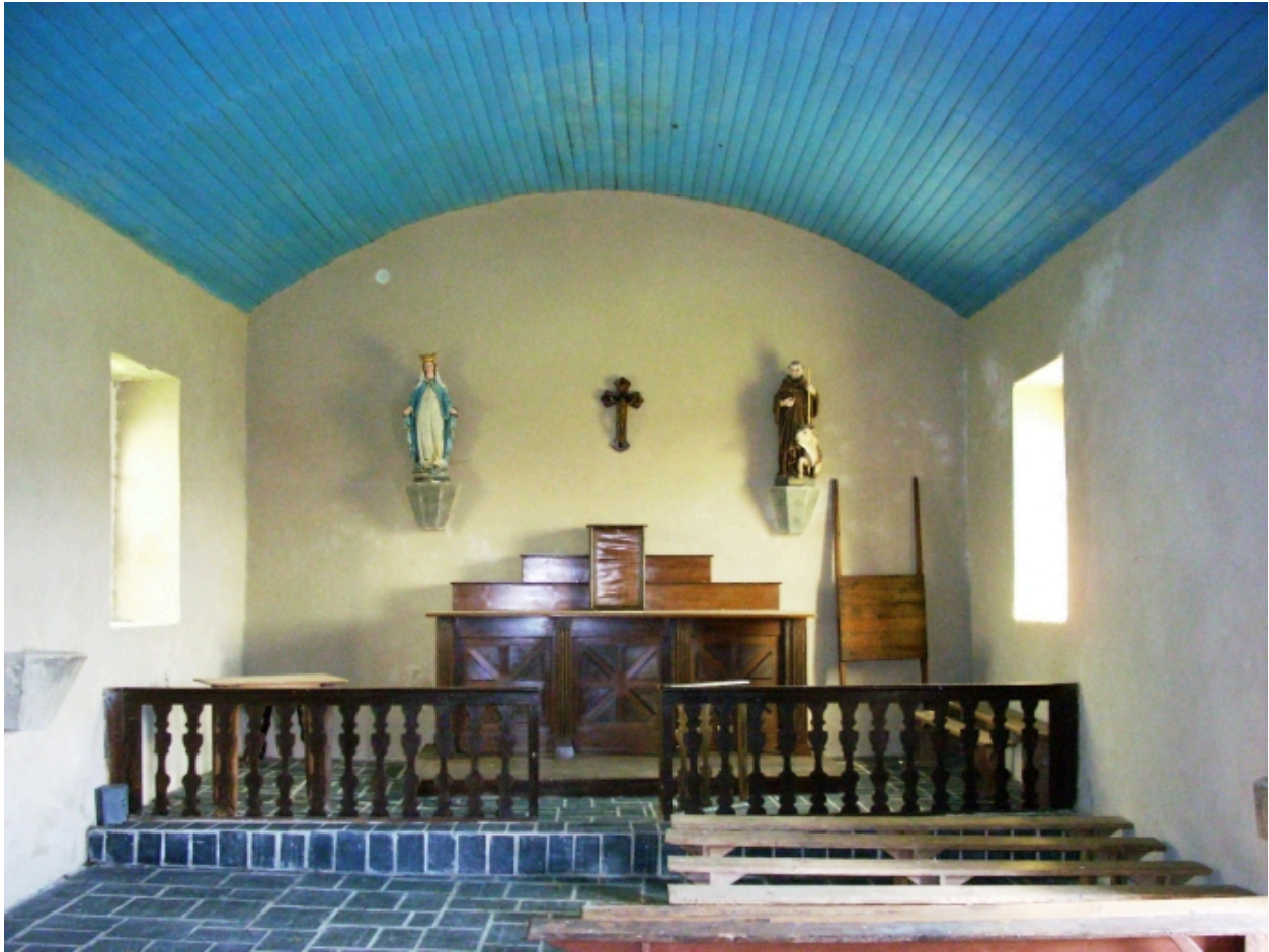
Poullaouen, chapelle Saint-Victor : vue axiale est