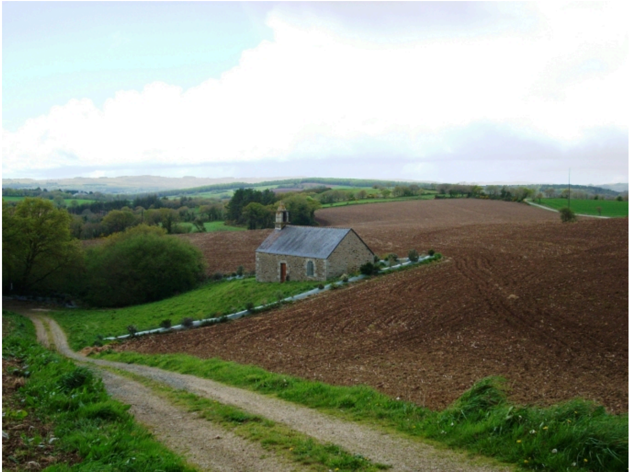
Poullaouen, chapelle Saint-Victor : vue de situation depuis le sud-est