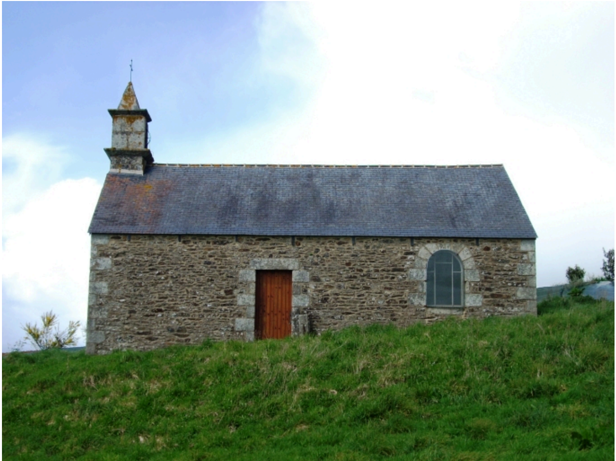
Poullaouen, chapelle Saint-Victor : élévation sud