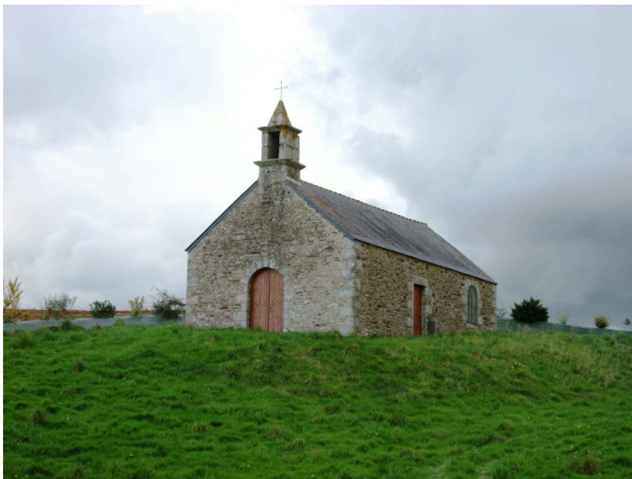
Poullaouen, chapelle Saint-Victor : vue générale sud-ouest