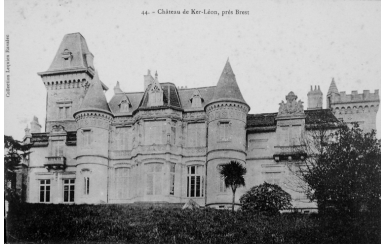
Vue générale IVR53_20042905509NUCB