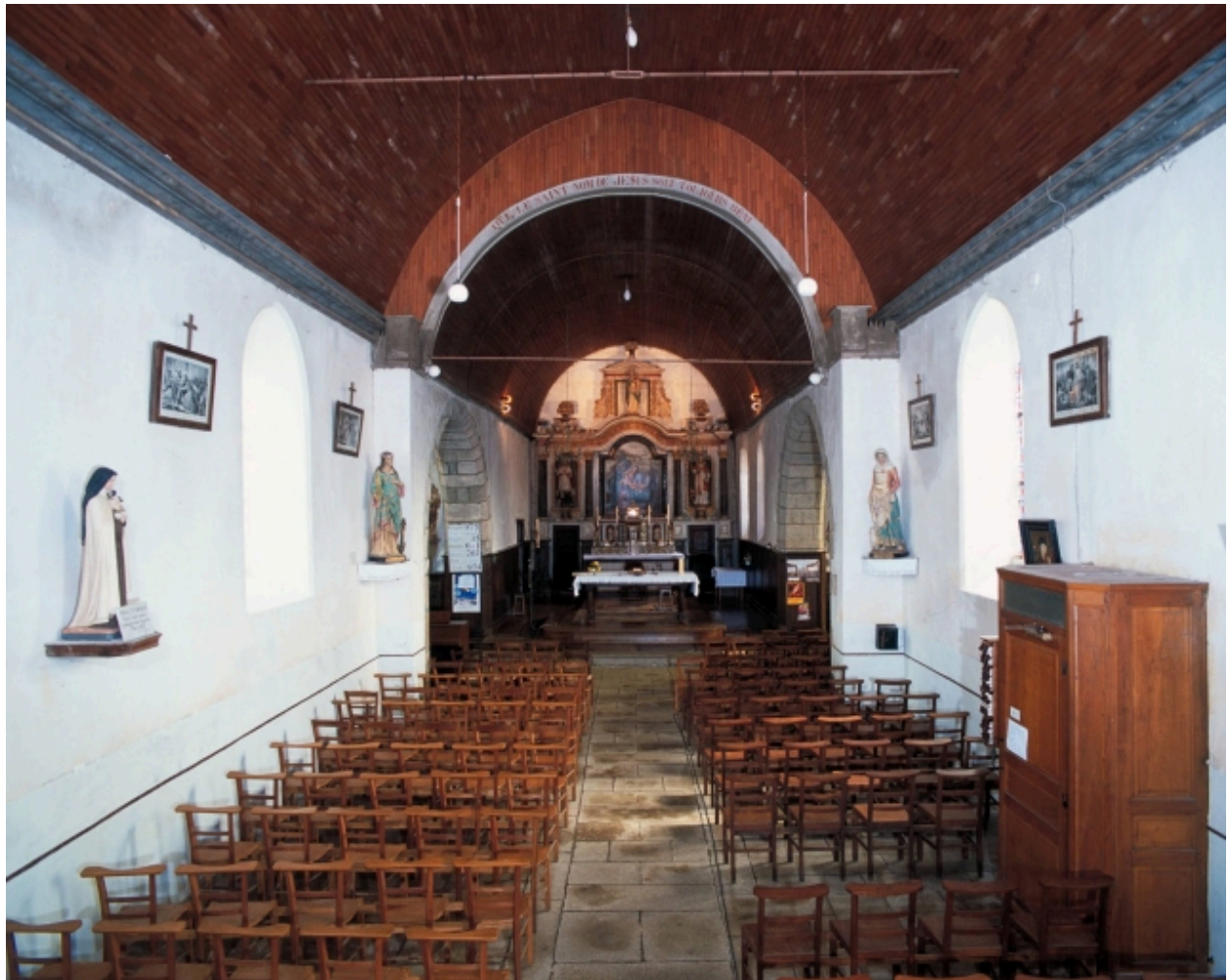
Vue générale vers le chœur