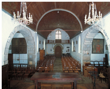
Vue générale vers la nef