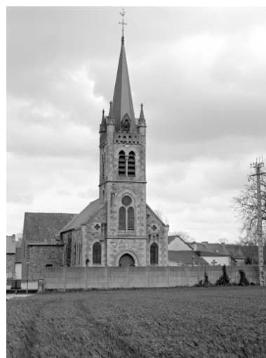
Elévation ouest ; vue générale IVR53_19943500831X