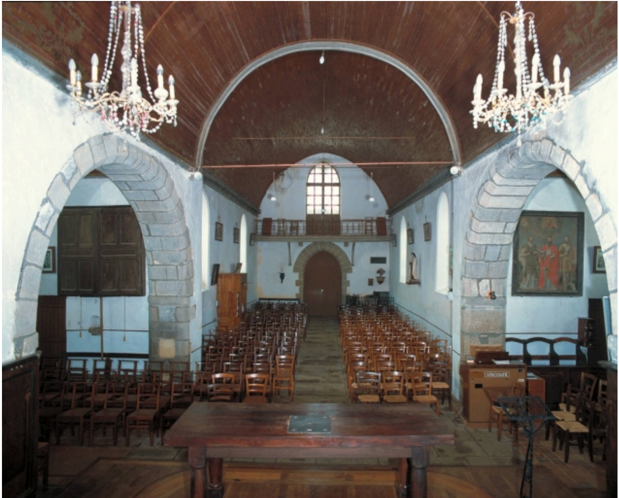
Vue générale vers la nef