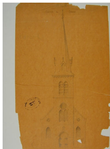
Le clocher-porche