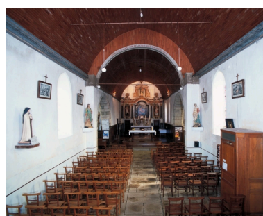
Vue générale vers le chœur IVR53_20013500516XA