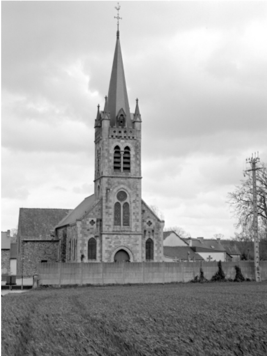
Elévation ouest ; vue générale