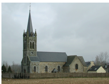
Vue de situation sud-ouest IVR53_20013506265NUCA