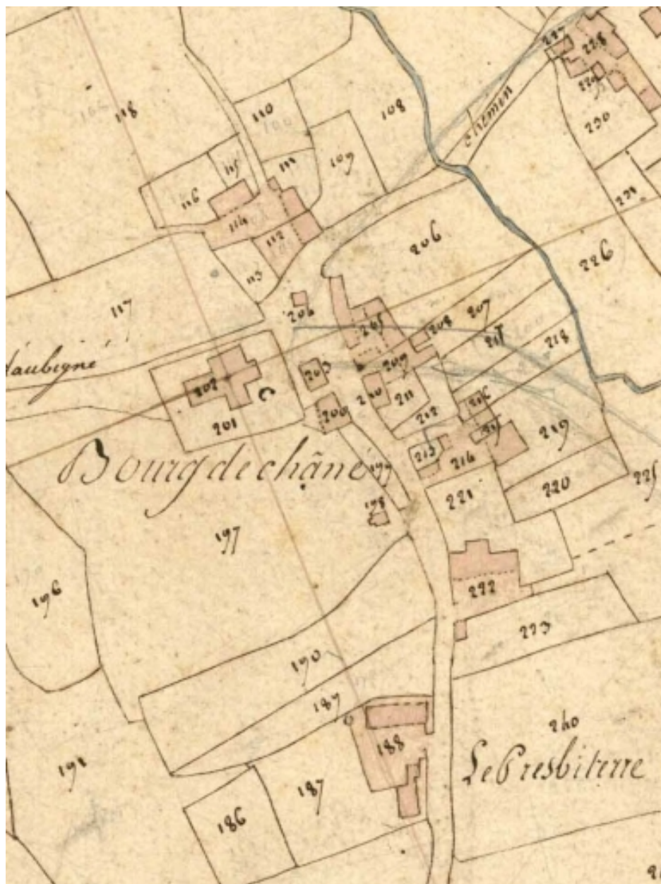
L'église sur le cadastre napoléonien