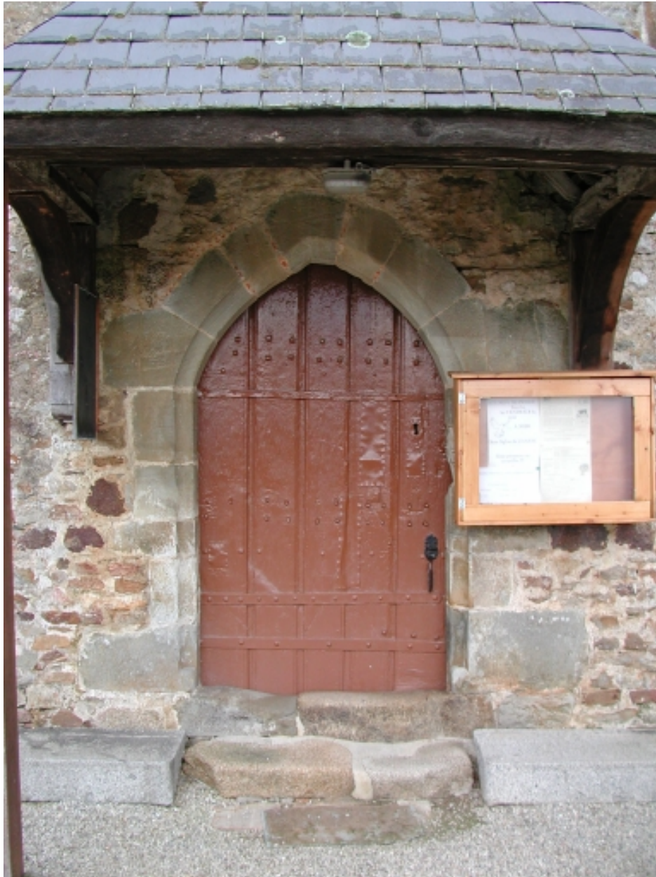
Détail ; élévation sud, porte