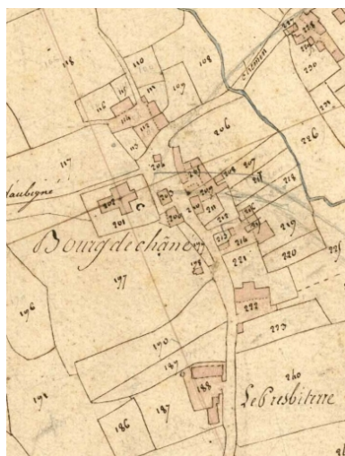
L'église sur le cadastre napoléonien IVR53_20013506436NUC