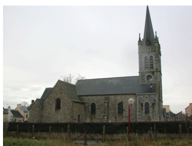
Vue générale nord IVR53_20013506266NUCA