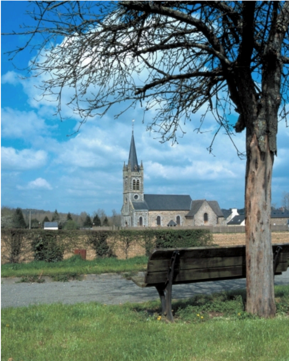
Vue de situation sud-ouest