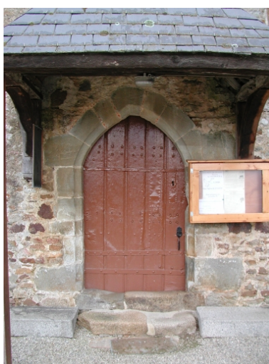
Détail ; élévation sud, porte