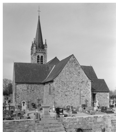
Elévation est ; vue générale IVR53_19943500777X