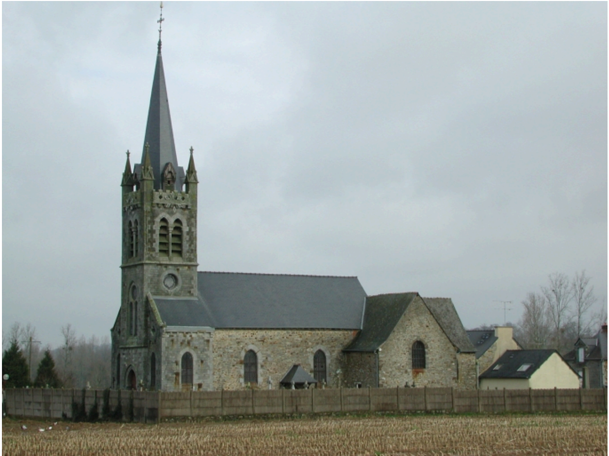
Vue de situation sud-ouest