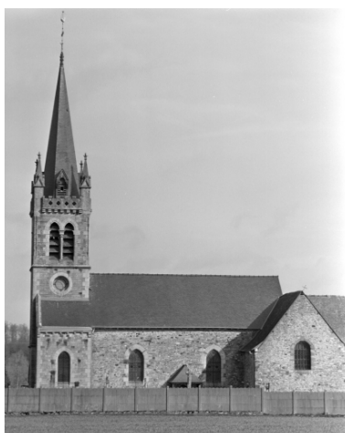
Elévation sud, partie ouest ; vue générale IVR53_19943500775X