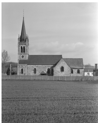
Elévation sud ; vue générale IVR53_19943500776X