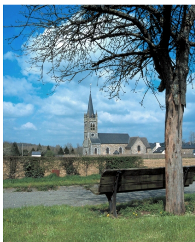
Vue de situation sud-ouest