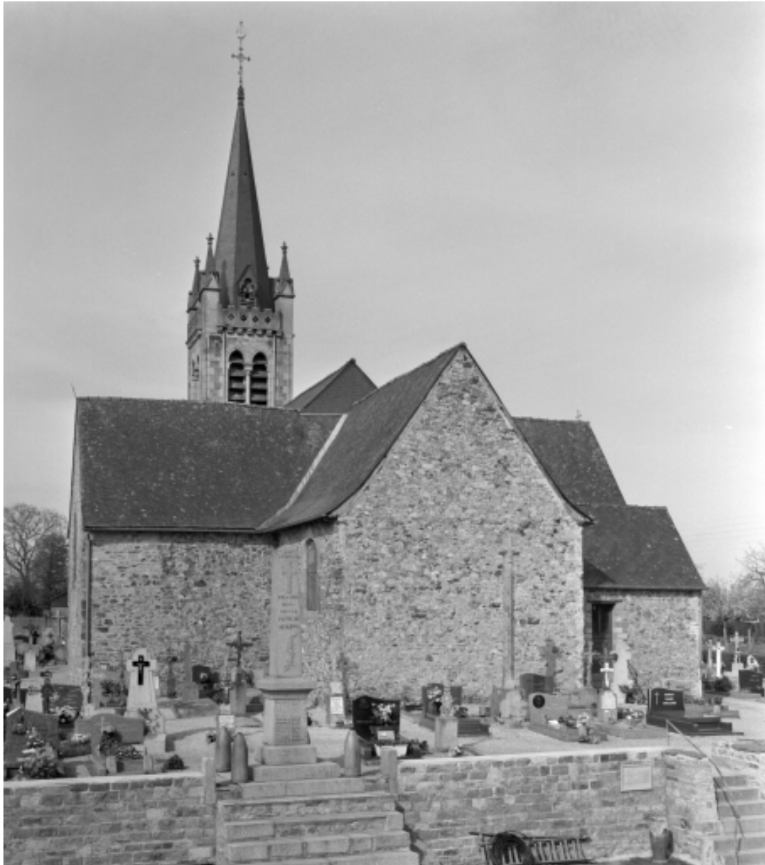
Elévation est ; vue générale