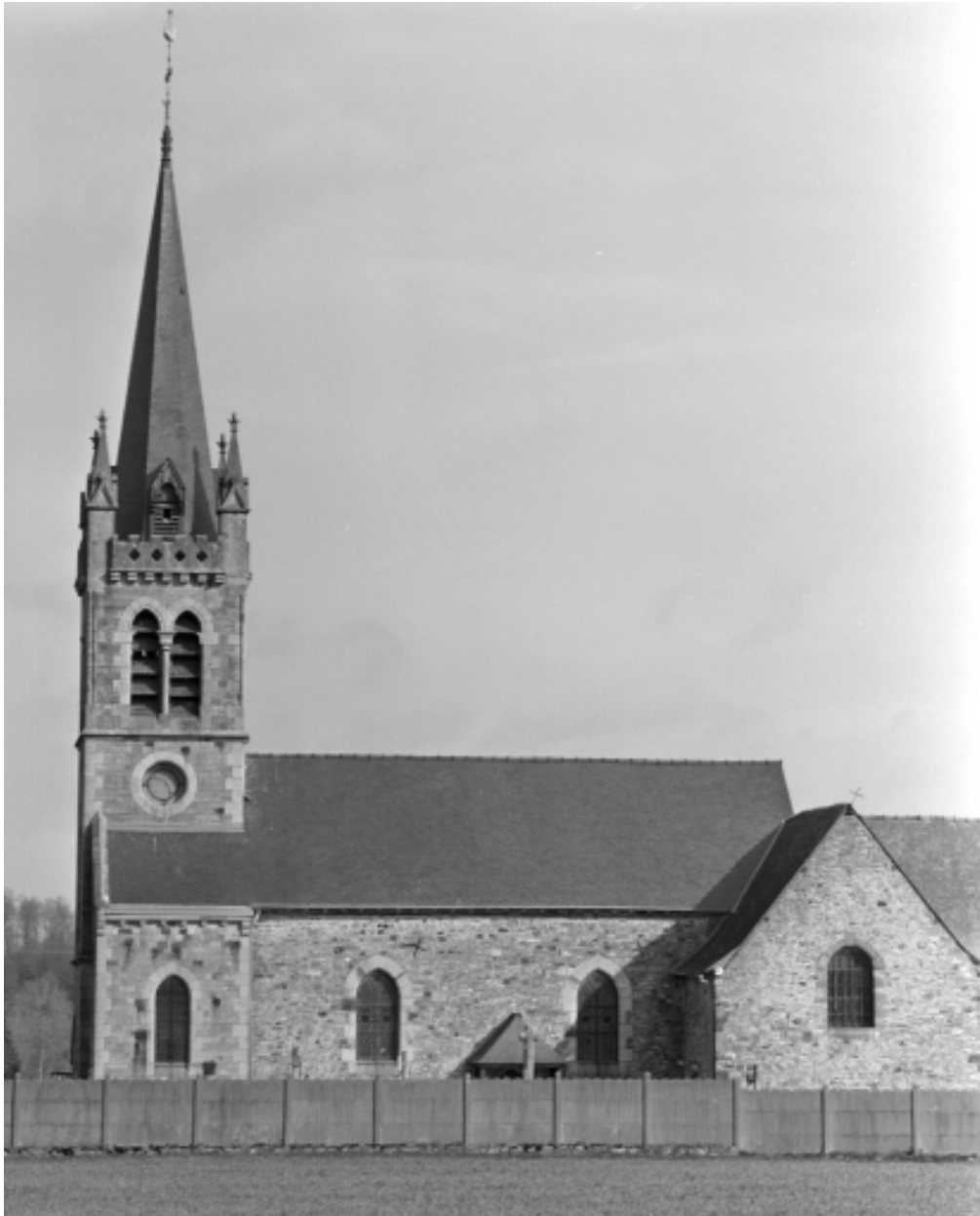
El vation sud, partie ouest ; vue g n rale