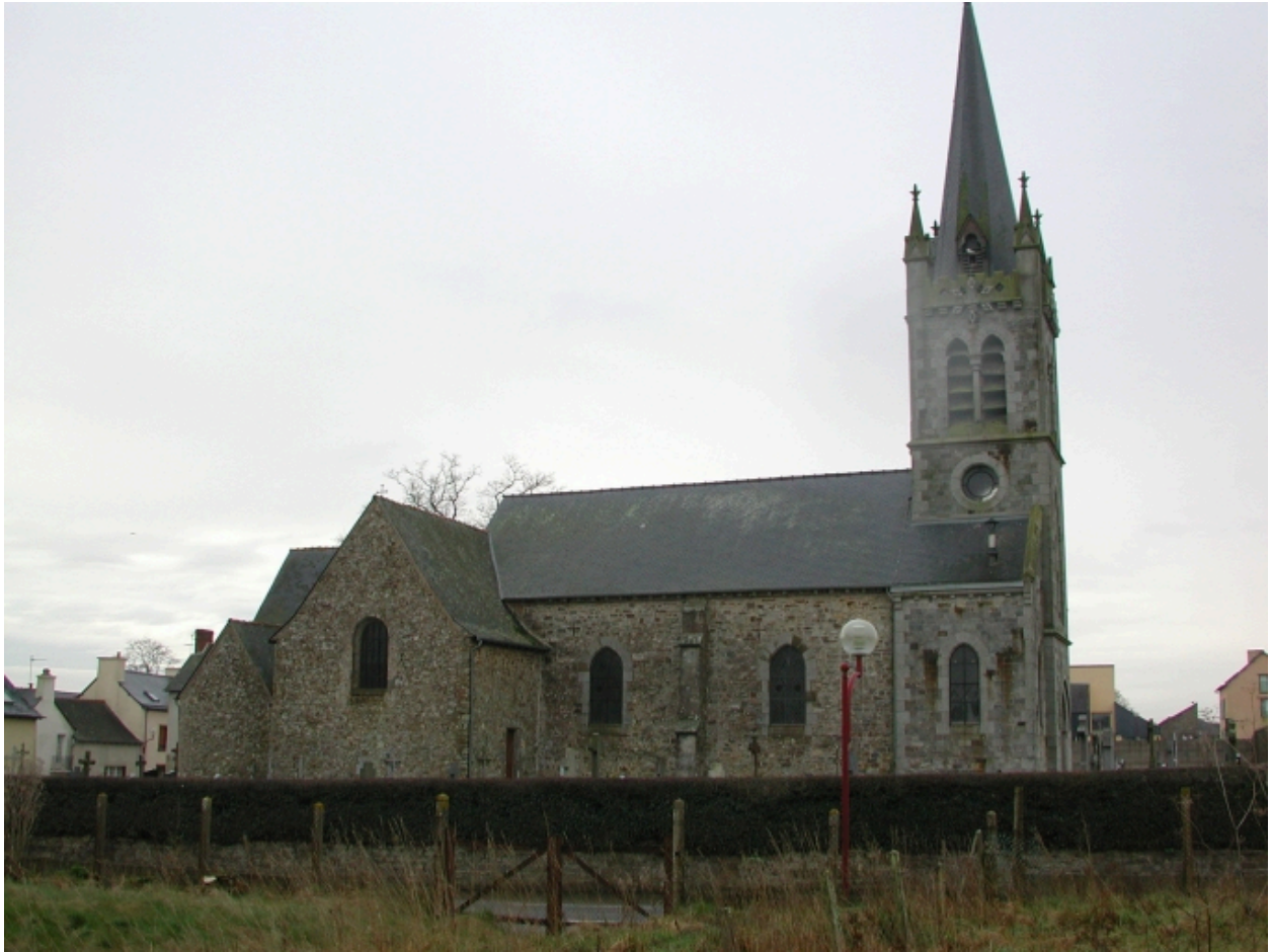
Vue générale nord