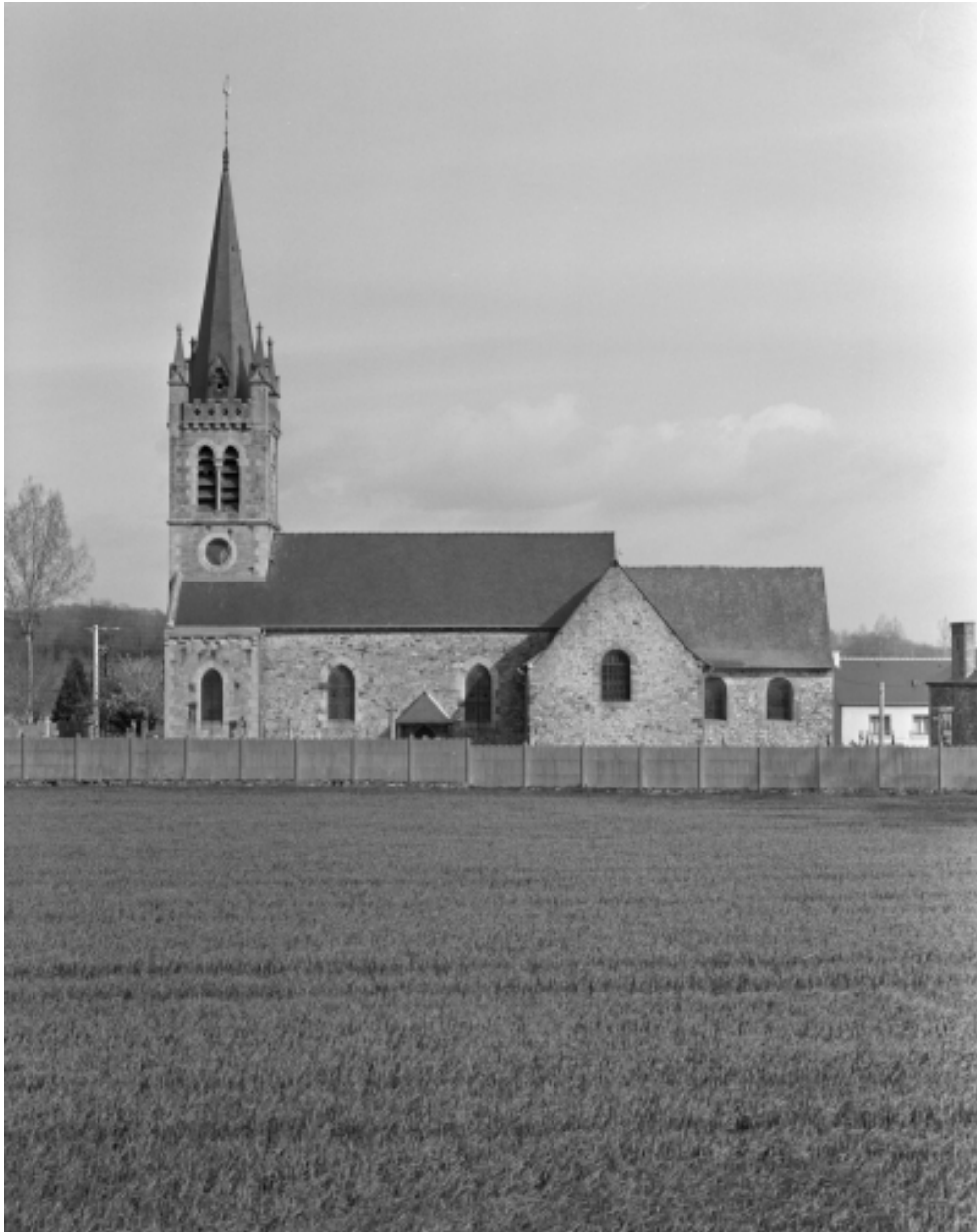
Elévation sud ; vue générale