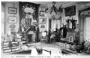
Le salon au début du 20e siècle.