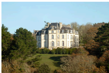
Vue générale ouest prise du pont d'Audierne. (2020) IVR53_20202906187NUCA

IVR53_19832900851X