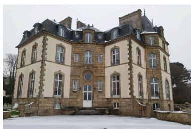
Elévation nord-ouest. (2021)