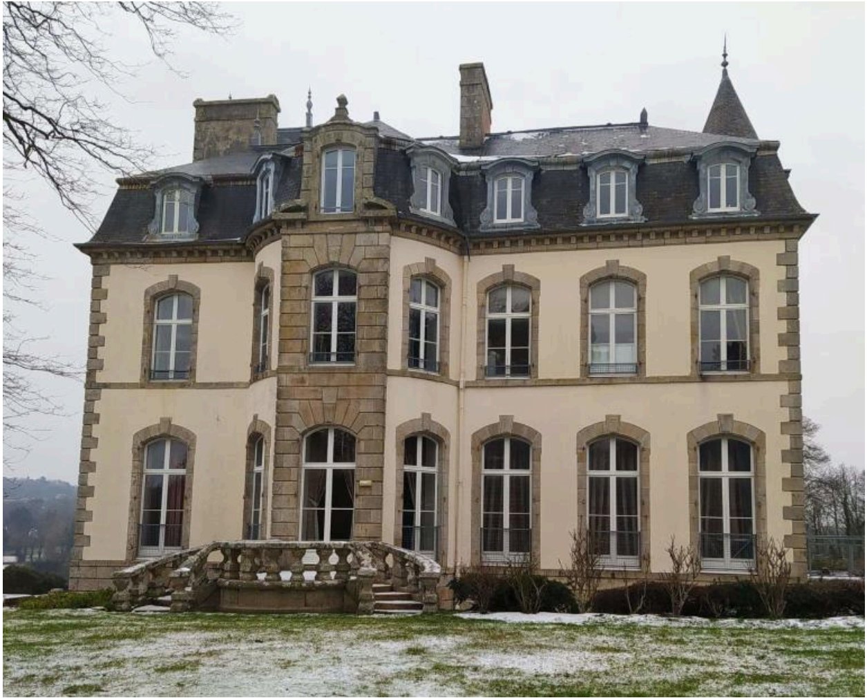
Elévation sud. (2021)