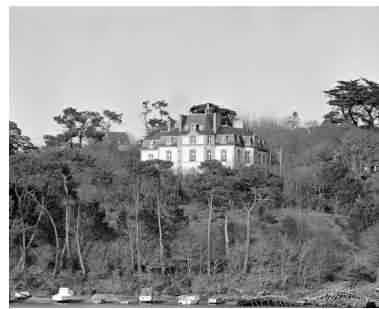
Vue générale ouest prise du pont d'Audierne. (1983)