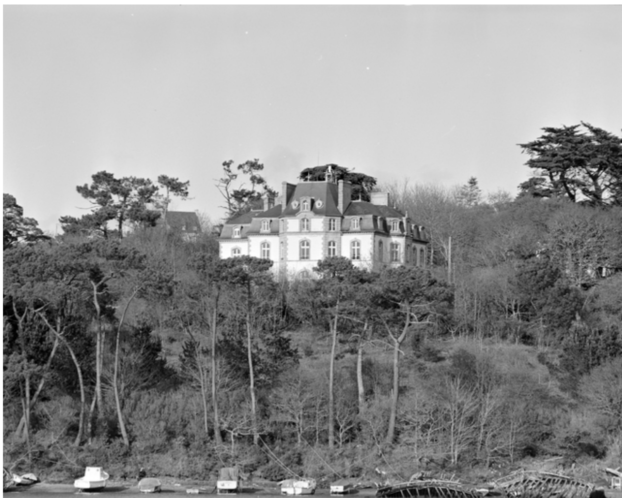
Vue générale ouest prise du pont d'Audierne. (1983)