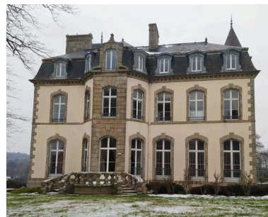
Elévation sud. (2021)