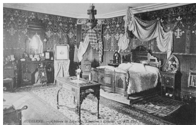
La chambre à coucher au début du 20e siècle. IVR53_20042905588NUCB

IVR53_19832900770X