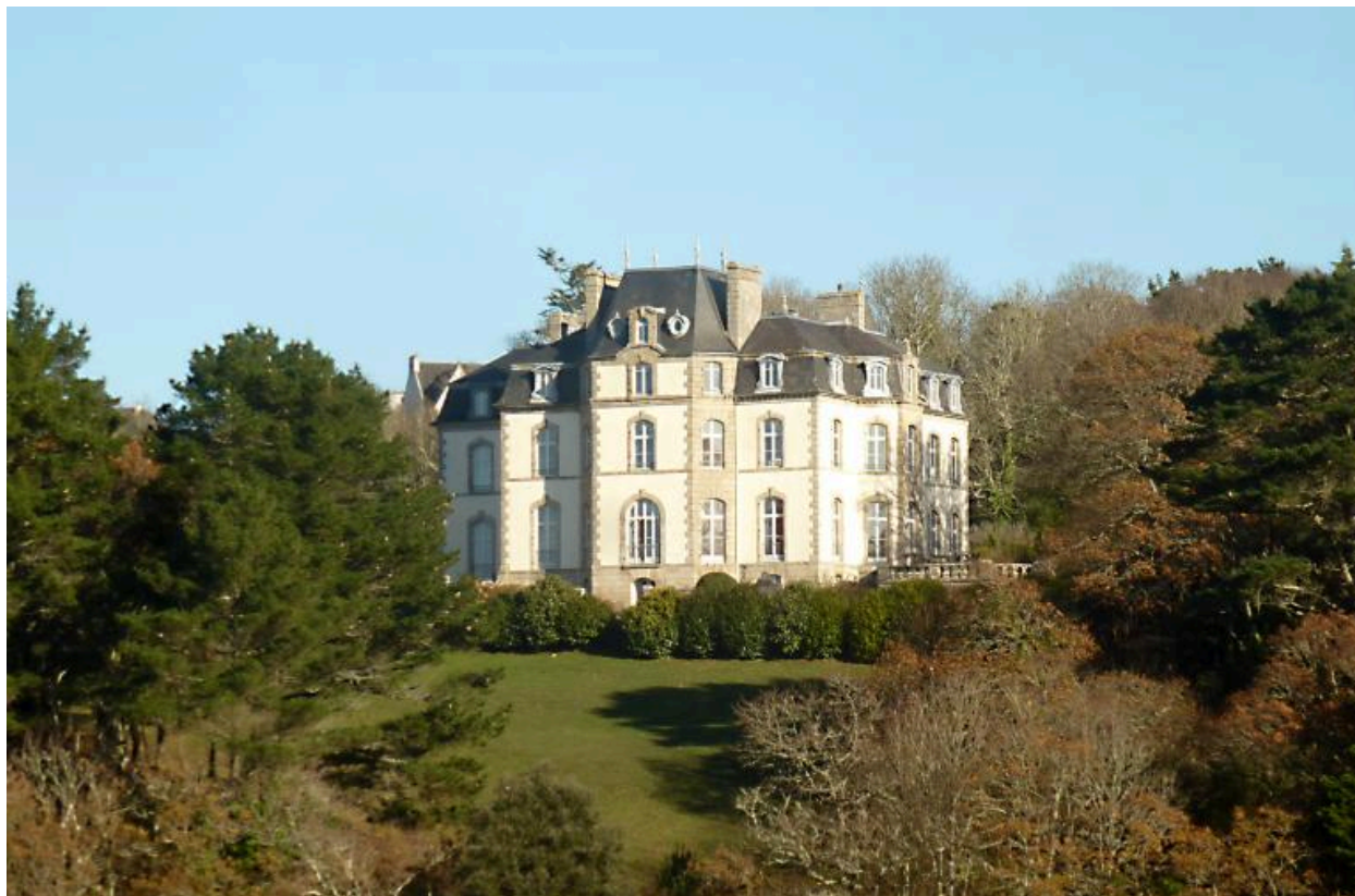
Vue générale ouest prise du pont d'Audierne. (2020)