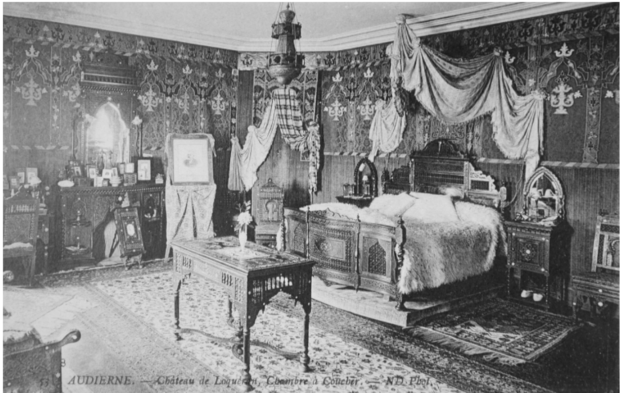
53 AUDIERNE. — Château de Locqueran, Chambre à Coucher.

La chambre à coucher au début du 20e siècle.