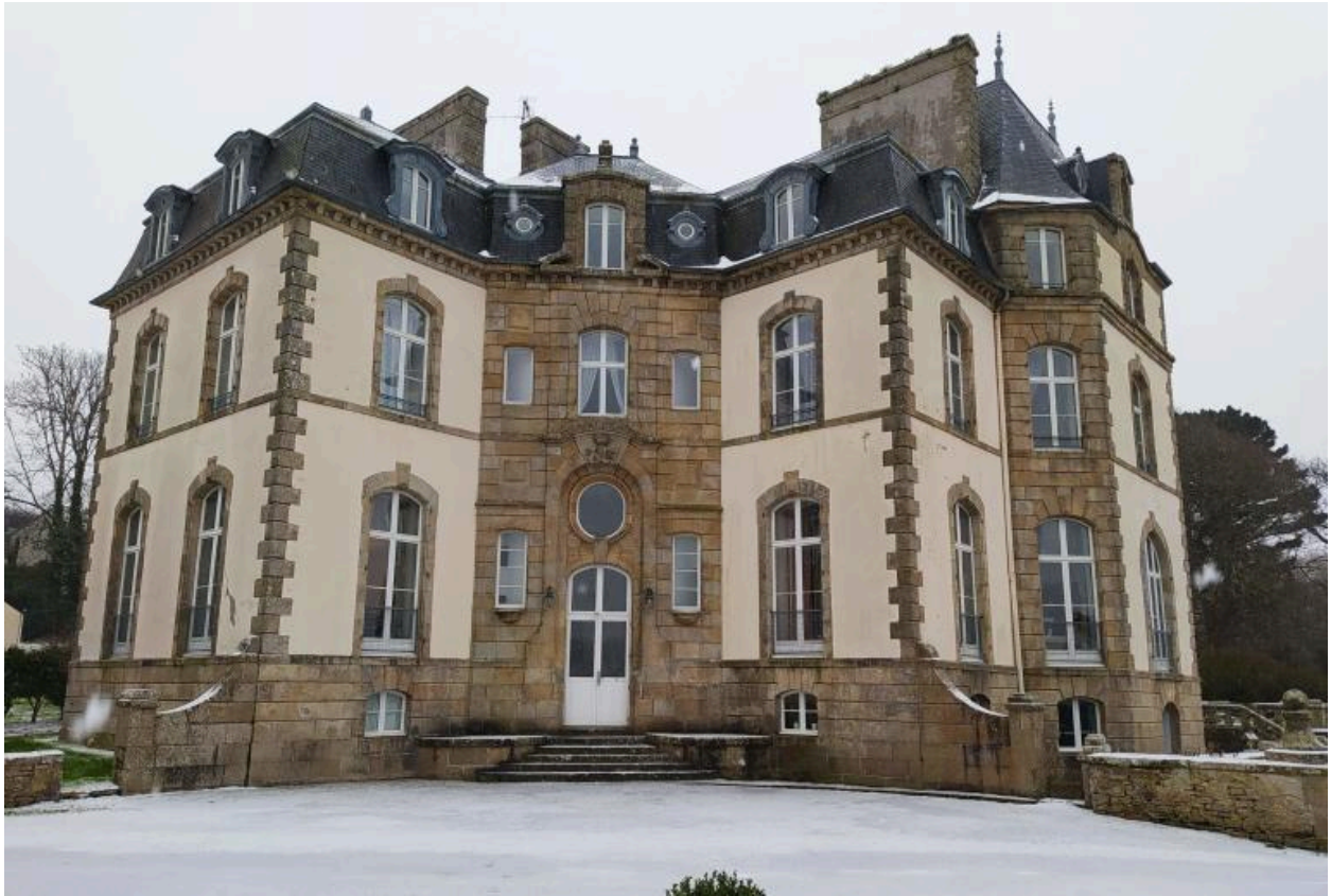
Elévation nord-ouest. (2021)