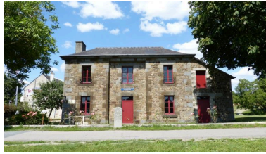
Vue sud IVR53_20243531591NUCA