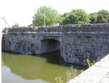
Vue générale IVR53_20053519014NUCA