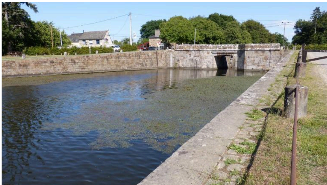
Vue sud ouest