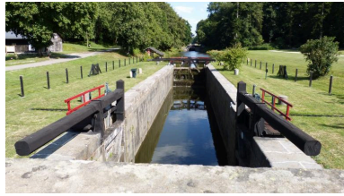
Vue vers l'est IVR53_20243531590NUCA