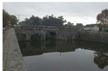
Vue sud-est IVR53_20053503180NUCA