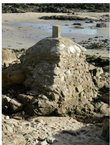
Borne géodésique du fort de Locqueltas