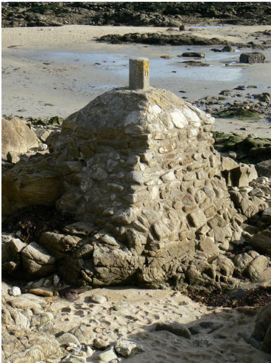
Borne géodésique du fort de Locqueltas