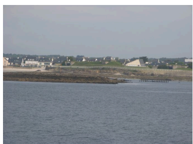
Vue de la pointe de Locqueltas avec une épave de bateau