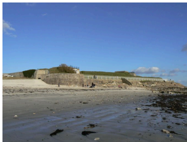
Vue générale de l'ensemble défensif de Locqueltas IVR53_20085606018NUCA