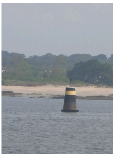
Tourelle de la Pierre d'Orge au large de Locqueltas