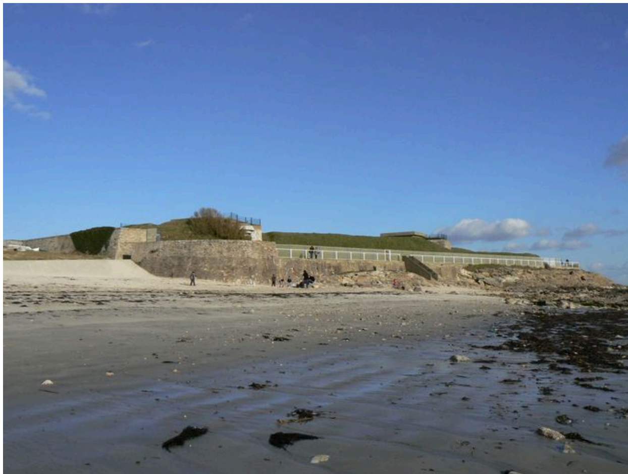
Vue générale de l'ensemble défensif de Locqueltas