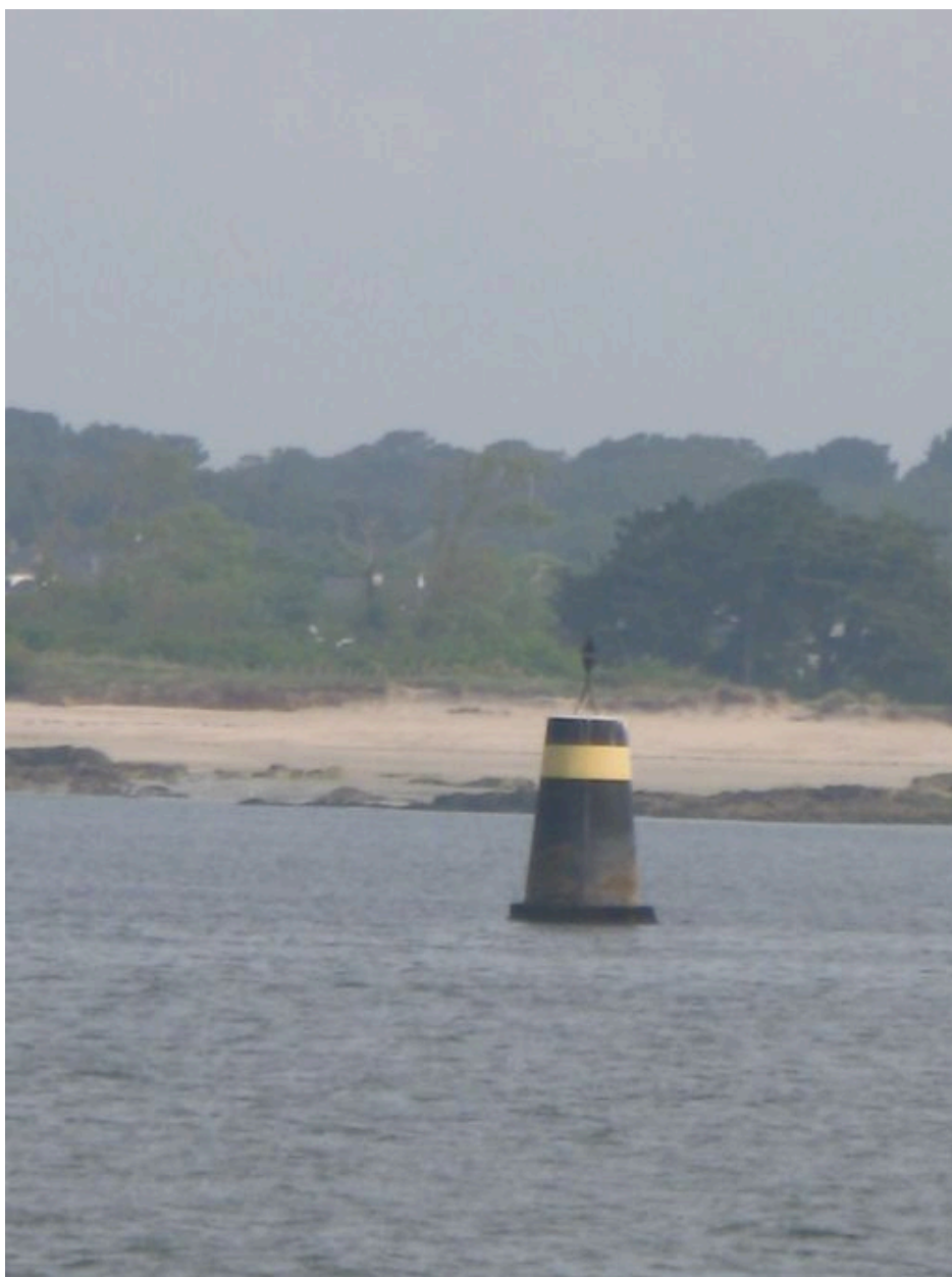
Tourelle de la Pierre d'Orge au large de Locqueltas