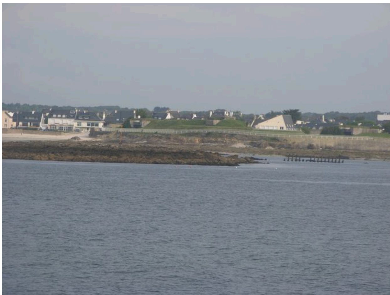
Vue de la pointe de Locqueltas avec une épave de bateau