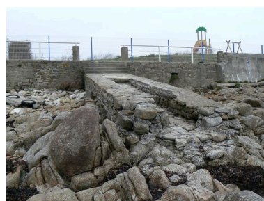
Rampe du fort de Locqueltas IVR53_20085606024NUCA