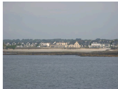
Front résidentiel de Locqueltas