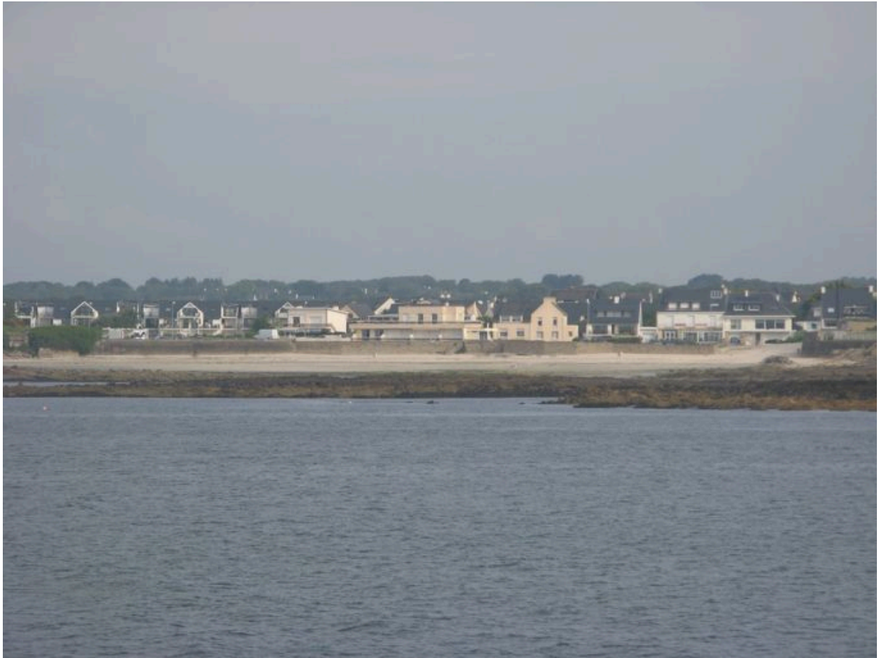
Front résidentiel de Locqueltas