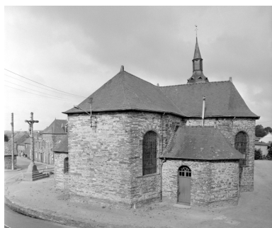
Elévation Est : vue générale IVR53_19943501026X