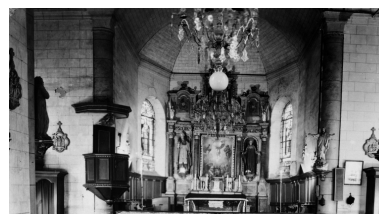
Vue générale du chœur. IVR53_19733500318V