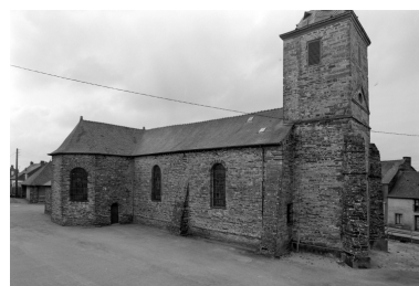
Elévation Nord : vue générale IVR53_19943501025X