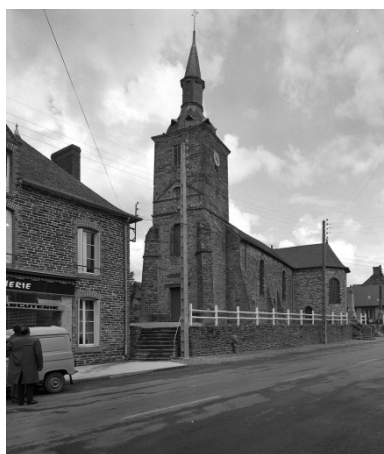
Vue générale sud-ouest. IVR53_19683500472V