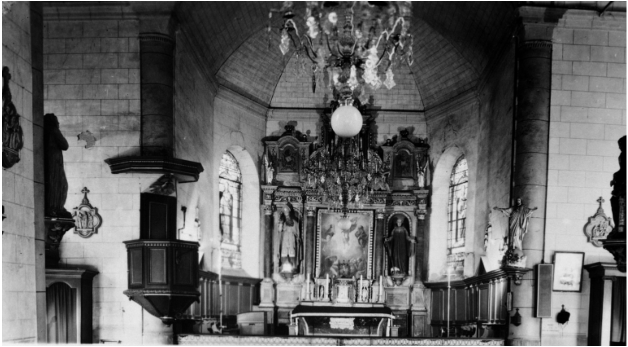
Vue générale du choeur.