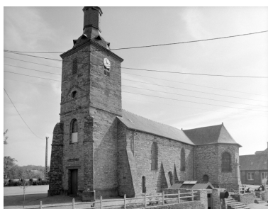
Elévation Sud-Ouest : vue générale IVR53_19943500830X