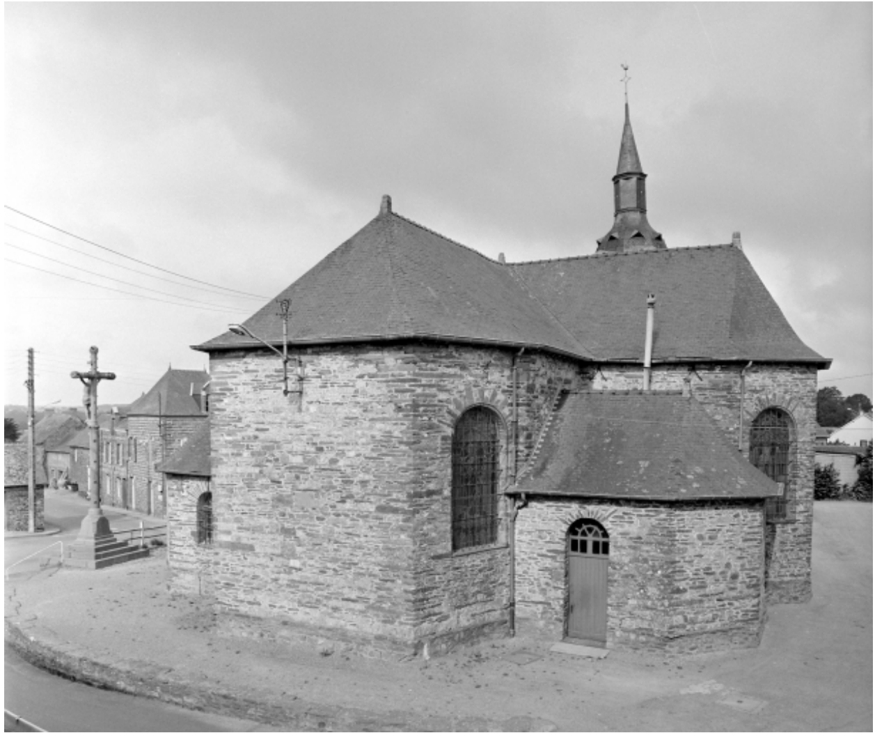
Elévation Est : vue générale