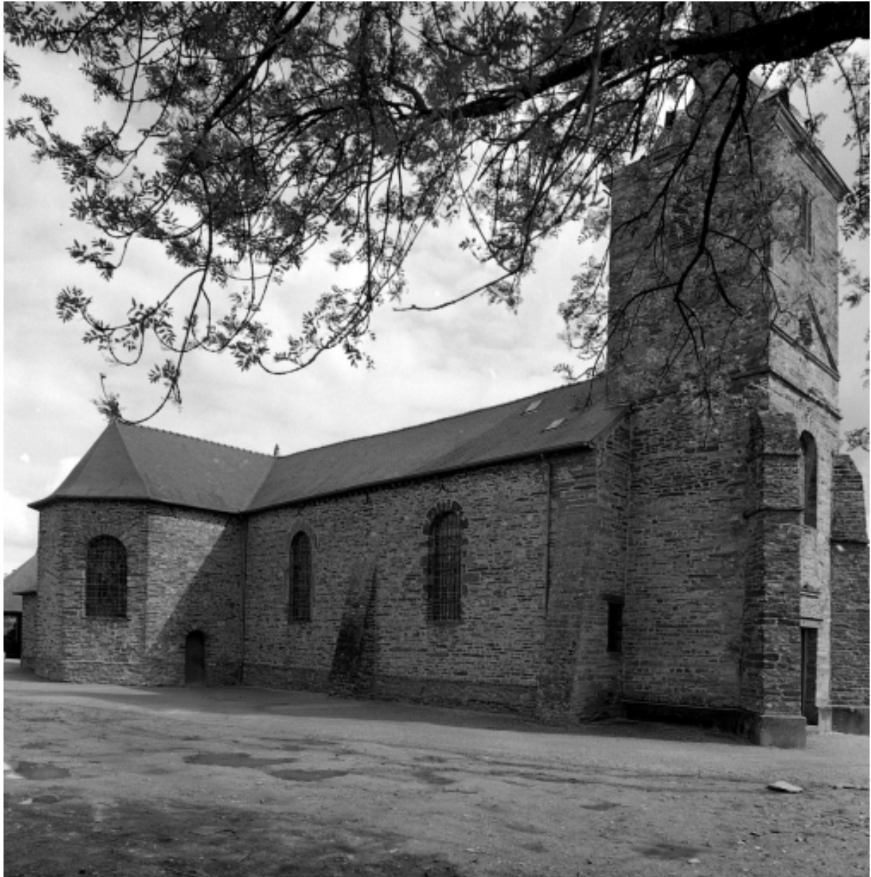
Vue générale nord-ouest.