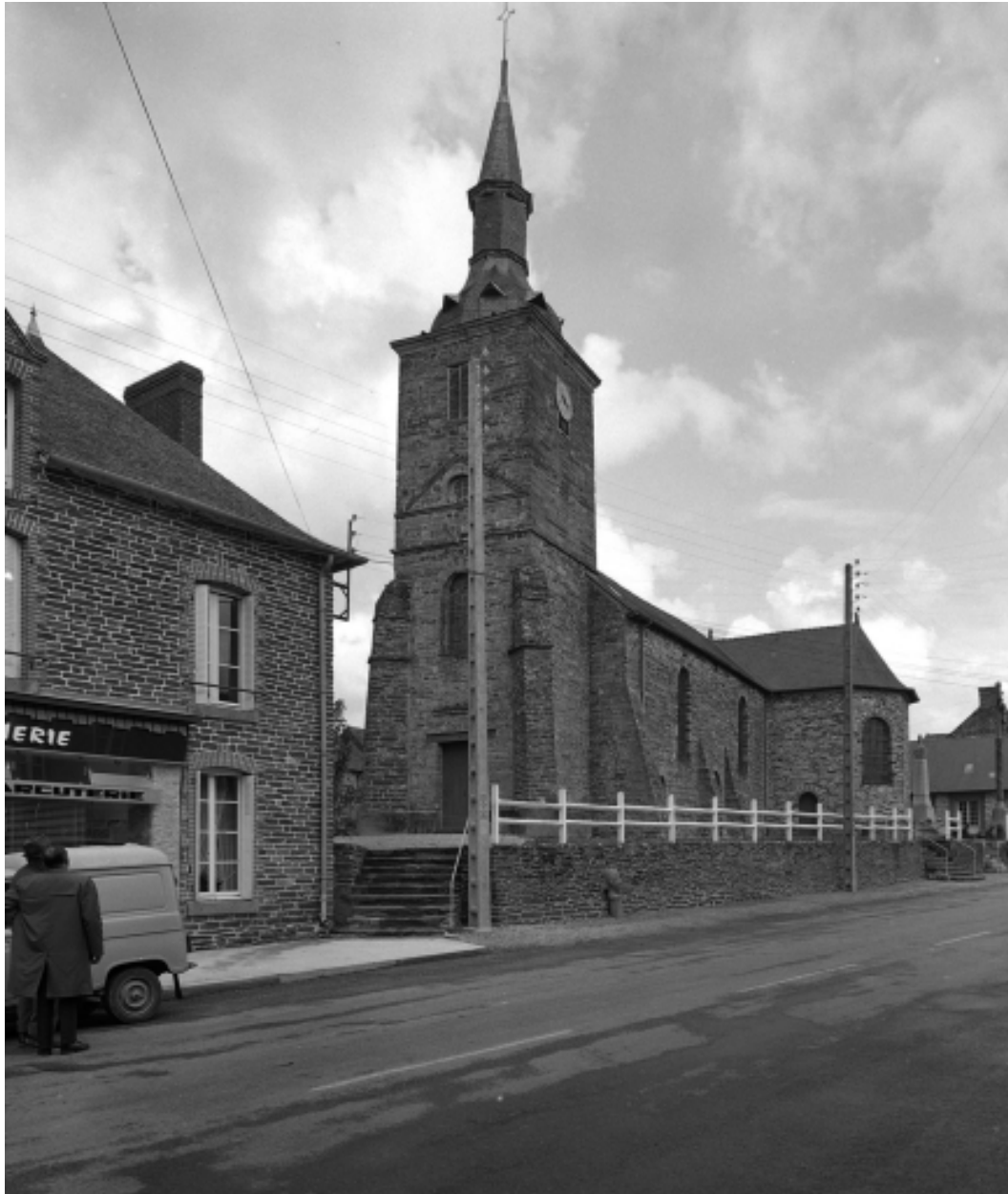
Vue générale sud-ouest.