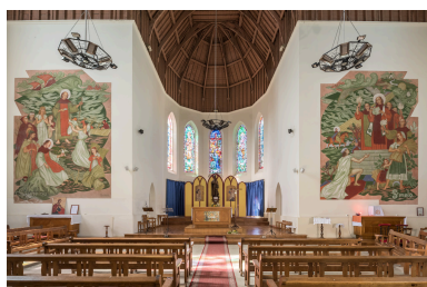
Vue générale du chœur et des deux fresques