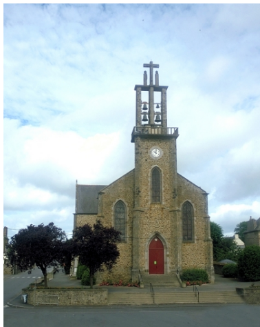
Vue générale est IVR53_20003501500XA