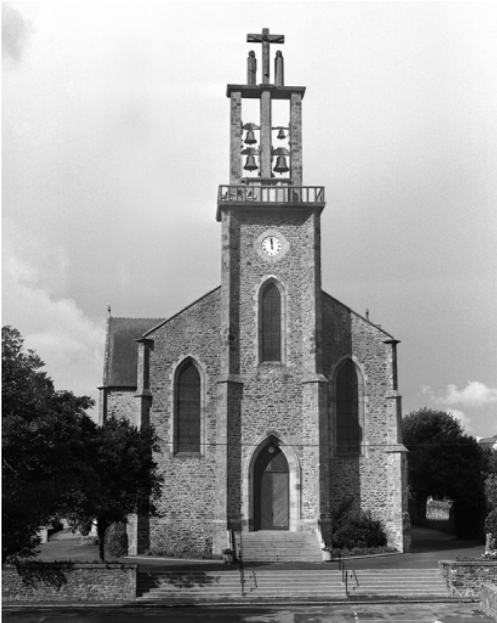
Vue générale est