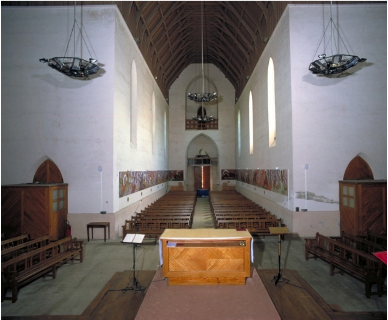
Vue intérieure prise du chœur vers la nef