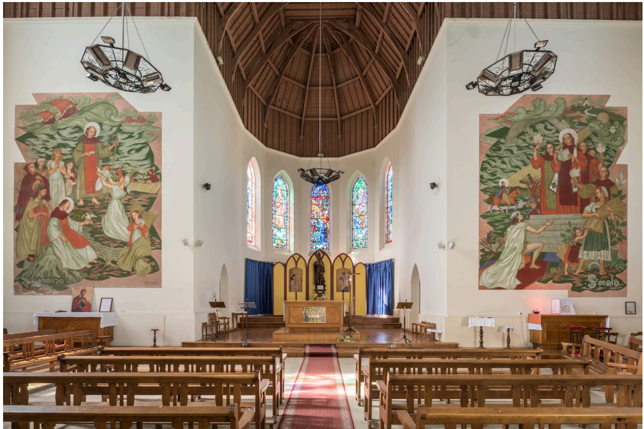
Vue générale du choeur et des deux fresques