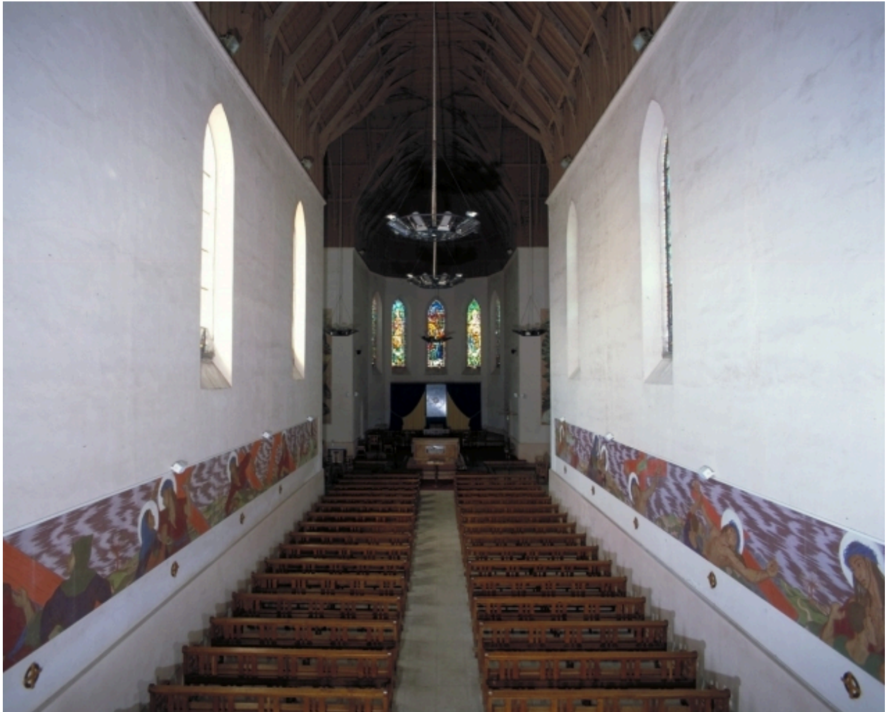
Vue intérieure, prise de la nef vers le chœur