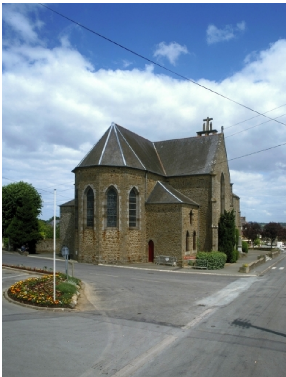
Vue générale sud-ouest