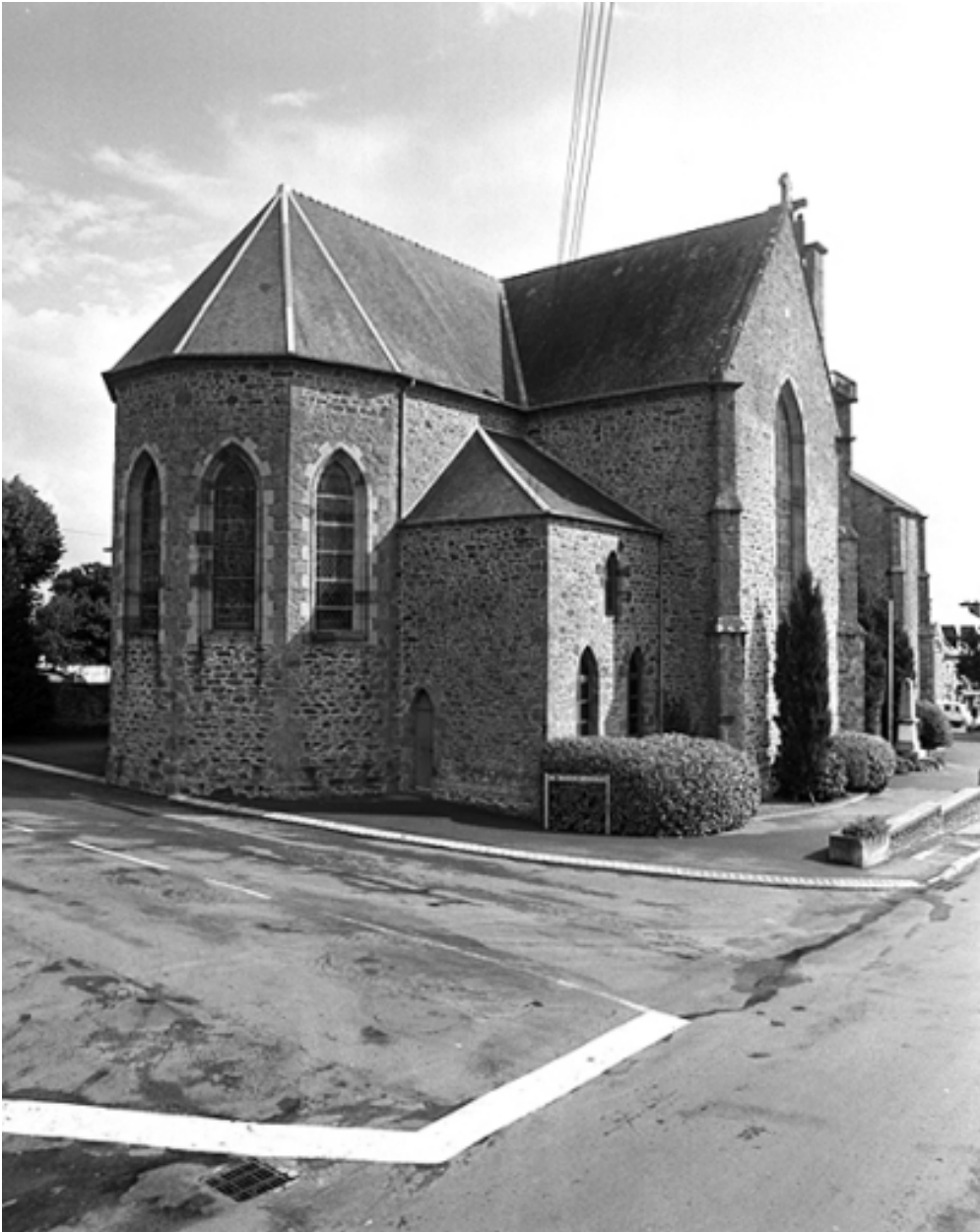
Vue générale sud-ouest