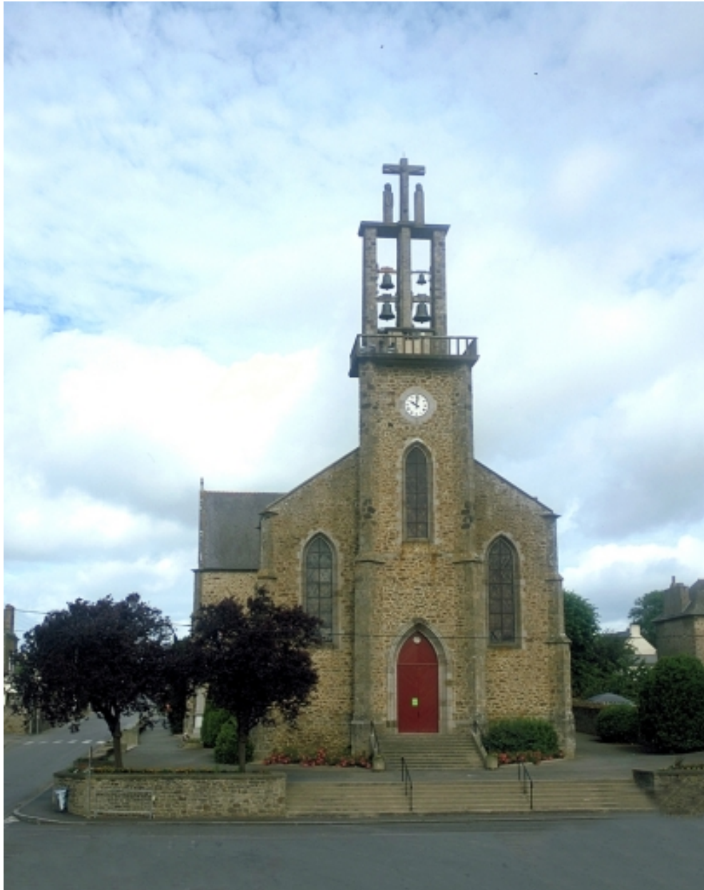
Vue générale est