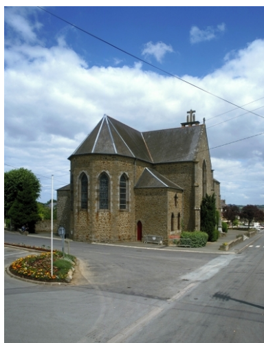
Vue générale sud-ouest IVR53_20003501499XA