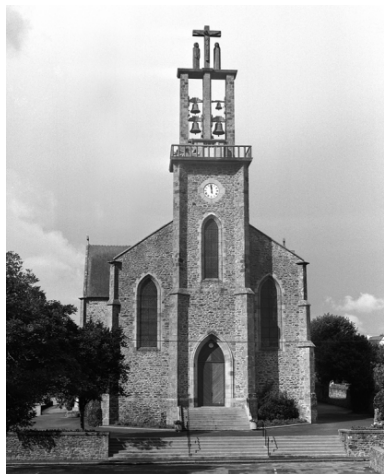
Vue générale est