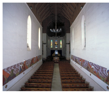
Vue intérieure, prise de la nef vers le chœur IVR53_20003501725XA