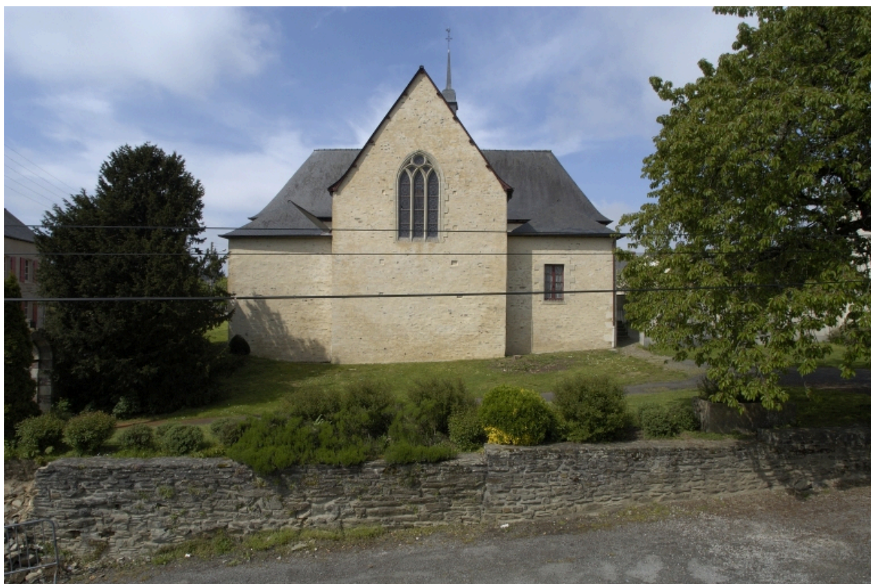
Vue est de l'église