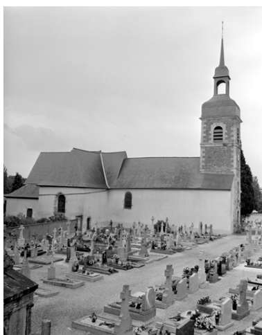
Elévation nord : vue générale IVR53_19943500919X