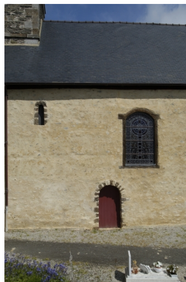
Détail des baies de la façade sud