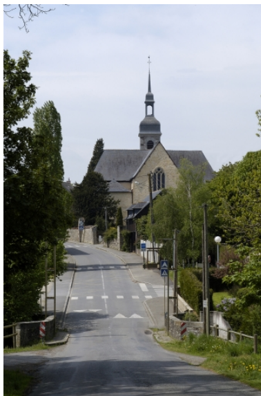
Vue est IVR53_20043500843NUCA