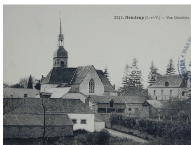
L'église sur une carte postale du début du 20e siècle