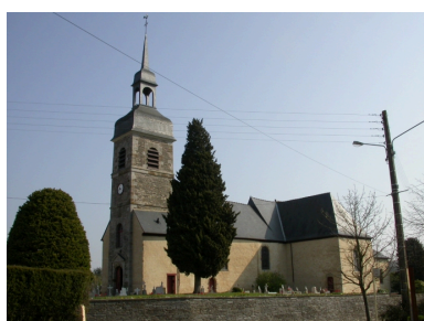
Vue sud-ouest IVR53_20043510862NUCA