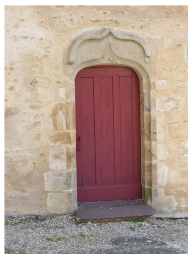
Porte surmontée d'une accolade : partie sud du transept