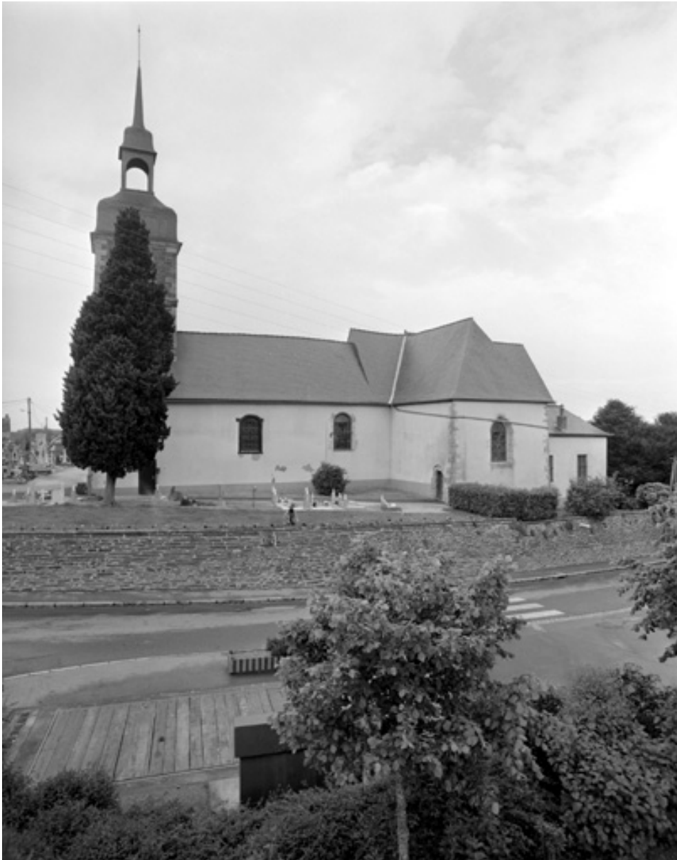
Elévation sud : vue générale