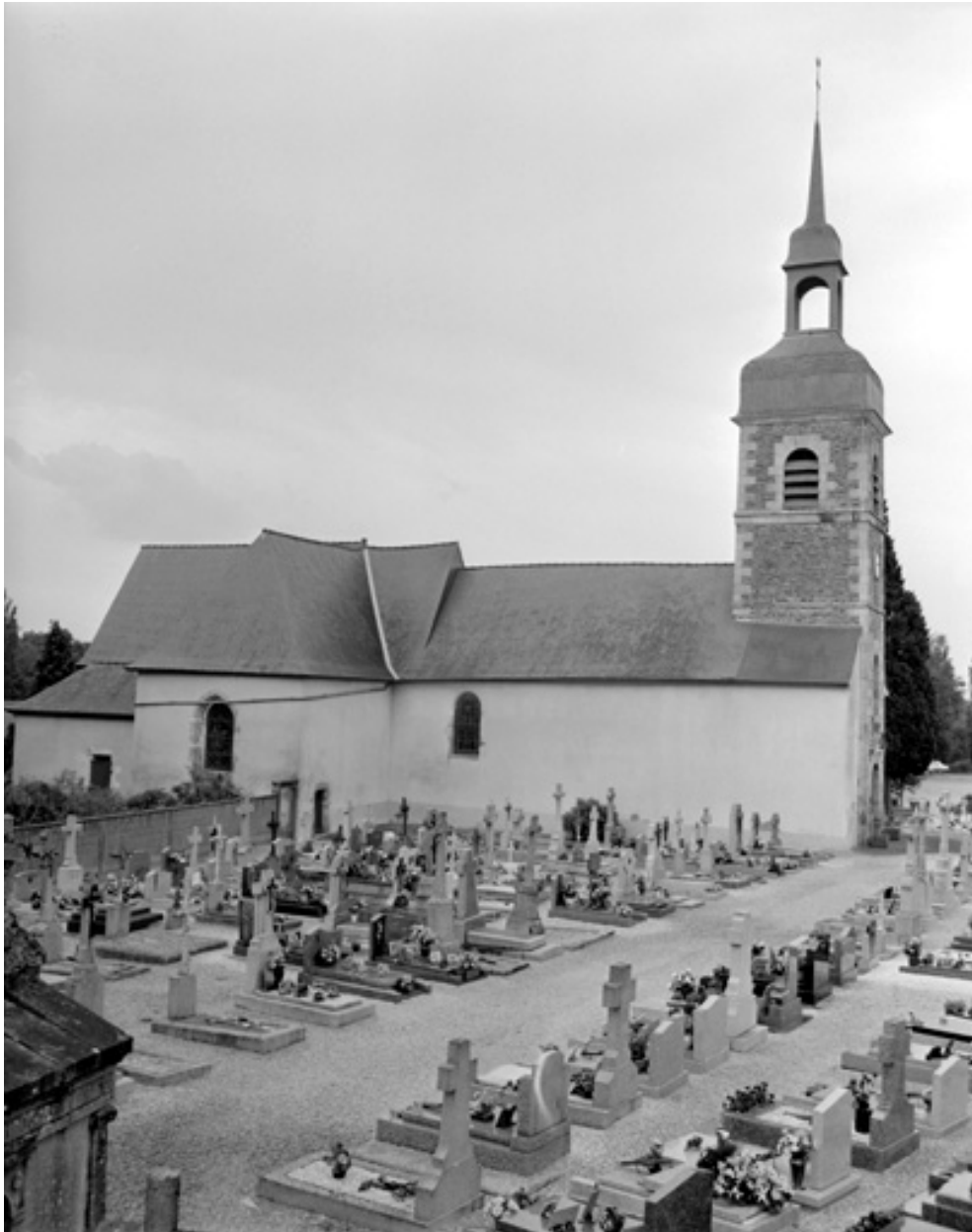
Elévation nord : vue générale