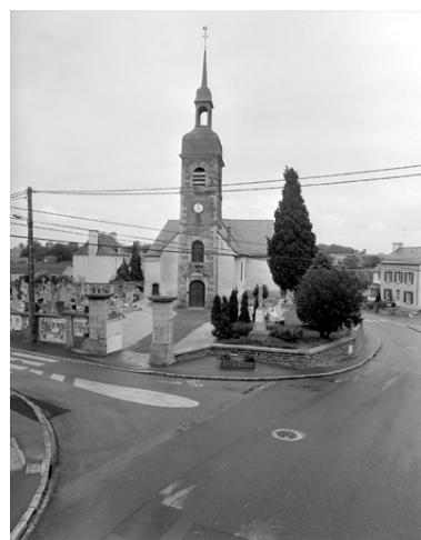
Élévation ouest : vue générale