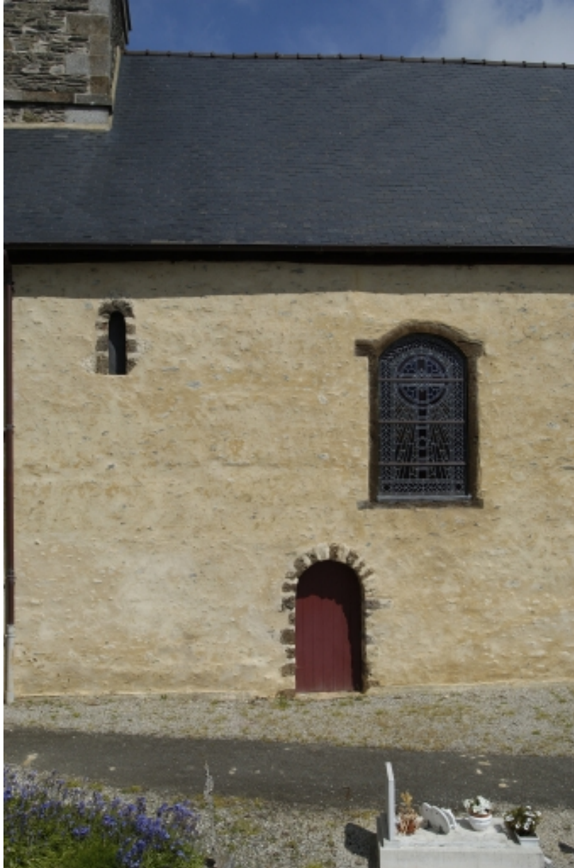
Détail des baies de la façade sud