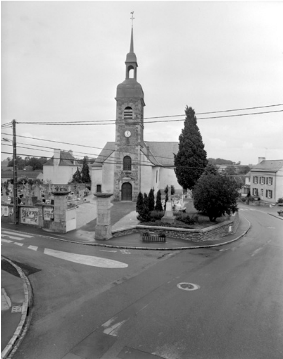
Elévation ouest : vue générale