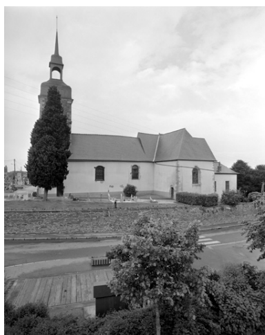
Elévation sud : vue générale, IVR53_19943500920X