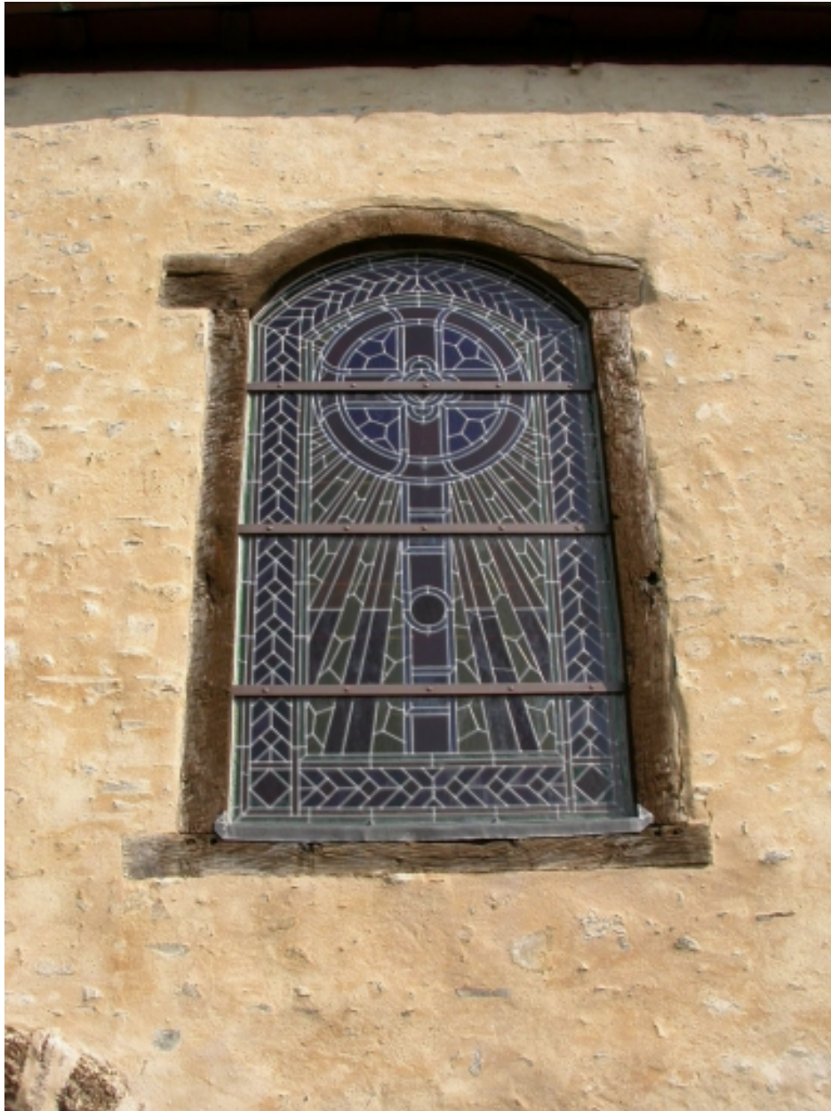
Fenêtre de la façade sud