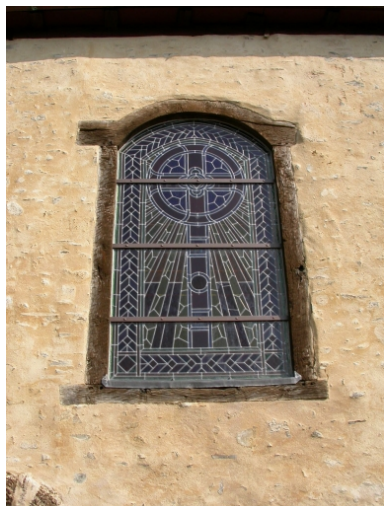
Fenêtre de la façade sud IVR53_20043510896NUCA

IVR53_20043510895NUCA