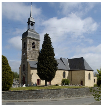
Vue générale sud-ouest IVR53_20043500830NUCA