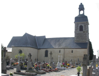
Vue nord IVR53_20043510863NUCA