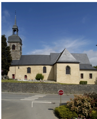
Vue sud de l'église