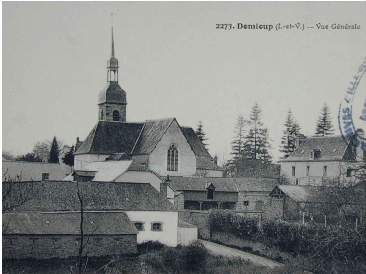
L'église sur une carte postale du début du 20e siècle