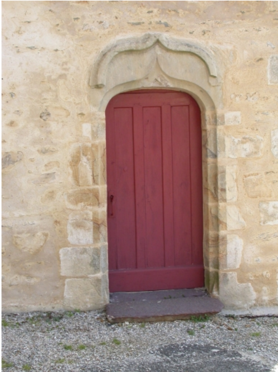
Porte surmontée d'une accolade : partie sud du transept