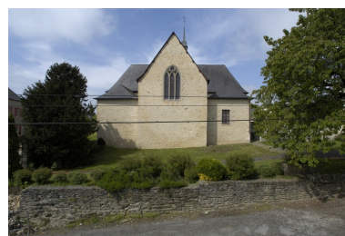
Vue est de l'église IVR53_20043500827NUCA