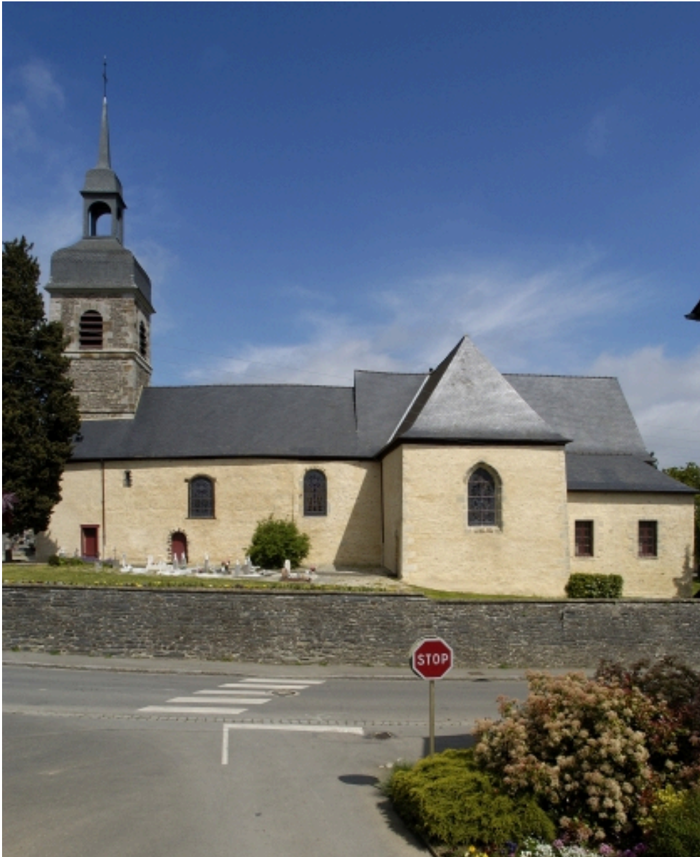
Vue sud de l'église