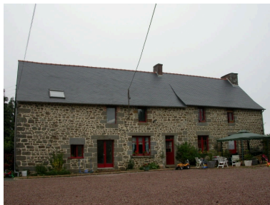
Vue générale du logis IVR53_20053518916NUCA