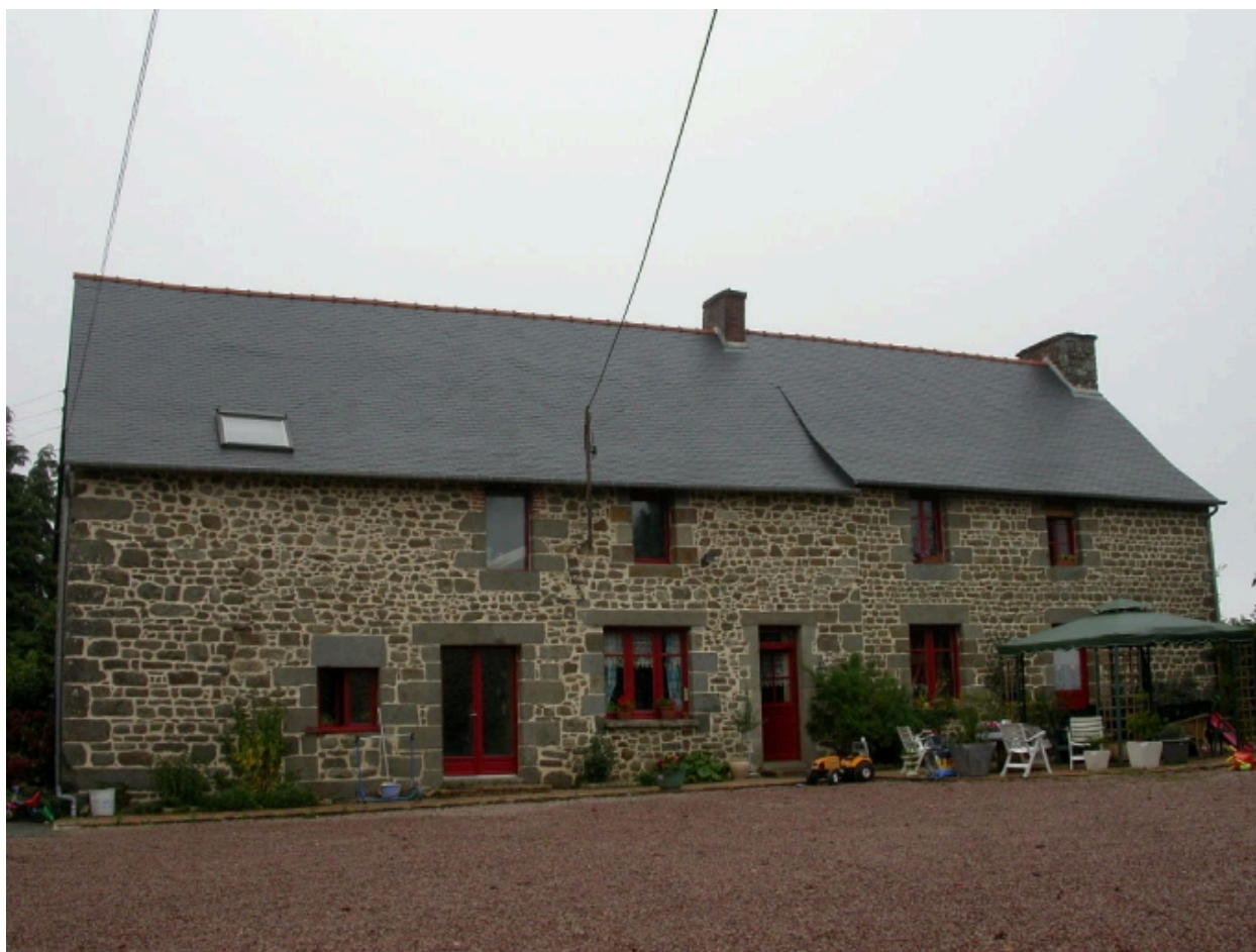
Vue générale du logis