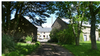
Vue d'ensemble ouest IVR53_20243531293NUCA