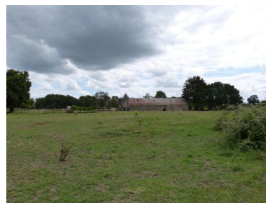
Vue générale nord IVR53_20243531291NUCA