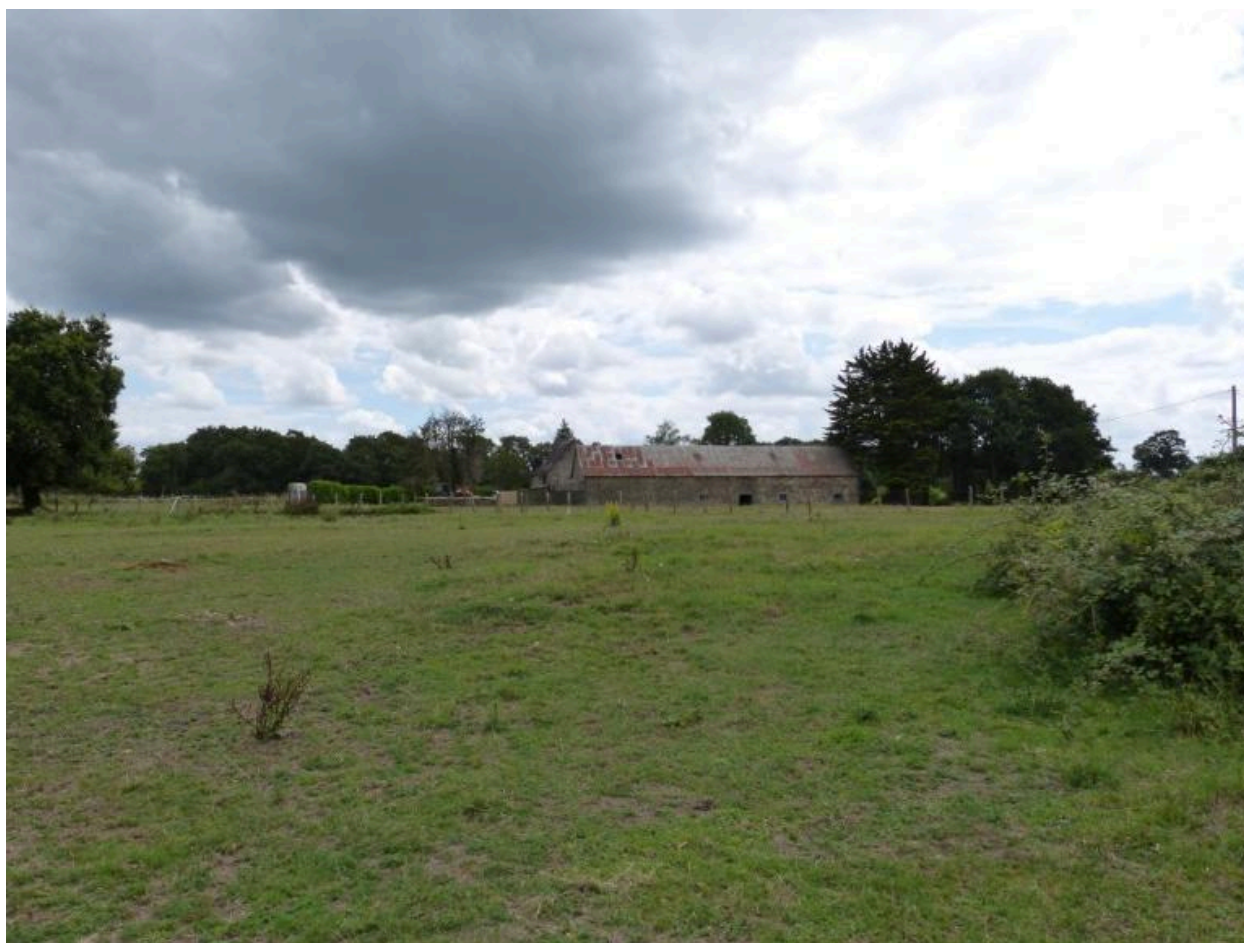
Vue générale nord