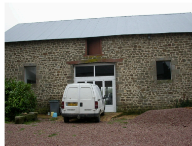
La grange