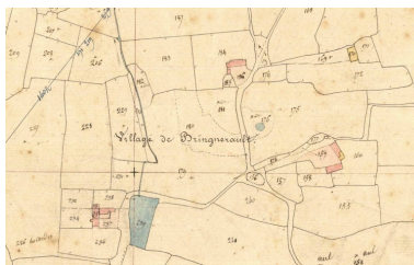
Le bâtiment sur le cadastre de 1835 IVR53_20053518912NUCA