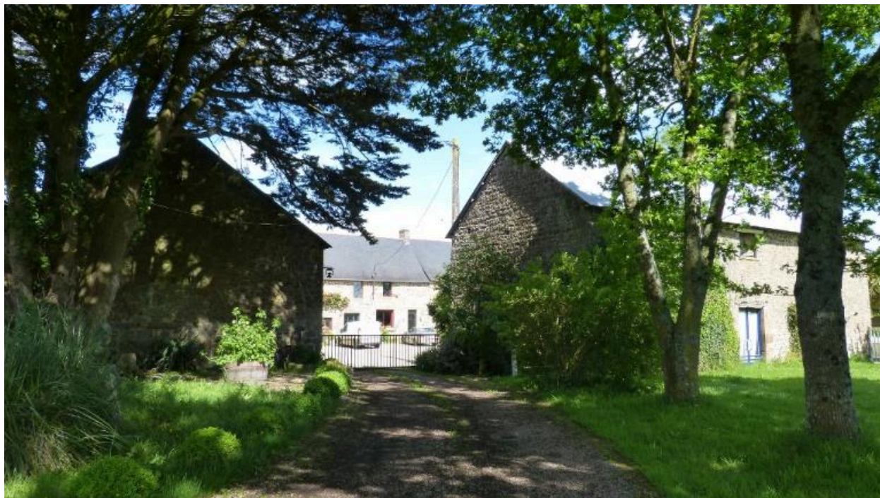
Vue d'ensemble ouest