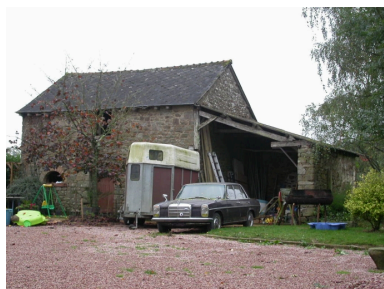
L'écurie IVR53_20053518918NUCA