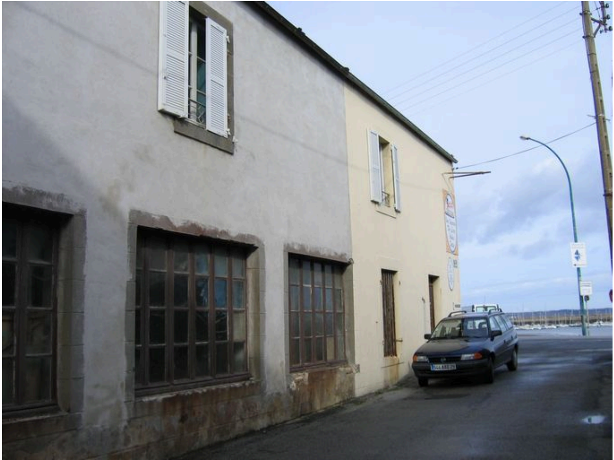
Elévation latérale de l'ancienne conserverie