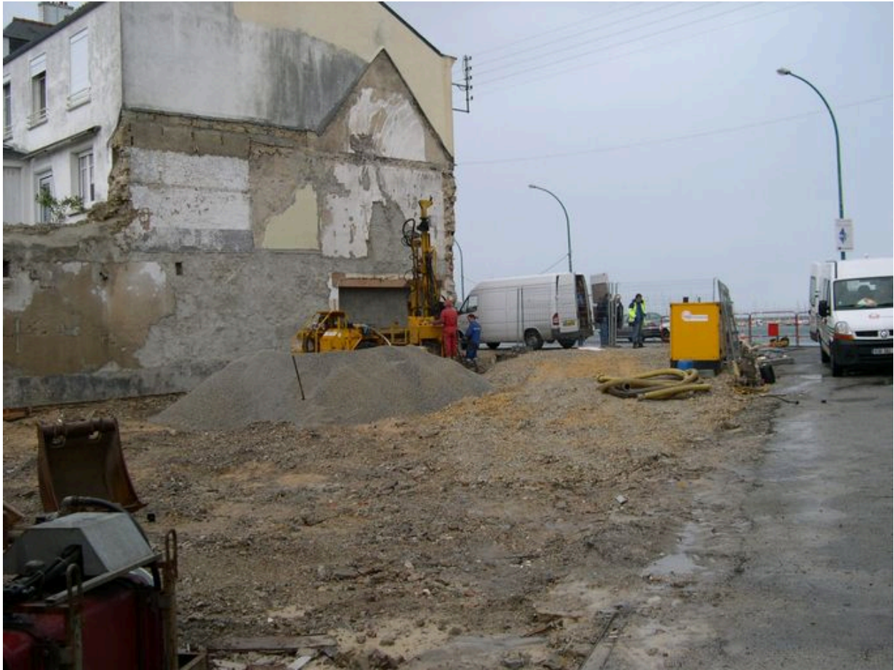
Chantier à l'emplacement de l'ancienne conserverie de sardines Béziers