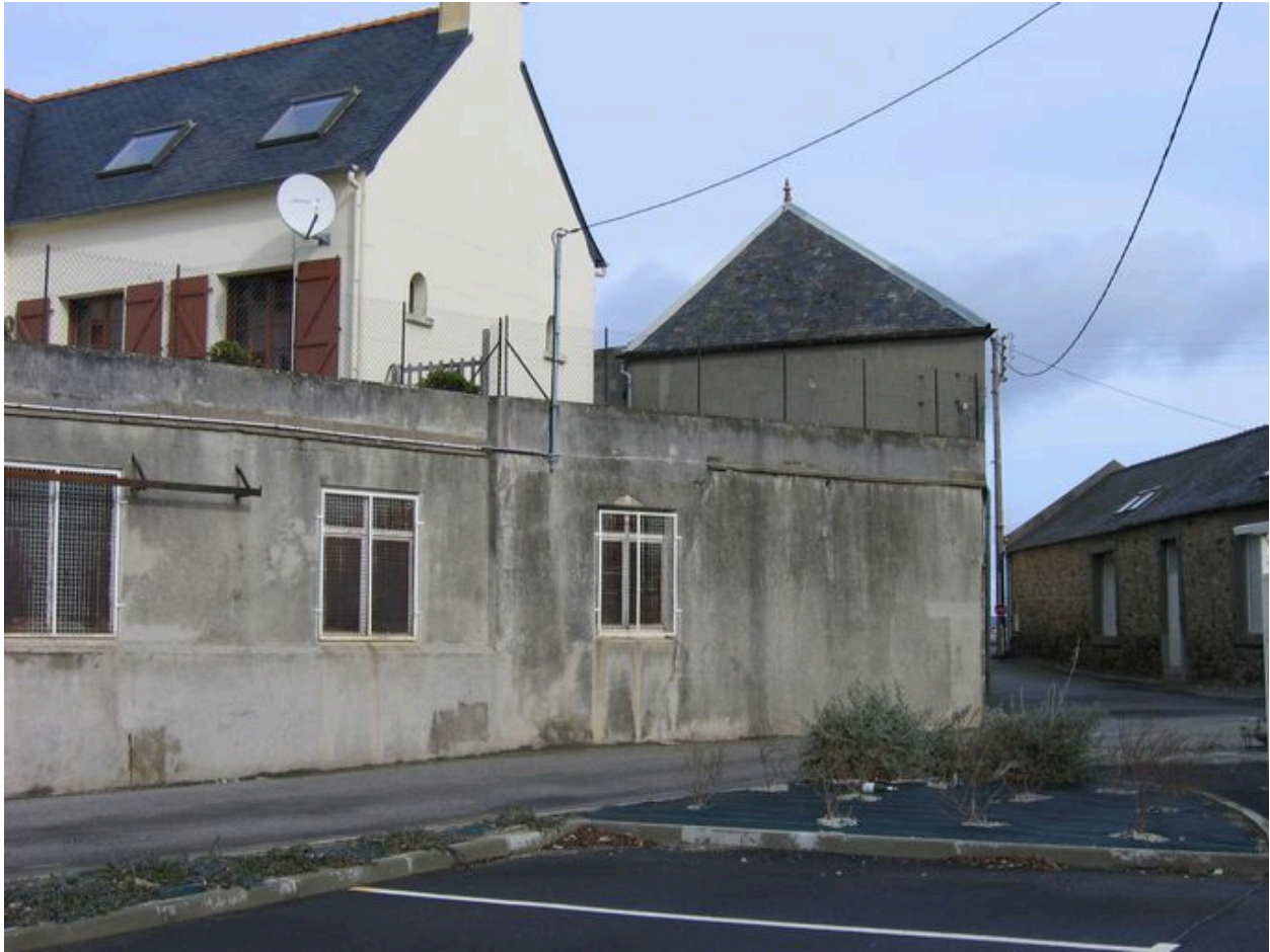
Elévation postérieure de l'ancienne conserverie