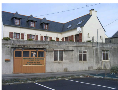
Elévation postérieure de l'ancienne conserverie Béziers IVR53_20062908409NUCA