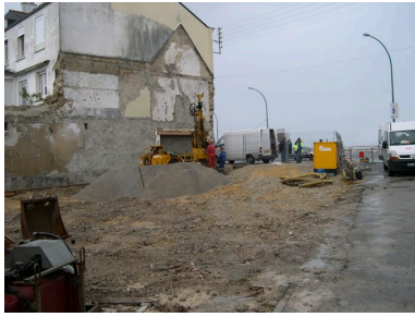
Chantier à l'emplacement de l'ancienne conserverie de sardines Béziers IVR53_20062908484NUCA