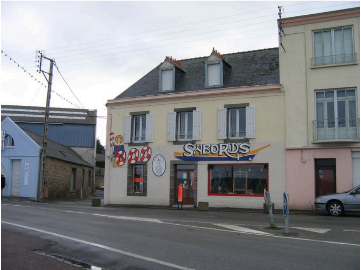
Vue générale de l'ancienne conserverie Béziers depuis la rue