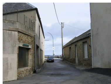
Elévation latérale de l'ancienne conserverie