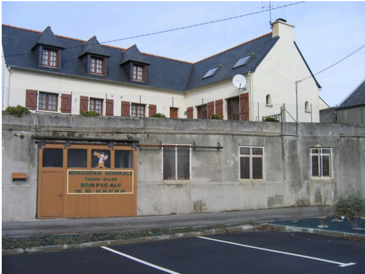
Elévation postérieure de l'ancienne conserverie Béziers