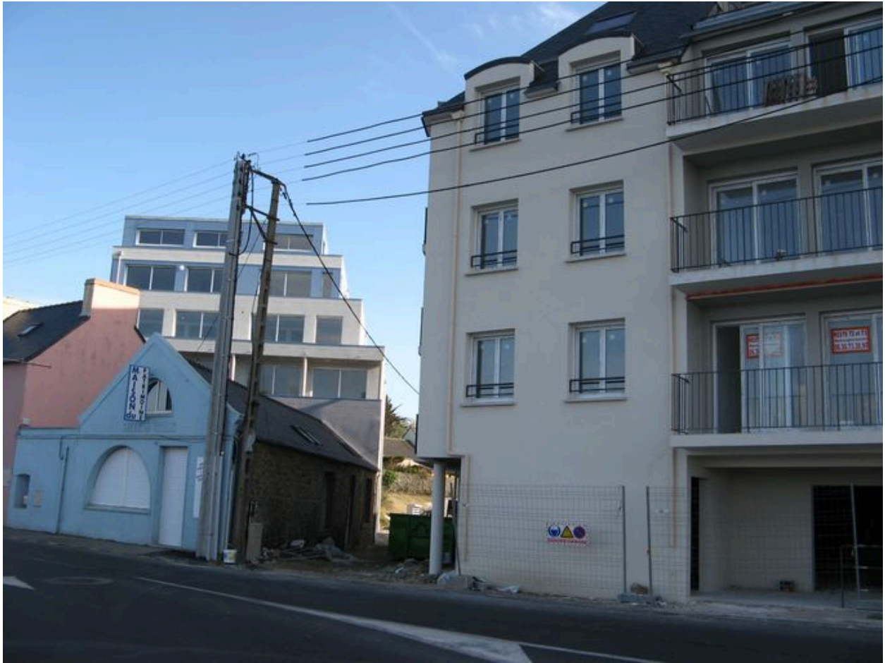
Nouveaux bâtiments construits en 2007-08