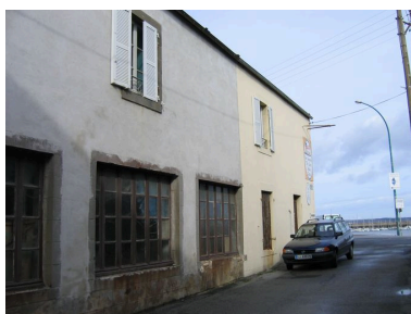
Elévation latérale de l'ancienne conserverie IVR53_20062908405NUCA