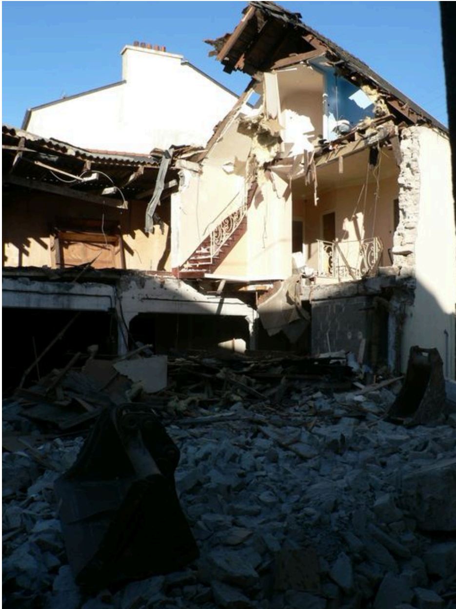
Démolition de l'ancienne conserverie de sardines Béziers (3 novembre 2006)