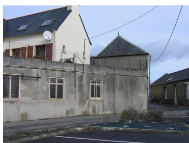
Elévation postérieure de l'ancienne conserverie