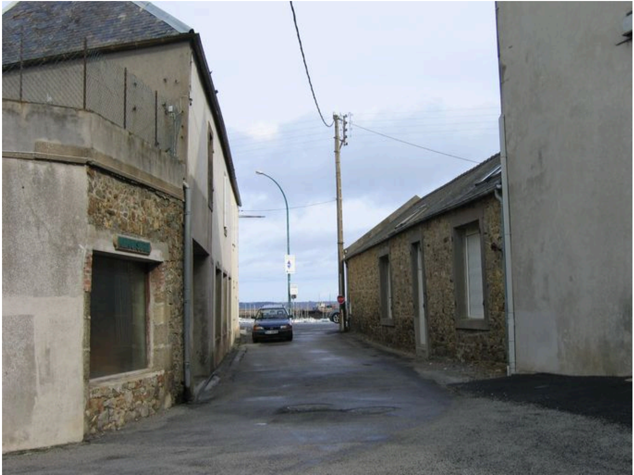
Elévation latérale de l'ancienne conserverie