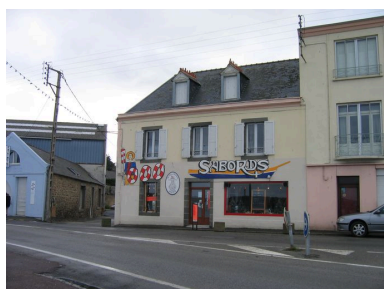
Vue générale de l'ancienne conserverie Béziers depuis la rue IVR53_20062908445NUCA