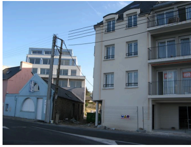
Nouveaux bâtiments construits en 2007-08 IVR53_20082908261NUCA