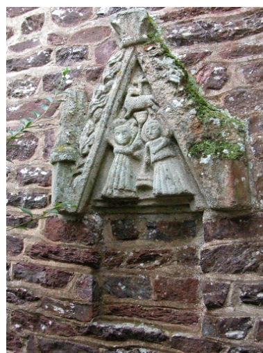
Elément d'un sacraire