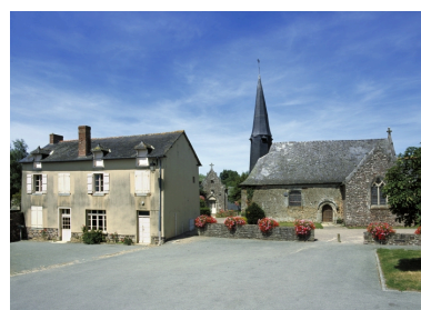
Vue de situation sud IVR53_20023500632XA