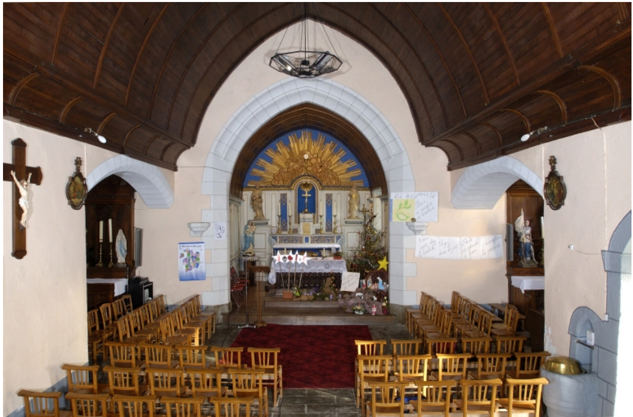
Vue intérieure prise de la nef vers le chœur