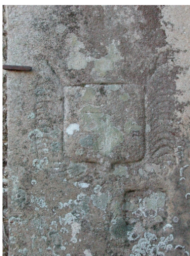
Dalle funéraire