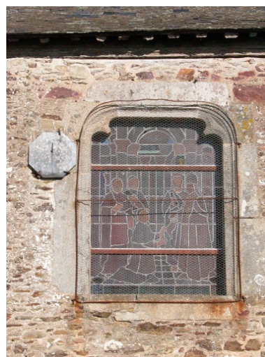
Fenêtre de la nef IVR53_20033513076NUCA