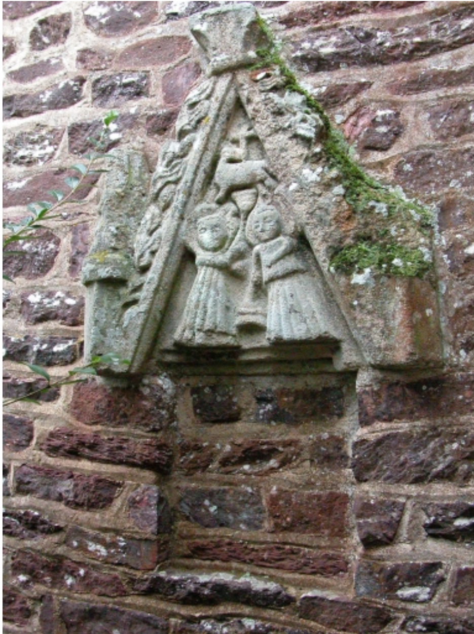
Elément d'un sacraire