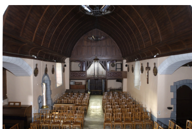
Vue intérieure prise du chœur vers la nef IVR53_20043500048NUCA