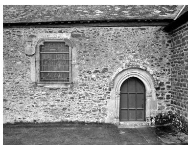
Vue partielle sud : porte et fenêtre IVR53_19943500669X