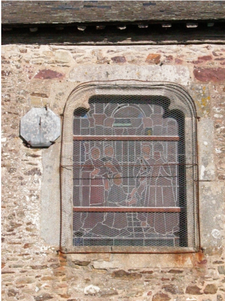
Fenêtre de la nef