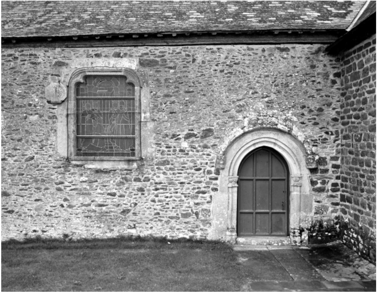
Vue partielle sud : porte et fenêtre