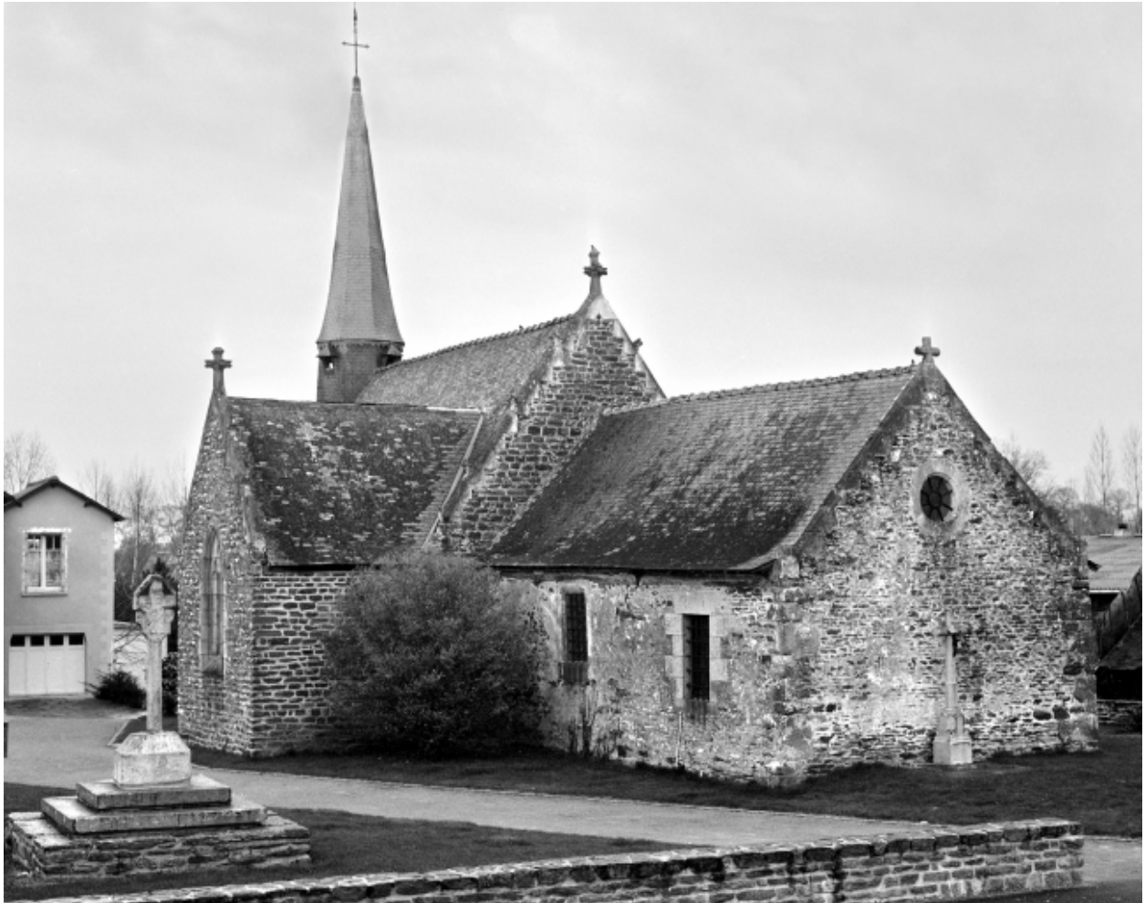
Vue générale sud est