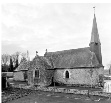
Vue générale nord IVR53_19943500671X