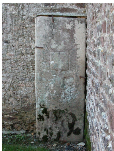
Dalle funéraire IVR53_20033513072NUCA