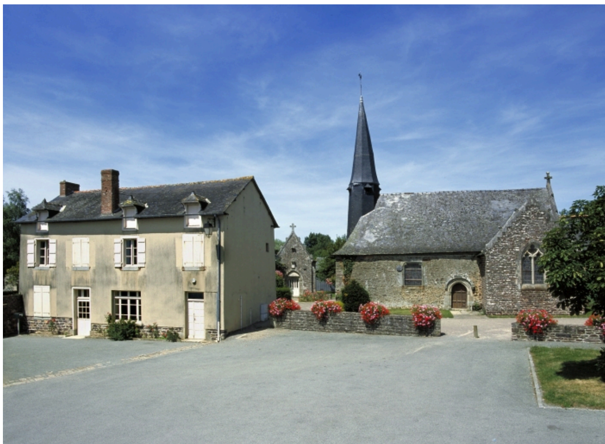
Vue de situation sud