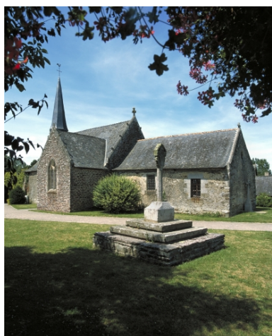
Vue générale sud est IVR53_20023500630XA