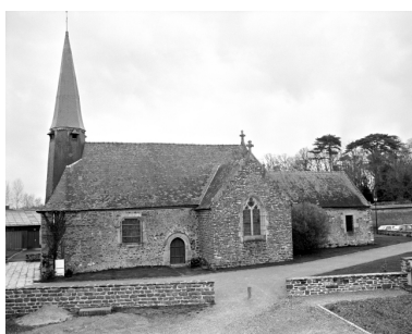
Vue générale sud IVR53_19943500668X