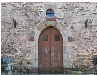
Porte ouest IVR53_20033513075NUCA