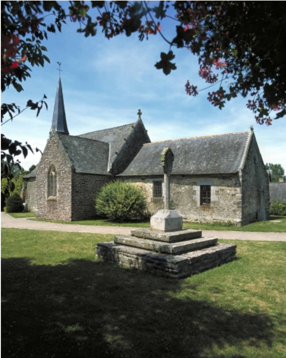
Vue générale sud est