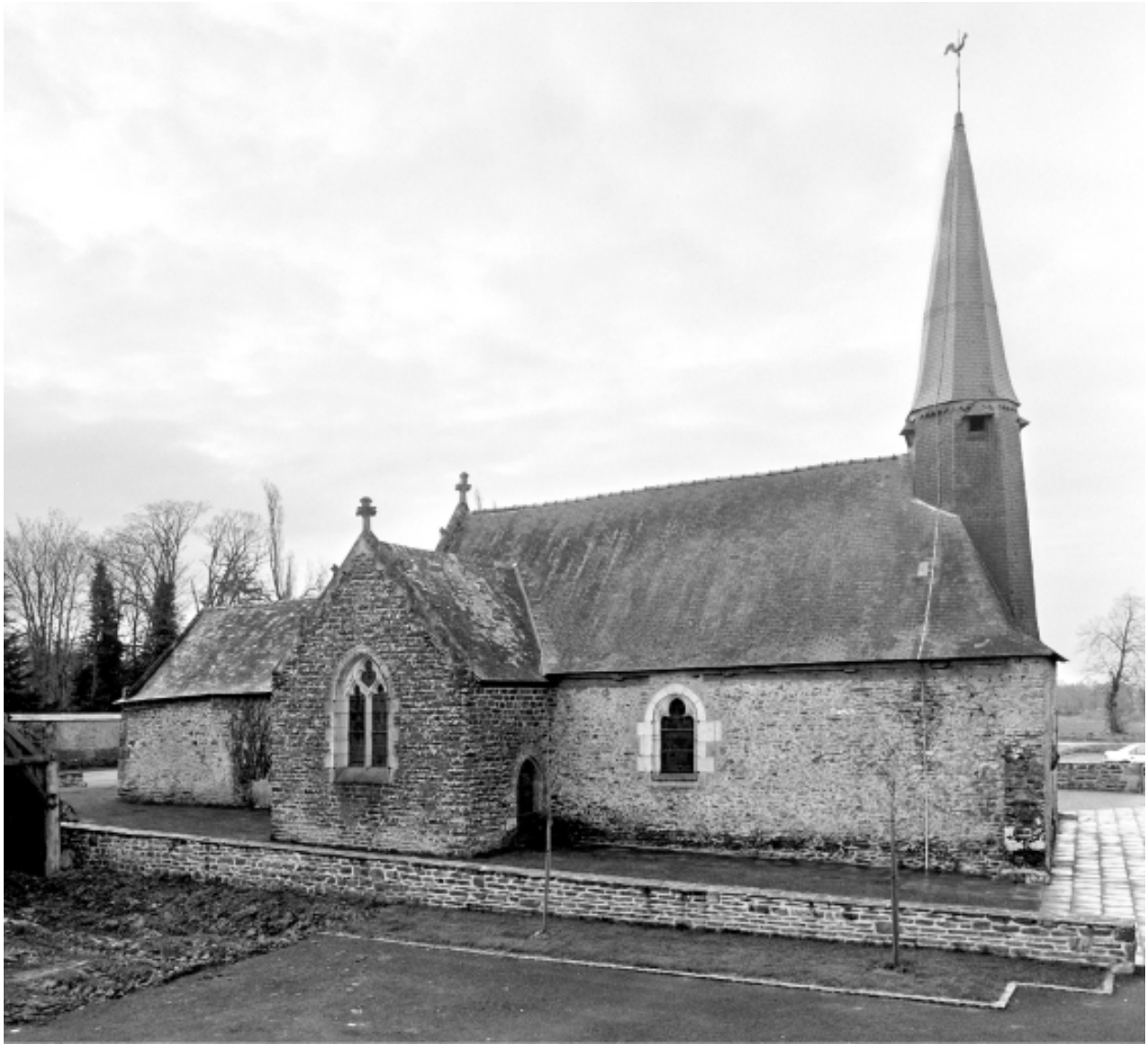
Vue générale nord