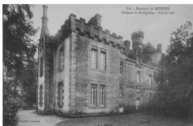
Vue des façades sud-est