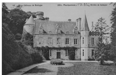
Vue générale de la façade ouest