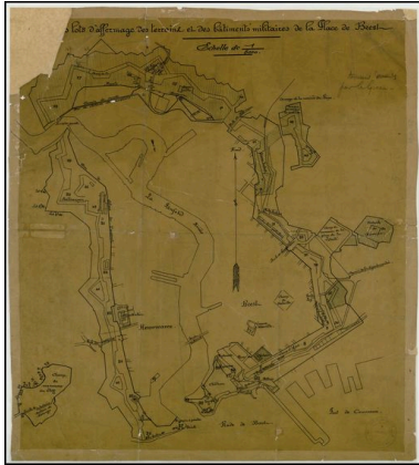
Plan des lots d'affermage des terrains et des bâtiments militaires de la place de Brest, 1922