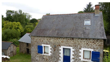
Vue sud IVR53_20243531669NUCA