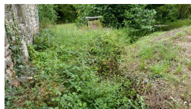
Ancien bief IVR53_20243531674NUCA