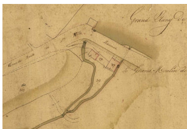
La maison et le moulin sur le cadastre de 1835