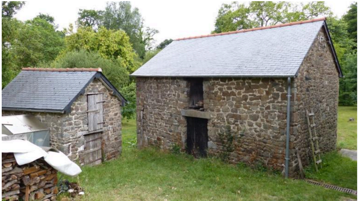
Vue sud est