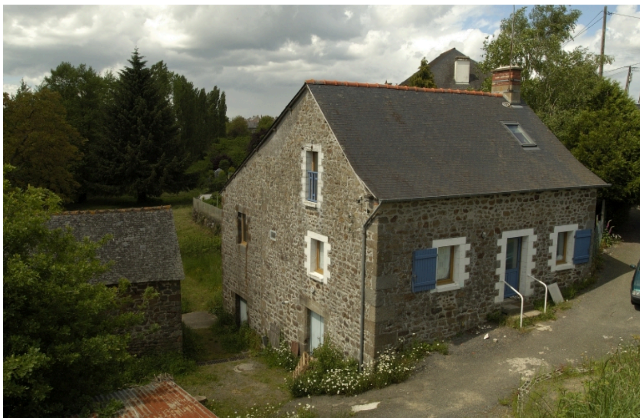
Vue générale sud-ouest