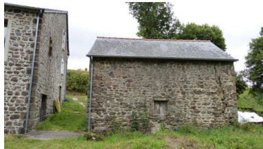
Vue nord IVR53_20243531673NUCA