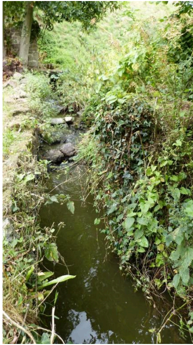
Ancien bief IVR53_20243531671NUCA