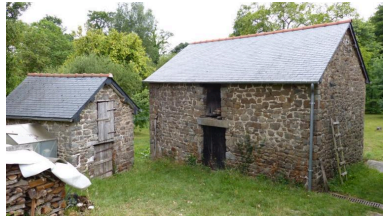
Vue sud est IVR53_20243531670NUCA