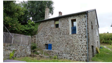
Vue nord