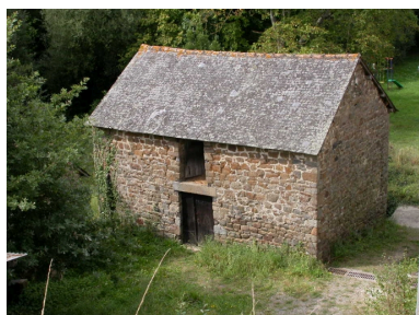
La dépendance IVR53_20053518487NUCA