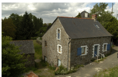
Vue générale sud-ouest IVR53_20053501480NUCA