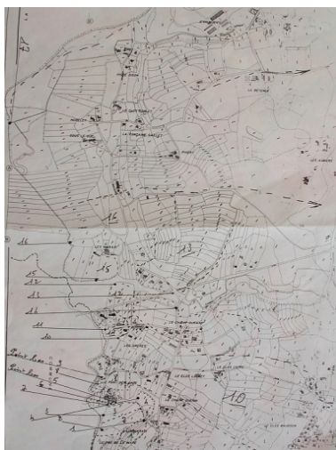
Cartographie des portes à marée entre Hillion et Yffiniac