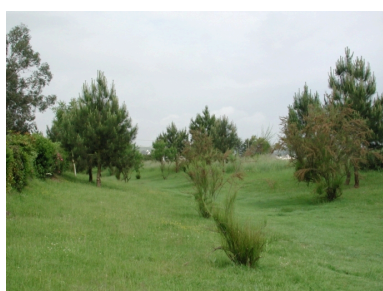
Sentier arboré sur le site de l'ancien bief de la Corderie (lotissement Saint-Jean) IVR53_20032204164NUCA