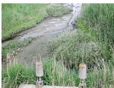
Double porte à marée du ruisseau La Corderie (rivière d'Yffiniac) IVR53_20032204162NUCA