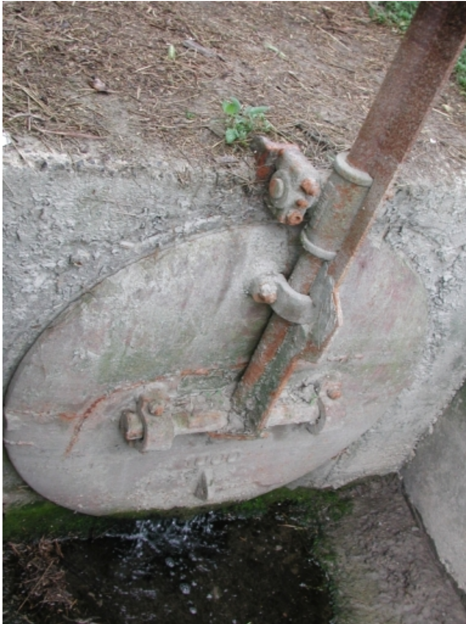
Clapet ou porte à la mer (écluse) du Saint-Jean