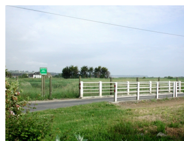
Pont de la rivière d'Yffiniac