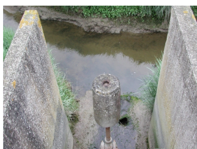
Ecluse : porte à marée du saint- Jean avec son contre-poids IVR53_20032204167NUCA