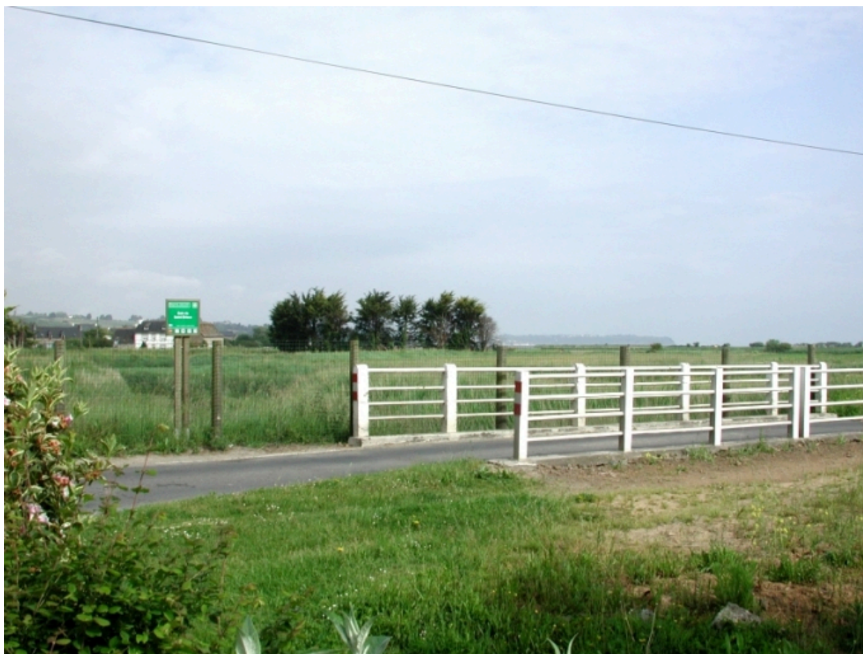
Pont de la rivière d'Yffiniac