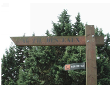
Panneau de signalisation du sentier de découverte et de randonnée : au fil de l'eau (cours d'eau d'Yffiniac) IVR53_20032204165NUCA