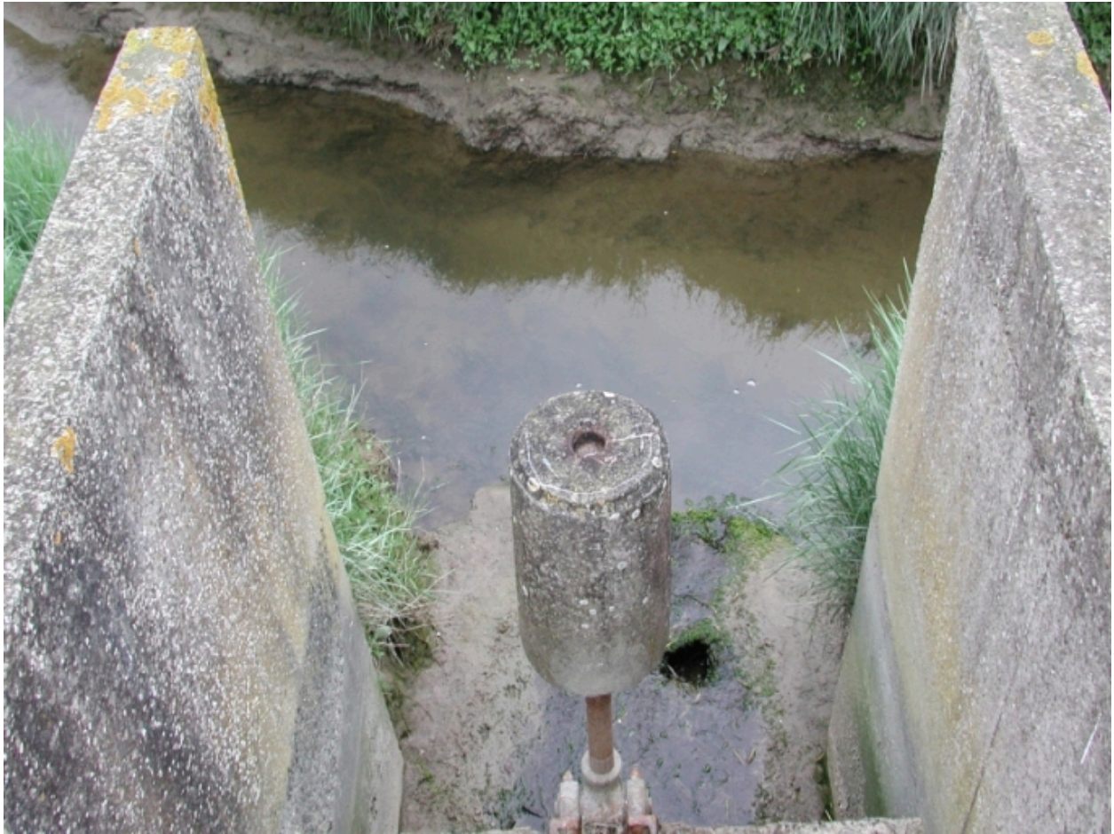
Ecluse : porte à marée du saint-Jean avec son contre-poids