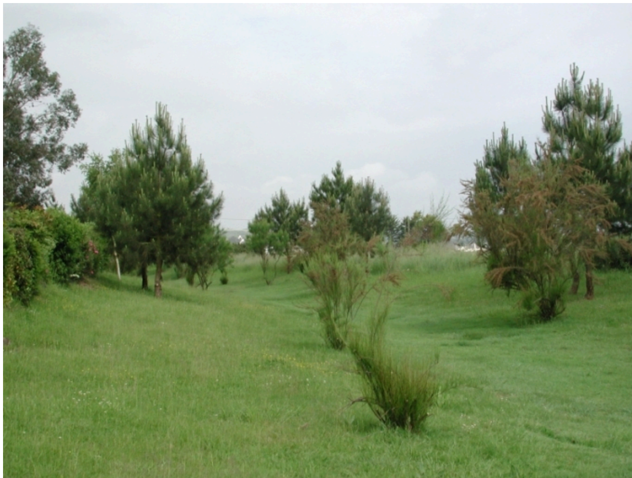
Sentier arboré sur le site de l'ancien bief de la Corderie (lotissement Saint-Jean)