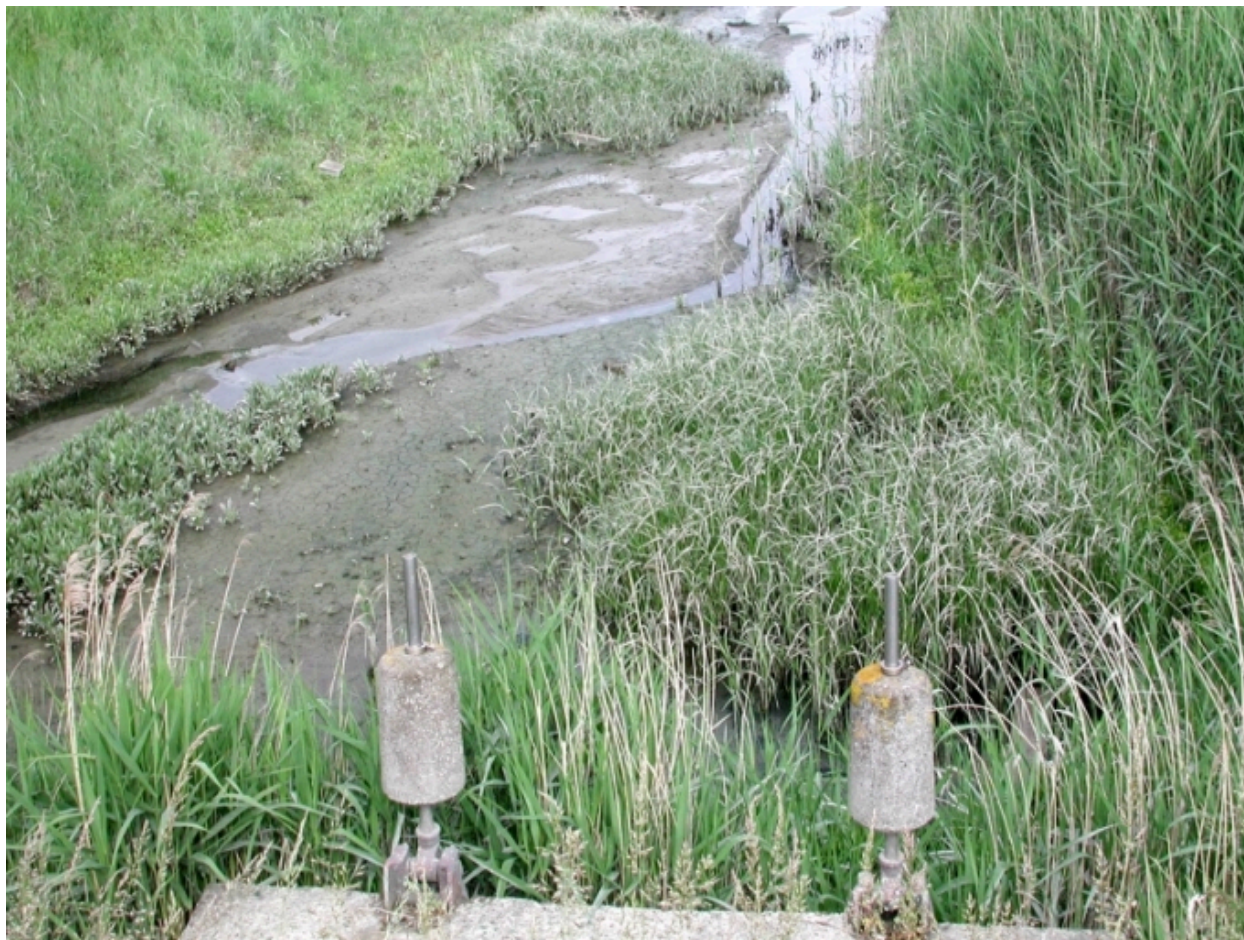
Double porte à marée du ruisseau La Corderie (rivière d'Yffiniac)