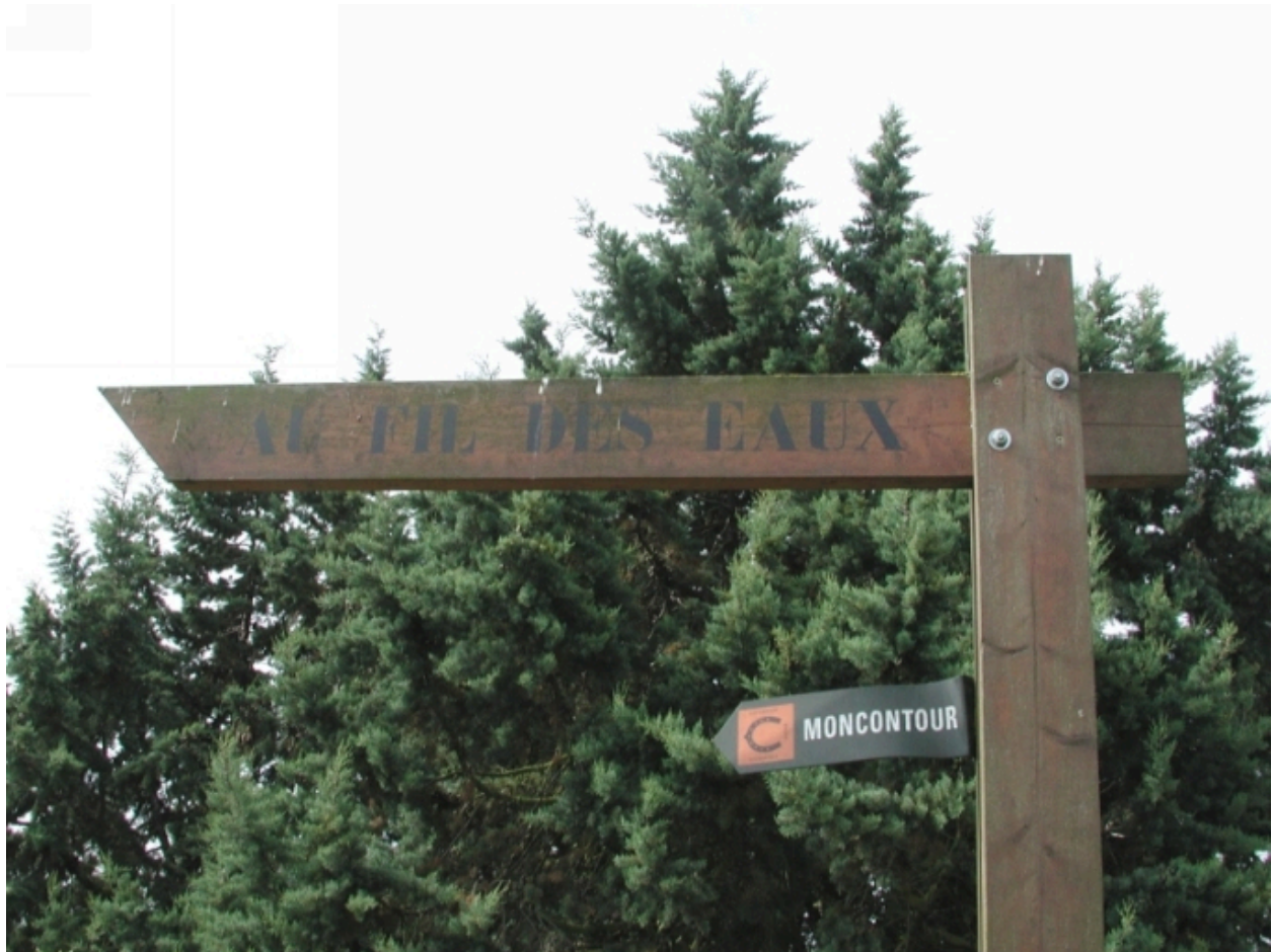
Panneau de signalisation du sentier de découverte et de randonnée : au fil de l'eau (cours d'eau d'Yffiniac)