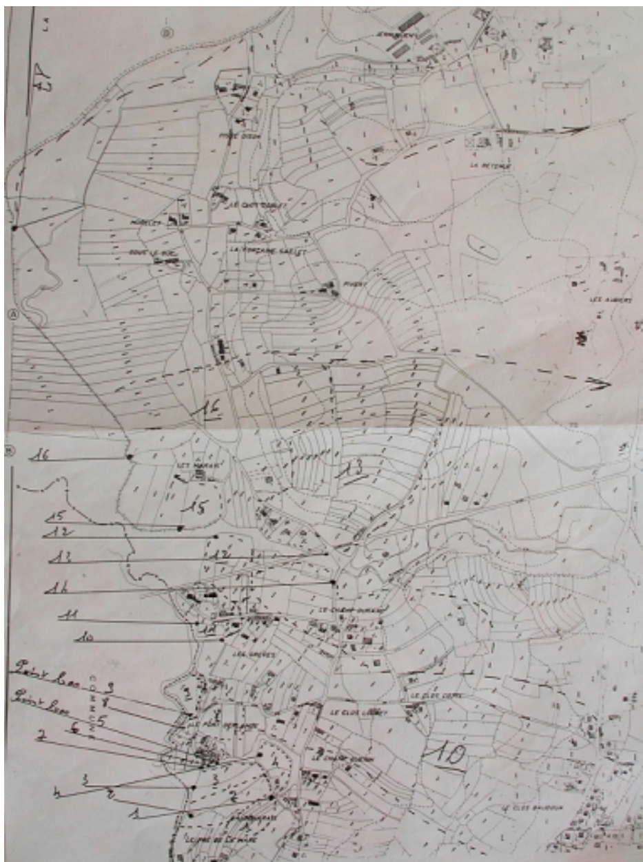
Cartographie des portes à marée entre Hillion et Yffiniac