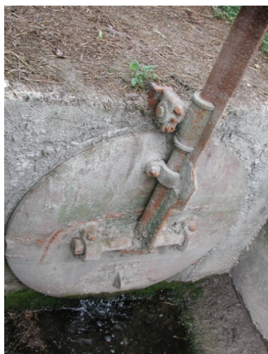
Clapet ou porte à la mer (écluse) du Saint-Jean