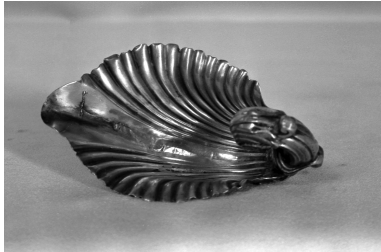
Coquille de baptême