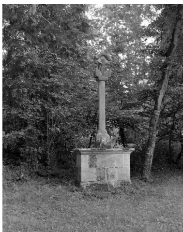
Château : croix monumentale (état en 1984), IVR53_19845600262X