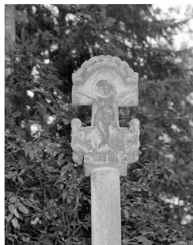
Château, croix monumentale : face portant le Christ en croix (état en 1984) IVR53_19845600263X