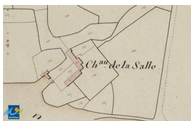
Le château de la Salle sur le cadastre de 1829 (A. D. du Morbihan, série 3 P 286/8)