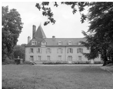
Château : élévation est (état en 1984) IVR53_19845600259X