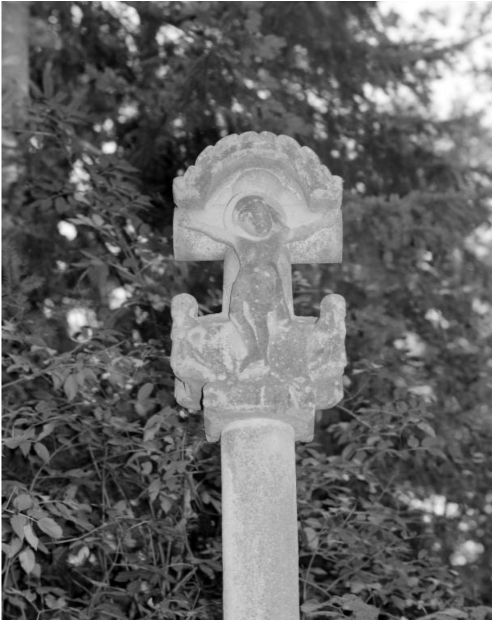
Château, croix monumentale : face portant le Christ en croix (état en 1984)