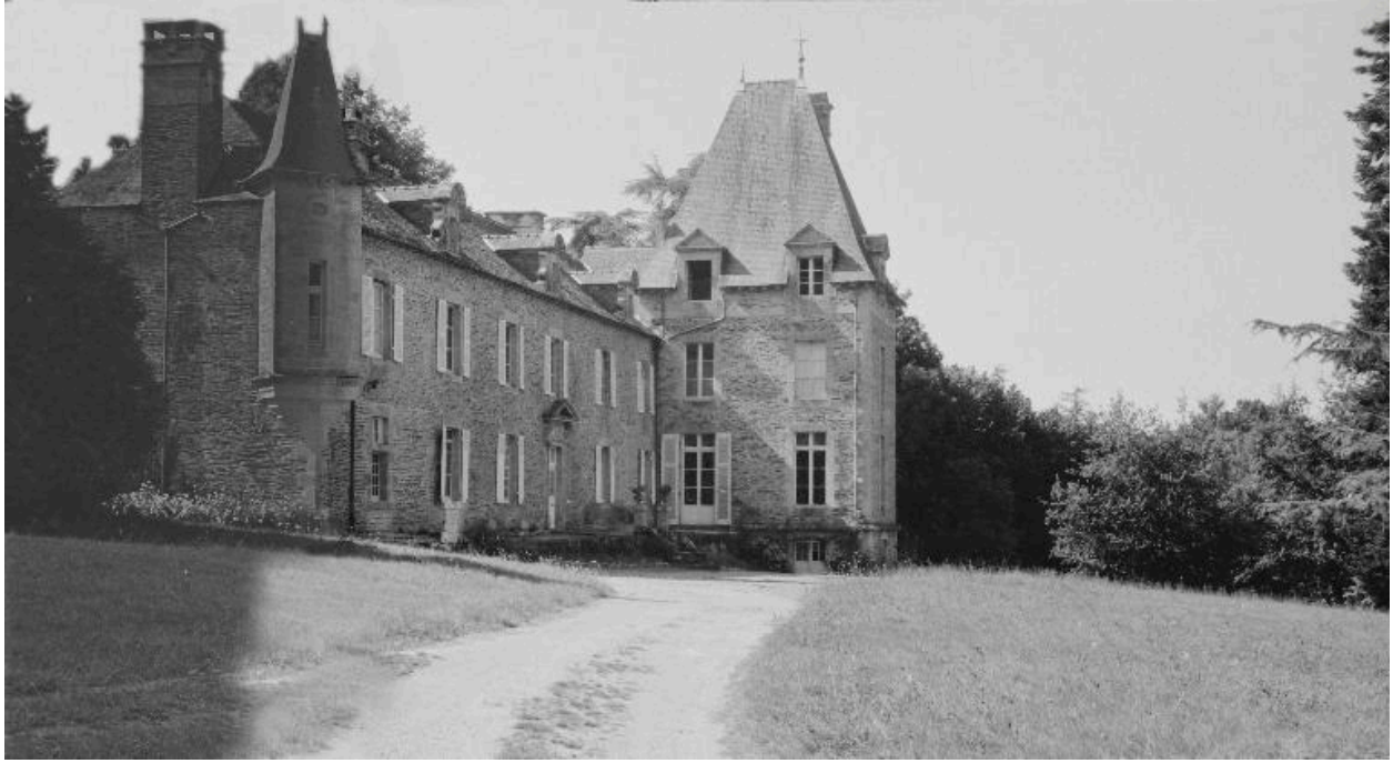
Château : élévation ouest (état en 1969)