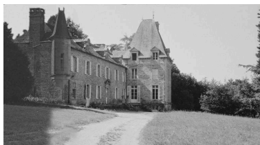
Château : élévation ouest (état en 1969)