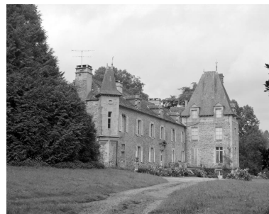
Château : élévation ouest (état en 1984) IVR53_19845600260X