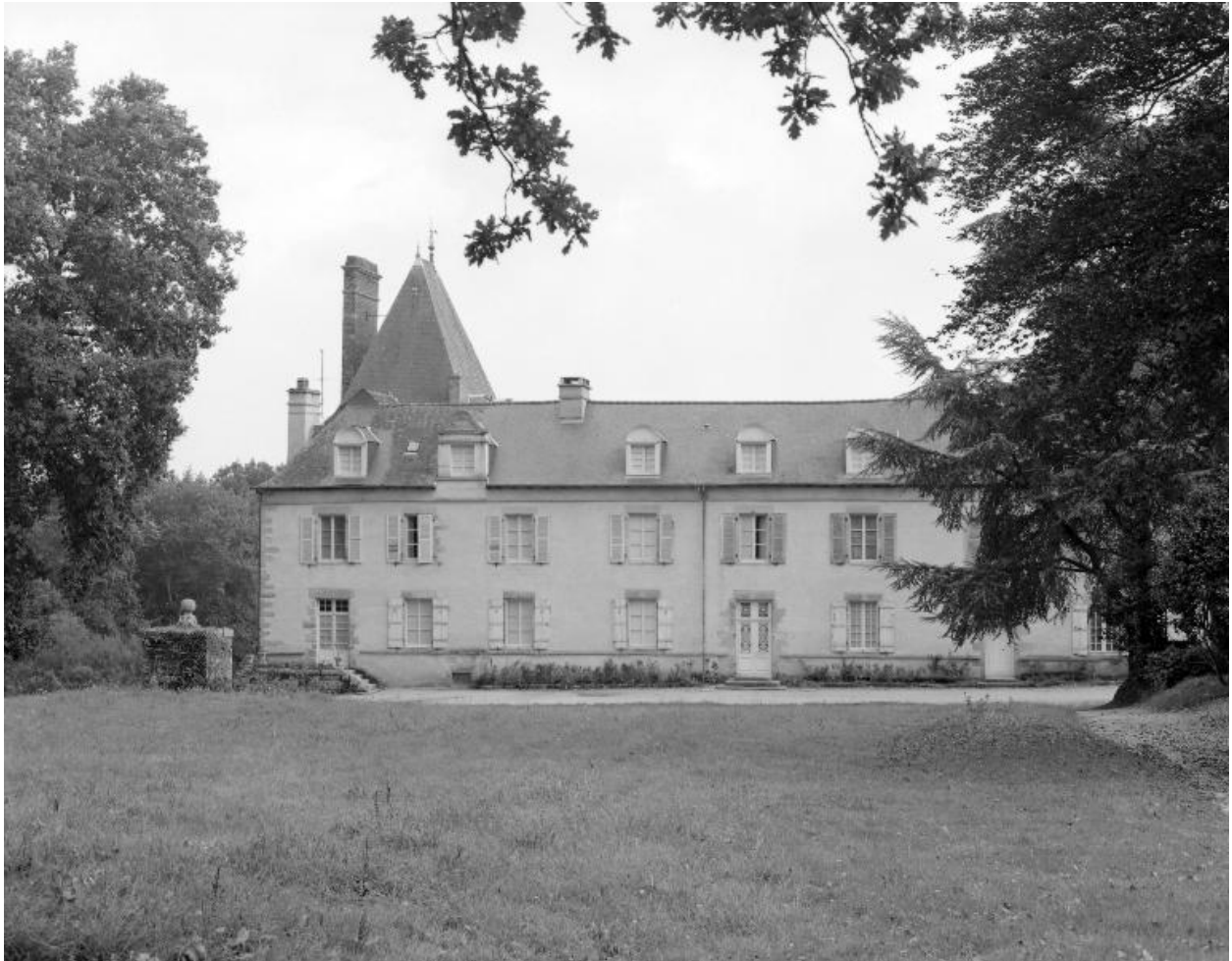
Château : élévation est (état en 1984)