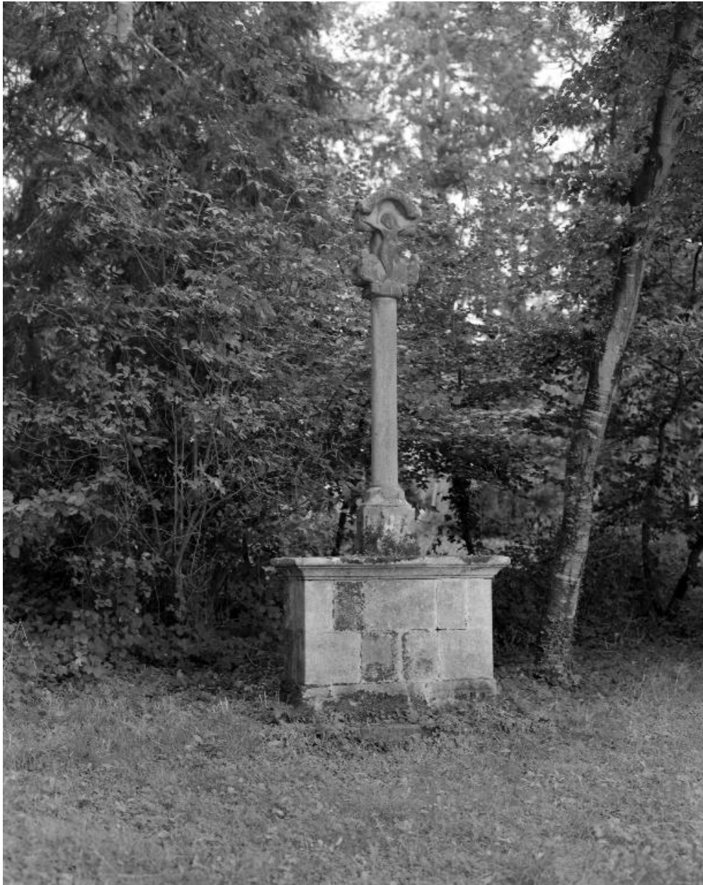
Château : croix monumentale (état en 1984)