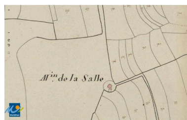
Le moulin à vent de la Salle sur le cadastre de 1829 (A. D. du Morbihan, série 3 P 286/8)