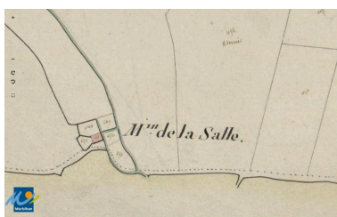
Un moulin à eau de la Salle sur le cadastre de 1829 (A. D. du Morbihan, série 3 P 286/8) IVR53_20135619806NUCA