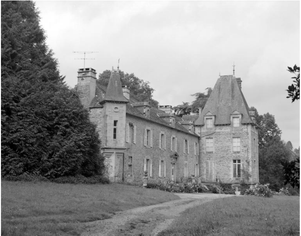
Château : élévation ouest (état en 1984)