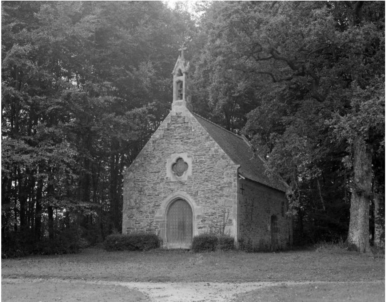
Château : la chapelle (état en 1984)