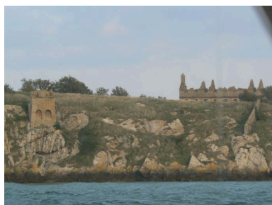
Vue du lazaret (à droite) et des latrines (à gauche)