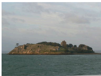
Vue générale de l'île de Trébéron IVR53_20072908893NUCA