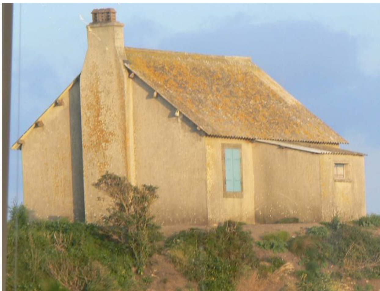
Vue de l'ancienne maison du gardien