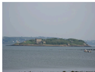
Vue de la partie méridionale de l'île Trébéron IVR53_20082908376NUCA