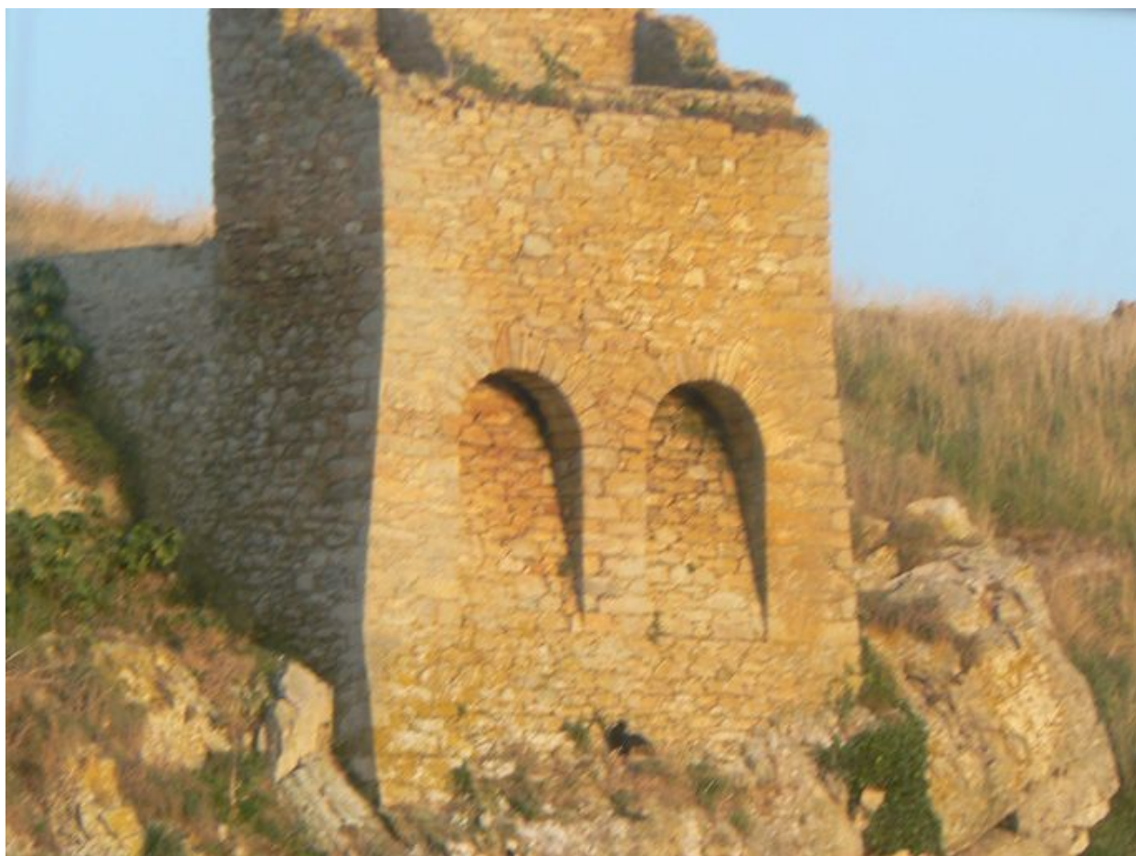
Vue des latrines