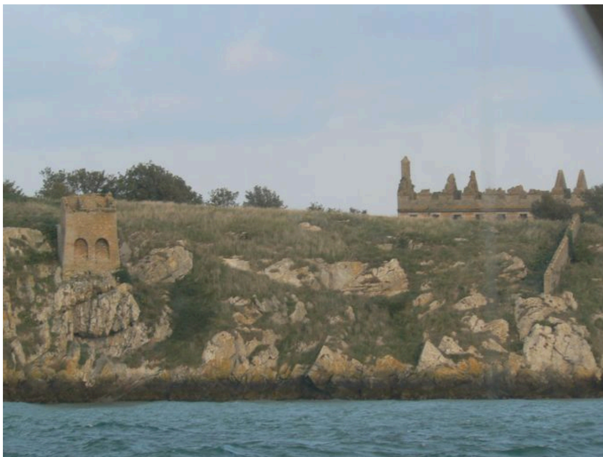
Vue du lazaret (à droite) et des latrines (à gauche)