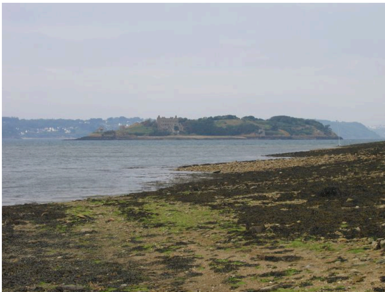
Vue générale de l'île Trébéron