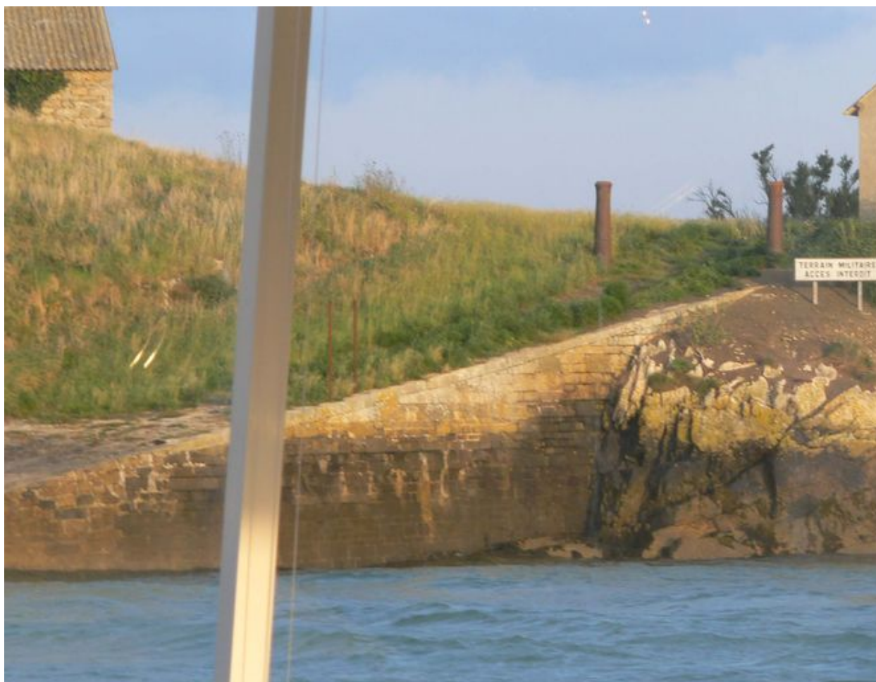
Vue de la cale