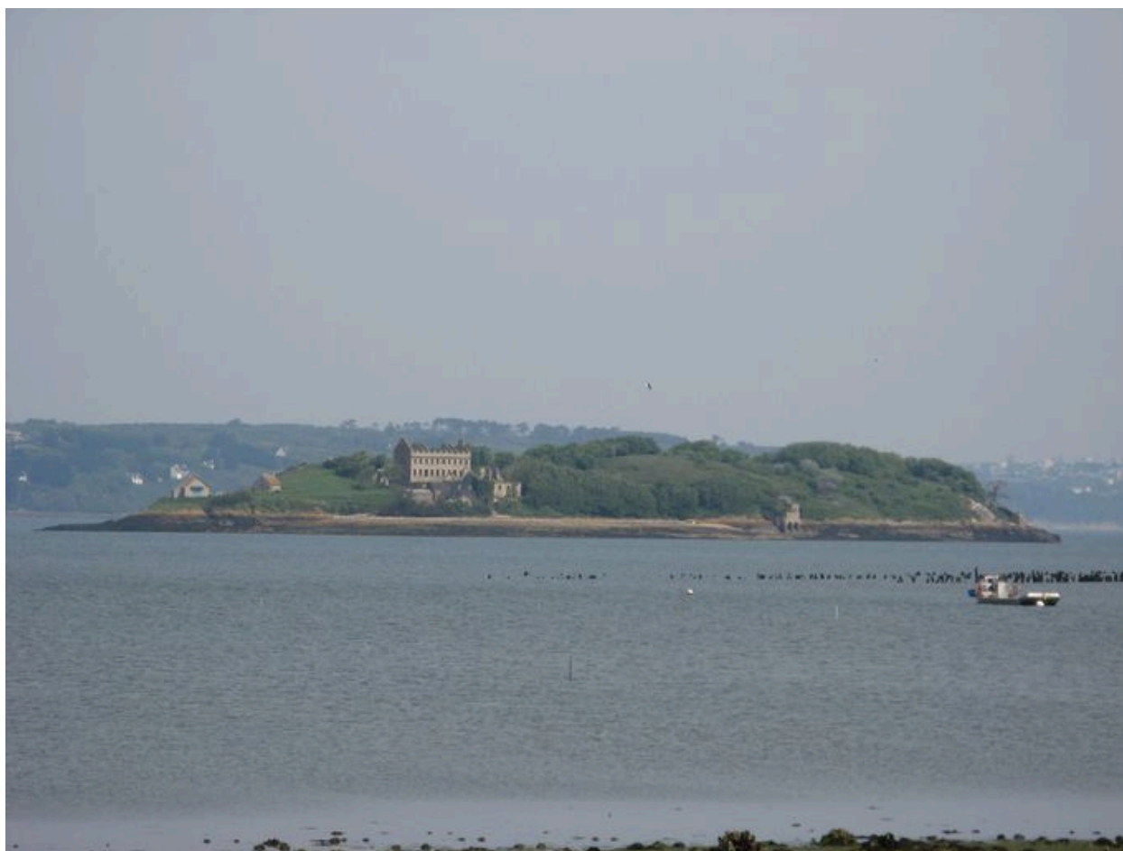
Vue de la partie méridionale de l'île Trébéron