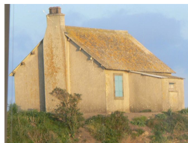
Vue de l'ancienne maison du gardien IVR53_20072908858NUCA