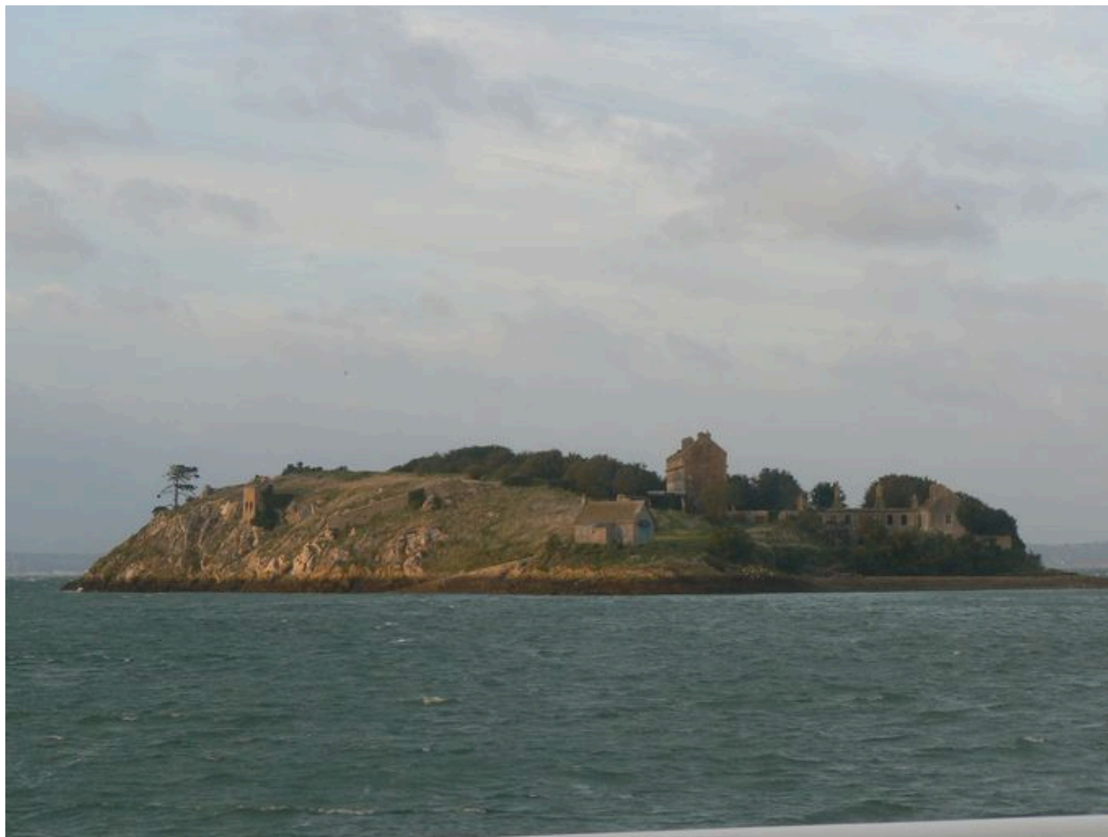
Vue générale de l'île de trébéron