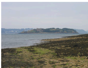
Vue générale de l'île Trébéron IVR53_20072908891NUCA