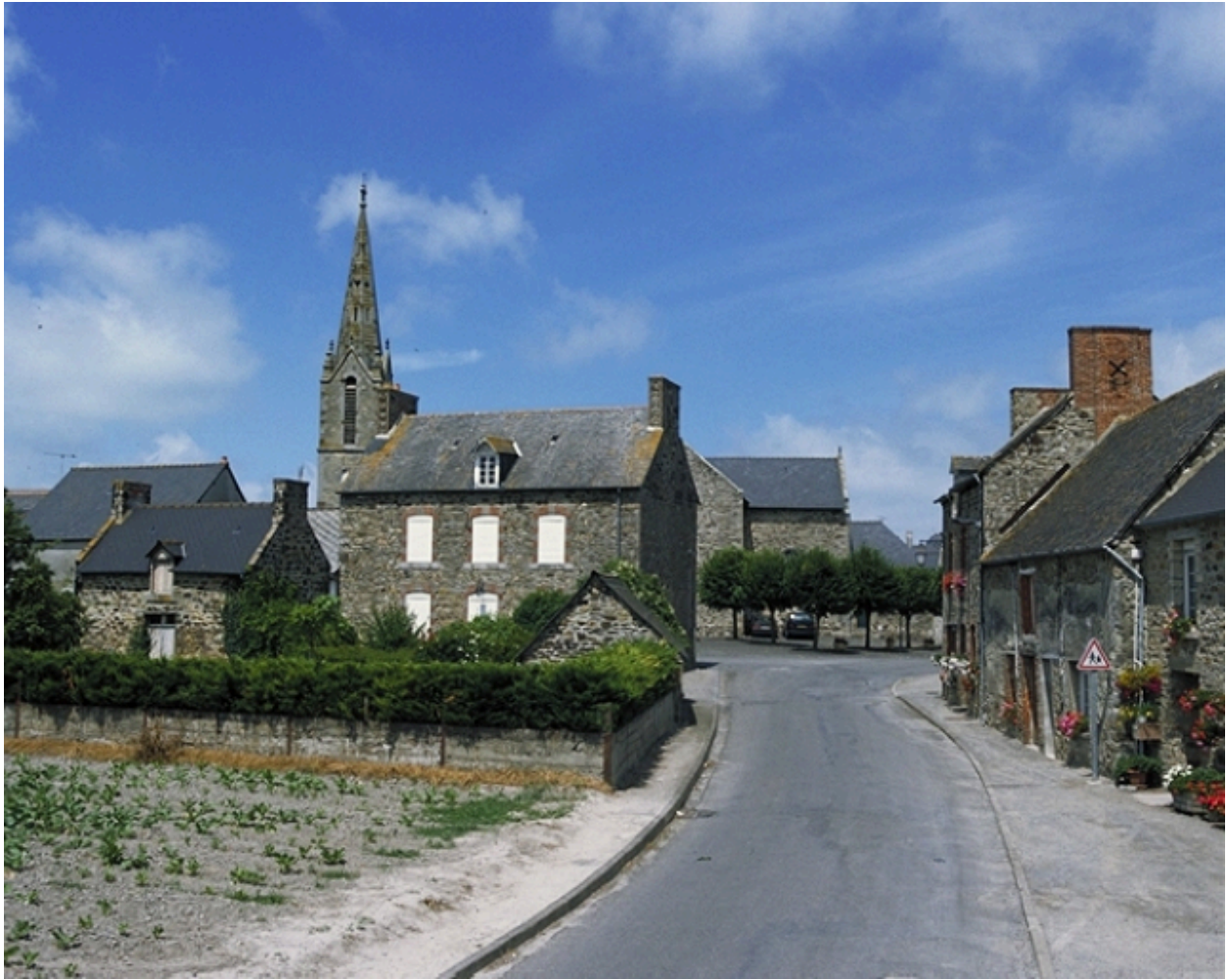
Vue de situation depuis le sud