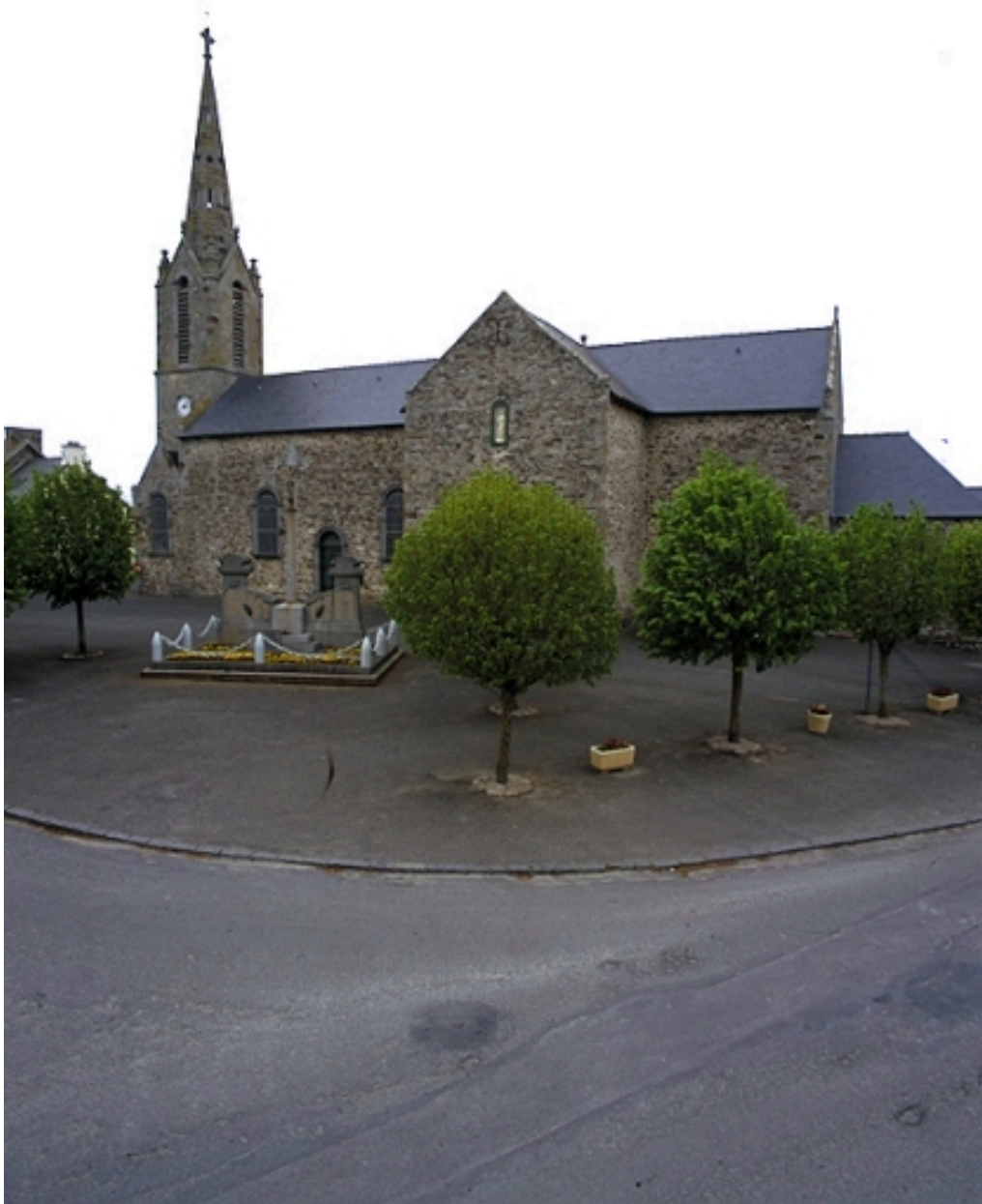
Vue générale sud-est