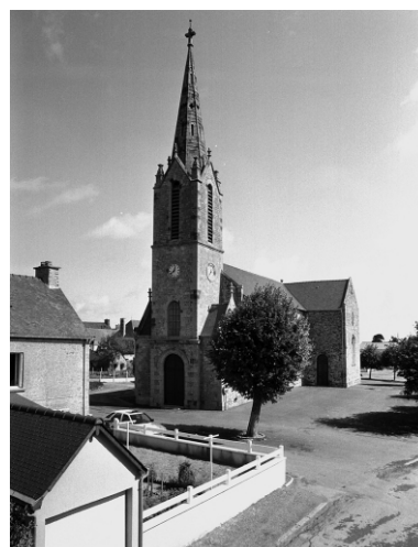
Vue générale sud-ouest IVR53_19943501802X