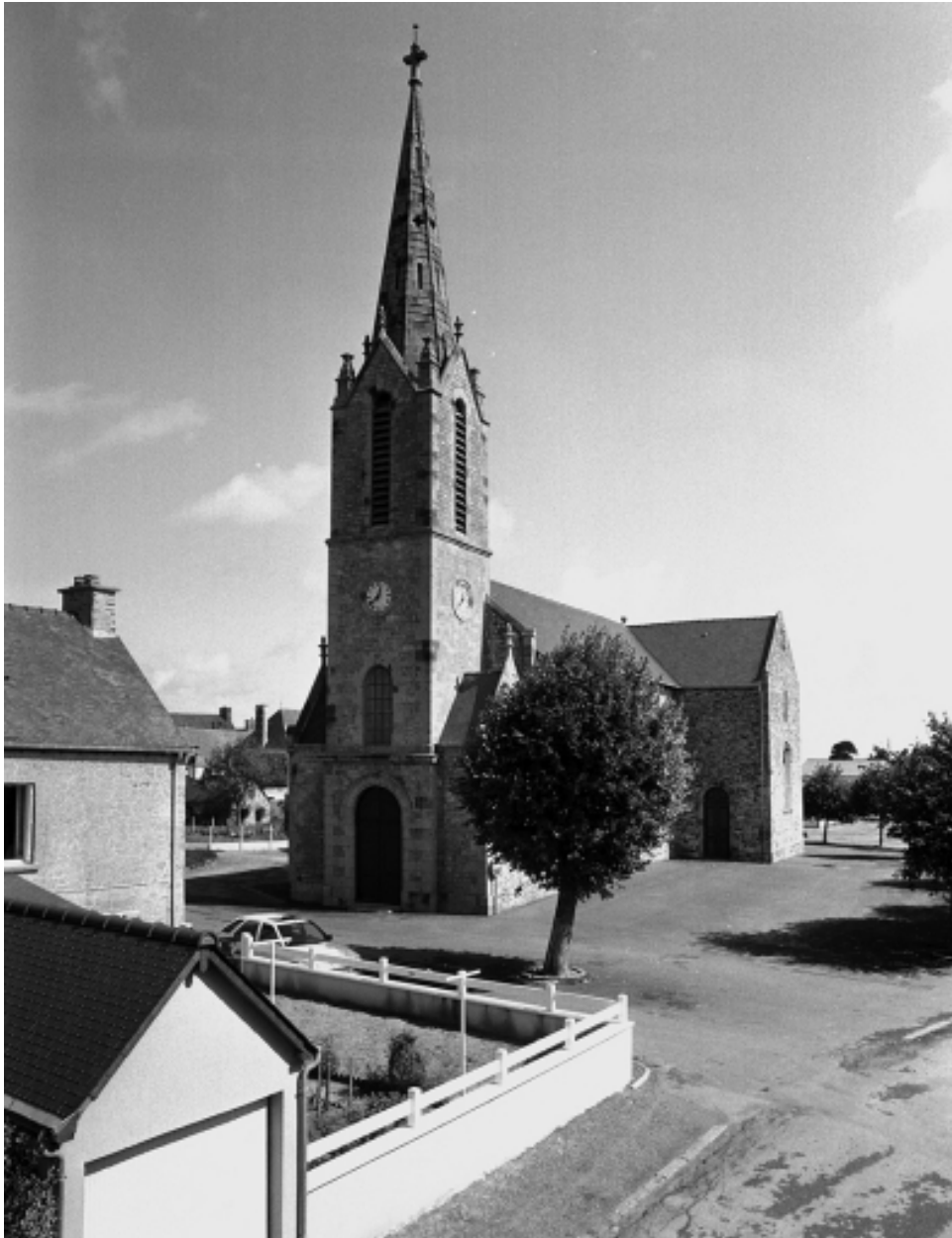
Vue générale sud-ouest