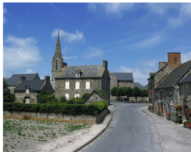
Vue de situation depuis le sud IVR53_20003500670XA