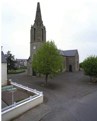
Vue générale sud-ouest IVR53_20003501179XA