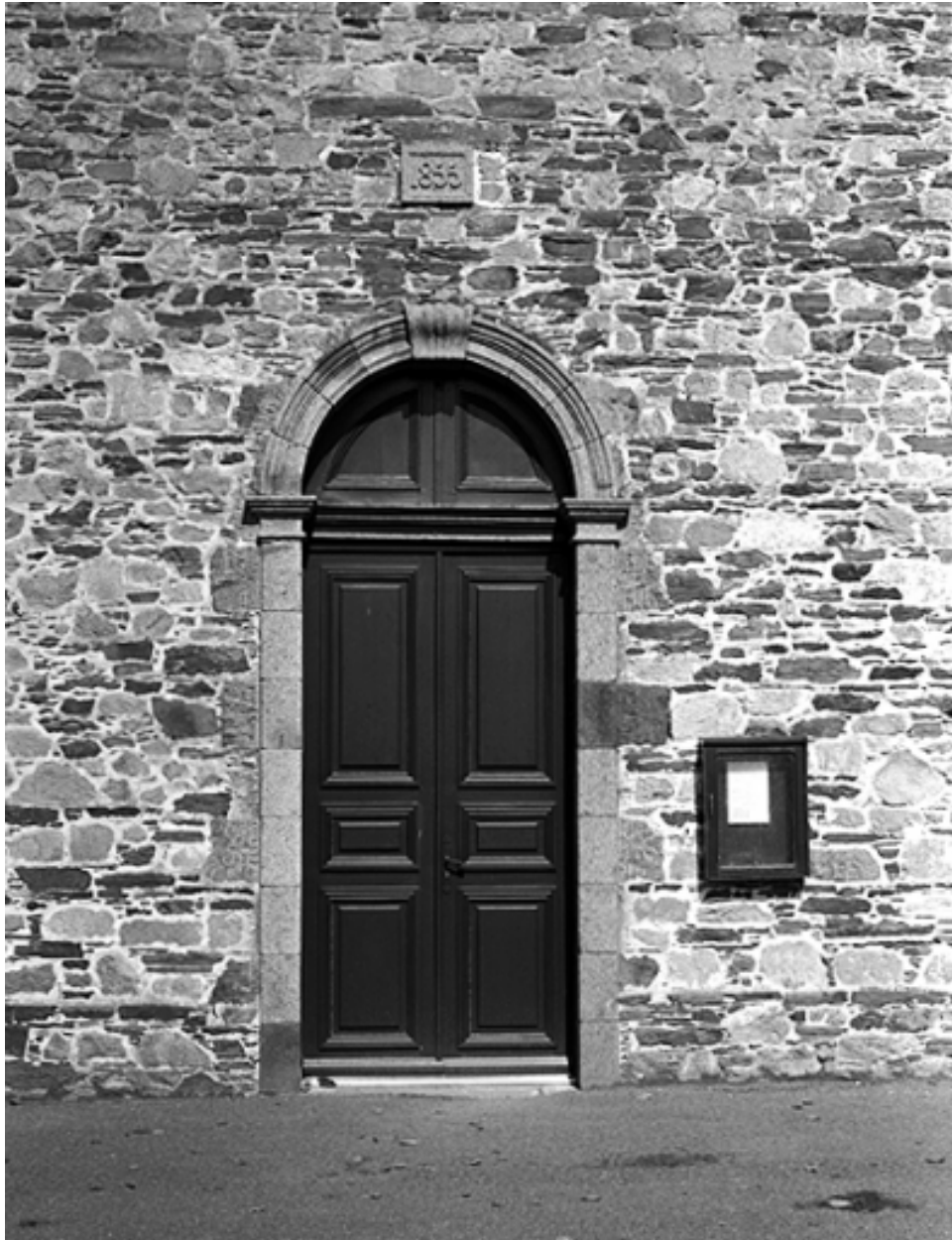
Elévation sud, porte ouest : vue générale