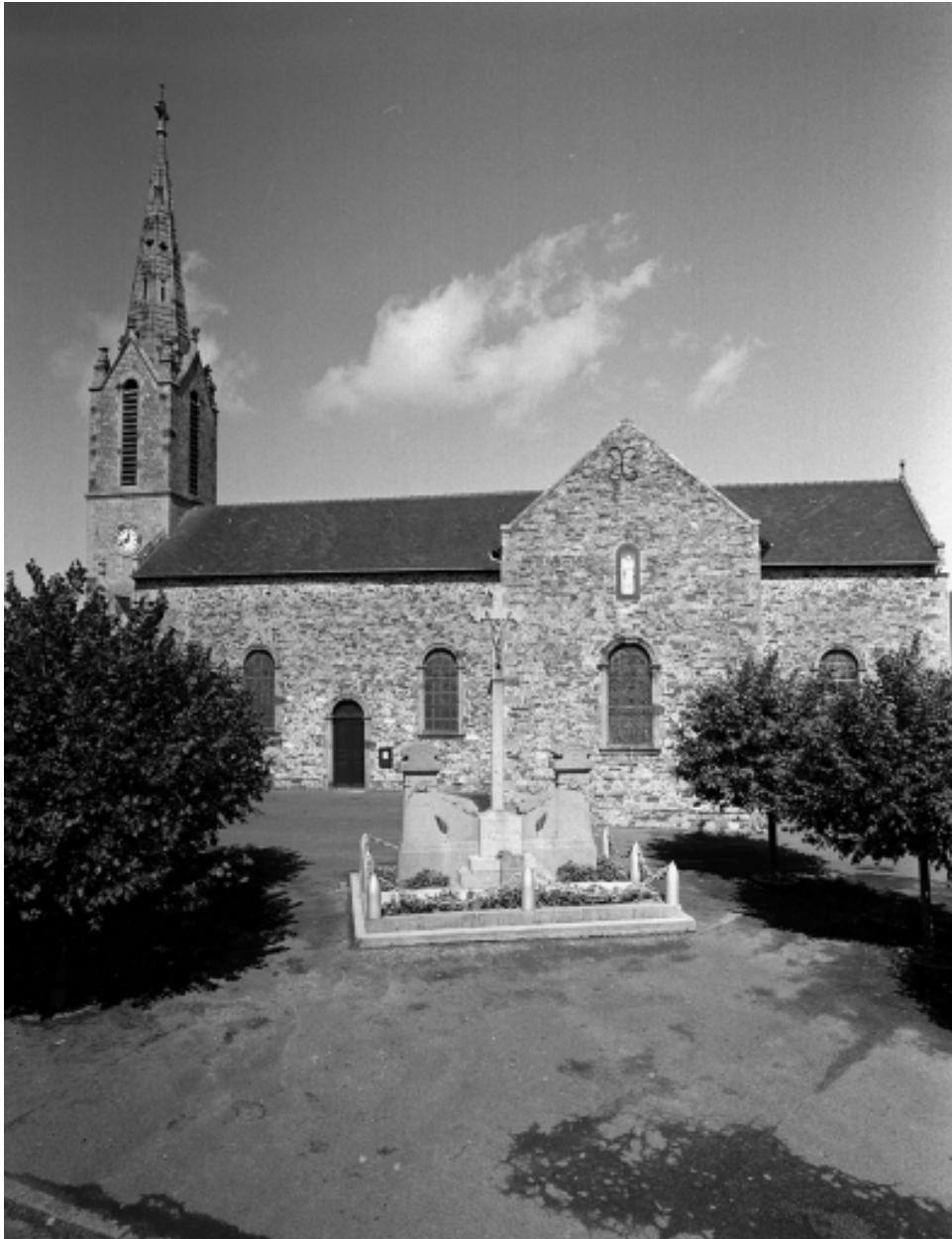
Vue générale sud-est