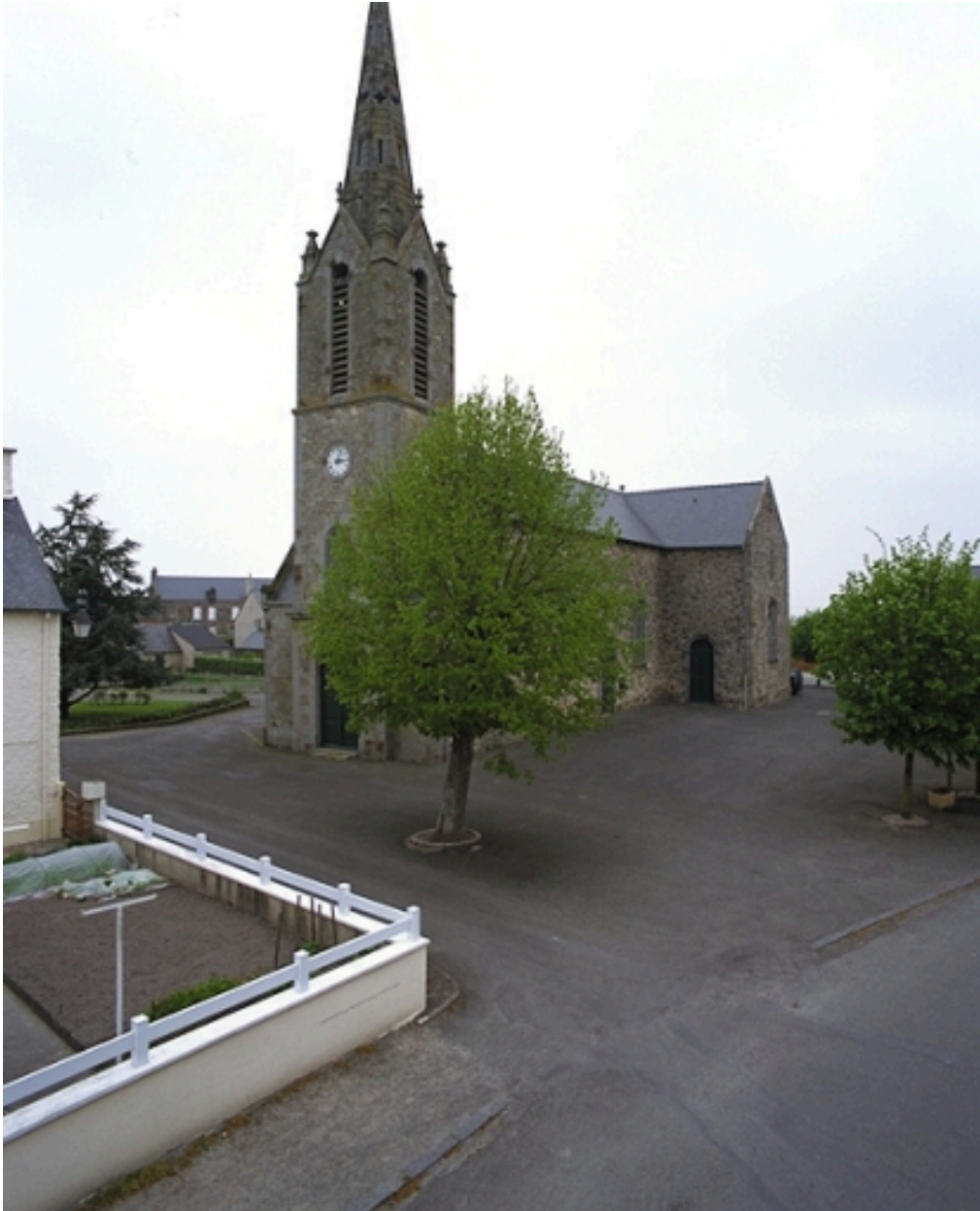
Vue générale sud-ouest