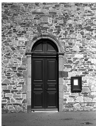
Elévation sud, porte ouest : vue générale