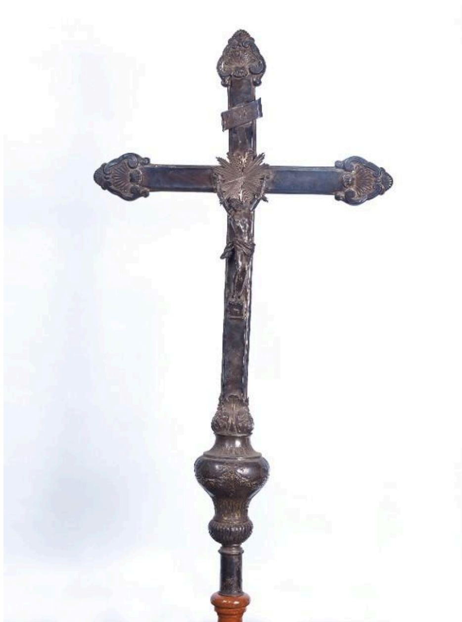
Vue d'ensemble de la partie supérieure, avers