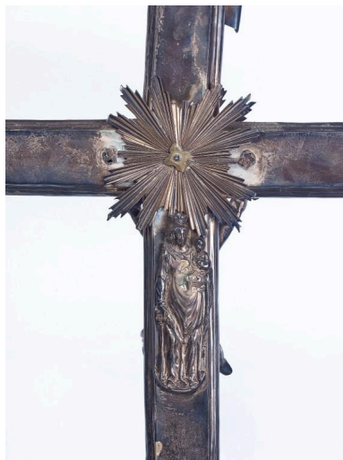
Détail de la Vierge à l'Enfant au revers IVR53_20242200091NUCA