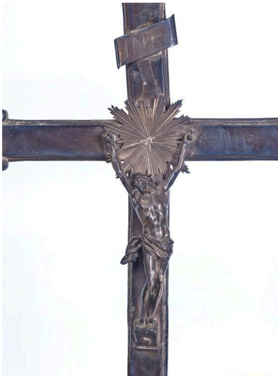
Détail du Christ sur l'avvers