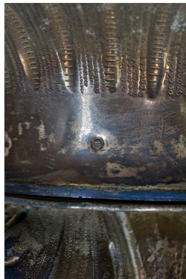
Poinçon de moyenne garantie, bureau de la garantie de Paris (1798-1809)