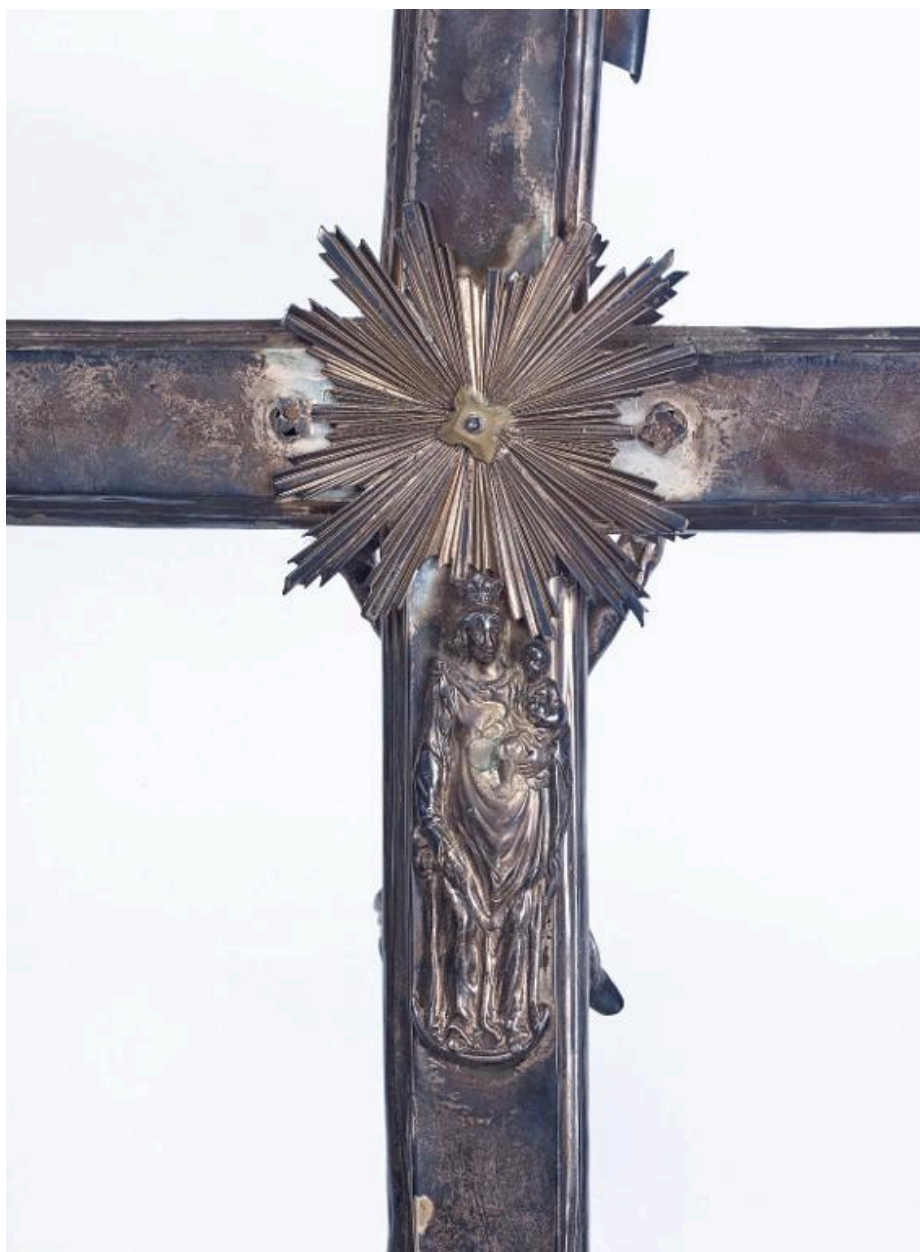
Détail de la Vierge à l'Enfant au revers