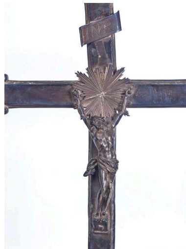
Détail du Christ sur l'avvers IVR53_20242200090NUCA