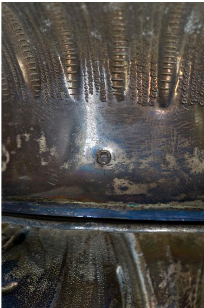
Poinçon de moyenne garantie, bureau de la garantie de Paris (1798-1809 )