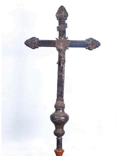
Vue d'ensemble de la partie supérieure, avers IVR53_20242200089NUCA