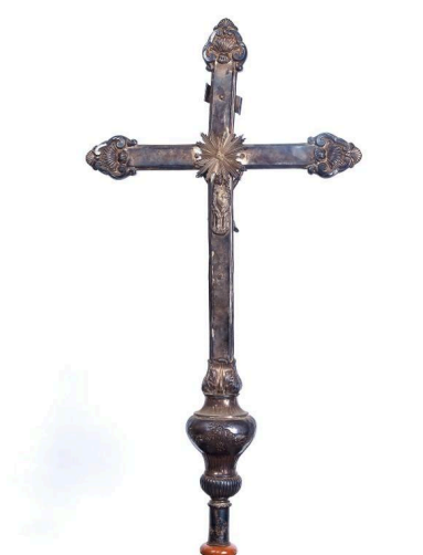
Vue d'ensemble de la partie supérieure, revers IVR53_20242200088NUCA