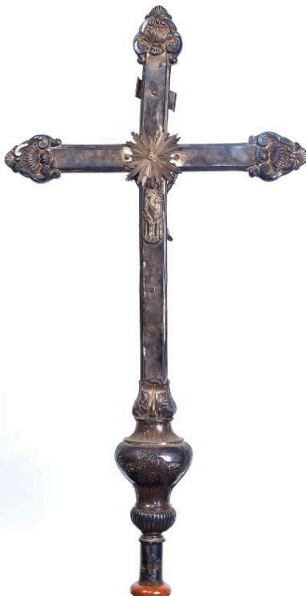
Vue d'ensemble de la partie supérieure, revers