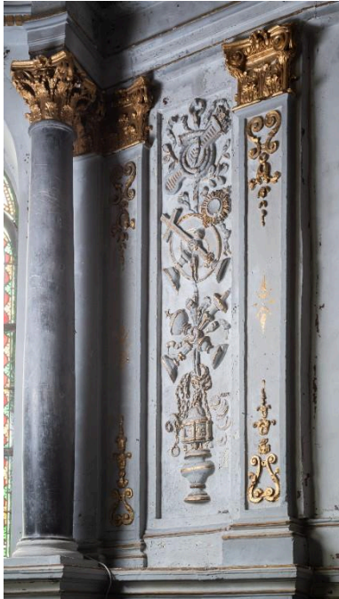
Retable du chœur, détail sculpté