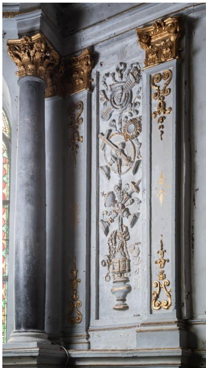
Retable du chœur, détail sculpté