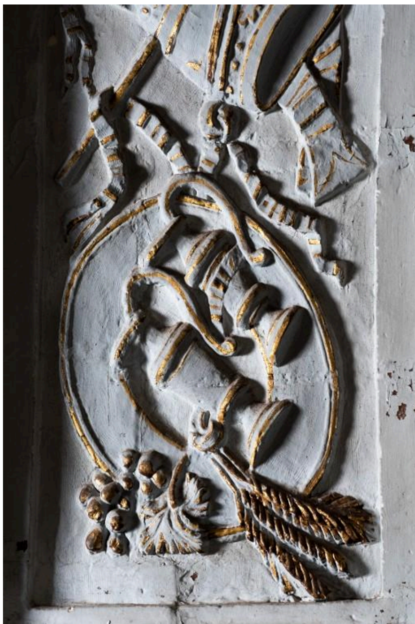
Retable du chœur, détail sculpté