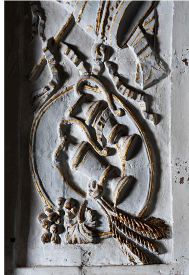
Retable du chœur, détail sculpté IVR53_20252201086NUCA