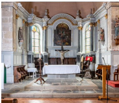
Chœur IVR53_20252201075NUCA